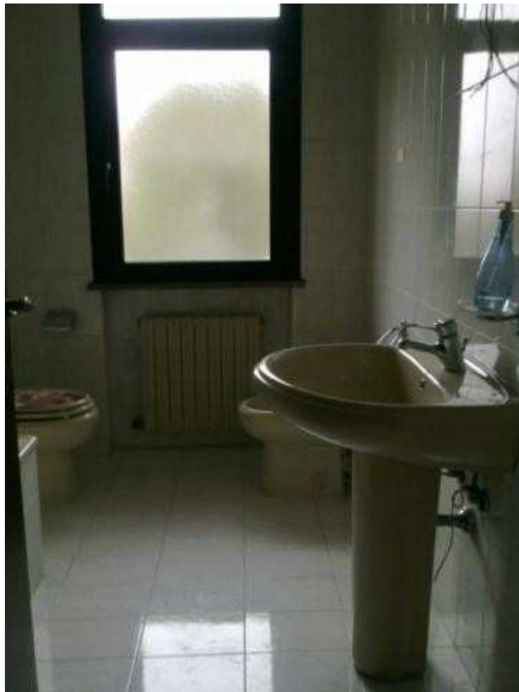
Foto 19 bagno privato Piano 1