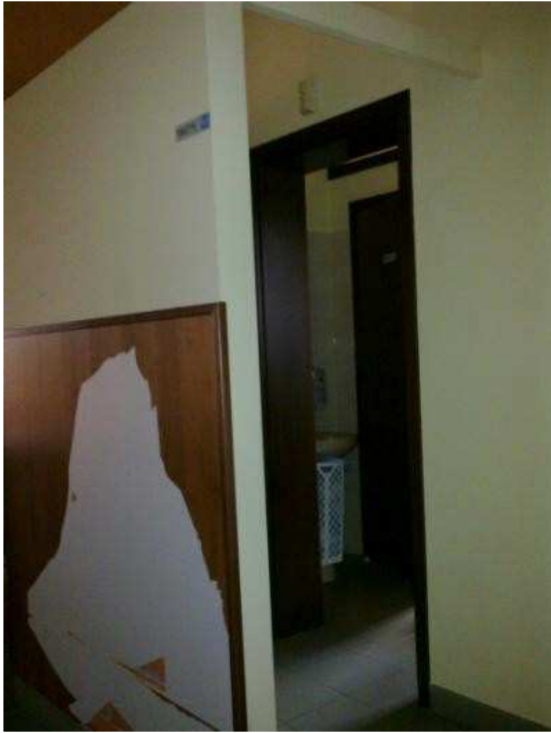
Foto 10 Antibagno piano terra