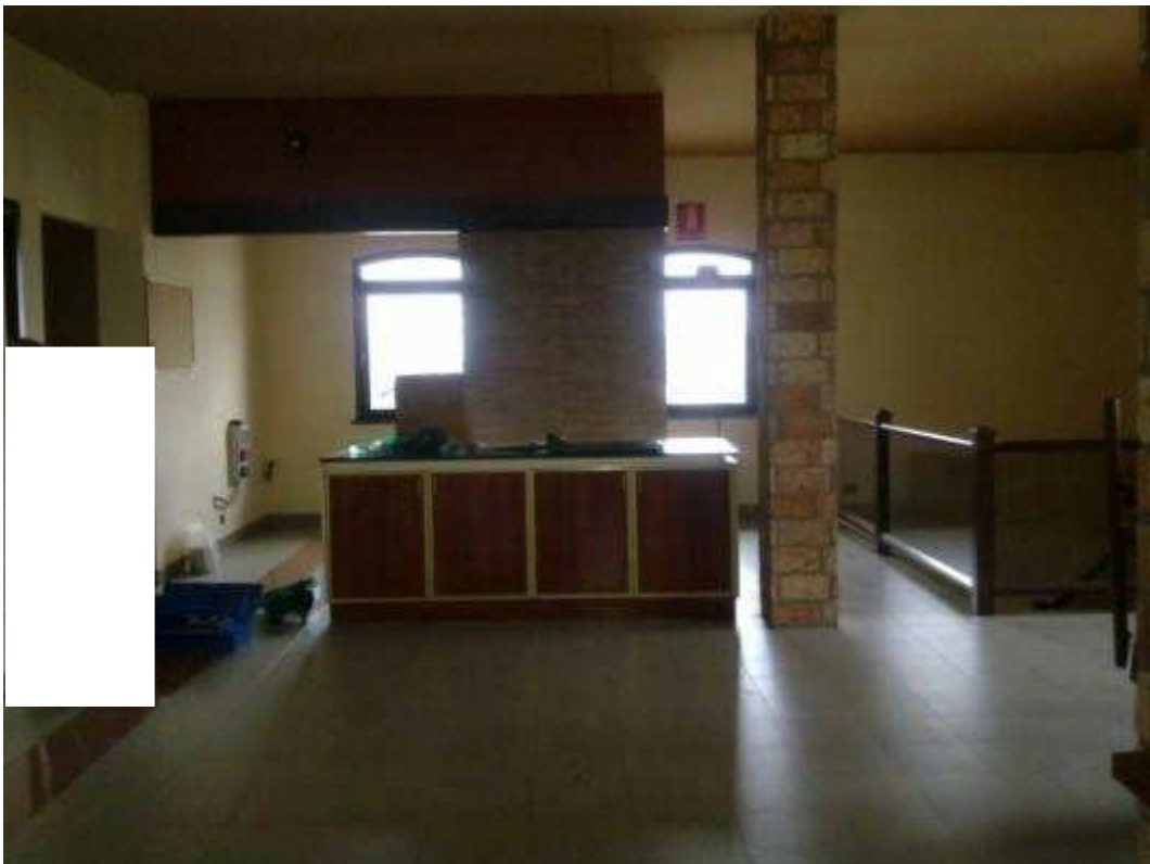
Foto 13 Sala pranzo piano primo