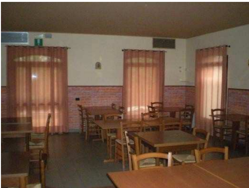
Foto 7 Sala pranzo piano terra