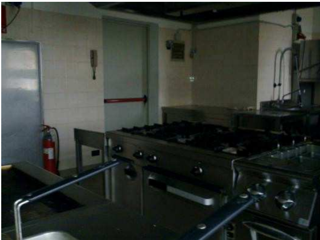
Foto 9 Cucina piano terra