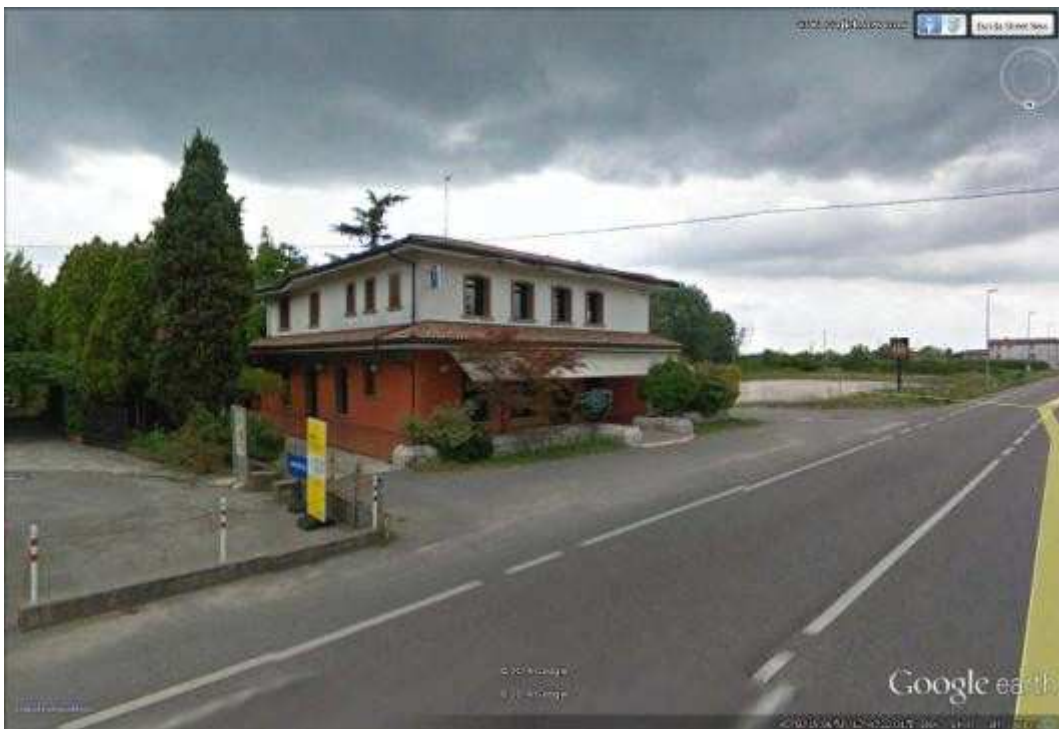
Foto 1 Vista del fabbricato da Via Marconi