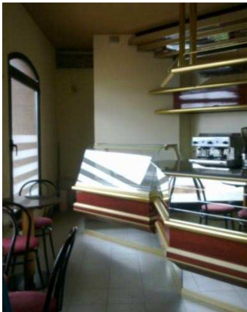
Foto 5 Zona bar piano terra