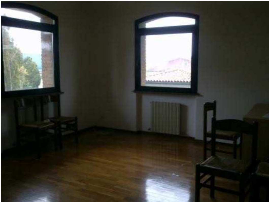
Foto 17 Camera Piano primo