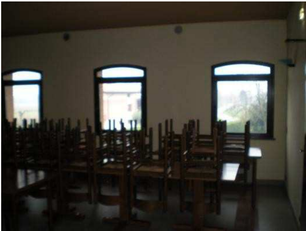
Foto 14 Sala pranzo piano primo