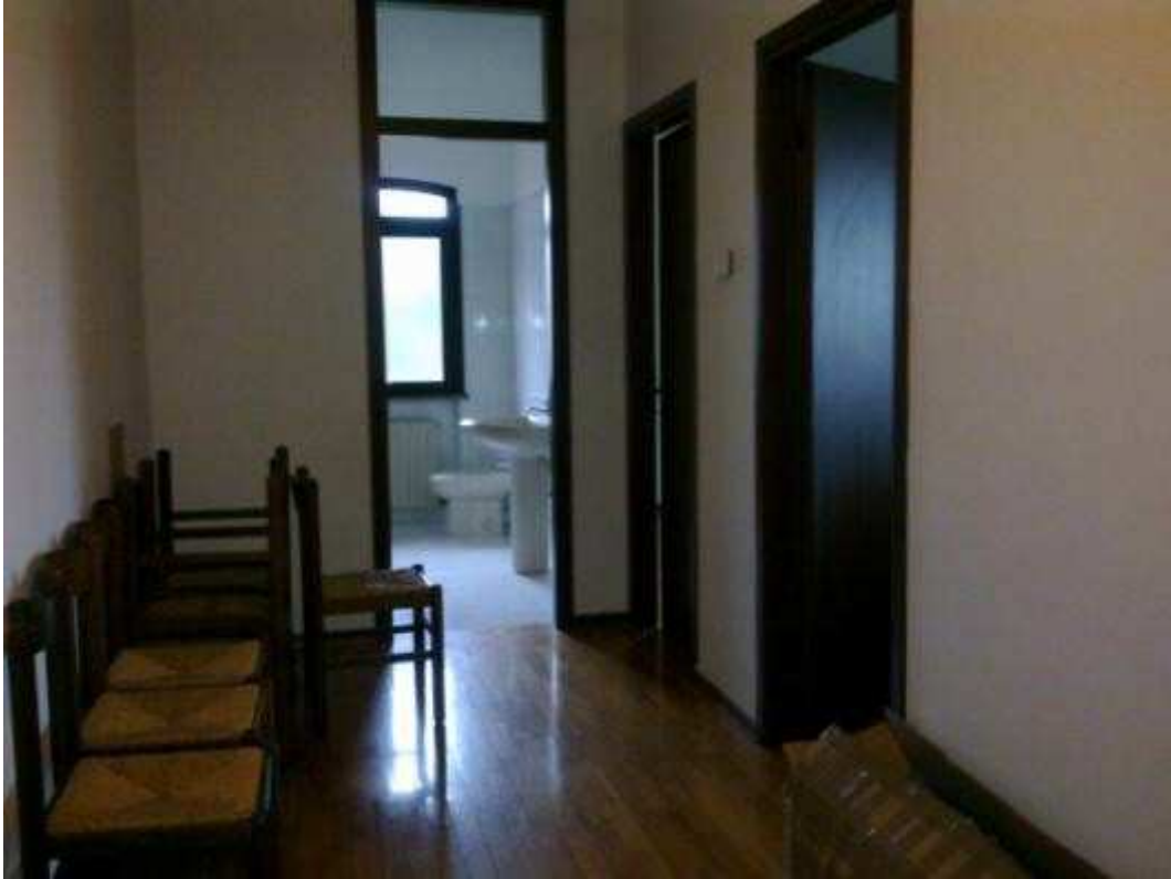
Foto 16 Zona privata