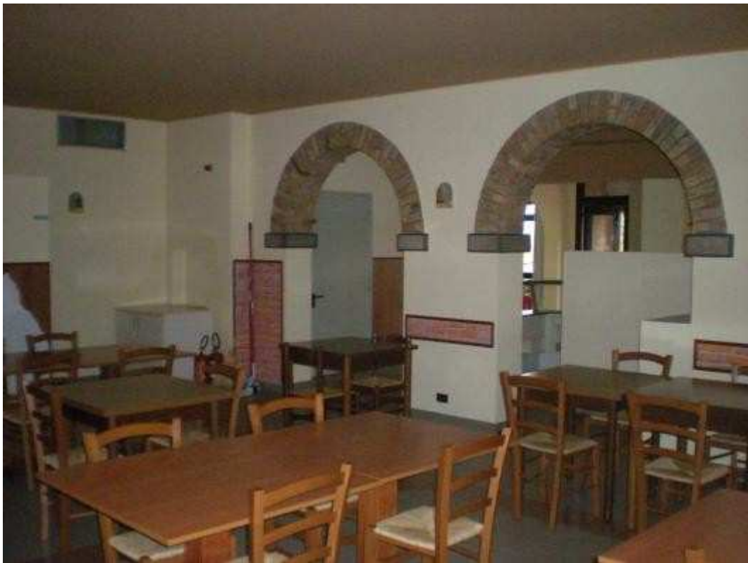
Foto 8 Sala pranzo piano terra