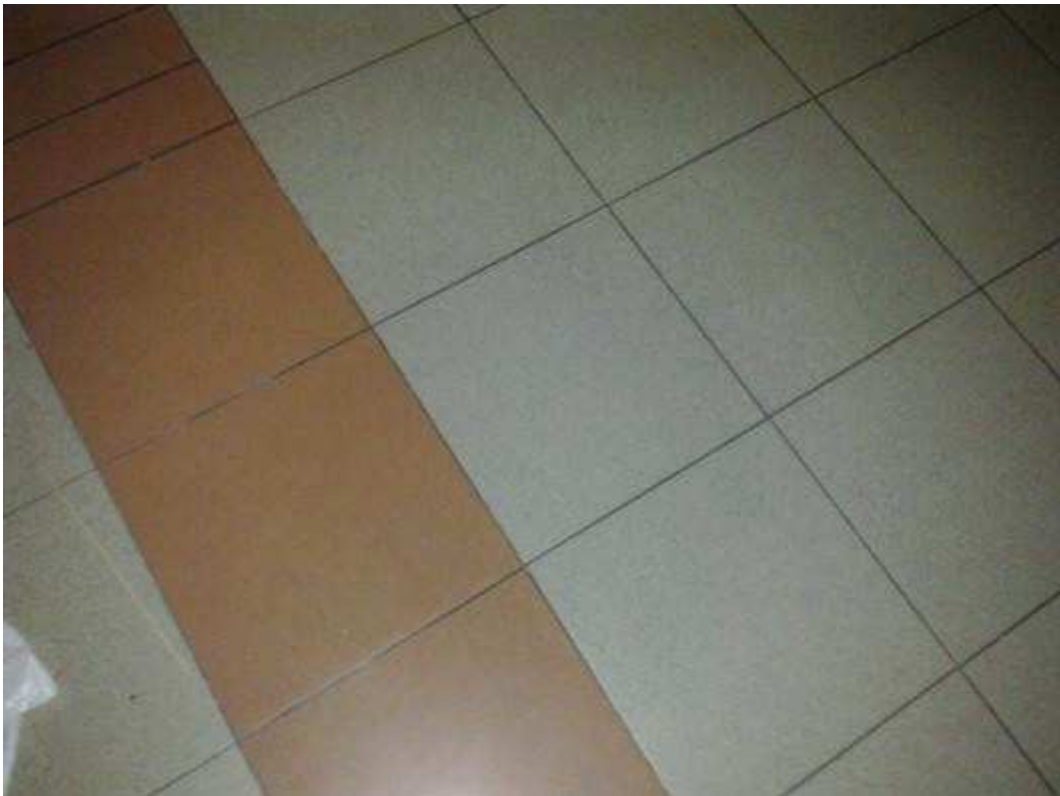
Foto 21 dettaglio pavimenti in piastrelle