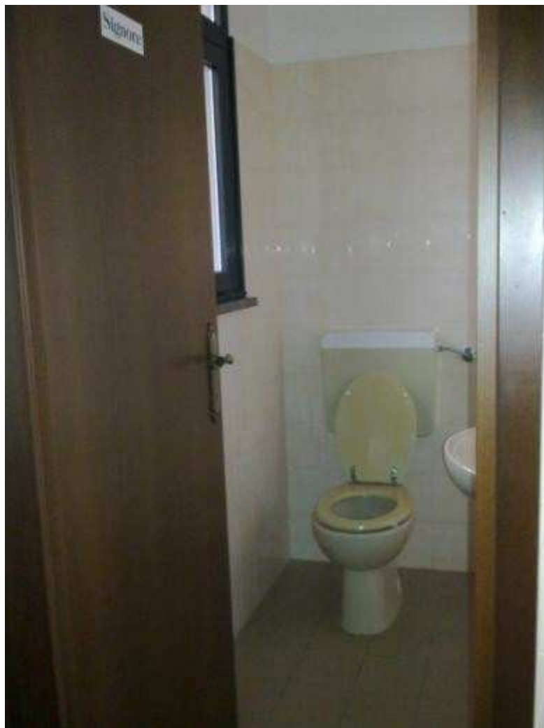
Foto 15 Bagno piano primo