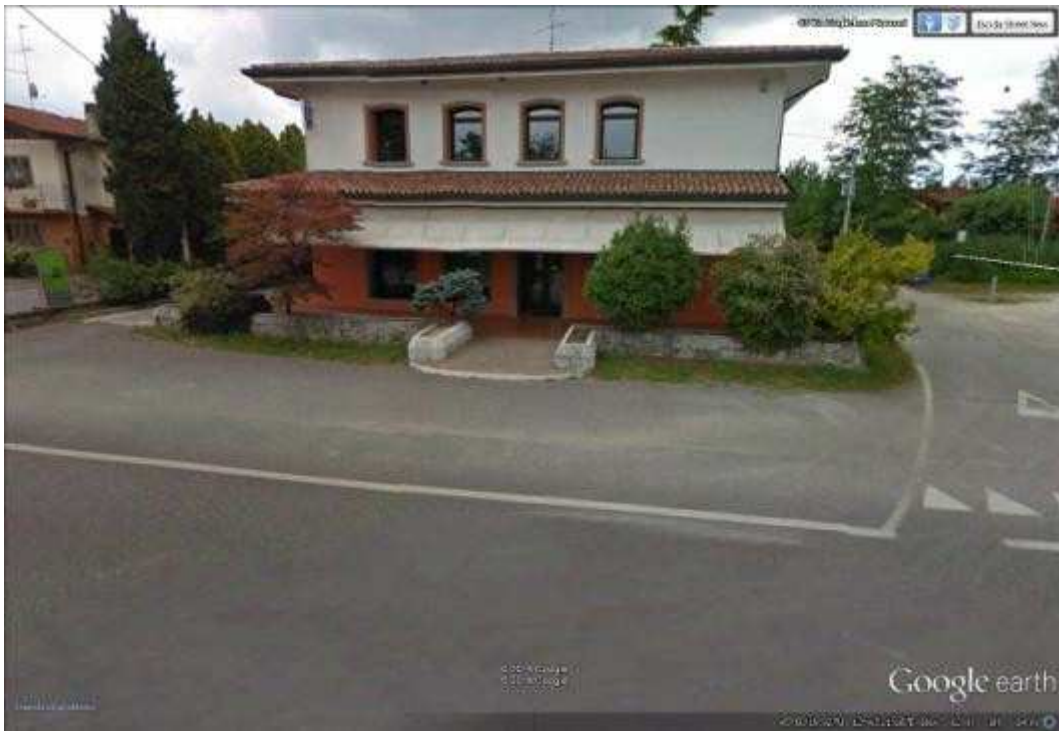
Foto 2 Vista frontale del fabbricato