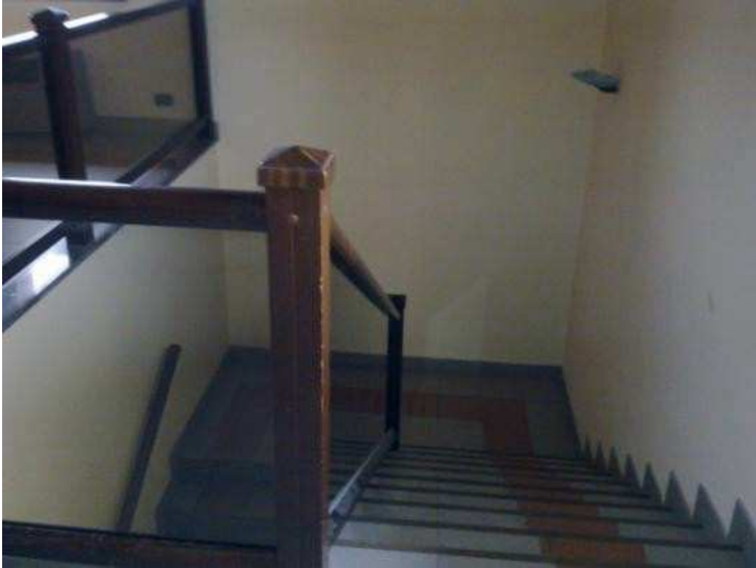
Foto 12 scala interna