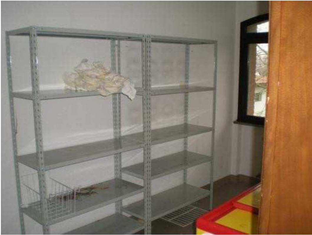
Foto 20 Ripostiglio Piano 1