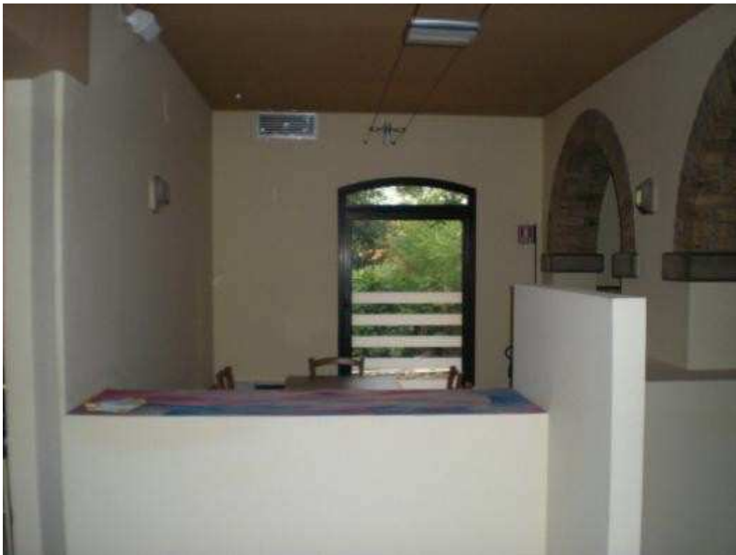
Foto 6 Sala pranzo piano terra