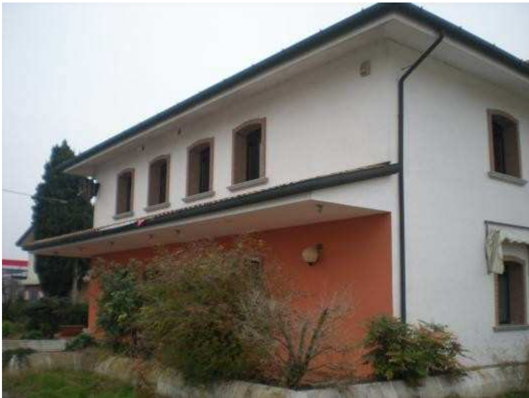
Foto3 Vista laterale