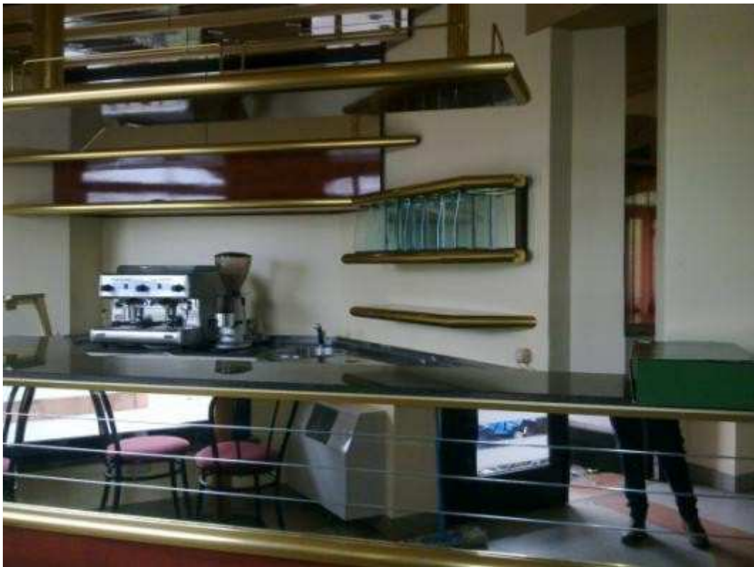
Foto 4 Zona bar piano terra