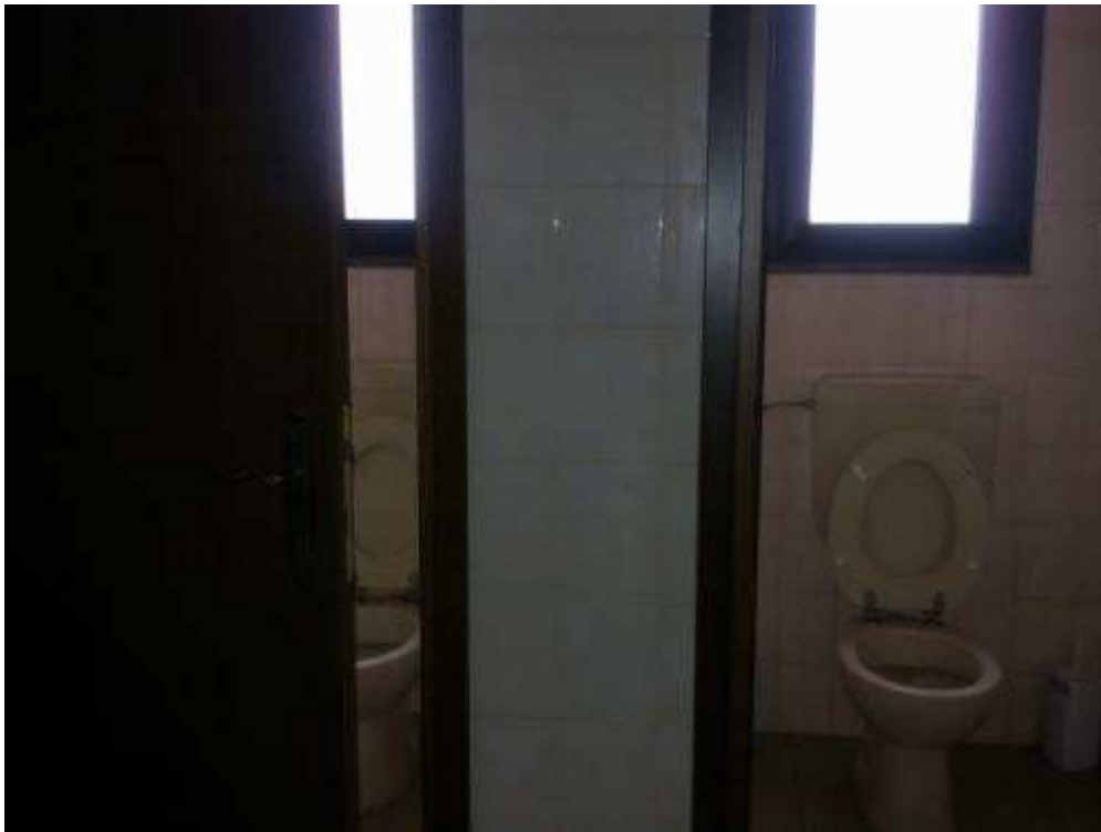
Foto 11 Bagni piano terra