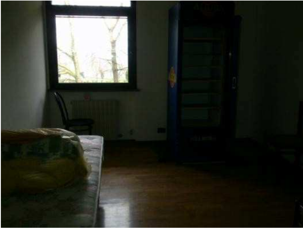
Foto 18 Cameretta Piano 1