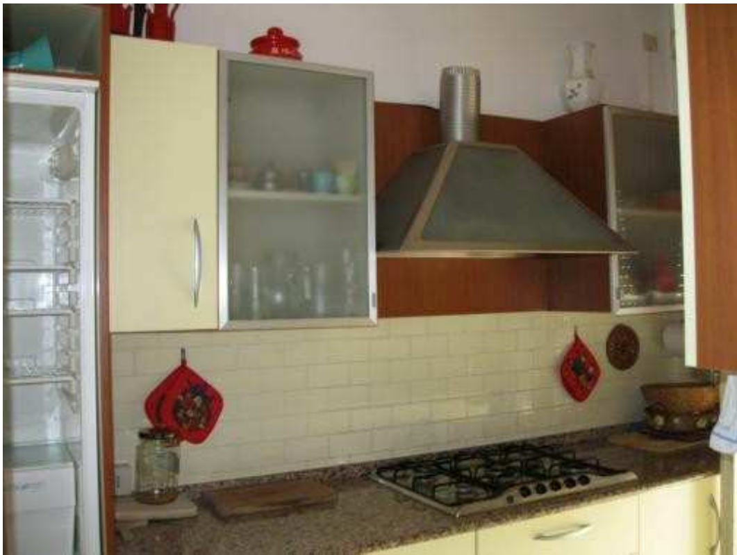
Foto 15 cucina