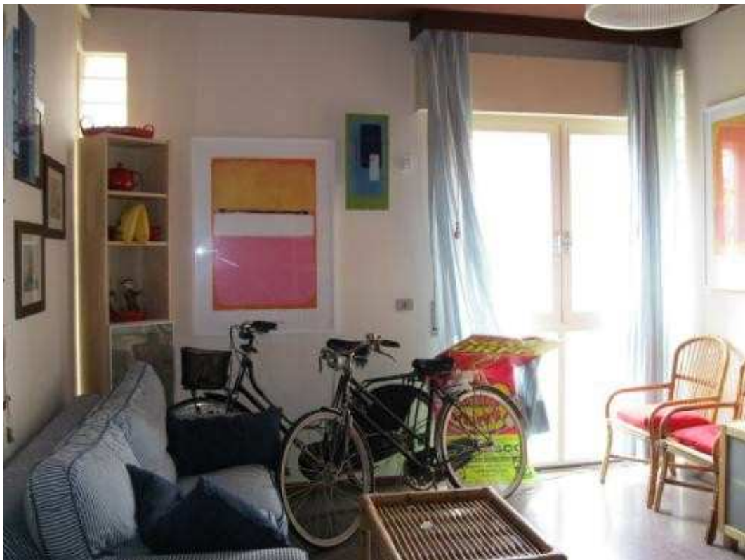
Foto 14 zona giorno