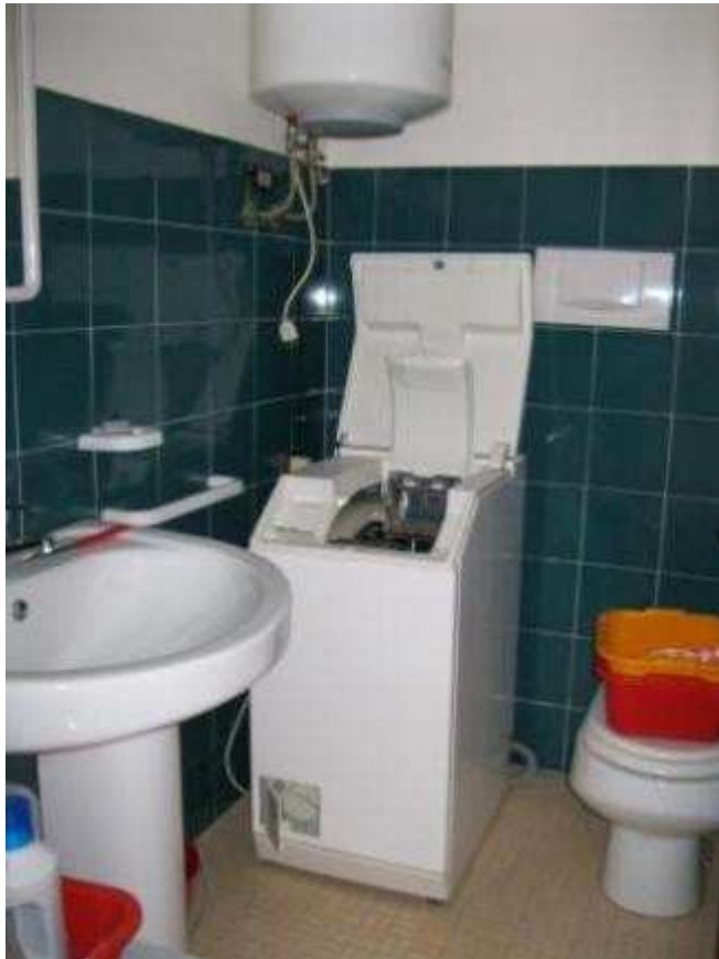
Foto 17 Lavanderia / servizi