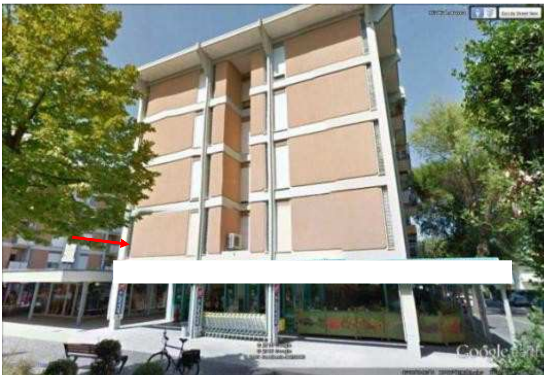
Foto 1 Vista del fabbricato da Viale Aurora