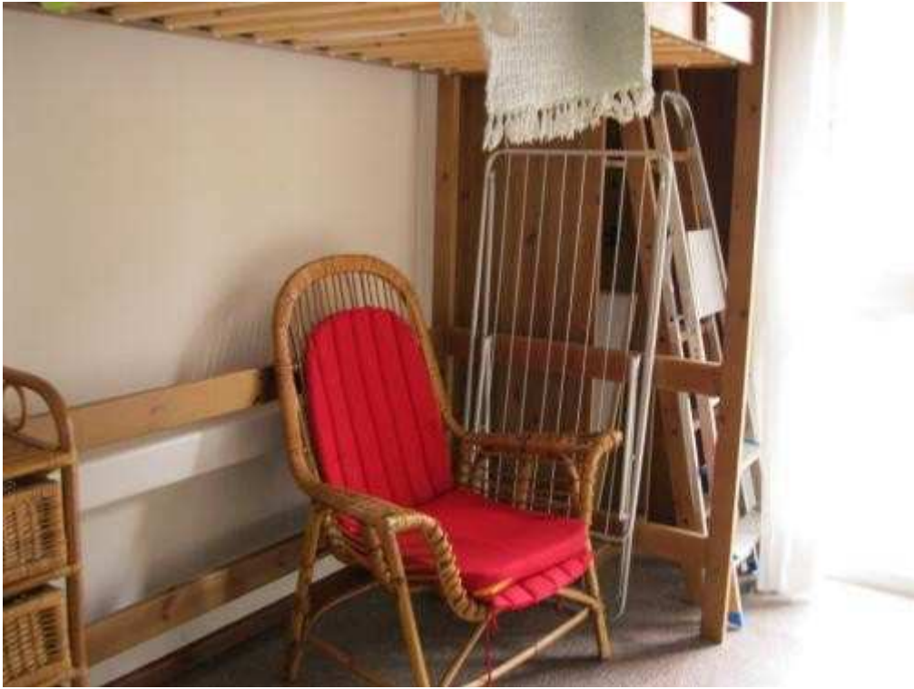
Foto 23 Cameretta/ripostiglio 1