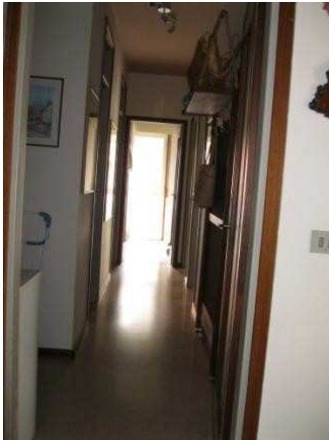
Foto 19 Corridoio