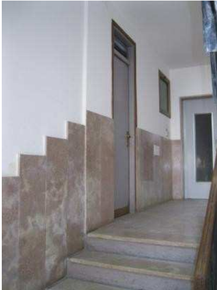
Foto 8 Scala condominiale ed ascensore