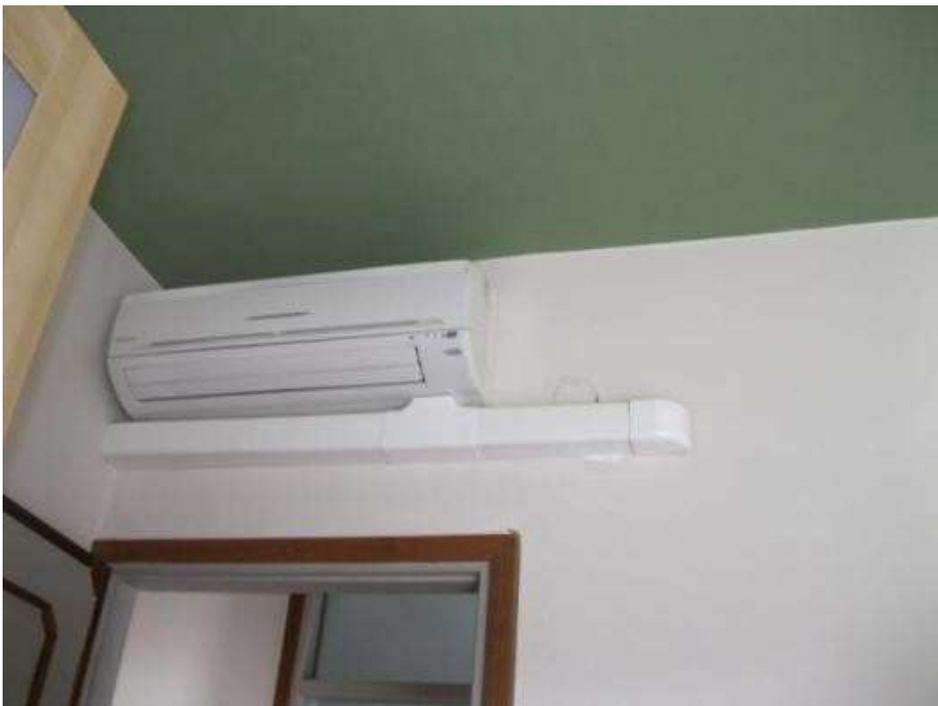
Foto 32 33 dettaglio impianto condizionamento