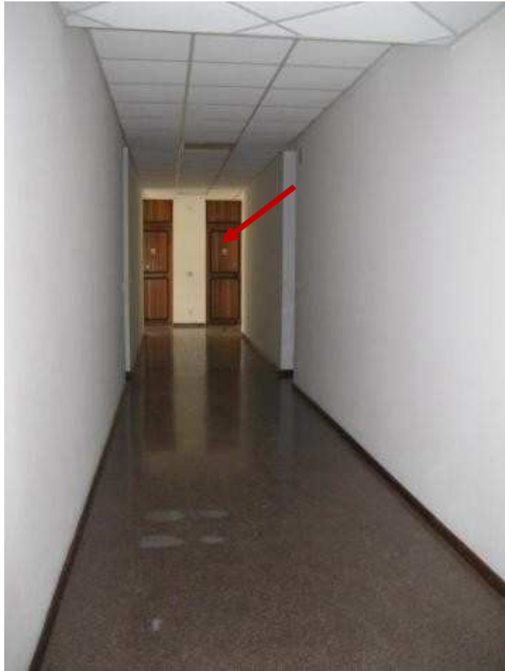
Foto 10 Corridoio comune e porta accesso immobile esecutato