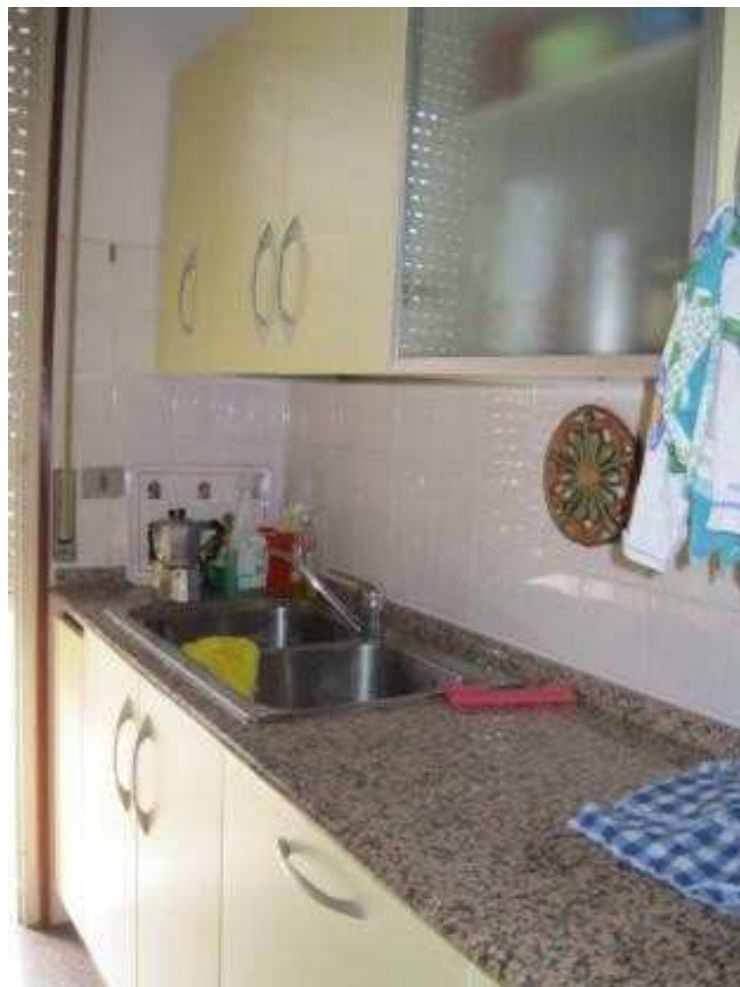
Foto 16 cucina