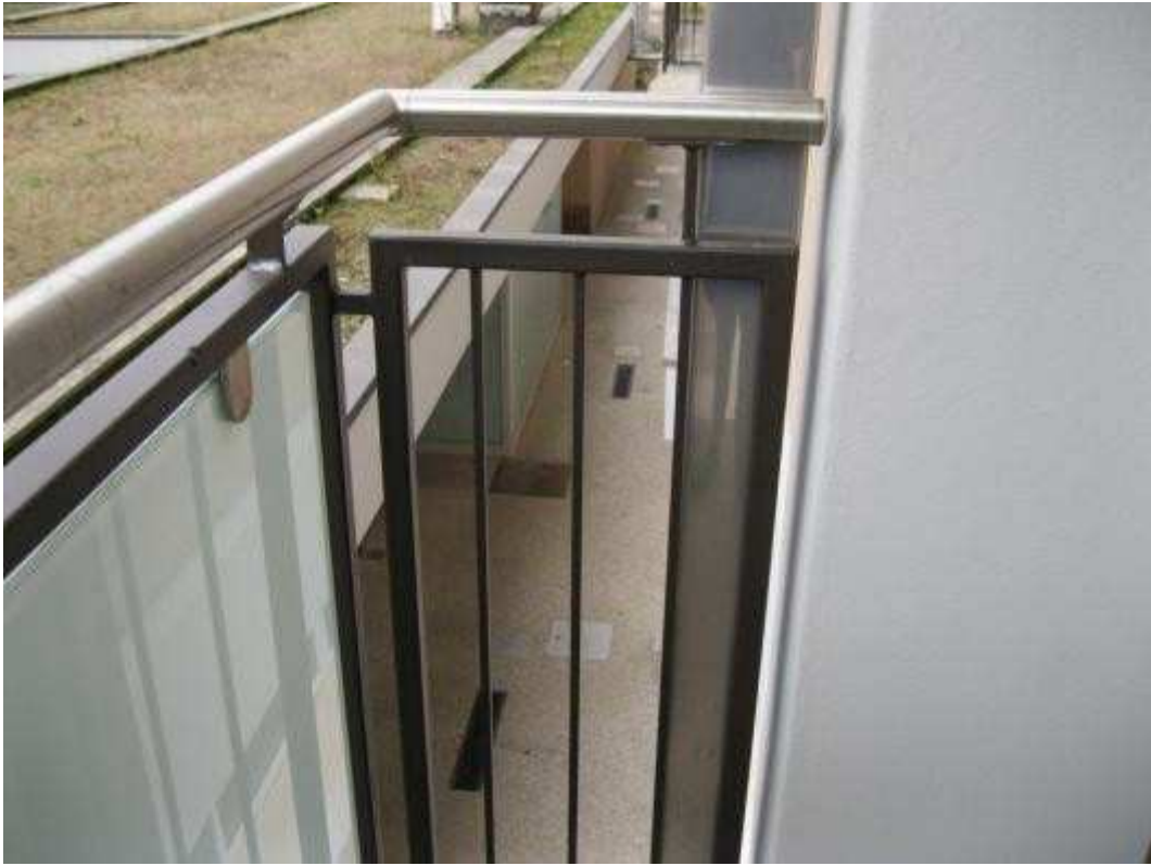
Foto 25 Terrazzino cucina