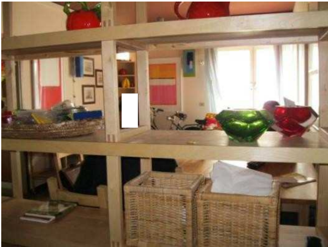
Foto 13 zona giorno