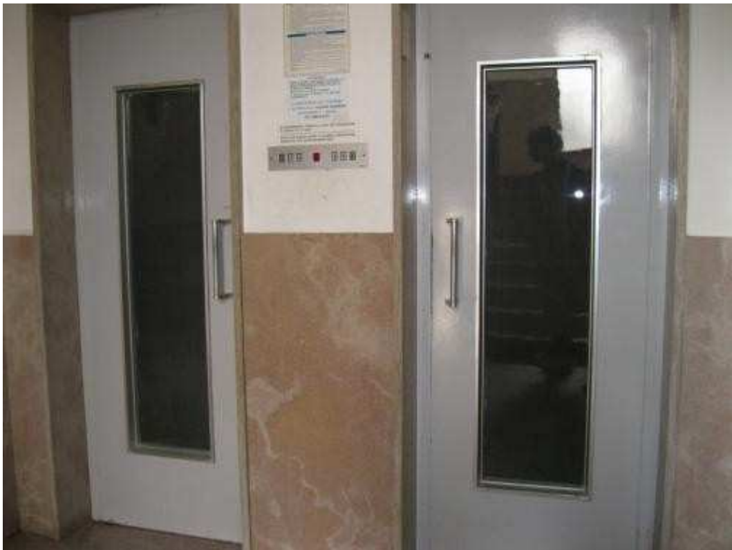
Foto 9 ascensori