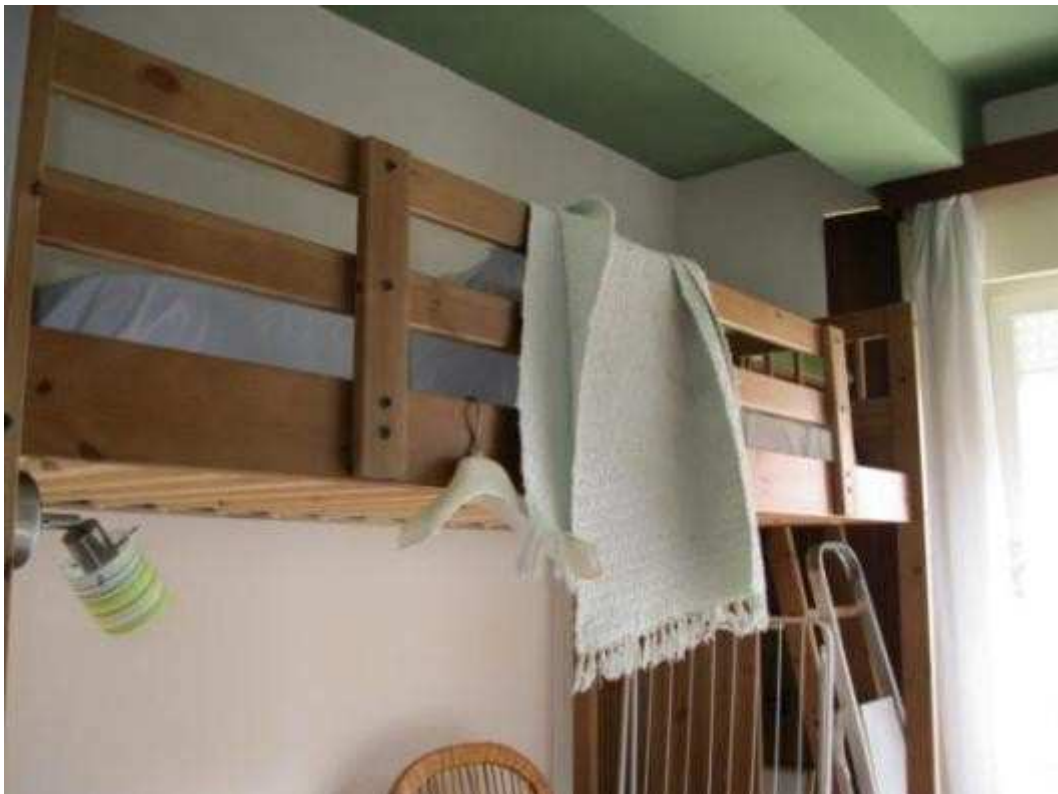
Foto 22 Cameretta/ripostiglio 1