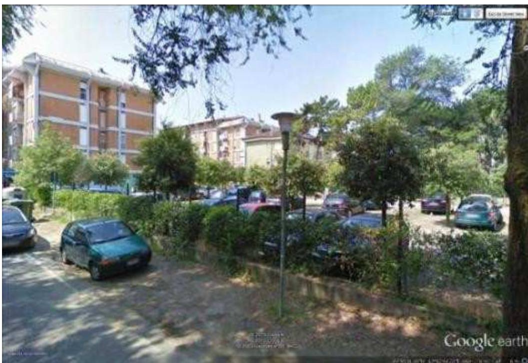
Foto 3 Vista posti auto da Via del Leone