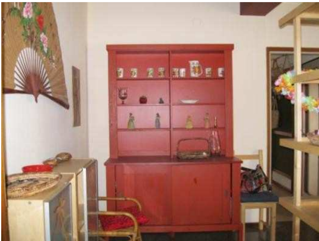
Foto 12 Ingresso soggiorno