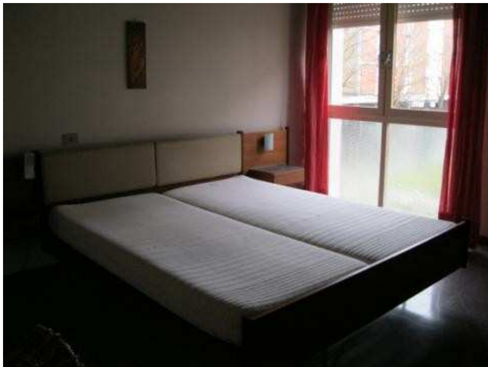
Foto 20 Camera matrimoniale