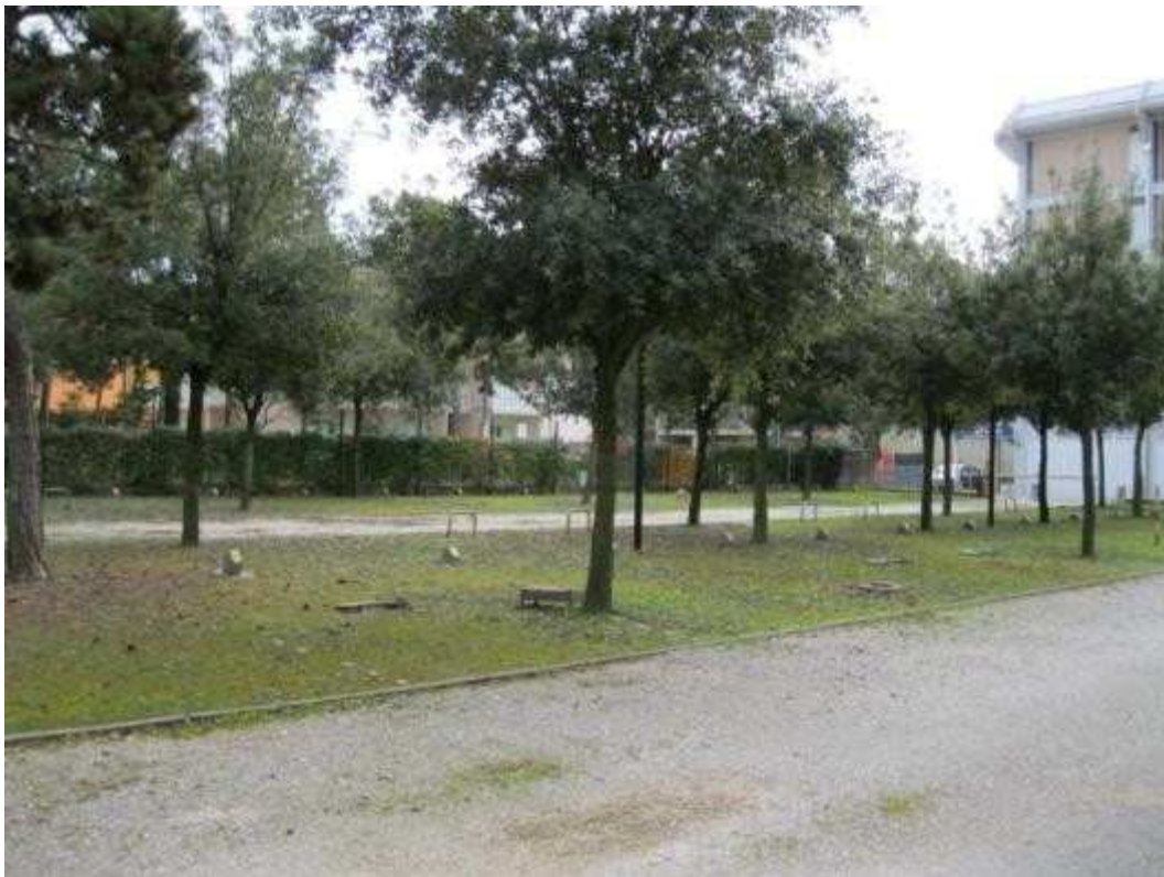
Foto 4 Area posti auto