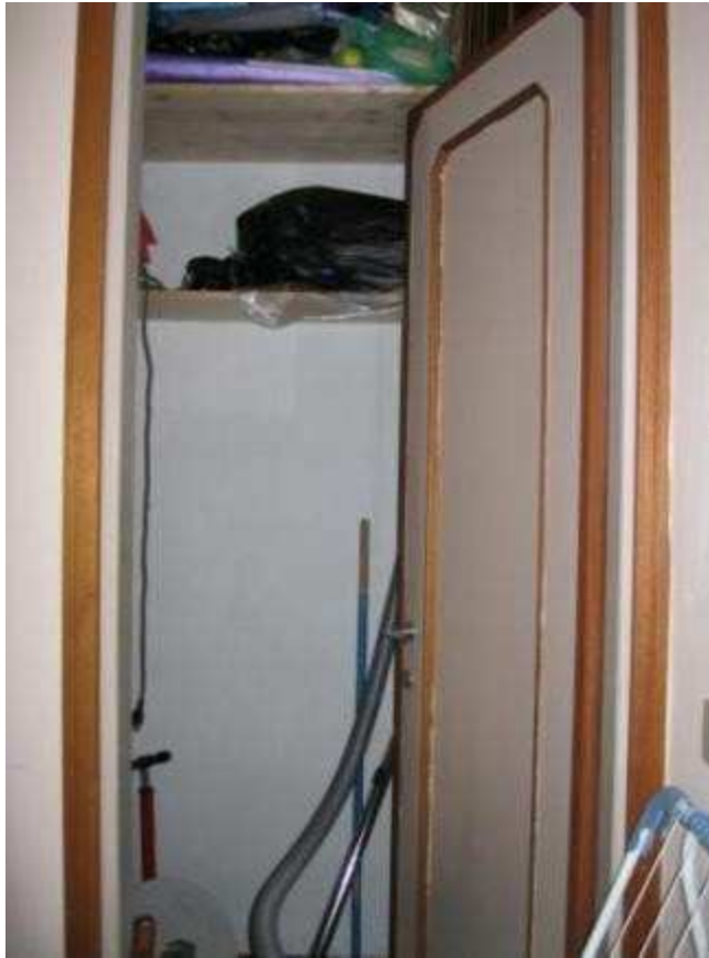
Foto 21 Ripostiglio