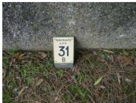
Foto 5 e 6 Dettaglio posto auto di pertinenza dell'immobile