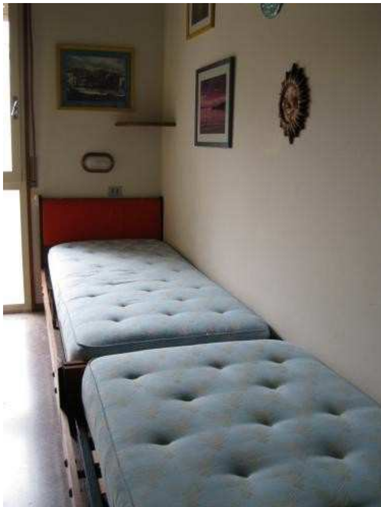
Foto 24 Cameretta 2