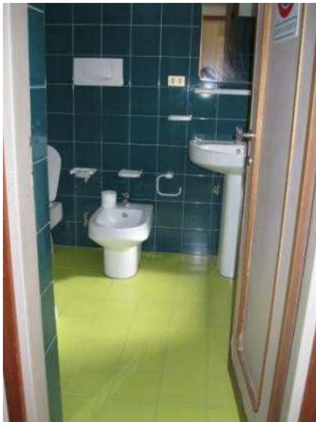
Foto 18 Bagno