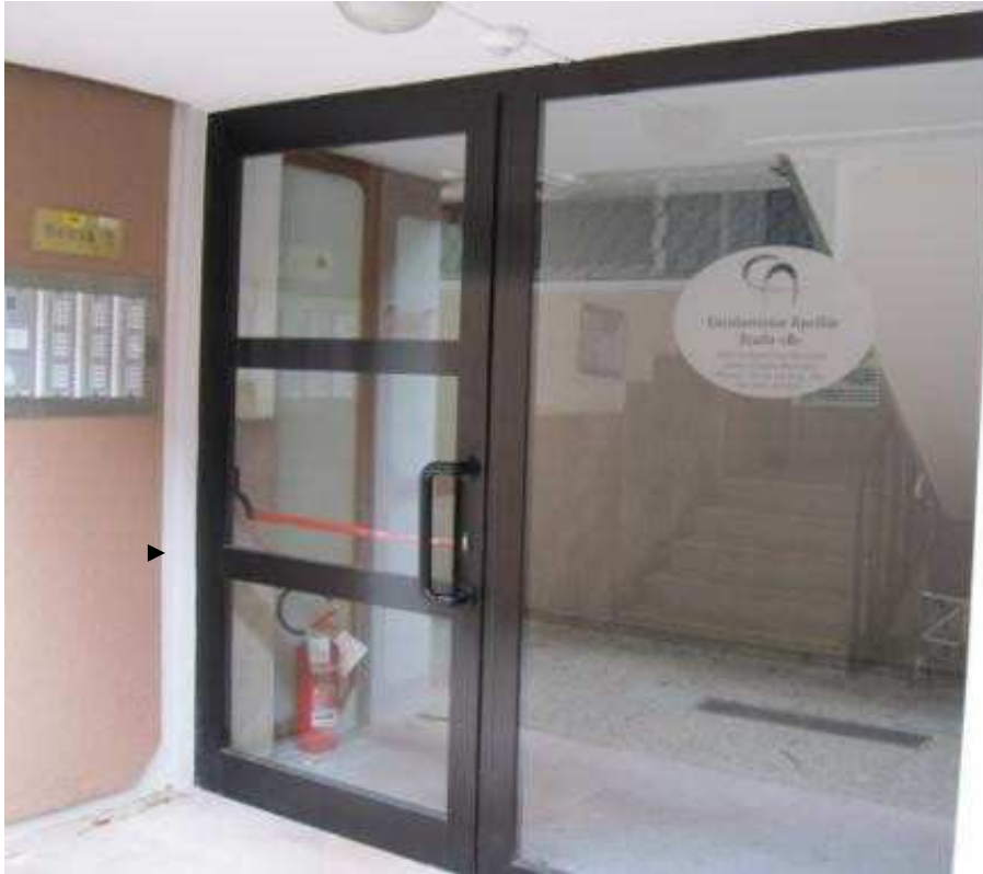
Foto 7 Ingresso Condominio