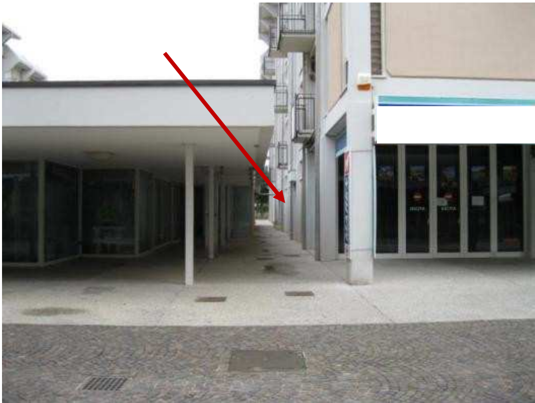
Foto 2 Vista del fabbricato da Viale Aurora con indicato ingresso condominiale