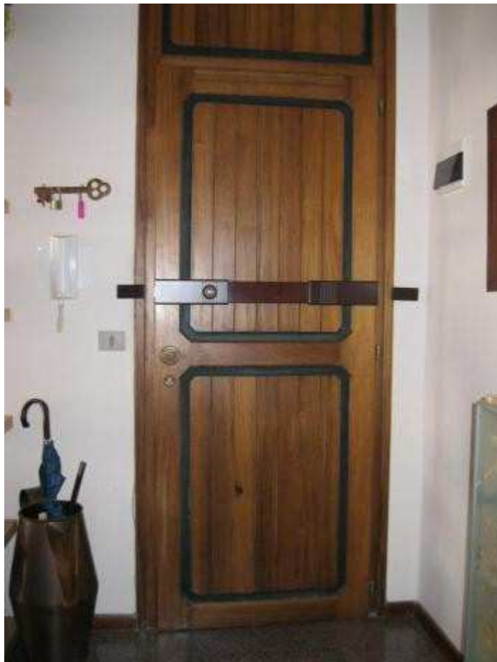
Foto 11 porta accesso immobile esecutato vista dall'interno