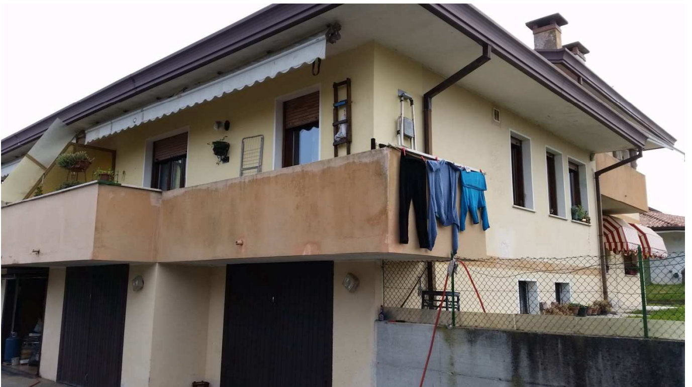
Foto 6 : Prospetto Sud-Ovest e Nord-Ovest dell’appartamento (Sub.2) oggetto di esecuzione immobiliare posto al piano rilazato del condominio “Novo Barco”.