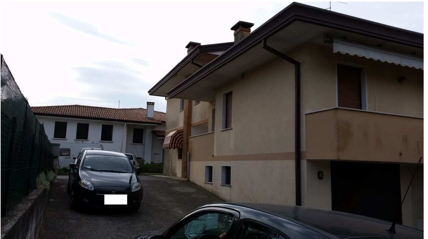
Foto 8 : Scoperto comune posto a Nord-Est del condominio “Novo Barco” ove è presente la rampa carrabile che conduce al Piano Seminterrato.