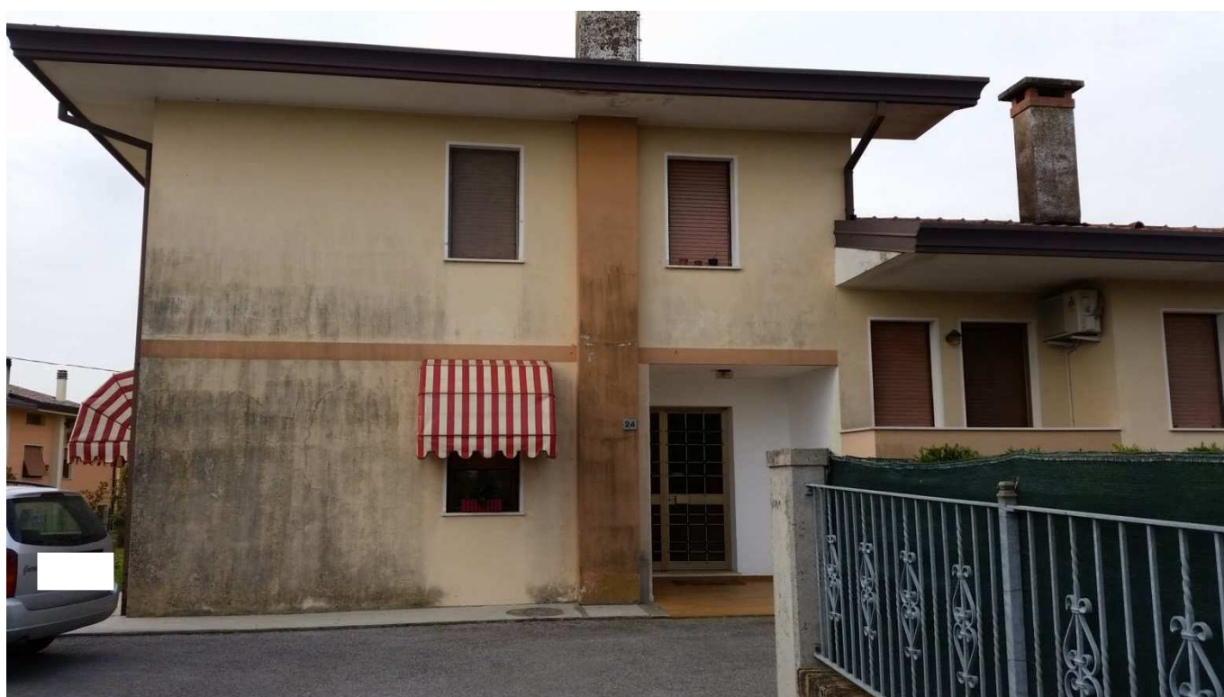
Foto 2 : Prospetto Nord-Est del fabbricato condominiale "Novo Barco" ove è ubicato l'ingresso principale.