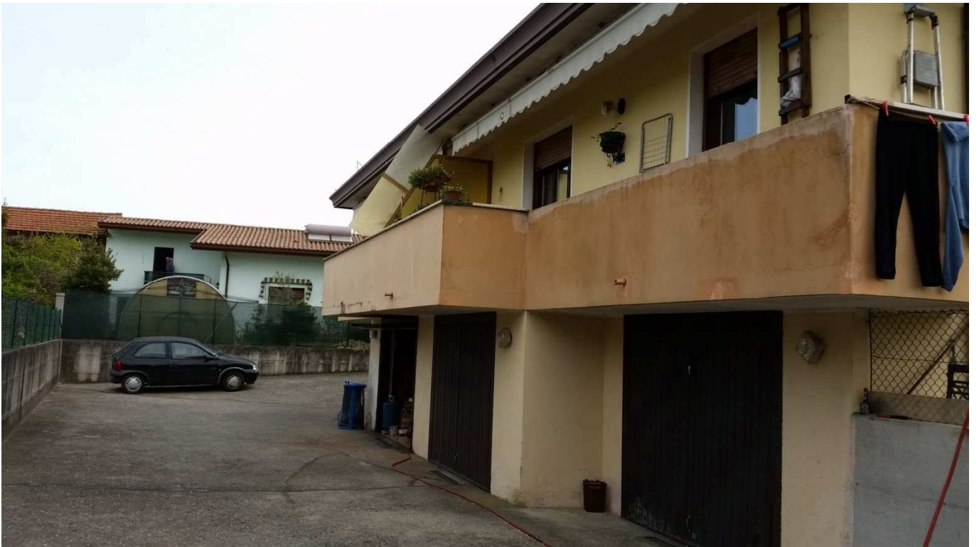
Foto 5 : Prospetto Nord-Ovest del condominio “Novo Barco” e scoperto pertinenziale comune utilizzato quale spazio di accesso e manovra autovetture per l’accesso alle autorimesse del Piano Seminterrato.