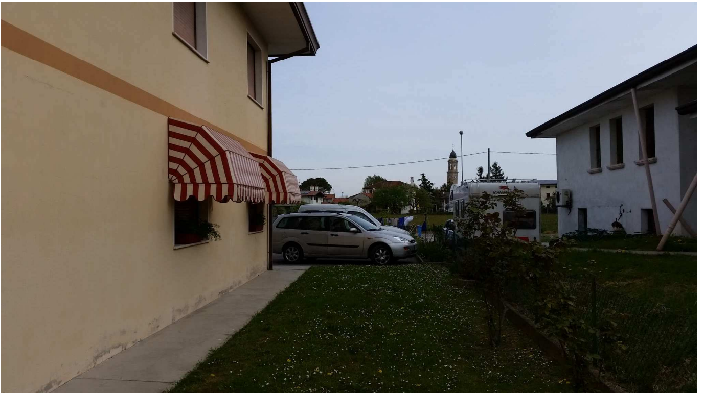
Foto 3 : Scoperto perinenziale comune destinato a giardino posto a Sud-Est del condominio.