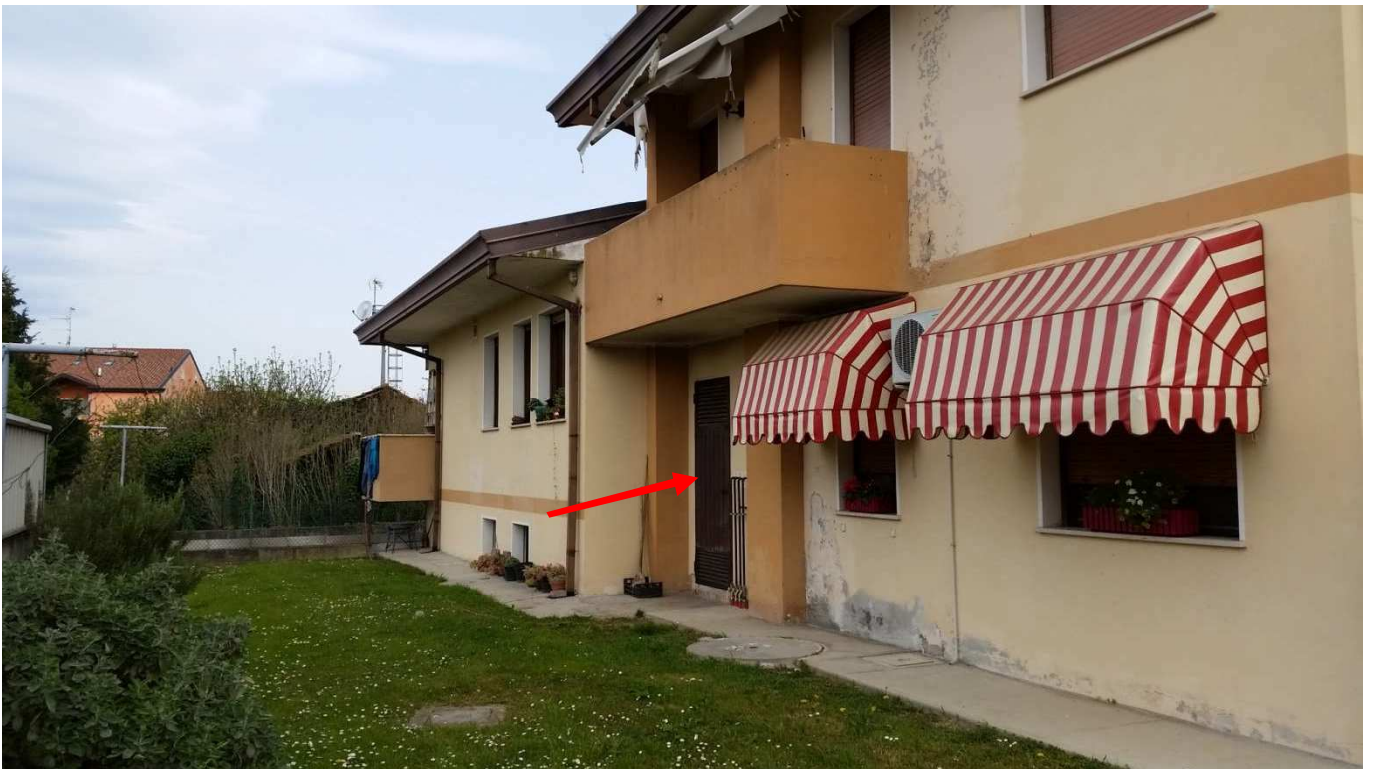
Foto 4 : Prospetto Sud-Ovest del Condominio “Novo Barco” con indicazione dell’accesso alla centrale termica comune.