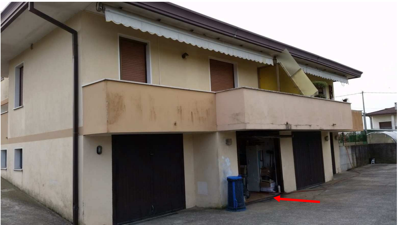
Foto 7 : Prospetto Nord-Ovest del Condominio “Novo Barco” con indicazione dell’autorimessa oggetto di esecuzione (Sub.10).