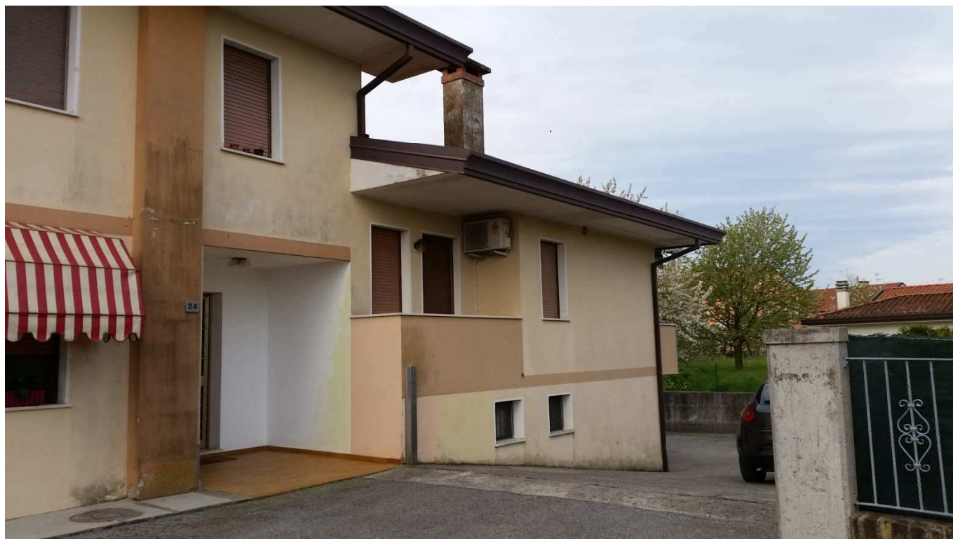
Foto 9 : Scoperto comune posto a Nord-Est del condominio “Novo Barco” ove è presente la rampa carrabile che conduce al Piano Seminterrato.