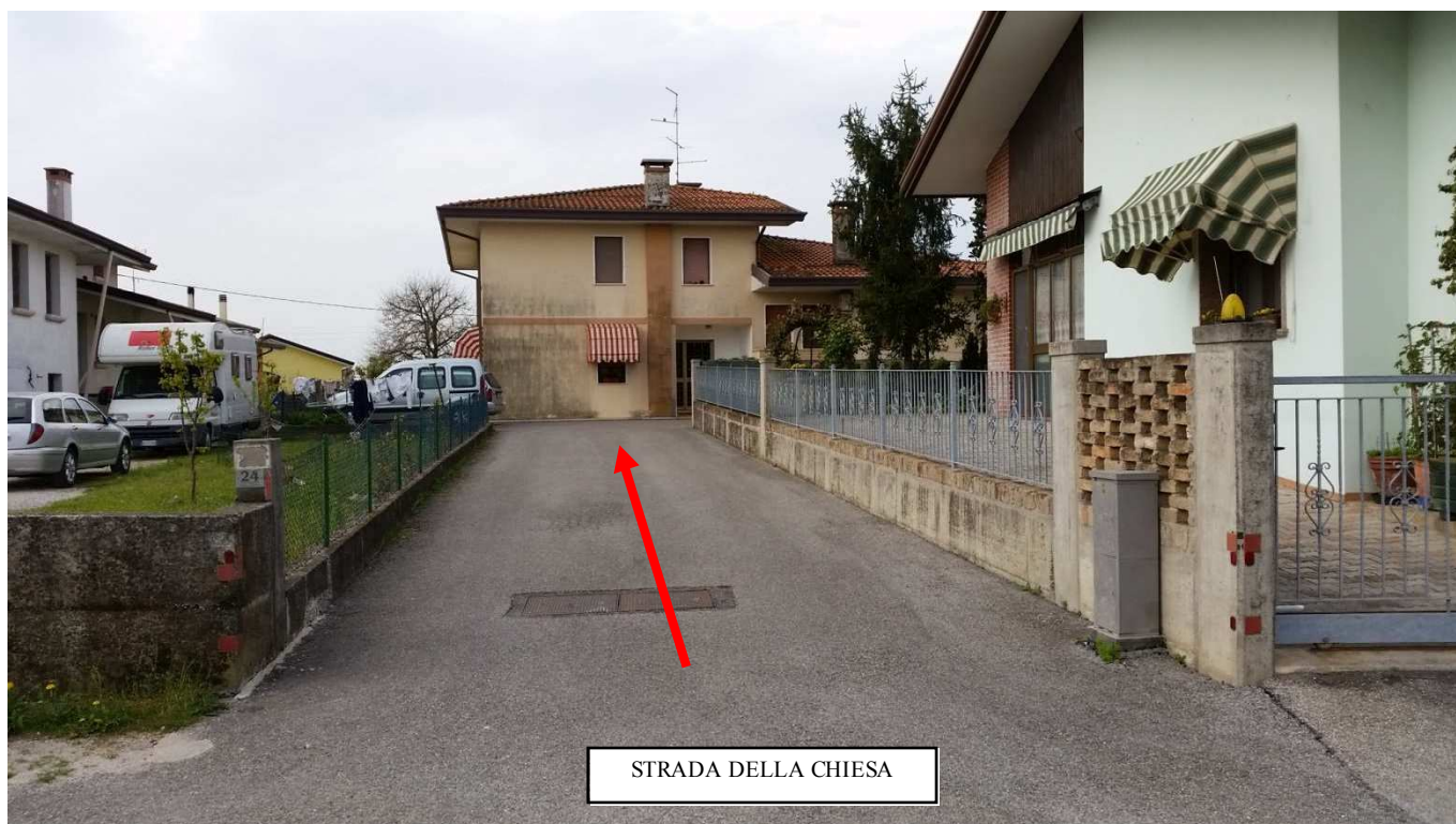
Foto 1 : Accesso carraio e pedonale alla proprietà condominiale dalla viabilità pubblica Strada della Chiesa