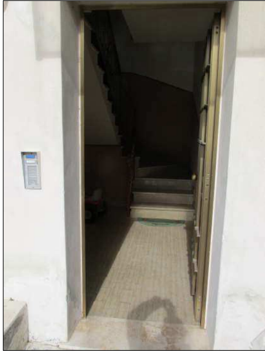
Fig.7: ingresso al piano terra nel vano scale comune