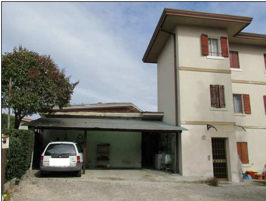
Fig.6: vista lati nord ed ovest del portico e della cantina