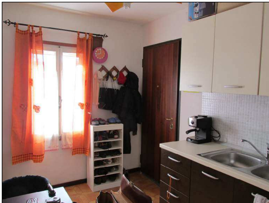
Fig.13: vista lato nord del soggiorno dalla cucina