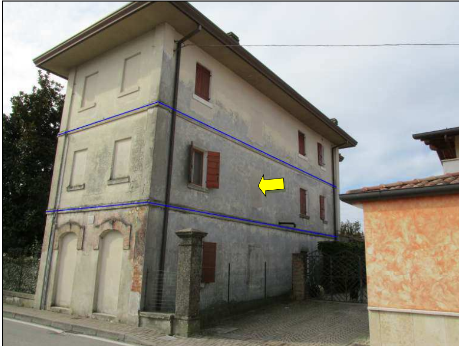
Fig.4: vista lati nord ed ovest della palazzina