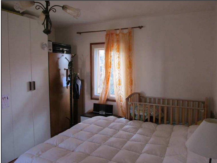
Fig.23: particolare pavimentazione in ceramica della camera matrimoniale