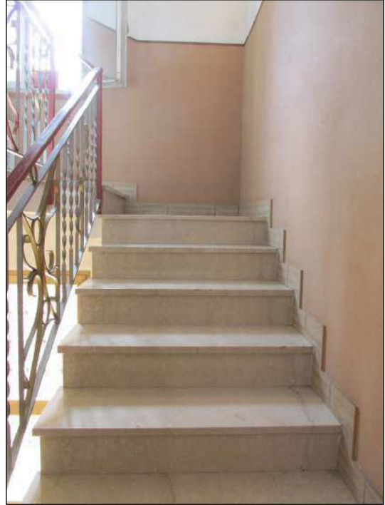
Fig.8: particolare rampa del vano scale comune