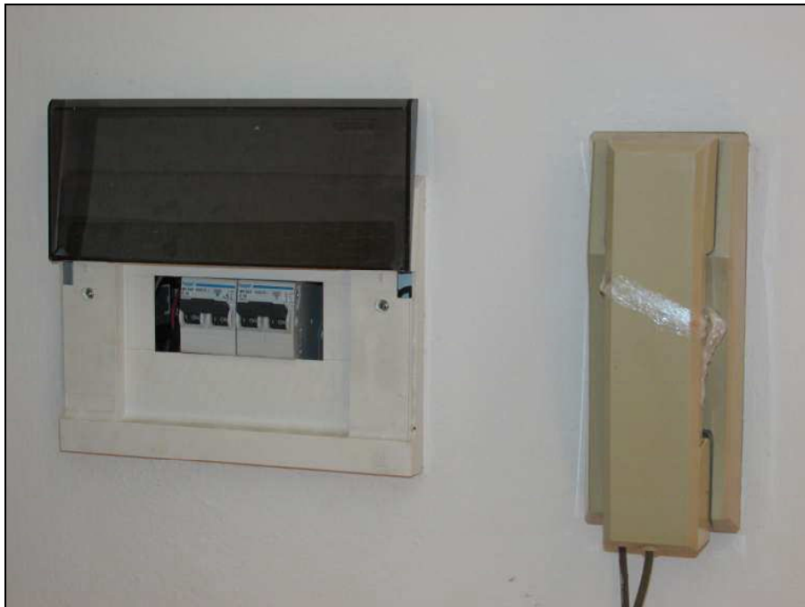
Fig.25: vista interni della cantina ad uso comune