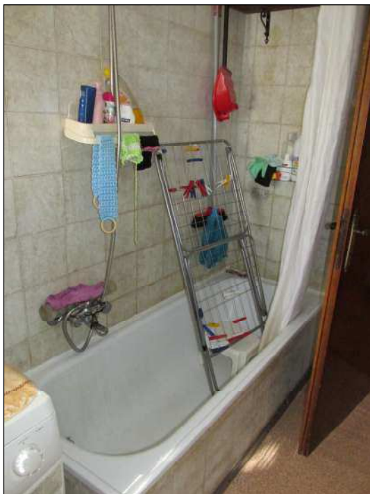
Fig.18: lato del bagno verso il soggiorno