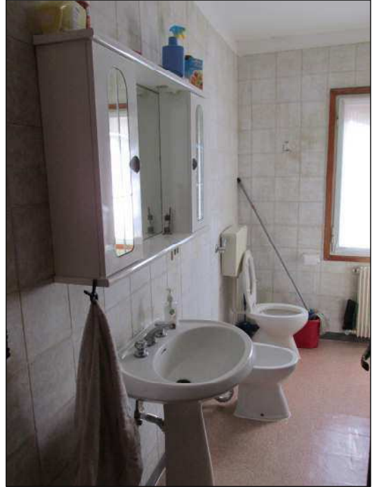
Fig.17: vista lato del bagno verso la camera matrimoniale