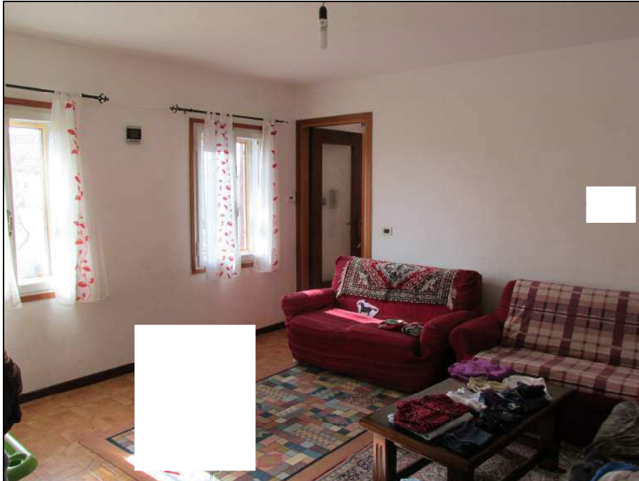
Fig.15: particolare pavimentazione soggiorno, cucina e disimpegno notte