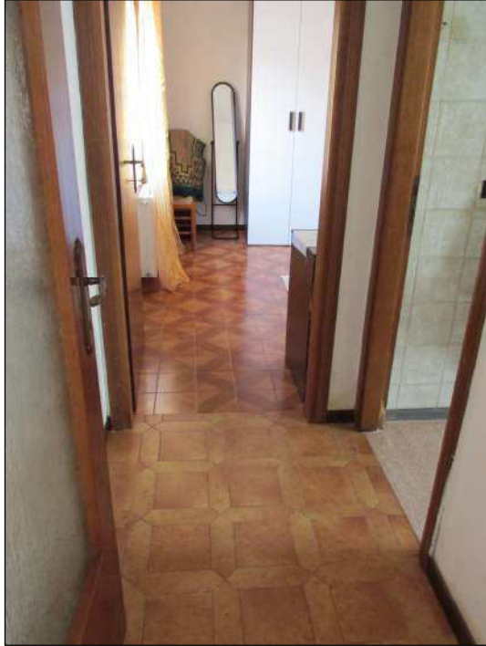
Fig.16: disimpegno zona notte