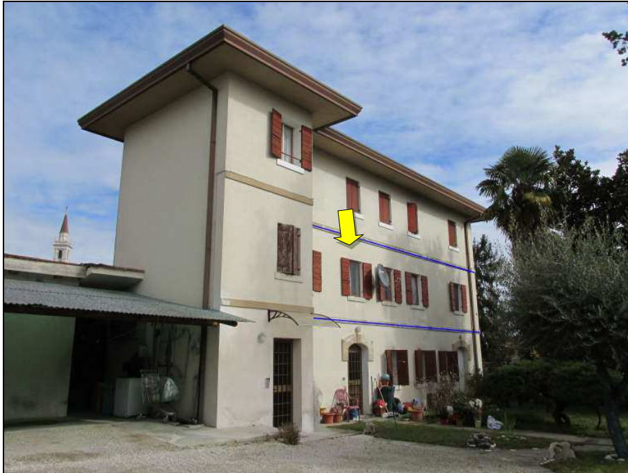
Fig.2: vista lati sud ed est della palazzina