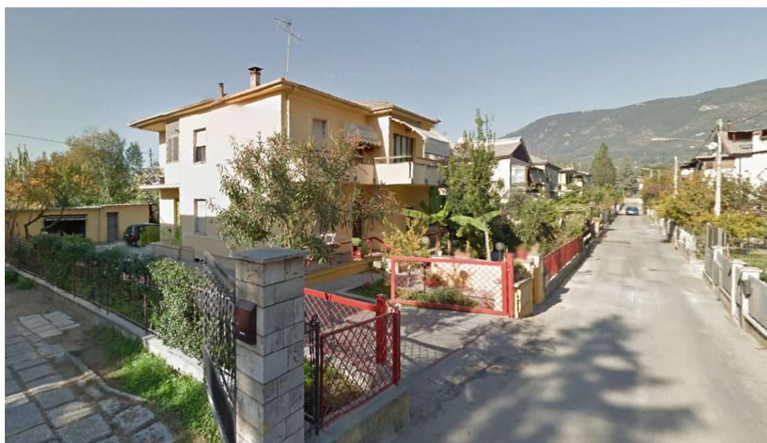
VISTA DA VIA DEI FORGIATORI