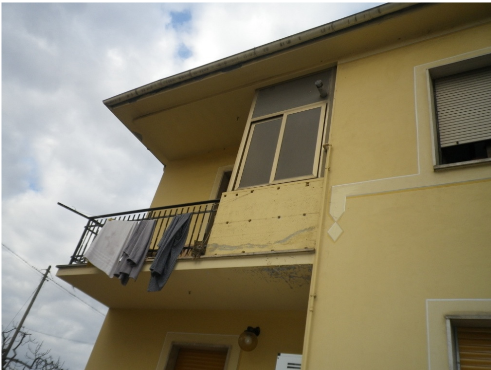
TERRAZZA FRONTE POSTERIORE