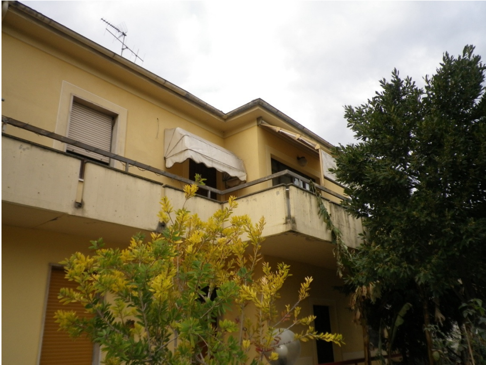
TERRAZZA FRONTE STRADA (INGRESSO)