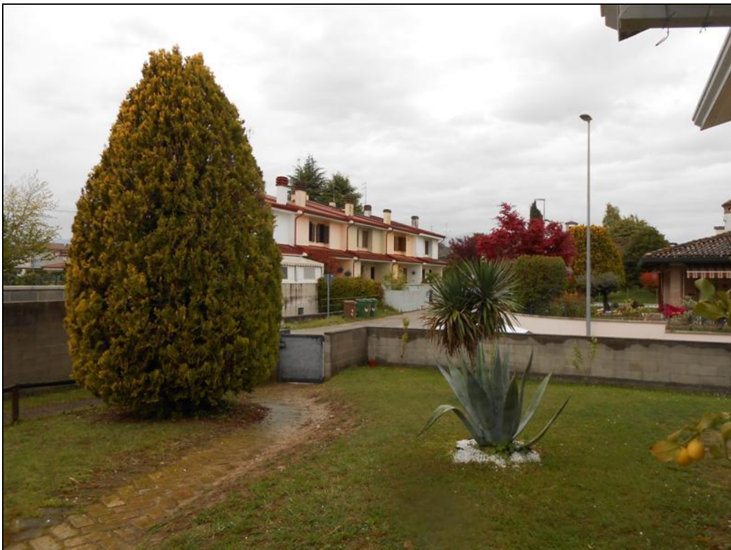
10) Veduta dallo scoperto in direzione della strada via Monte Canin