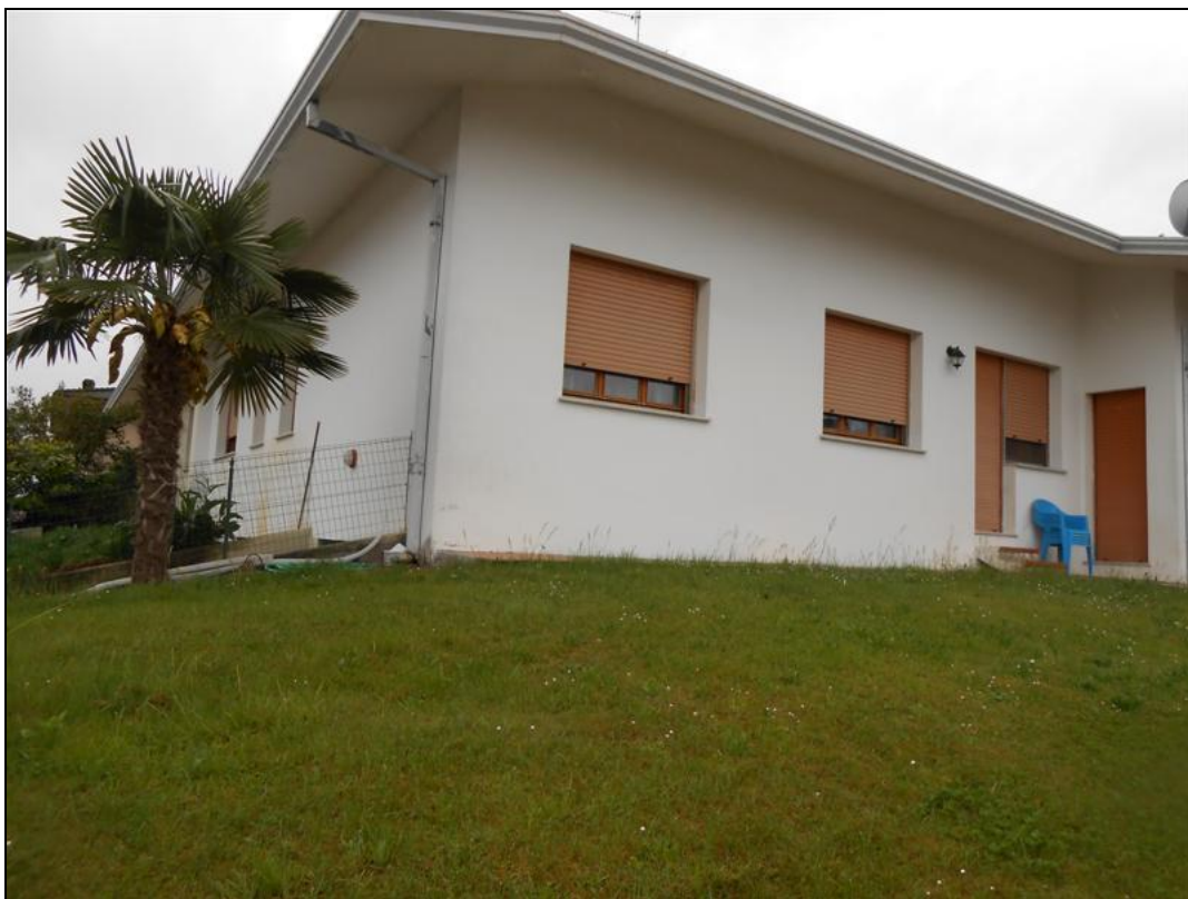
22) Veduta dell'angolo nord-est del fabbricato