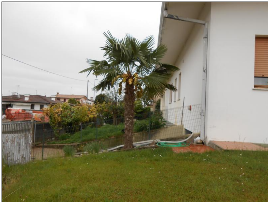
26) Veduta della rampa di accesso al garage dallo scoperto