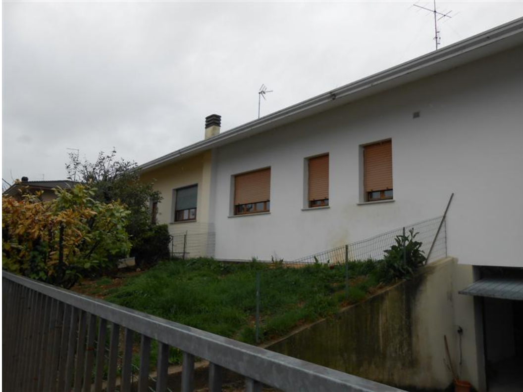
35) Cannello di ingresso carrabile