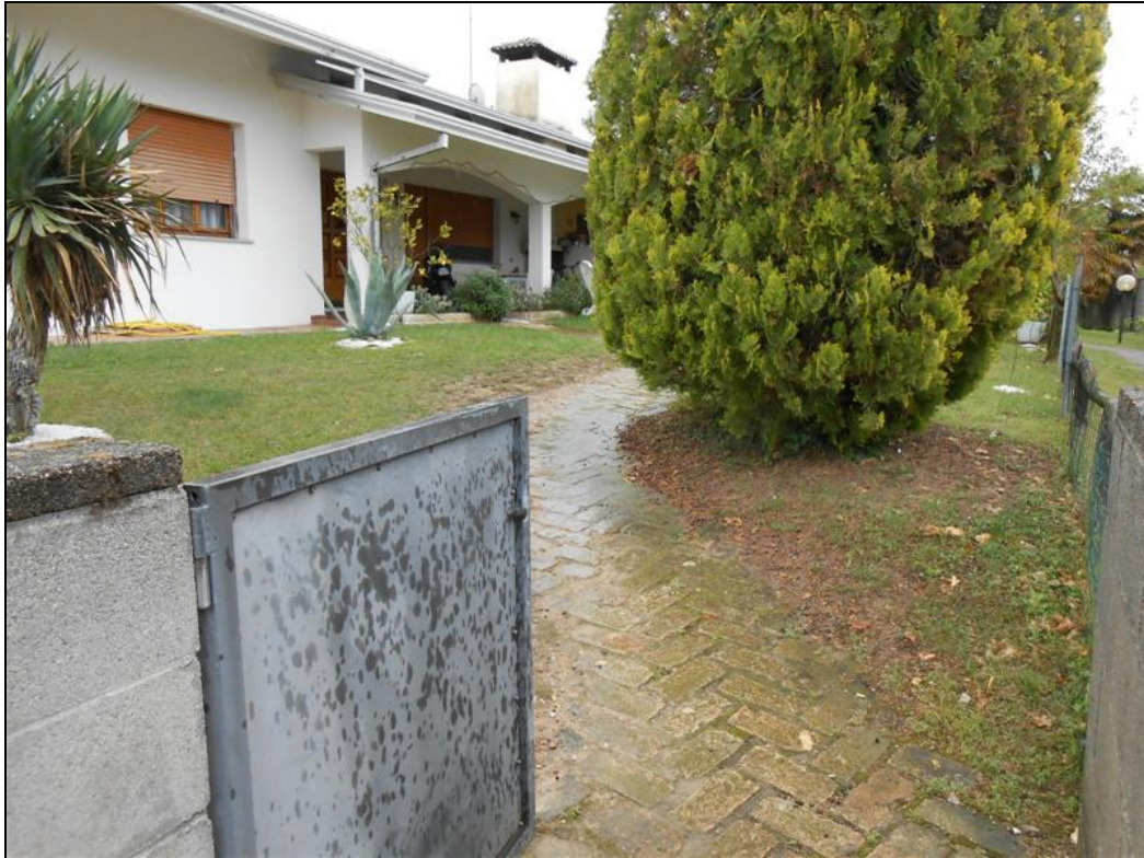
5) Vialetto di ingresso