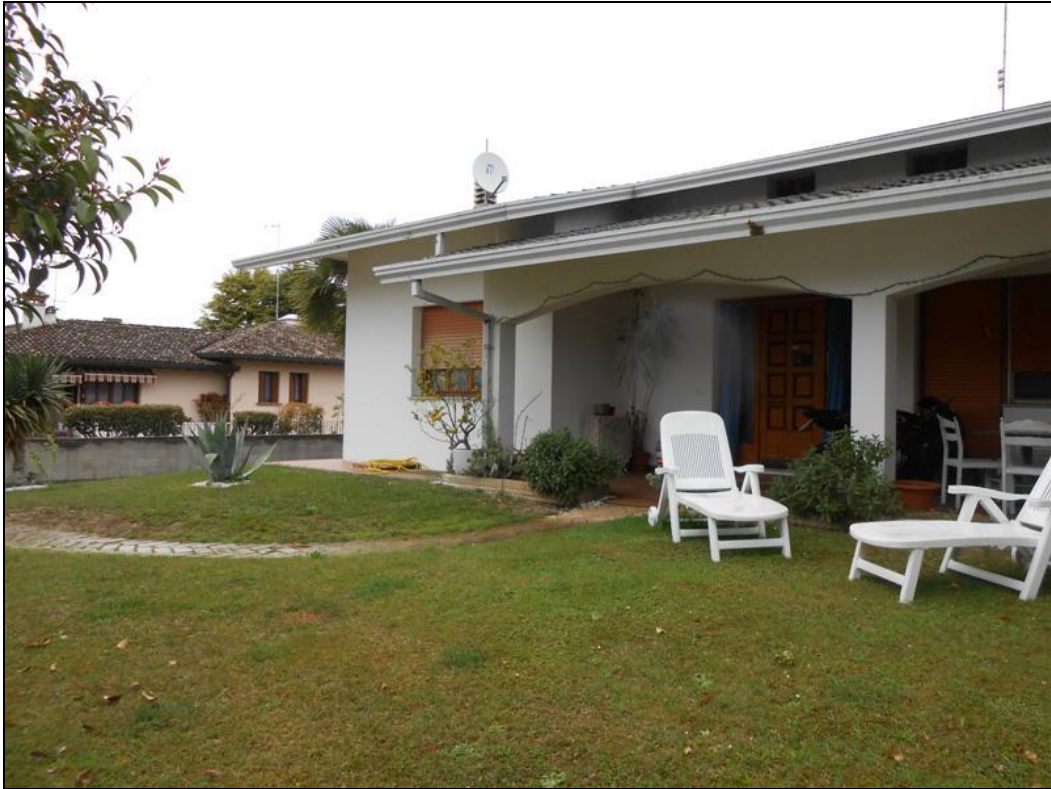
9) Scoperto esclusivo antistante il portico