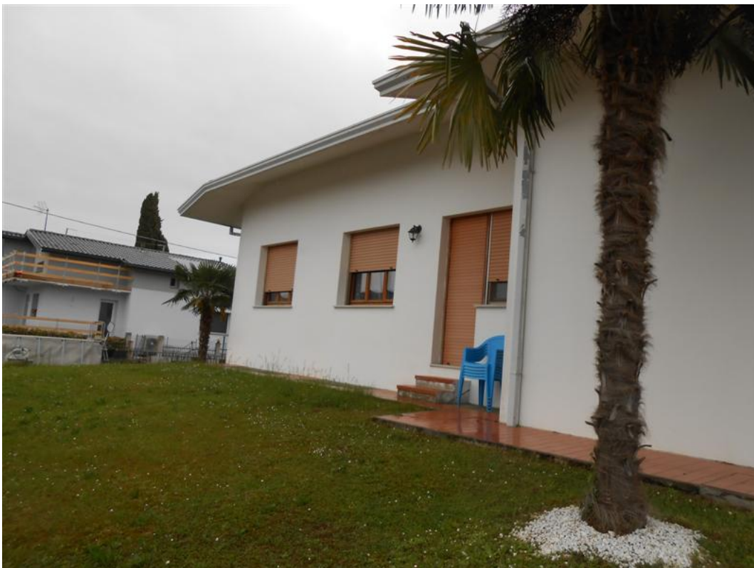
20) Veduta del fronte nord del fabbricato