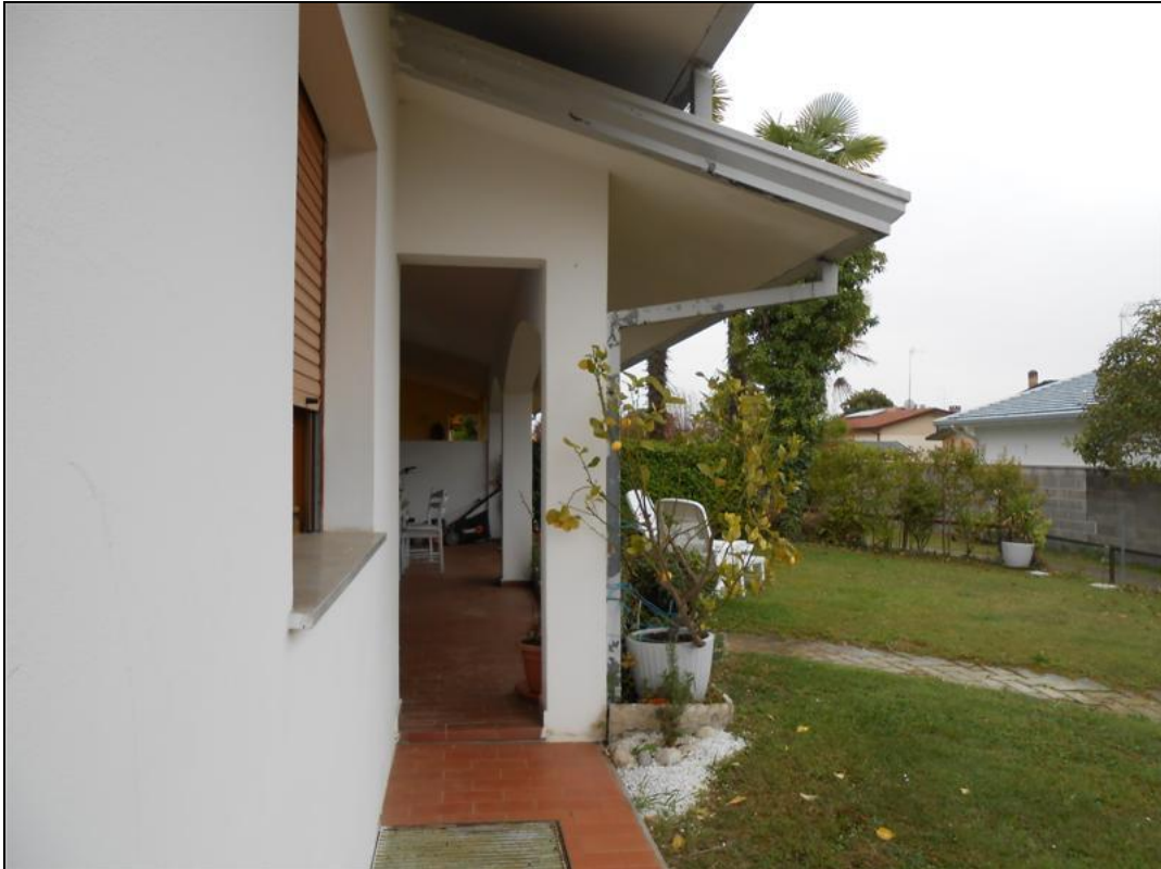
29) Veduta del portico dall'angolo nord-ovest del fabbricato