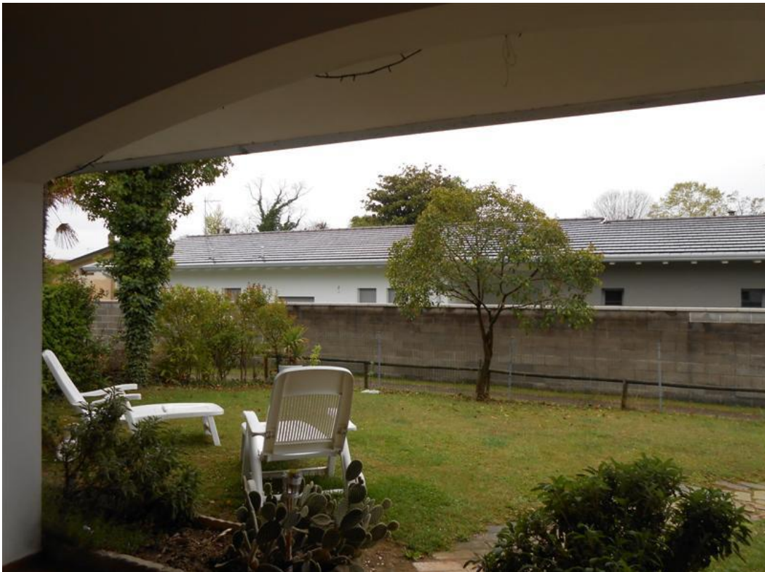
14) Veduta dello scoperto dal portico