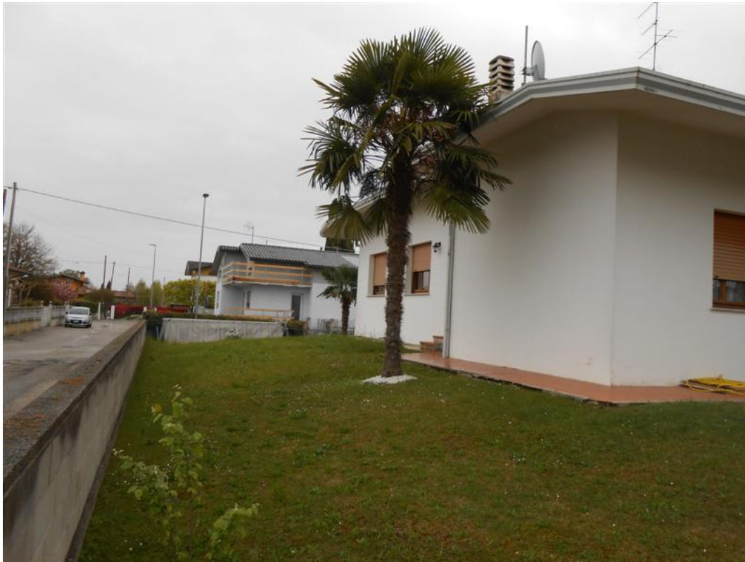
19) Veduta dello scoperto