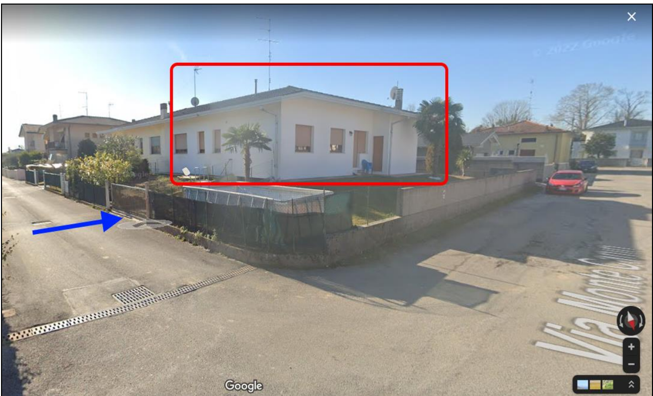
2) Ingresso carrabile dalla traversa di via Monte Canin e veduta d'insieme del fabbricato