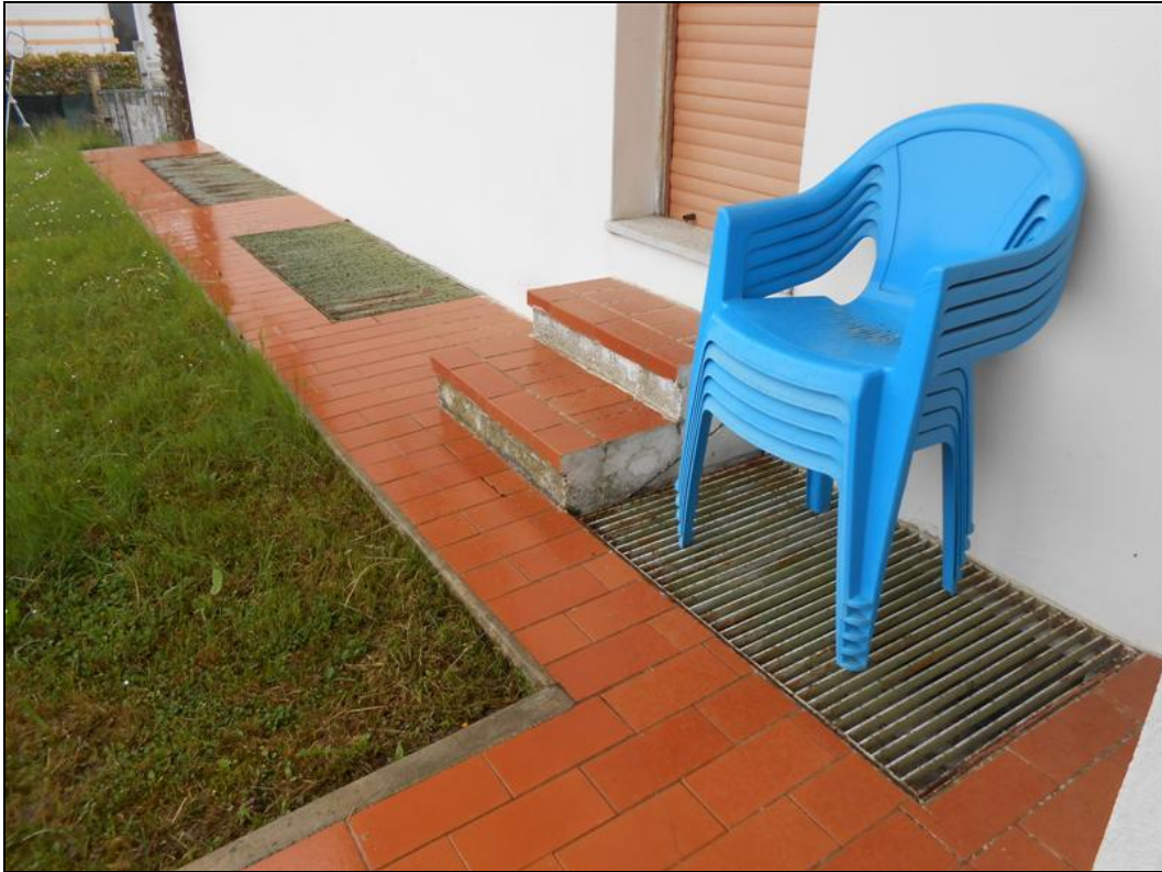
27) Particolare esterno