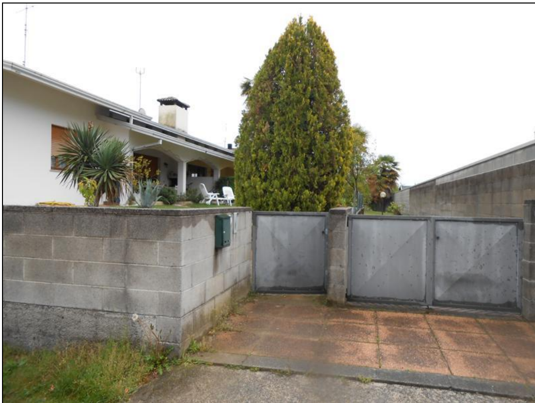
4) Particolare del cancello di ingresso pedonale