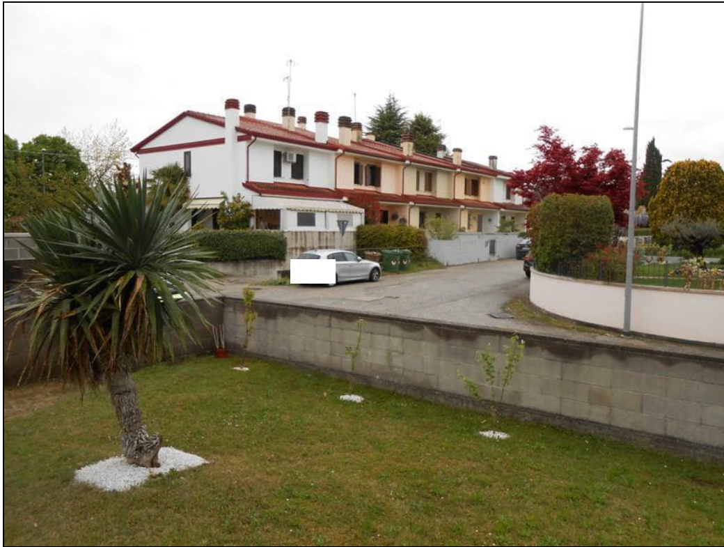
11) Veduta della recinzione sulla strada via Monte Canin