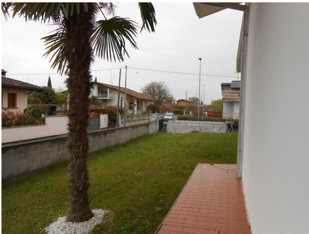
18) Veduta dello scoperto e della recinzione sulla strada traversa di via Monte Canin