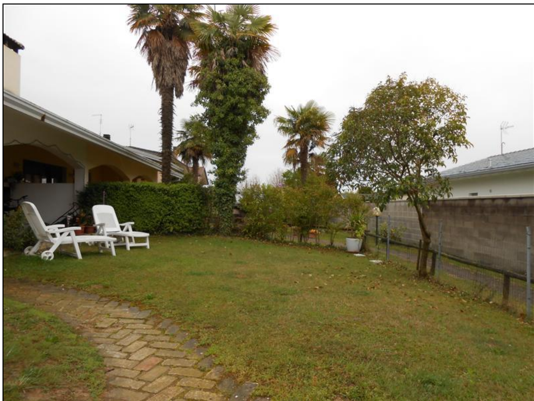
8) Scoperto esclusivo antistante il portico