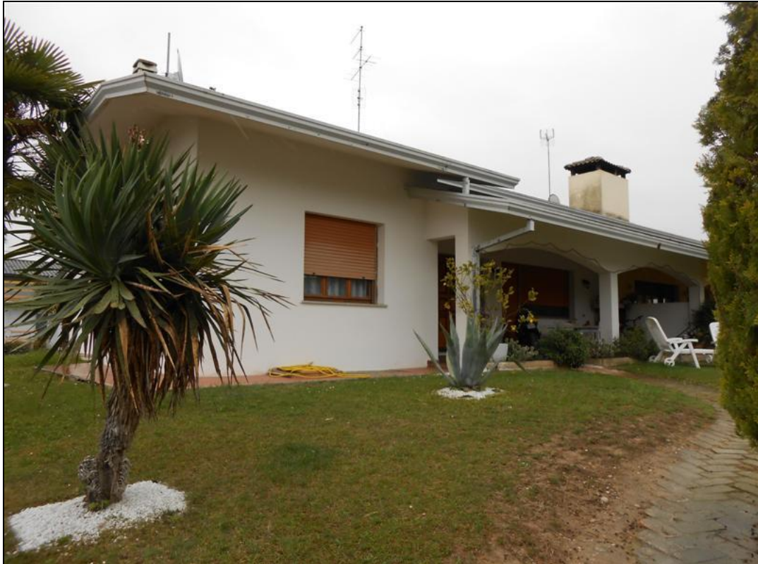
7) Veduta del portico