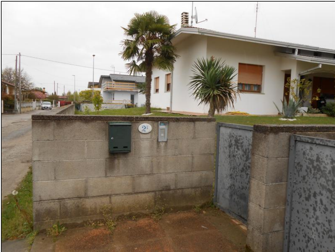
31) Particolare del cancello di ingresso pedonale