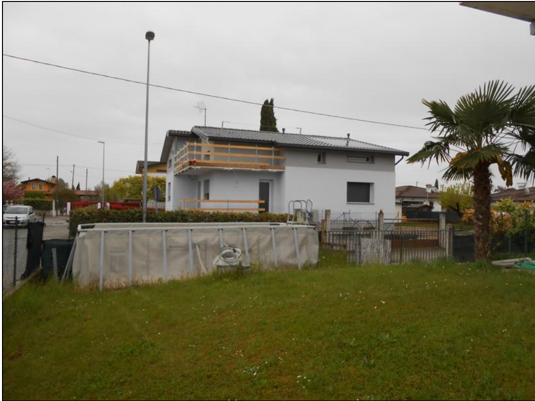
25) Particolare dello scoperto