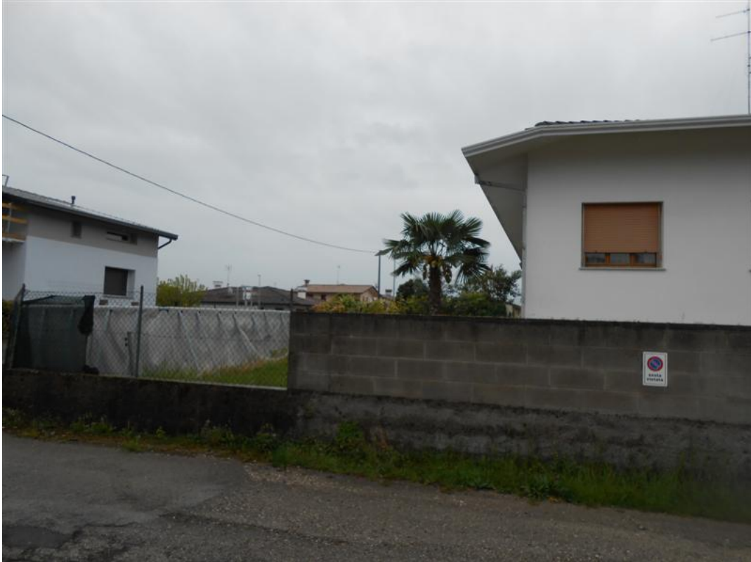
33) Veduta dalla strada via Monte Canin