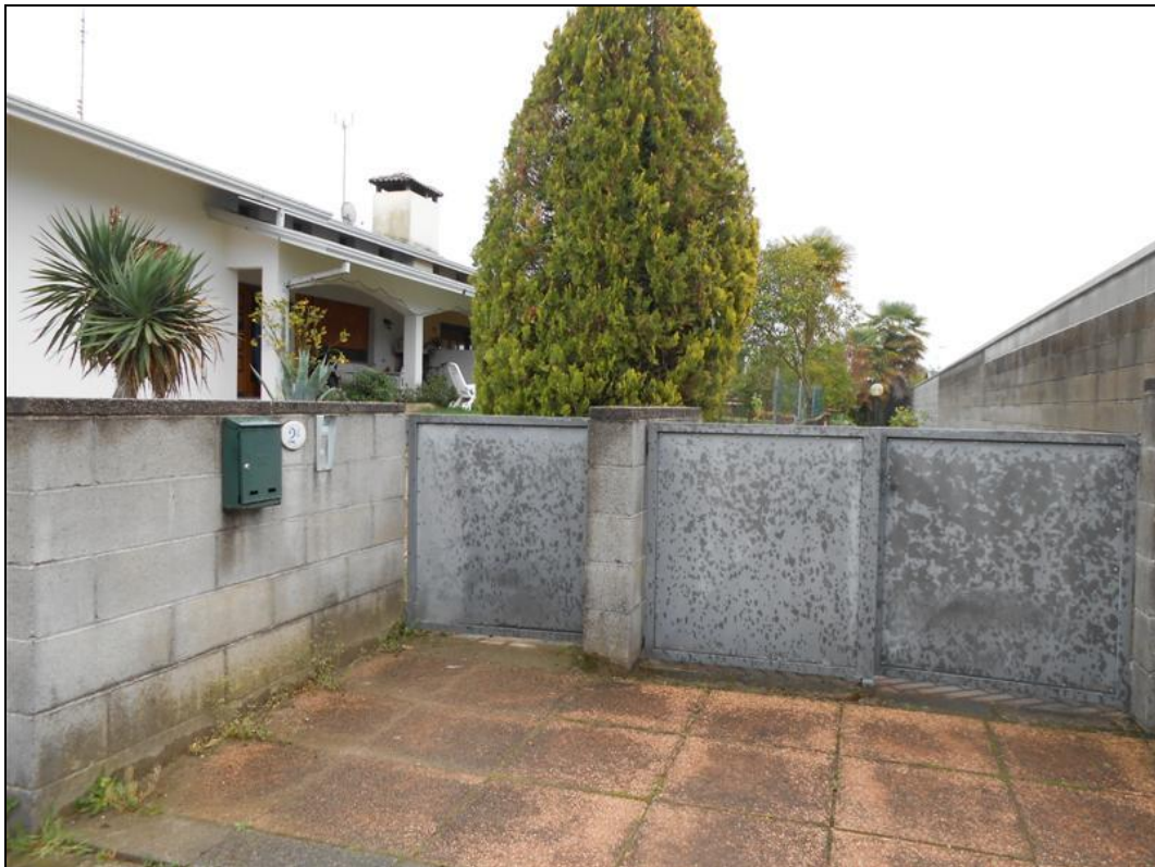
30) Particolare del cancello di ingresso pedonale da via Monte Canin