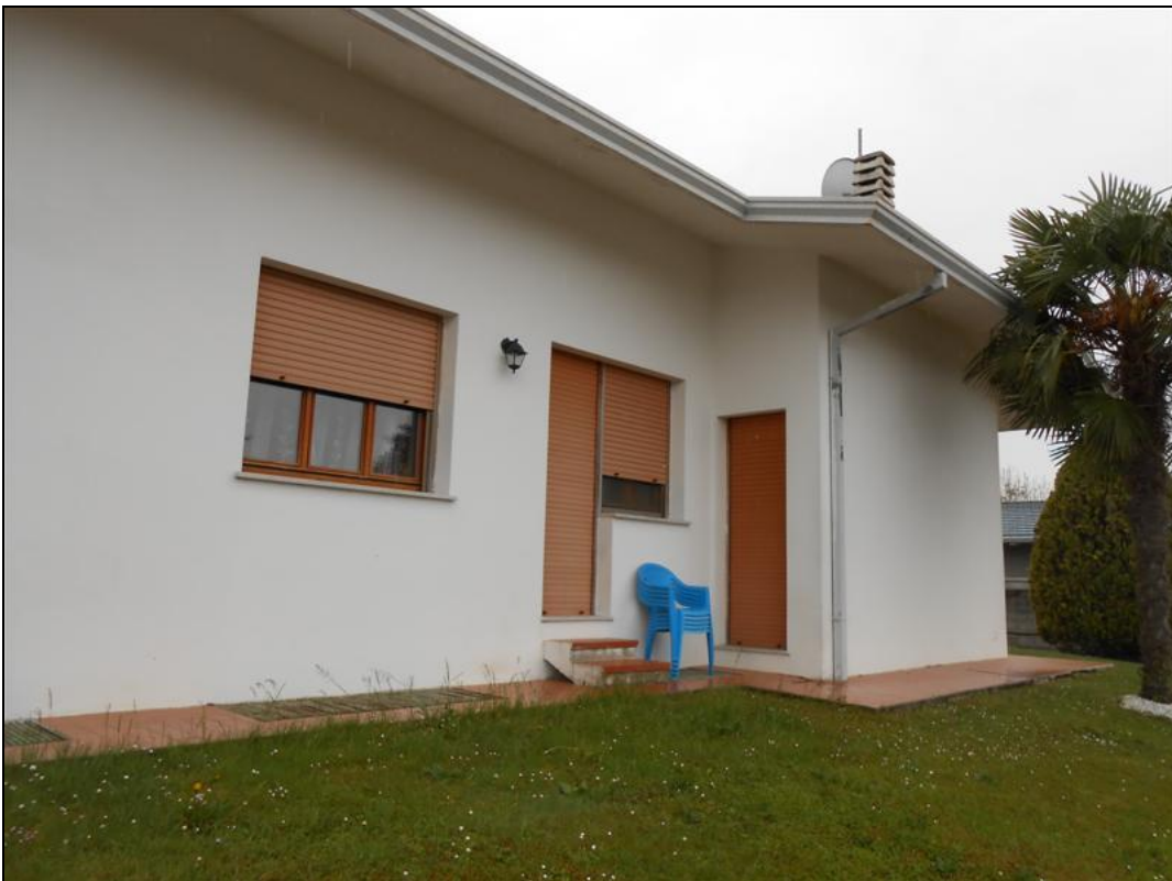
24) Particolare del fronte nord