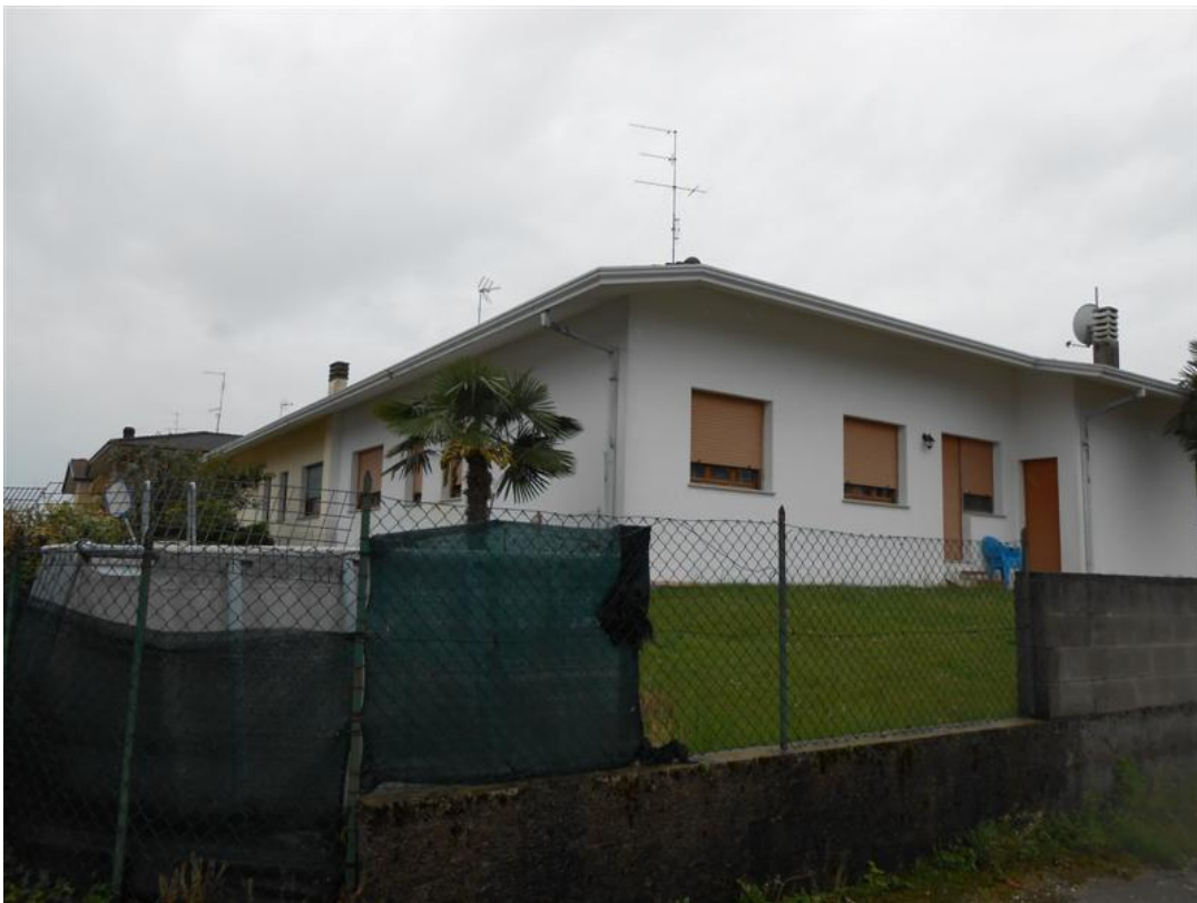
34) Veduta dalla strada nell'angolo tra via Monte Canin e la traversa