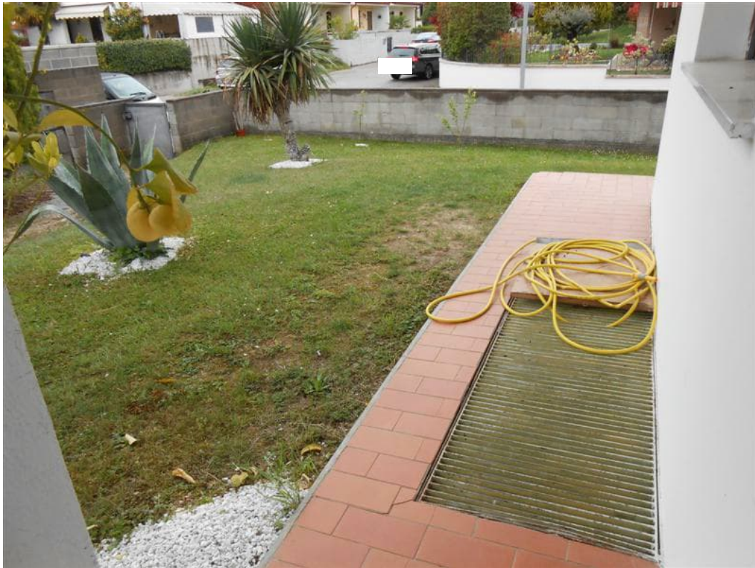
17) Particolare esterno