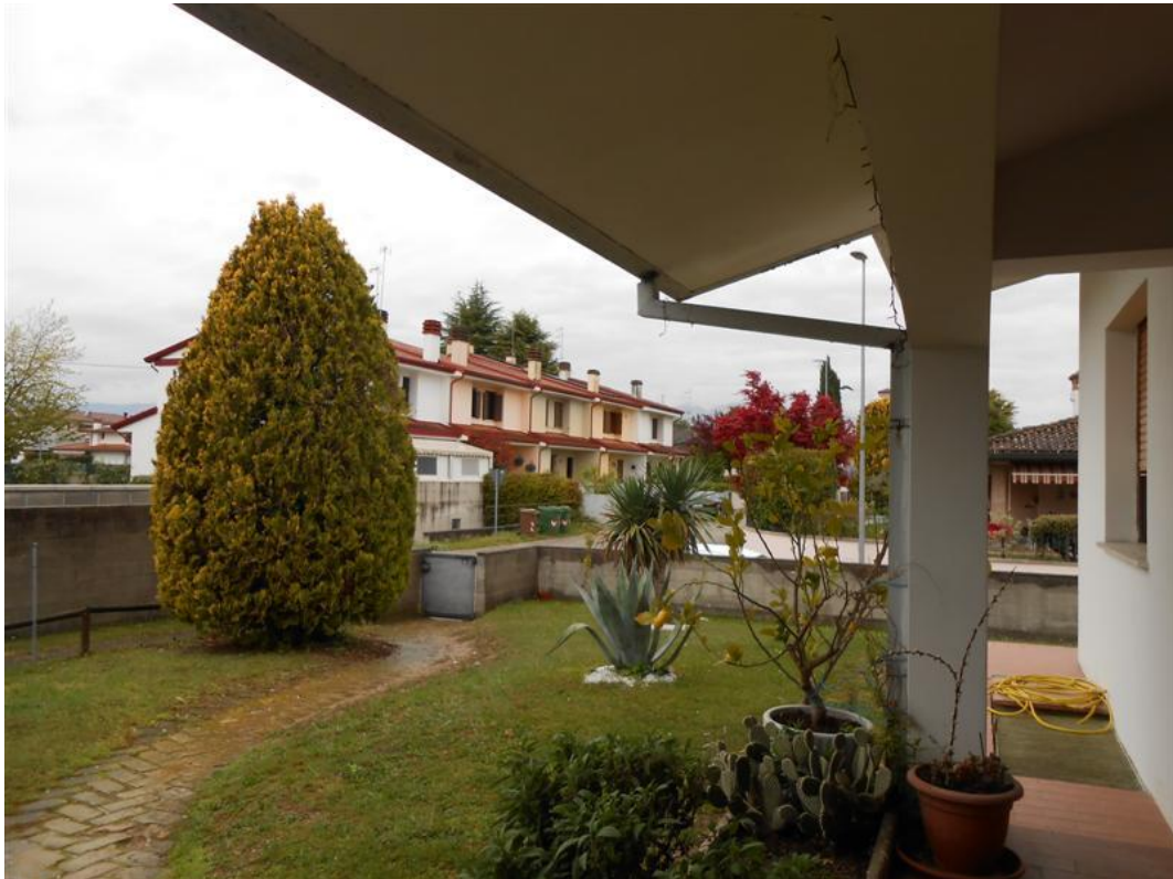
15) Veduta dello scoperto dal portico