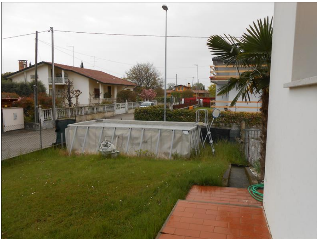
28) Particolare esterno