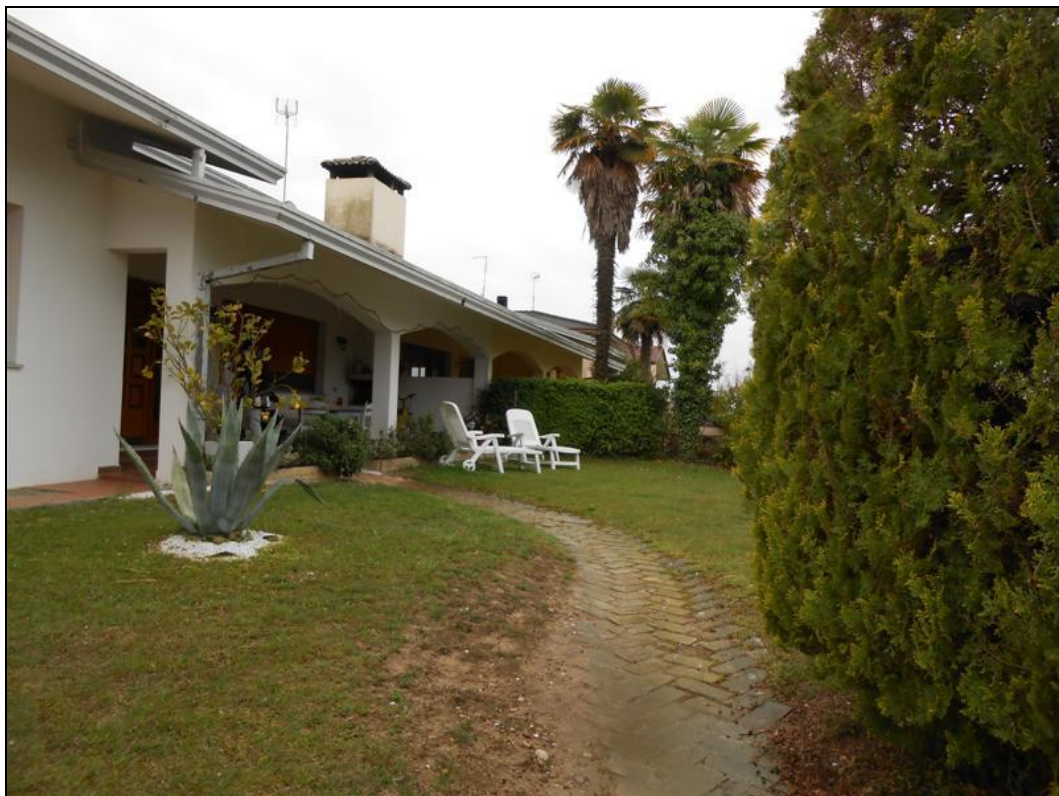
6) Vialetto afferente al portico e veduta dello scoperto esclusivo