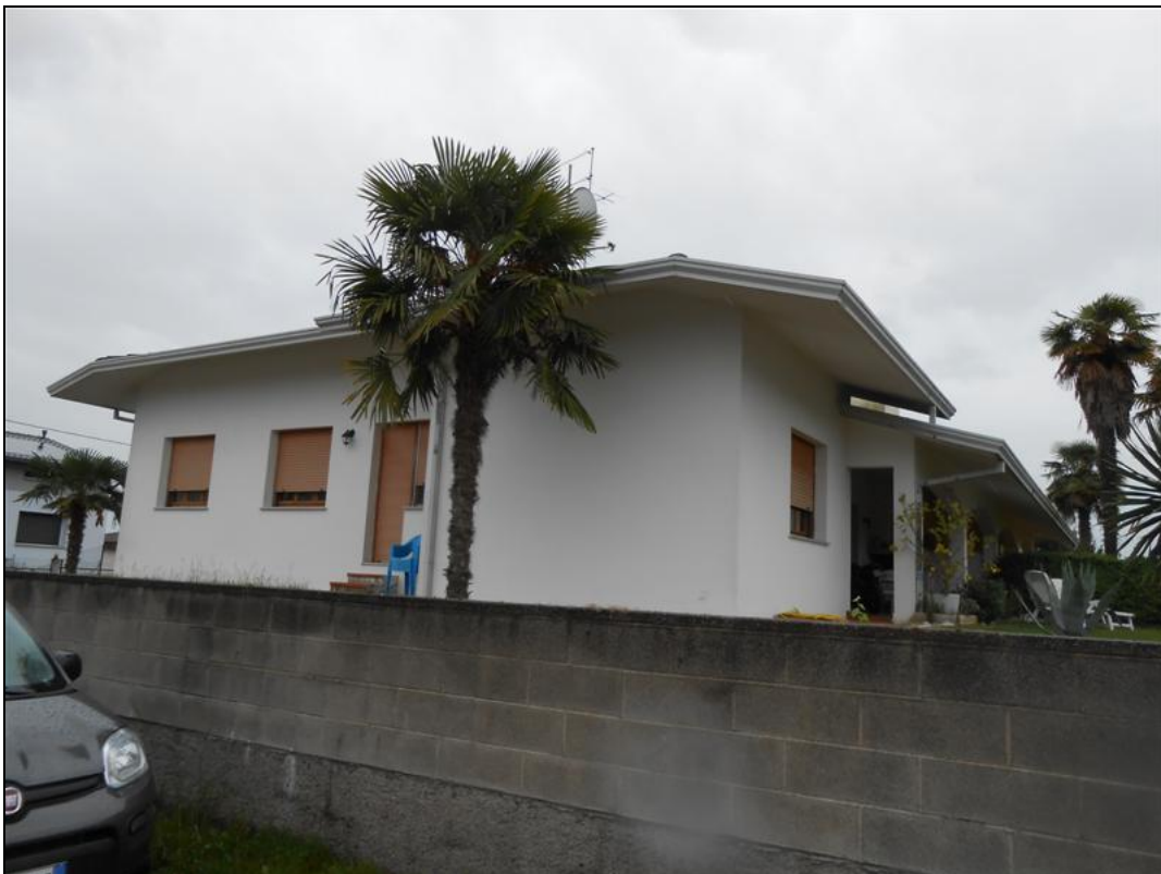
32) Veduta dalla strada via Monte Canin