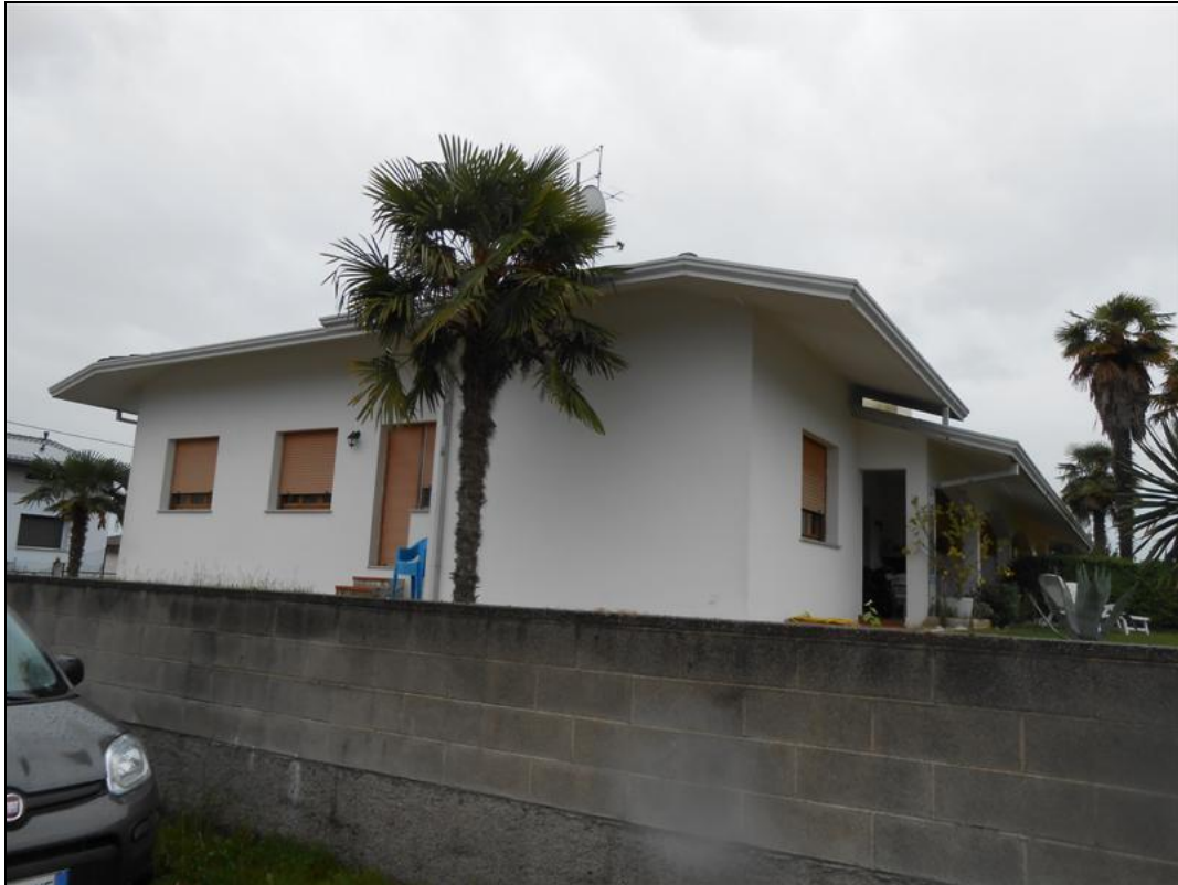
3) Veduta dalla strada via Monte Canin