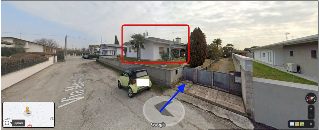
1) Ingresso pedonale da via Monte Canin n. 2/1 e veduta d'insieme del fabbricato