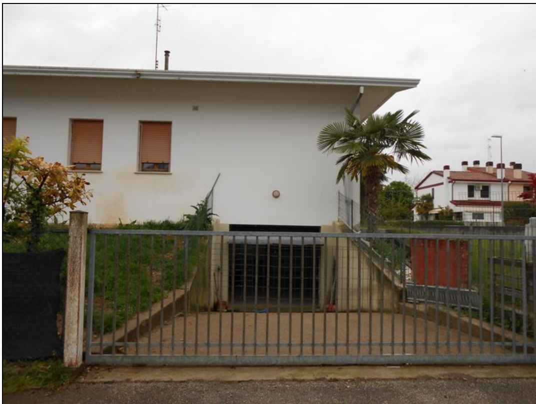
36) Ingresso carrabile e rampa di accesso al garage al piano seminterrato