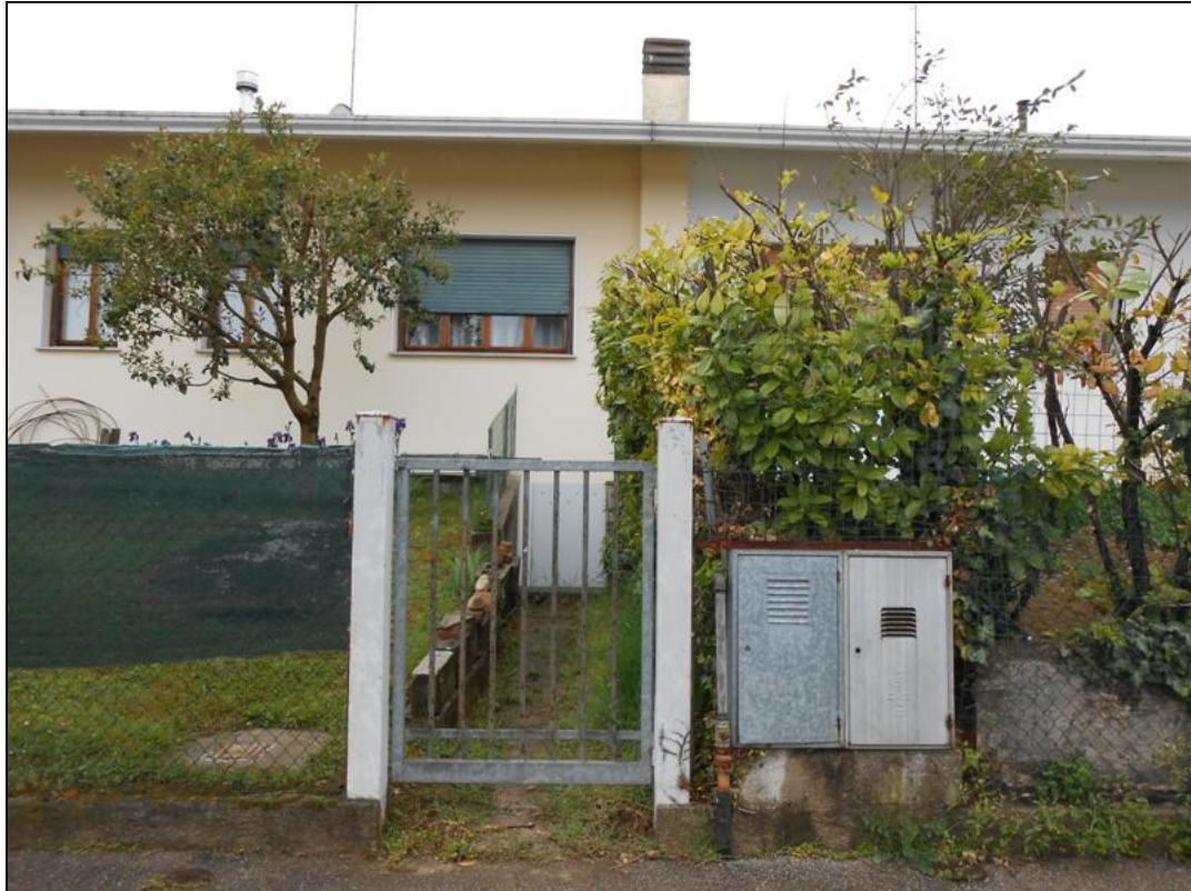
39) Cannelletto di ingresso al locale centrale termica comune del fabbricato