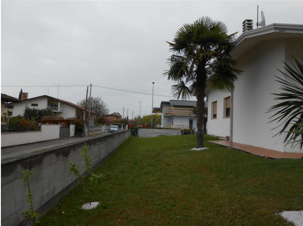
21) Scoperto lato nord