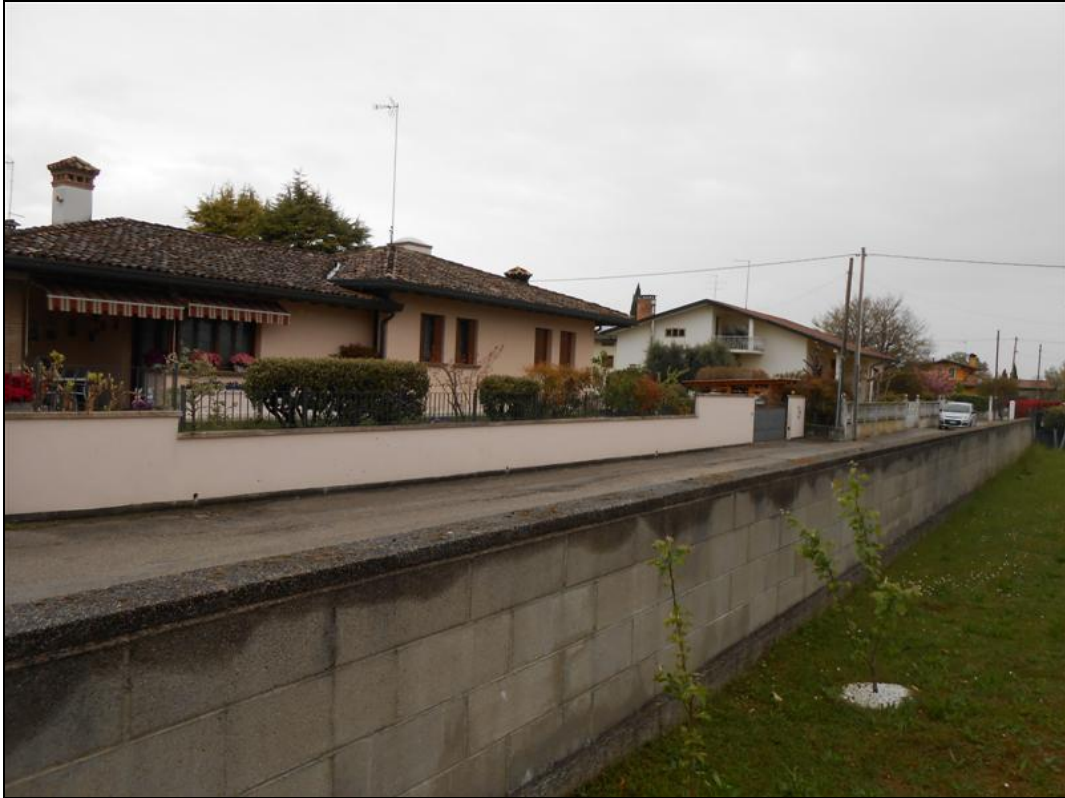
23) Recinzione sulla strada