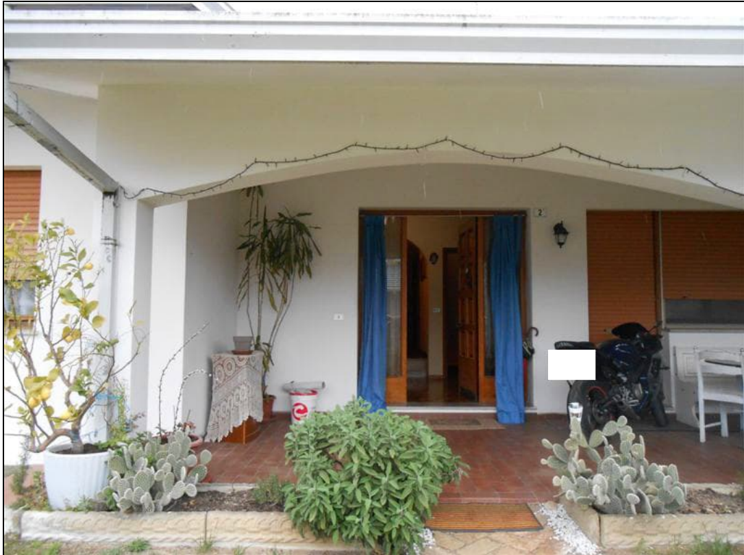
13) Ingresso all'abitazione al piano terra