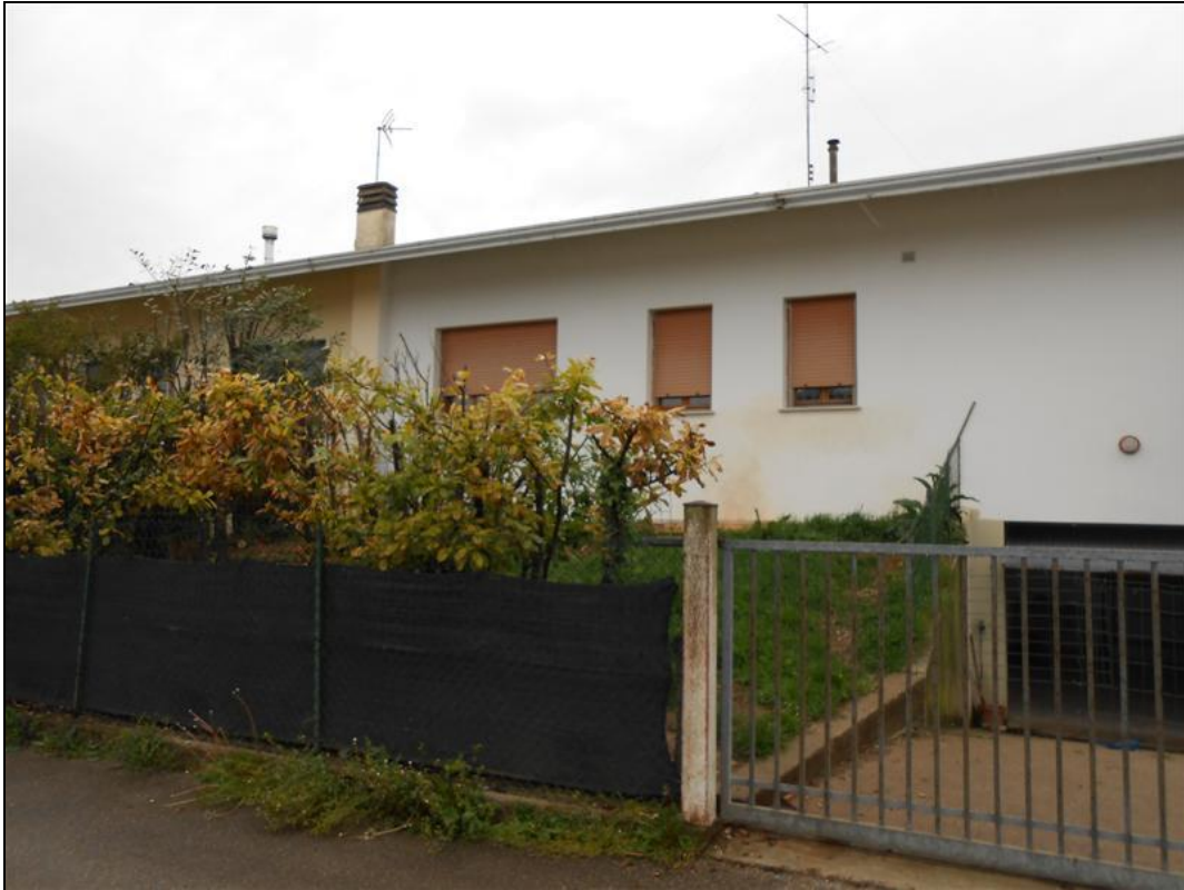
37) Cannello di ingresso carrabile