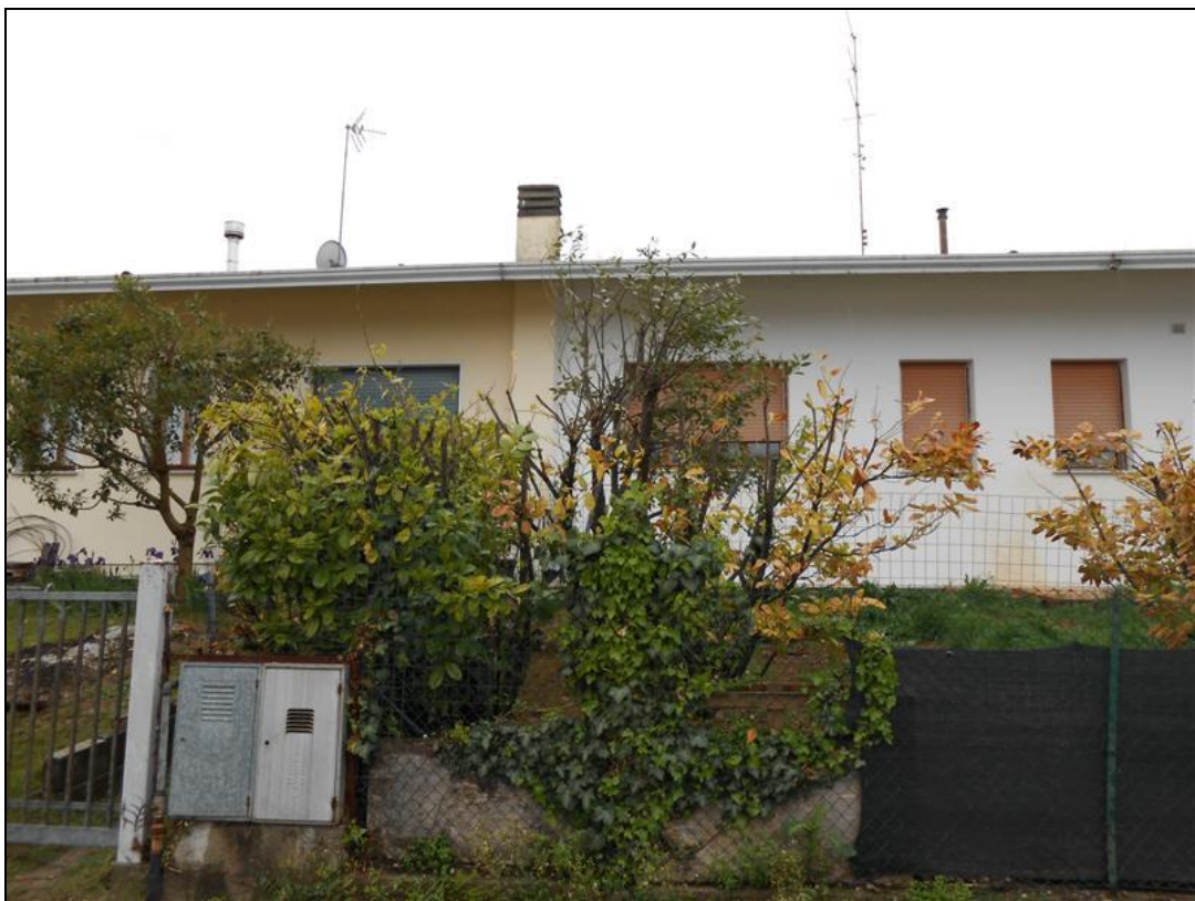
38) Veduta del fronte est dalla traversa di via Monte Canin