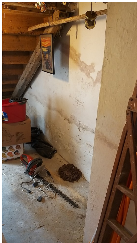
Foto n° 94 – Lotto 2 - Comune di Azzano Decimo (PN) – Foglio 22, m.le 12 – Piano terra. Particolare del vano uso deposito di cui alla foto precedente, visto dalla cantina.