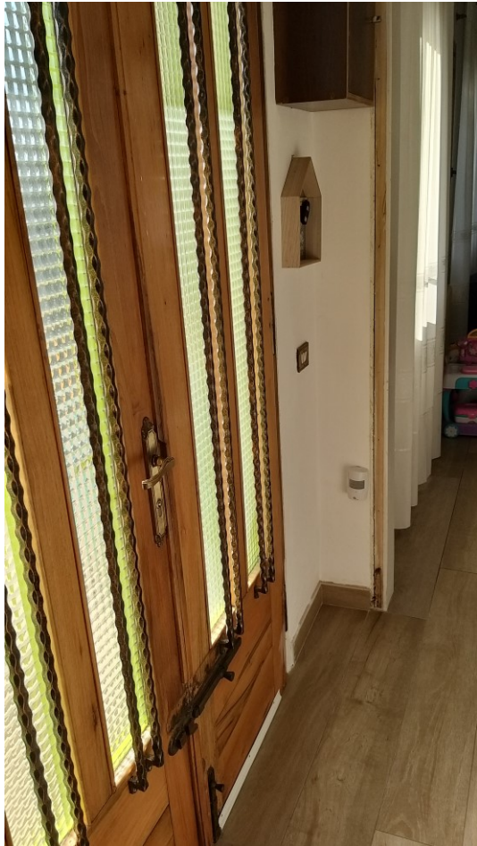
Foto n°86 - Lotto 2 - Comune di Azzano Decimo (PN) - Foglio 22, m.le 12 - Piano terra. Veduta, dall'interno, dell'ingresso alla porzione di fabbricato adibita ad abitazione.