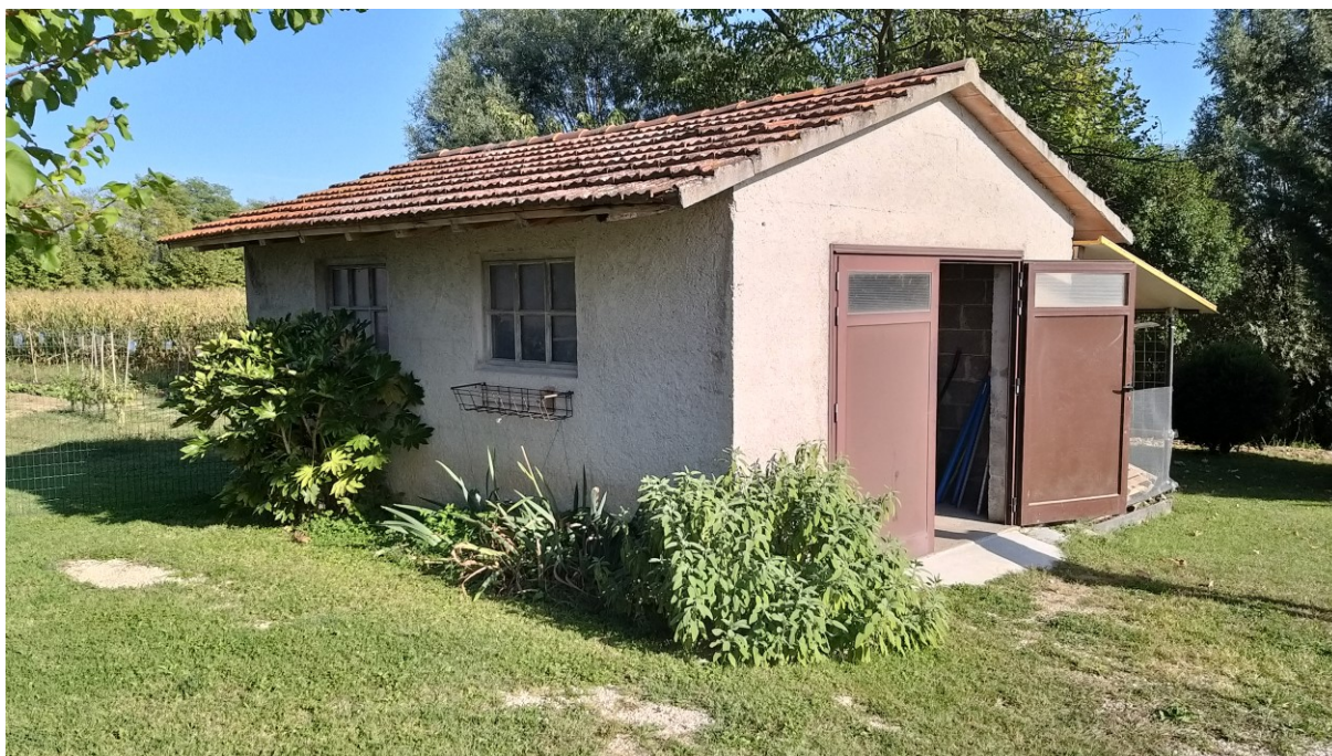
Foto n° 82 – Lotto 2 - Comune di Azzano Decimo (PN) – Foglio 22, m.le 12 – Veduta del fabbricato indipendente uso deposito posto a sud-est, a breve distanza dall'abitazione principale.