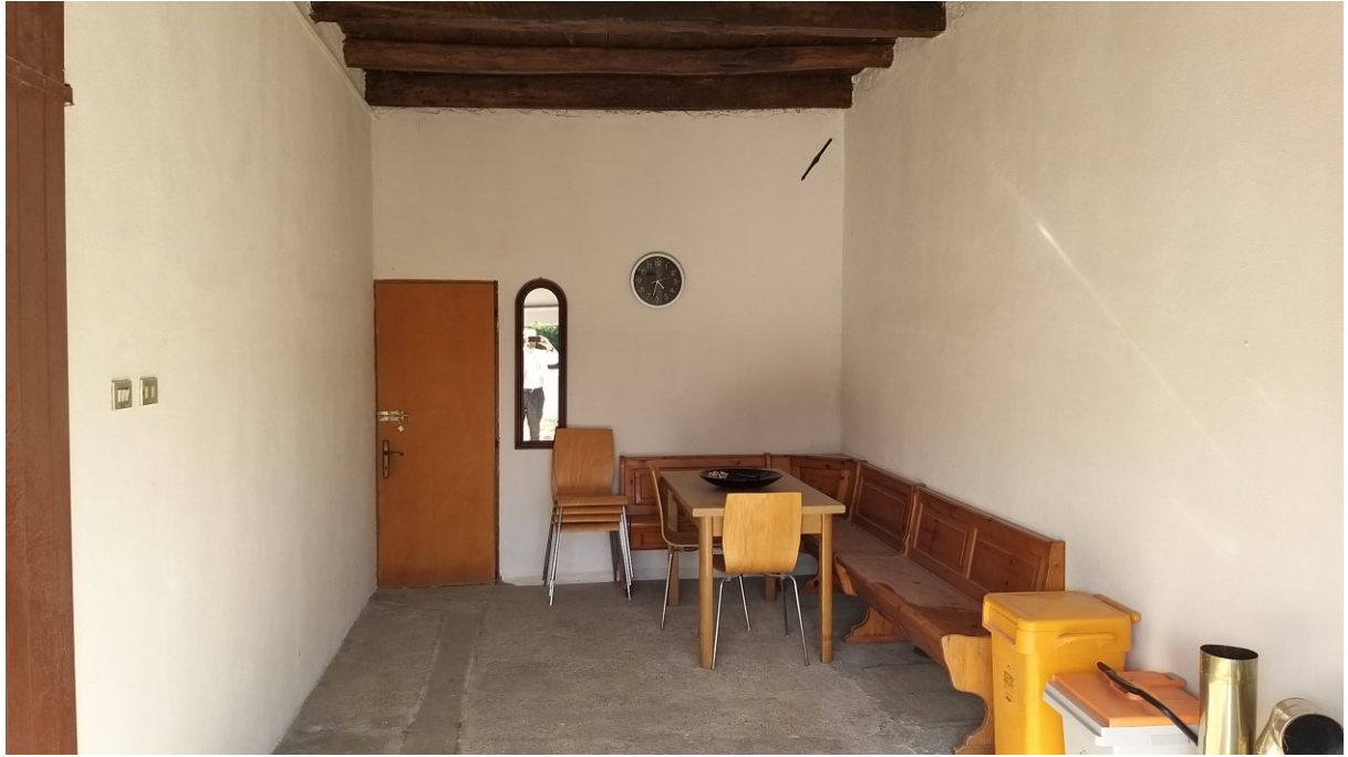
Foto n° 67 – Lotto 2 - Comune di Azzano Decimo (PN) – Foglio 22, m.le 12 – Veduta, da posizione sud-ovest, del vano originariamente adibito a deposito, aperto verso il cortile. A sinistra si intravede la porta di accesso al deposito interno (ex stalla), mentre dalla porta visibile in fondo si accede al vano interno uso pollaio.