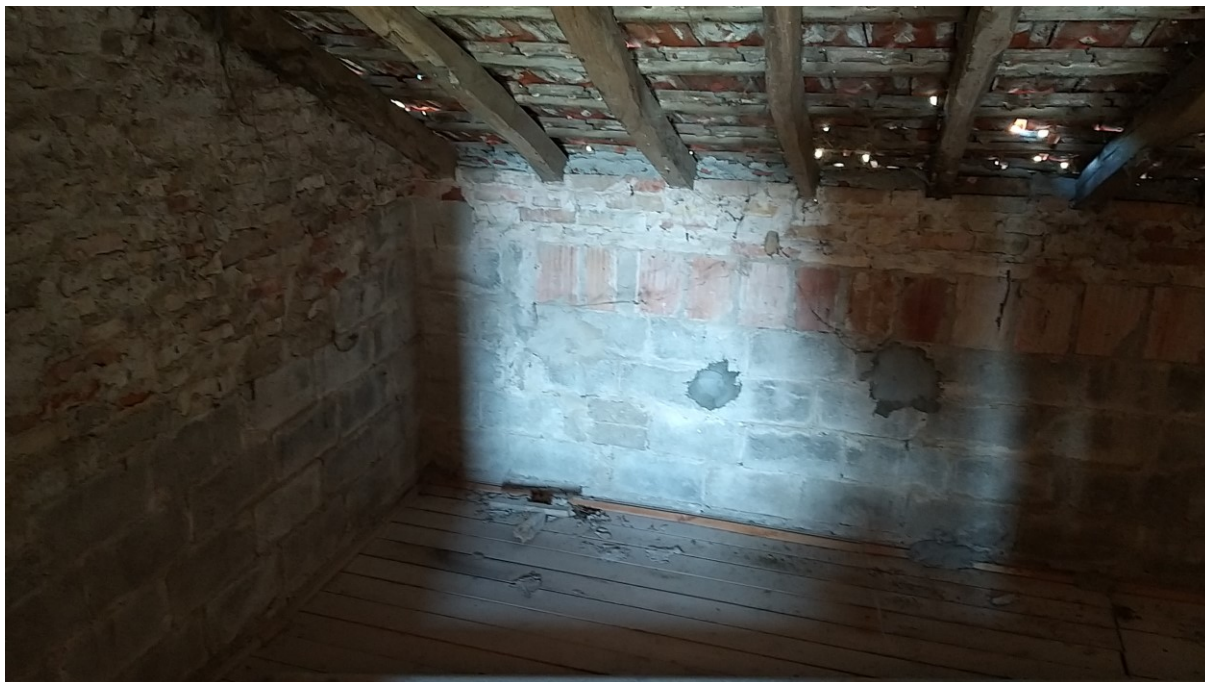
Foto n° 75 – Lotto 2 - Comune di Azzano Decimo (PN) – Foglio 22, m.le 12 – Veduta interna del secondo deposito al primo piano dell'edificio; a questo vano si accede direttamente dal deposito ex fienile di cui alle precedenti foto.