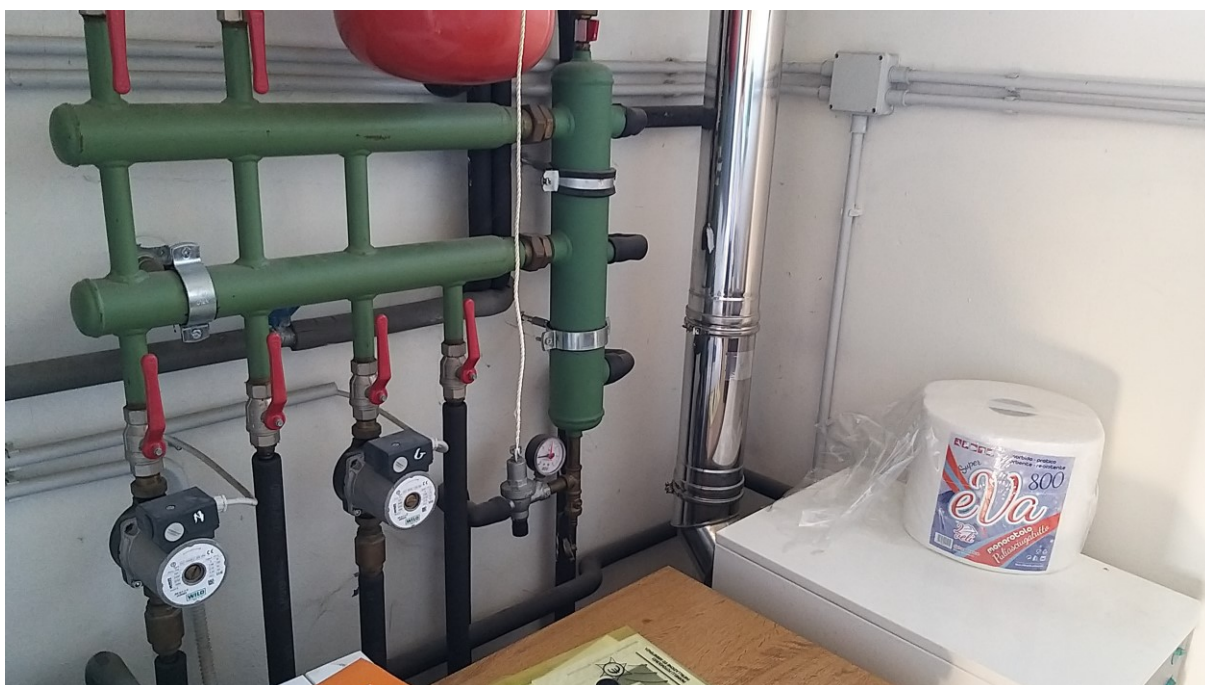
Foto n° 116 - Lotto 2 - Comune di Azzano Decimo (PN) - Foglio 22, m.le 12 - Particolare delle tubazioni presenti nella centrale termica.