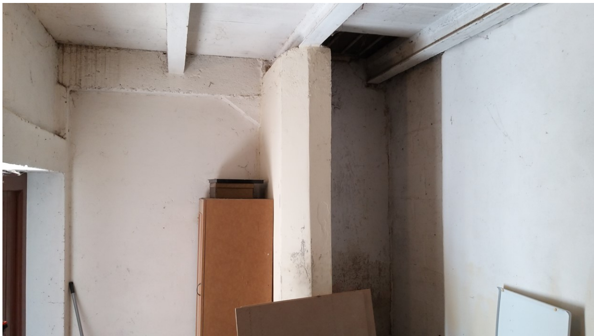
Foto n° 69 – Lotto 2 - Comune di Azzano Decimo (PN) – Foglio 22, m.le 12 – Veduta interna di porzione sud-ovest del deposito interno (ex stalla); a sinistra l'accesso dal deposito aperto di cui alla foto precedente.