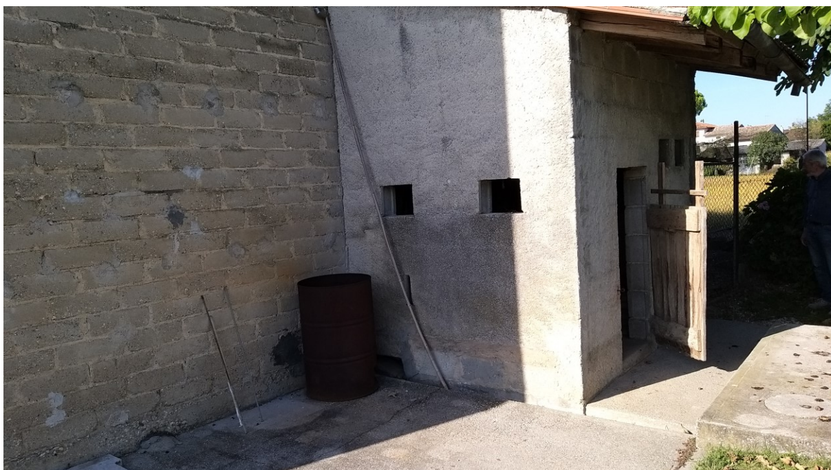
Foto n° 78 - Lotto 2 - Comune di Azzano Decimo (PN) - Foglio 22, m.le 12 - Veduta del deposito materiali ed attrezzi (ex porcile), con unico accesso esterno indipendente.