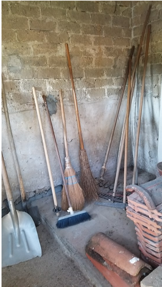
Foto n° 79 – Lotto 2 - Comune di Azzano Decimo (PN) – Foglio 22, m.le 12. Particolare interno della porzione est del deposito ex porcile.