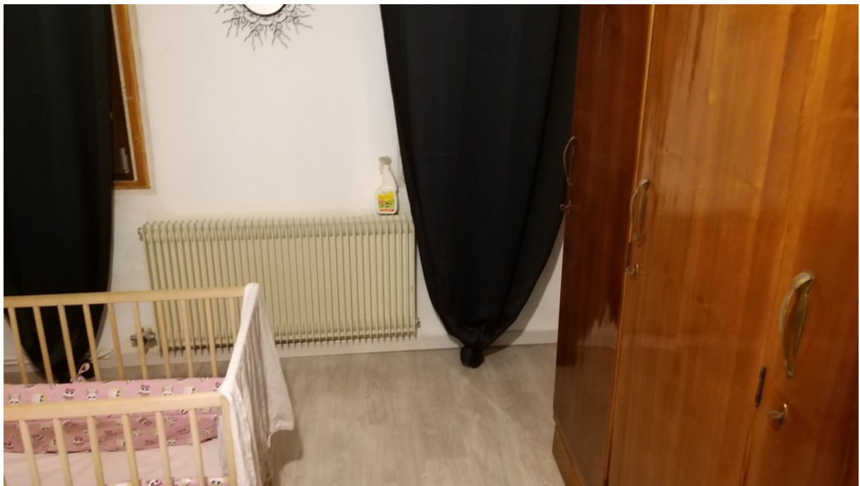
Foto n° 108 – Lotto 2 - Comune di Azzano Decimo (PN) – Foglio 22, m.le 12 – Primo piano. Particolare di porzione sud-est della stessa camera.