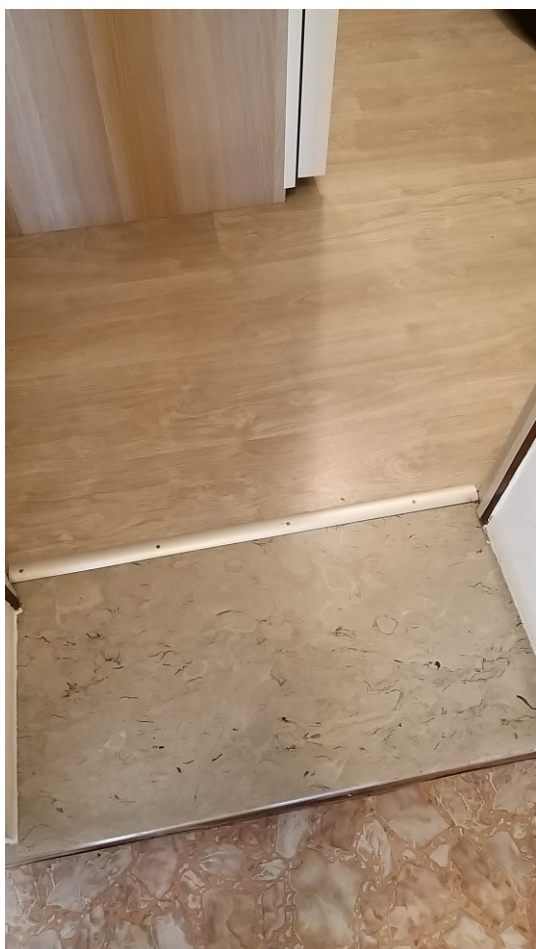
Foto n° 98 - Lotto 2 - Comune di Azzano Decimo (PN) - Foglio 22, m.le 12 - Particolare, visto dal pianerottolo delle scale, dell'ingresso all'ante-bagno posto al piano intermedio.