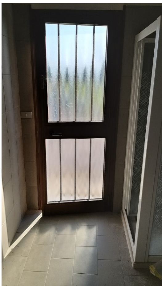
Foto n° 113 - Lotto 2 - Comune di Azzano Decimo (PN) - Foglio 22, m.le 12 - Ritornati al piano terra, veduta interna del vano bagno-WC adiacente alla centrale termica; in fondo la porta d'accesso indipendente dal cortile.