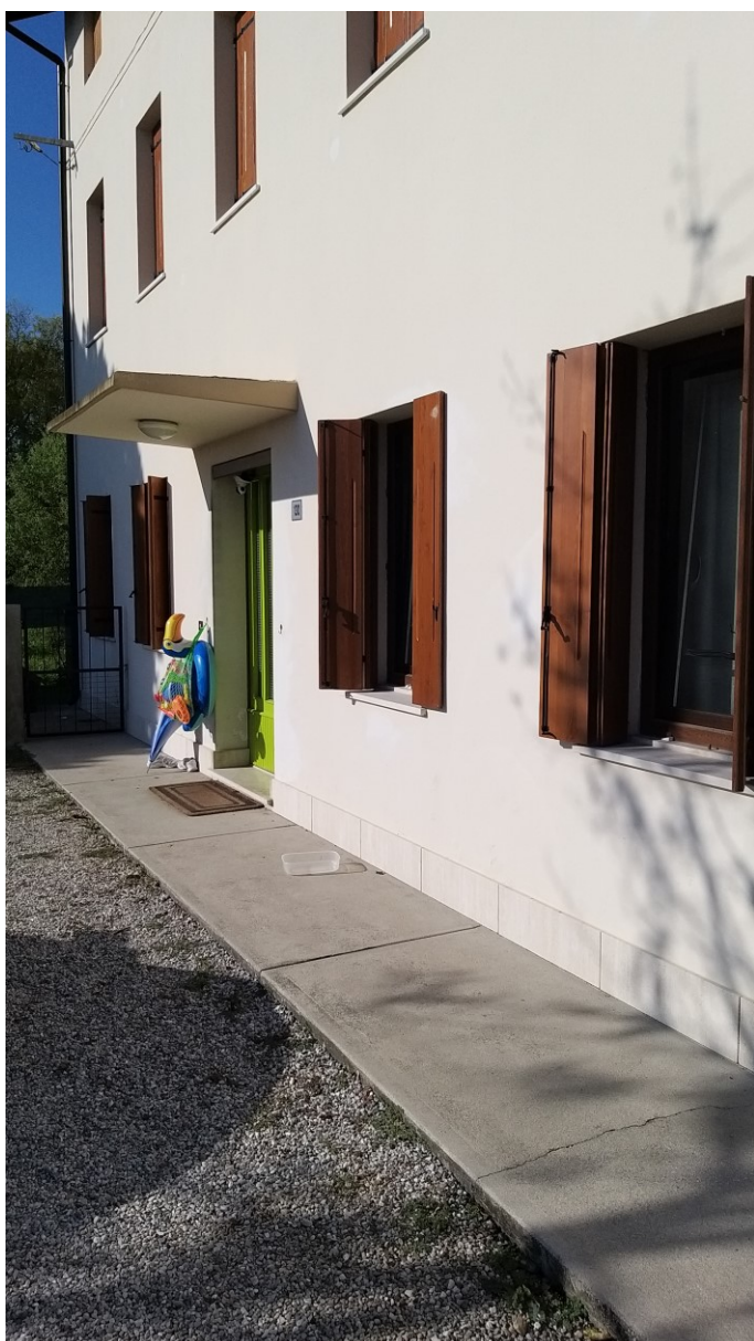
Foto n° 66 – Lotto 2 - Comune di Azzano Decimo (PN) – Foglio 22, m.le 12. Veduta dell'ingresso principale al fabbricato pignorato, nella parte destinata ad abitazione.