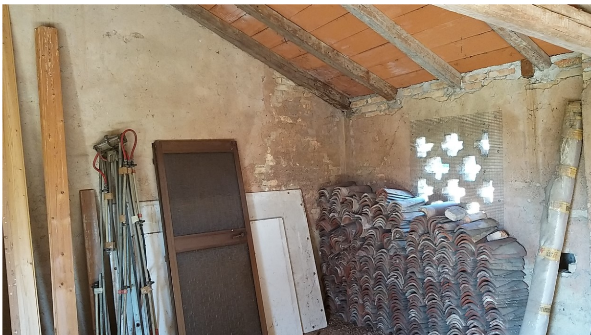
Foto n° 74 – Lotto 2 - Comune di Azzano Decimo (PN) – Foglio 22, m.le 12 – Veduta dello stesso vano da posizione opposta rispetto alla foto precedente.