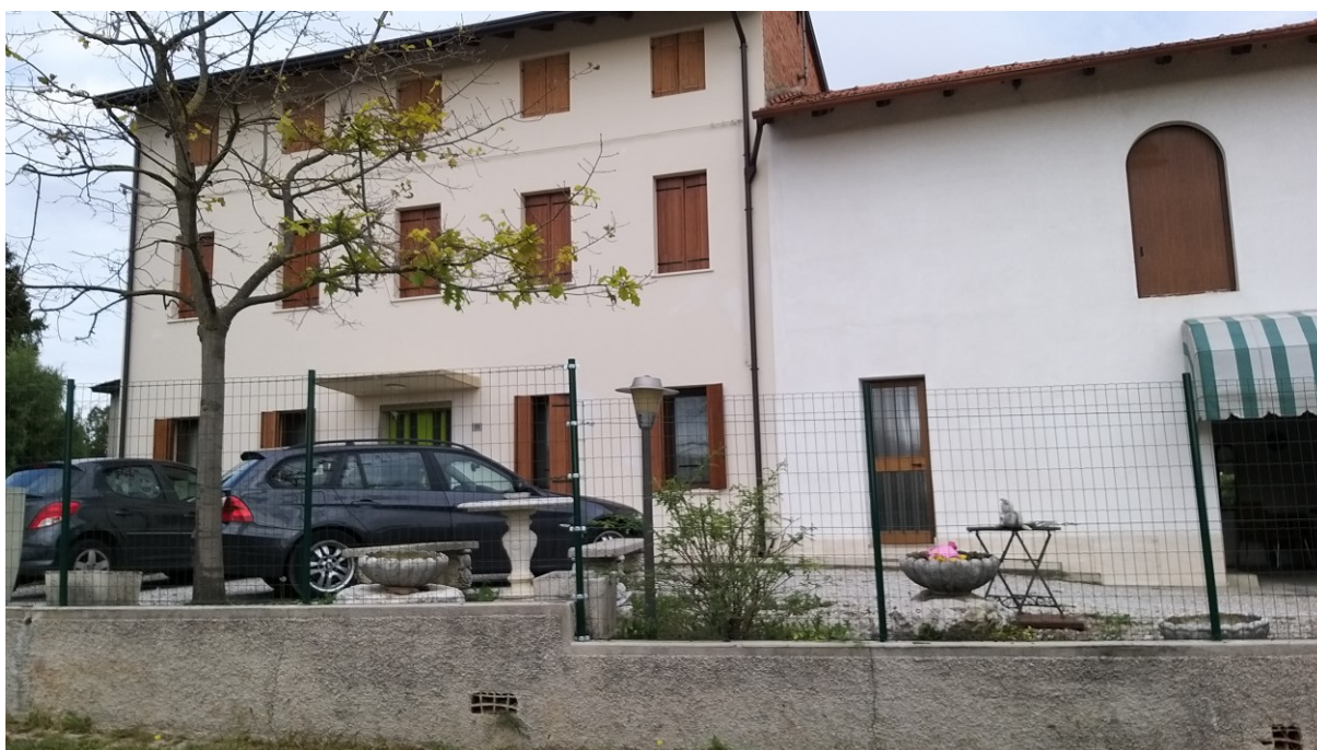
Foto n° 64 – Lotto 2 - Comune di Azzano Decimo (PN) – Foglio 22, m.le 12 – Veduta, da posizione sud-ovest, della parte di fabbricato adibita ad abitazione (a sinistra), con l'ingresso principale (porta sotto pensilina) e di una porzione degli annessi rustici (sulla destra). La porta in alluminio e vetro visibile al centro costituisce ingresso indipendente ai locali WC e centrale termica.