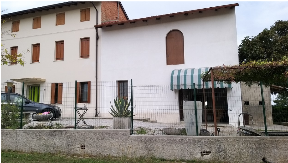
Foto n° 65 – Lotto 2 - Comune di Azzano Decimo (PN) – Foglio 22, m.le 12 – Particolare della porzione di fabbricato con gli annessi rustici di cui alla foto precedente.