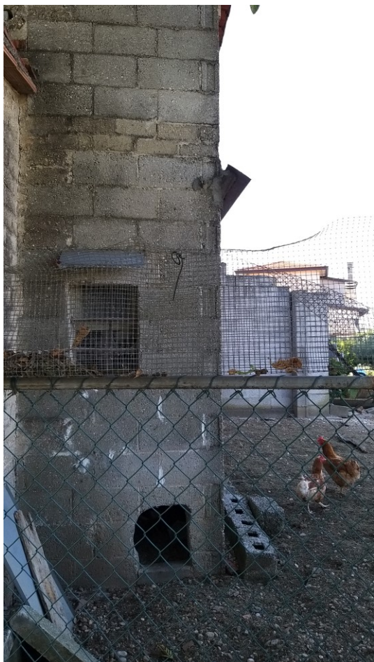
Foto n° 81 – Lotto 2 - Comune di Azzano Decimo (PN) – Foglio 22, m.le 12. Veduta, da posizione sud-est, dell'area esterna al pollaio; in fondo a destra si nota il muro che sosteneva la tettoia, ora non più presente.