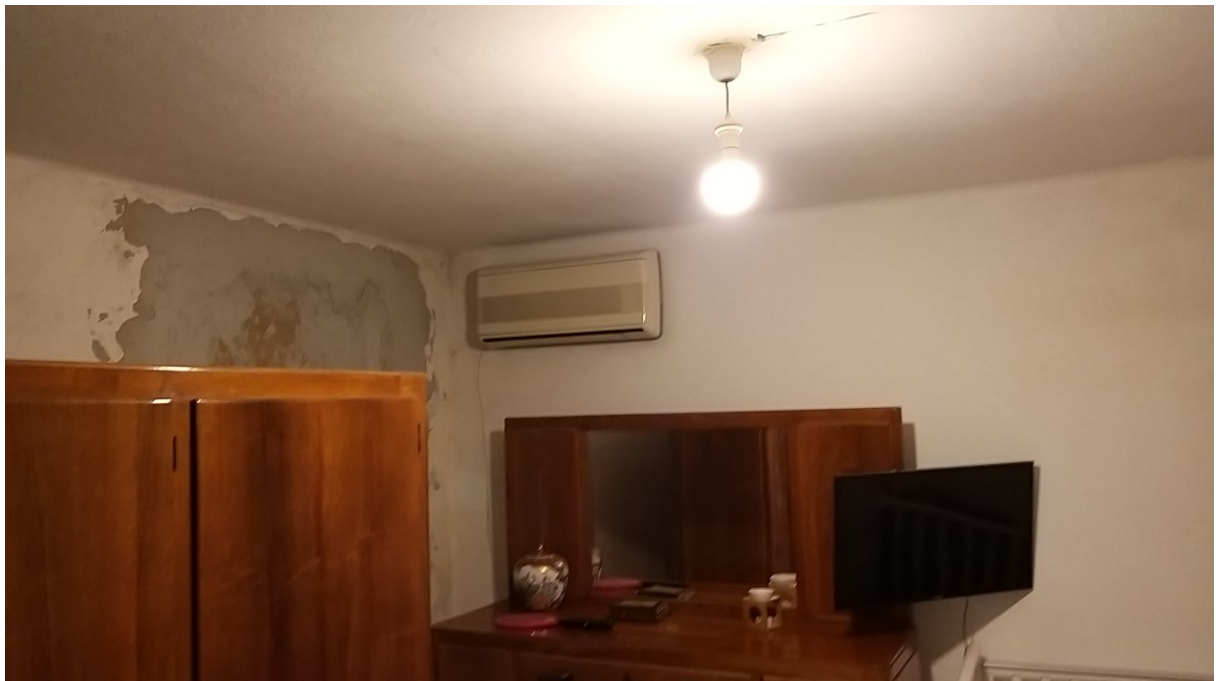
Foto n° 107 – Lotto 2 - Comune di Azzano Decimo (PN) – Foglio 22, m.le 12 – Primo piano. Veduta di porzione nord-ovest della seconda camera, posta a destra rispetto alle scale. Evidenti, sul muro, i segni di chiusura della finestra indicata in planimetria depositata.