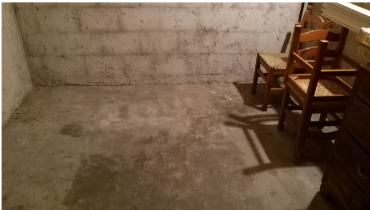
Foto n° 111 – Lotto 2 - Comune di Azzano Decimo (PN) – Foglio 22, m.le 12 – Particolare degli intonaci e della pavimentazione al grezzo nel primo vano uso soffitta.