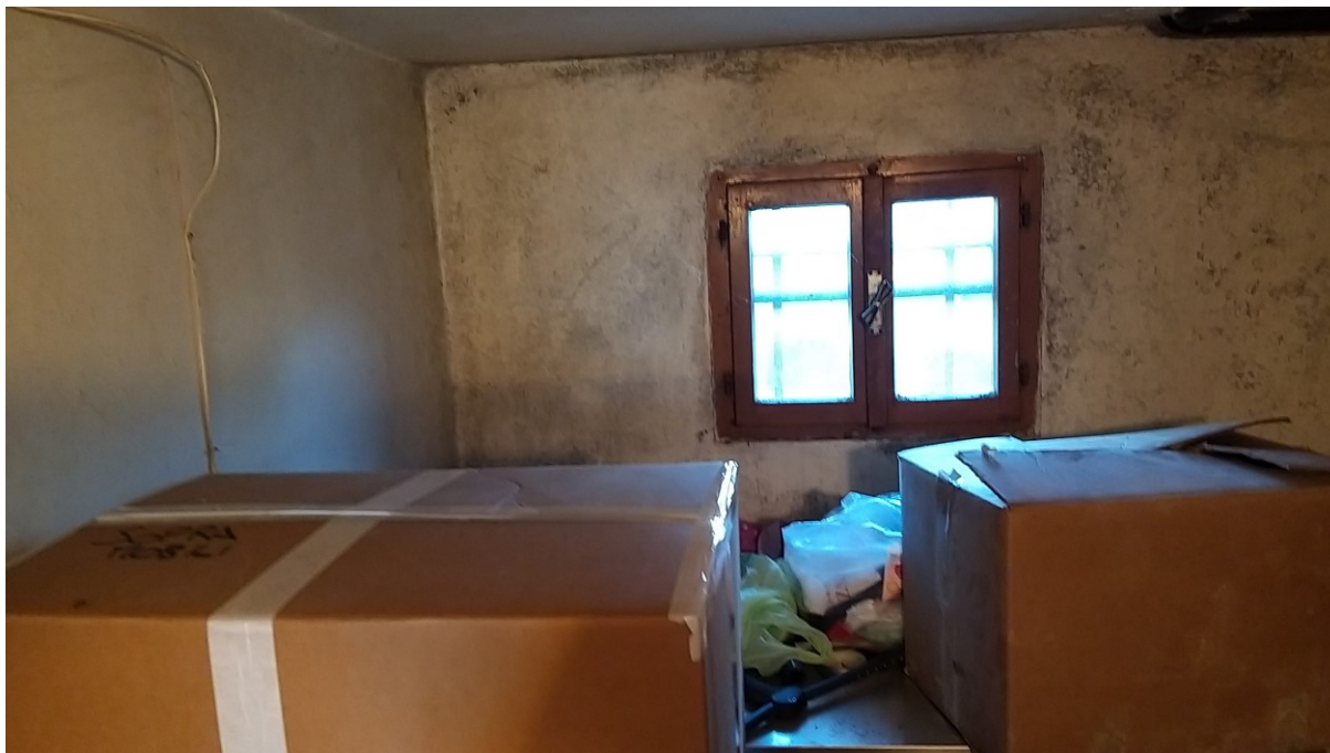
Foto n° 95 – Lotto 2 - Comune di Azzano Decimo (PN) – Foglio 22, m.le 12 – Piano terra. Veduta, da posizione sud, di parte del vano ad uso cantina.