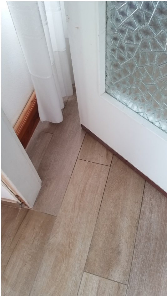
Foto n° 89 - Lotto 2 - Comune di Azzano Decimo (PN) - Foglio 22, m.le 12 - Piano terra. Ritornati nell'atrio d'ingresso, si accede al vano cucina-pranzo, posto a sinistra dell'atrio stesso; particolare della porta di accesso.