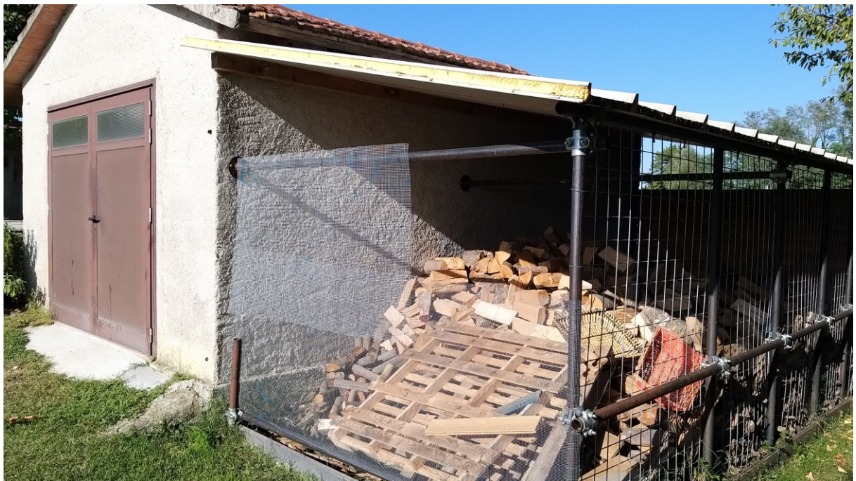
Foto n° 85 – Lotto 2 - Comune di Azzano Decimo (PN) – Foglio 22, m.le 12 – Veduta, da posizione sud-est, della tettoia adibita a deposito di legna da ardere.