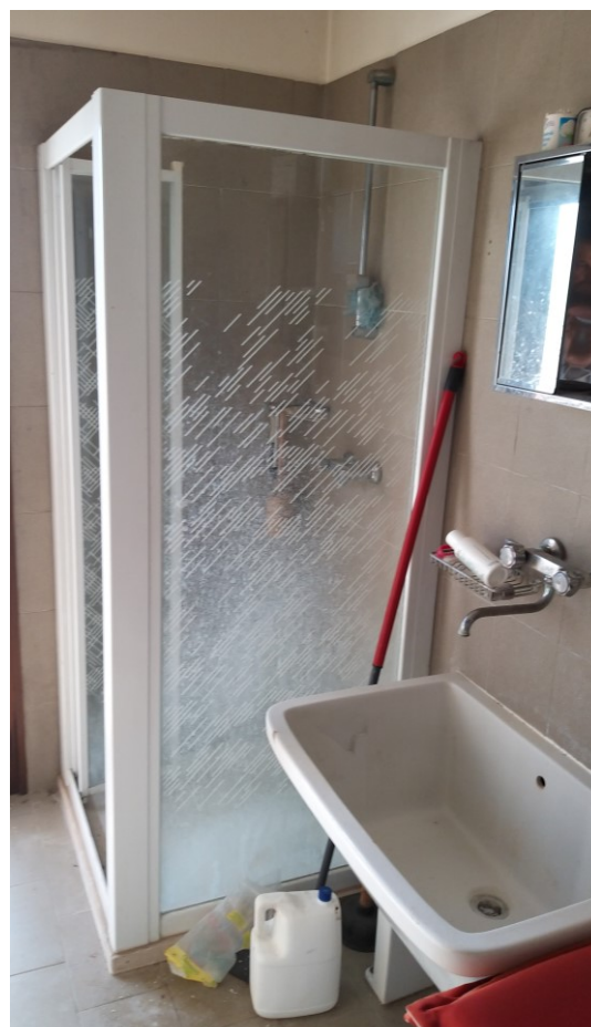
Foto n° 114 - Lotto 2 - Comune di Azzano Decimo (PN) - Foglio 22, m.le 12 - Particolare del box doccia e del lavatoio, nel vano di cui alla foto precedente.