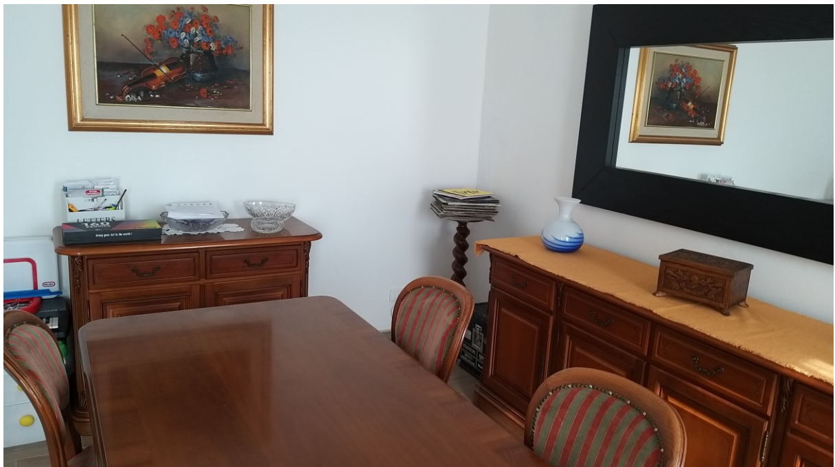
Foto n° 87 - Lotto 2 - Comune di Azzano Decimo (PN) - Foglio 22, m.le 12 - Piano terra. Veduta di porzione nord-est del vano ad uso soggiorno, posto a destra rispetto all'ingresso di cui alla foto precedente.