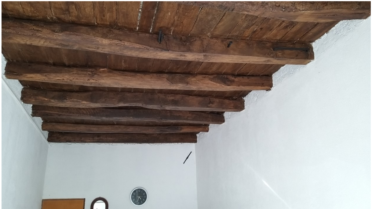
Foto n° 68 – Lotto 2 - Comune di Azzano Decimo (PN) – Foglio 22, m.le 12 – Nello stesso vano particolare del soffitto, con travi e assi in legno massiccio a vista.