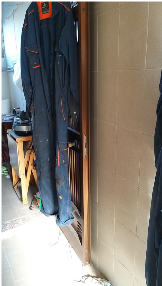
Foto n° 115 - Lotto 2 - Comune di Azzano Decimo (PN) - Foglio 22, m.le 12 - Veduta, dal vano uso bagno-WC, della porta di accesso al locale centrale termica adiacente.