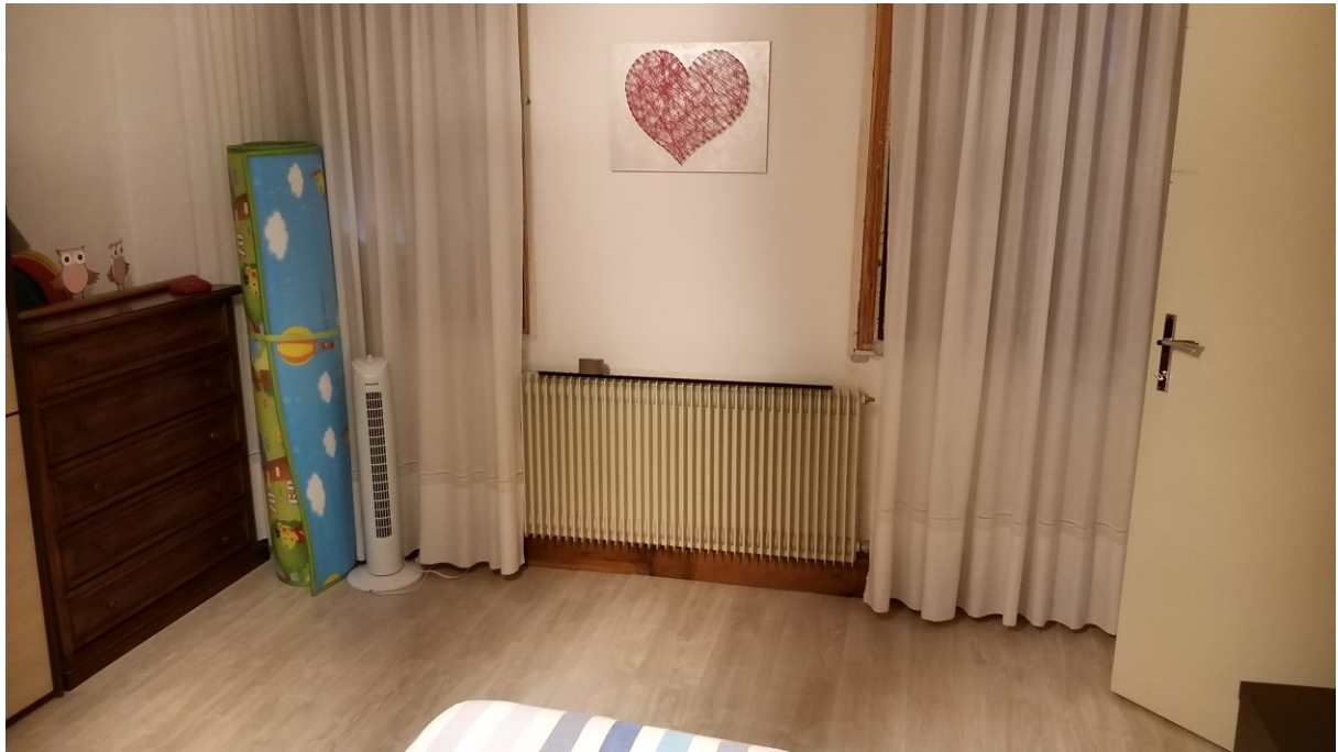
Foto n° 106 – Lotto 2 - Comune di Azzano Decimo (PN) – Foglio 22, m.le 12 – Veduta della parte esposta sud-ovest della camera di cui alla foto precedente.