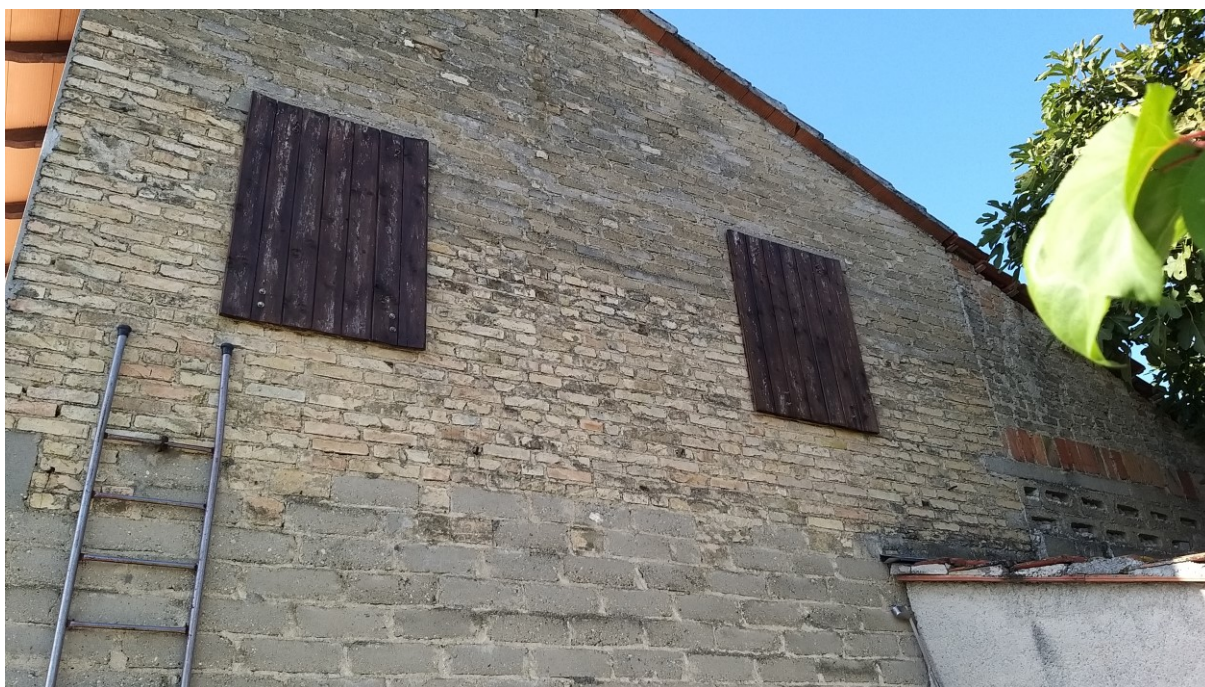
Foto n° 76 – Lotto 2 - Comune di Azzano Decimo (PN) – Foglio 22, m.le 12 – Veduta esterna del primo piano in zona sud-est, corrispondente all'interno ai locali ex fienile e deposito di cui alle foto precedenti.