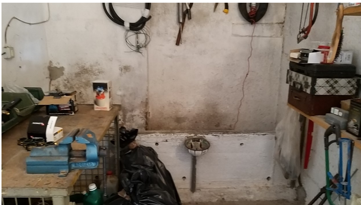
Foto n° 70 – Lotto 2 - Comune di Azzano Decimo (PN) – Foglio 22, m.le 12 – Veduta di porzione opposta dello stesso vano di cui alla foto precedente.