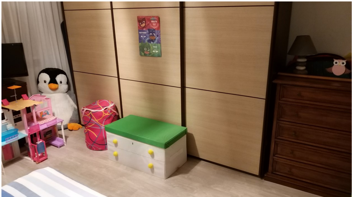
Foto n° 105 - Lotto 2 - Comune di Azzano Decimo (PN) - Foglio 22, m.le 12 - Primo piano. Veduta interna di porzione nord-est della camera di cui alla foto precedente.