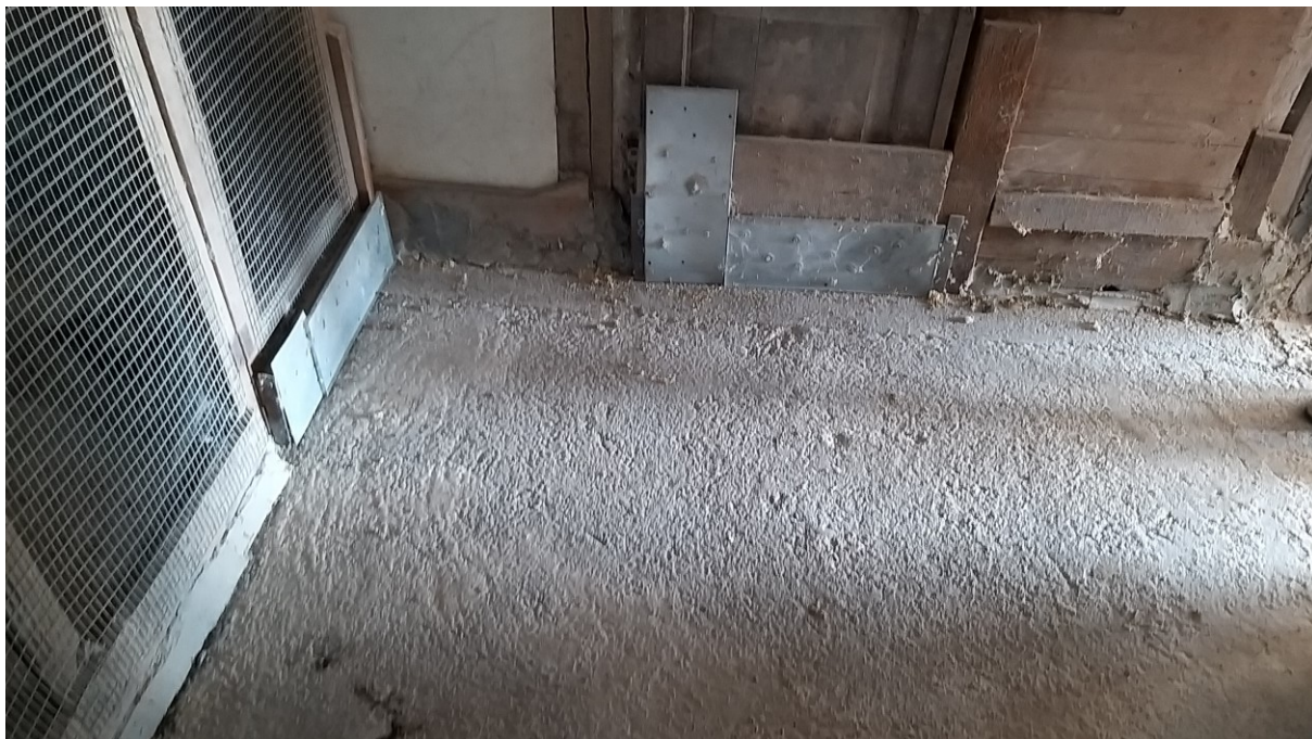
Foto n° 72 – Lotto 2 - Comune di Azzano Decimo (PN) – Foglio 22, m.le 12 – Particolare della pavimentazione al grezzo presente nel pollaio; a destra si intravede l'entrata.