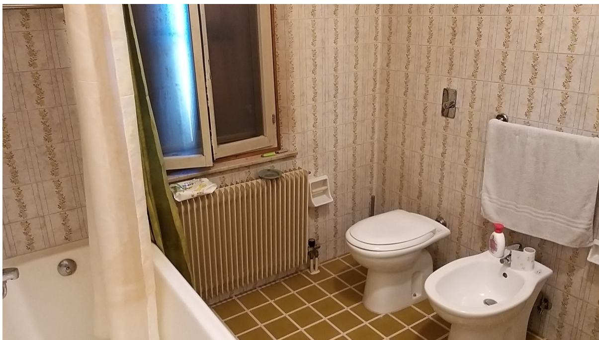
Foto n° 101 – Lotto 2 - Comune di Azzano Decimo (PN) – Foglio 22, m.le 12 – Veduta interna del bagno di cui alle foto precedenti.