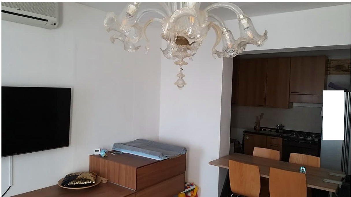
Foto n° 91 – Lotto 2 - Comune di Azzano Decimo (PN) – Foglio 22, m.le 12 – Piano terra. Veduta, da posizione sud-est, di porzione del soggiorno, con la cucina sullo sfondo.