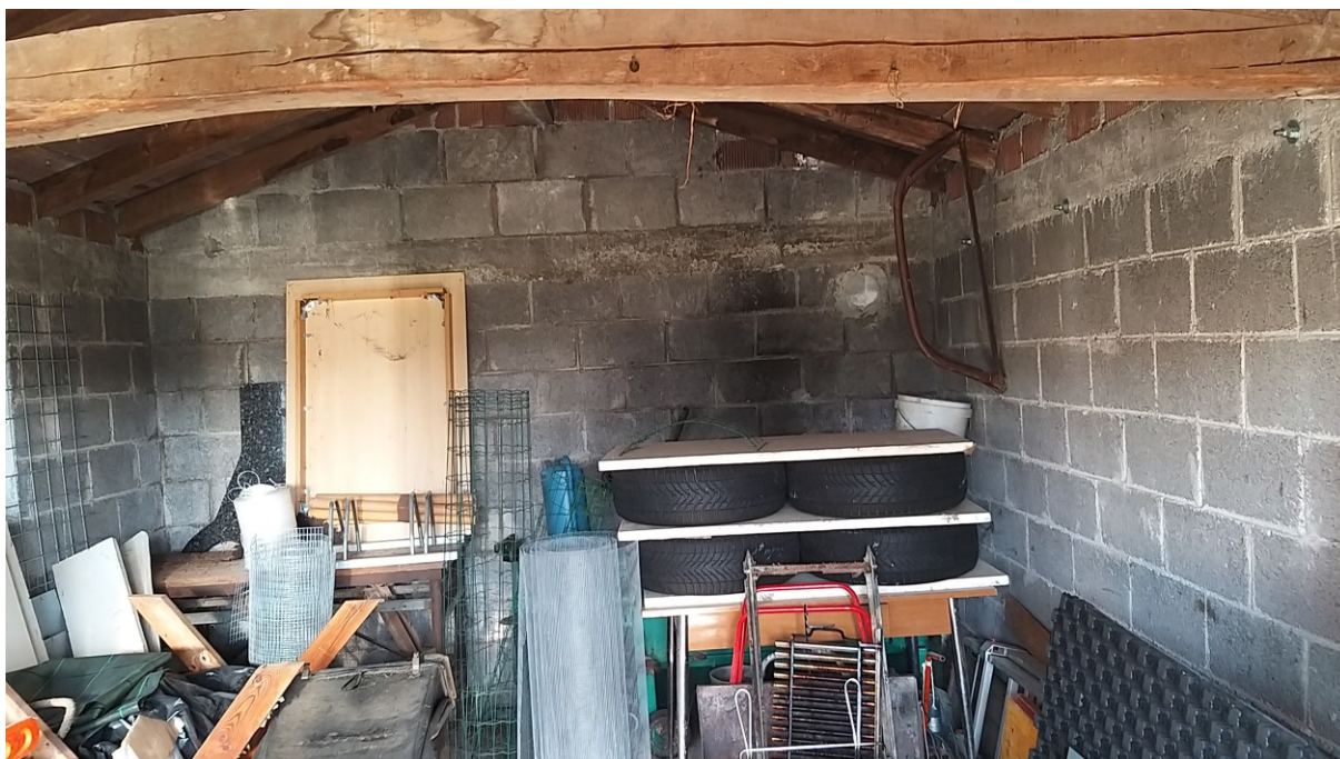
Foto n° 83 – Lotto 2 - Comune di Azzano Decimo (PN) – Foglio 22, m.le 12 – Veduta interna, dall'entrata, del deposito di cui alla foto precedente.