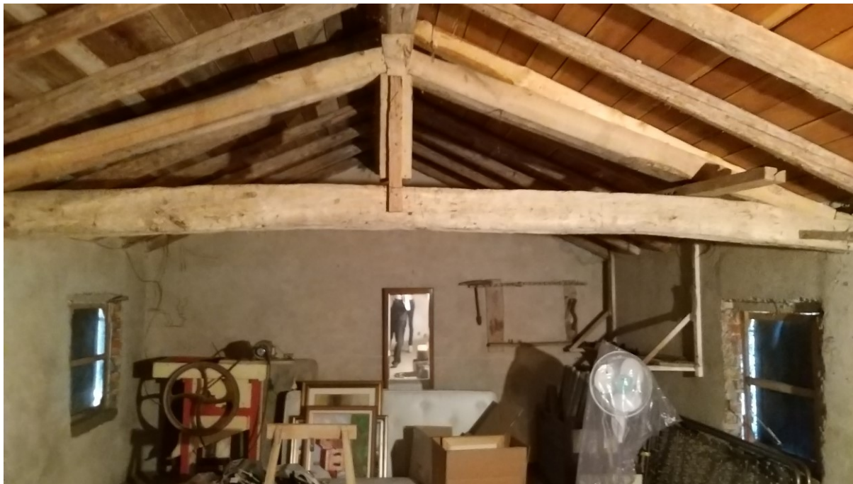
Foto n° 112 - Lotto 2 - Comune di Azzano Decimo (PN) - Foglio 22, m.le 12 - Veduta interna del sottotetto nel secondo vano uso soffitta, di più ampie dimensioni.