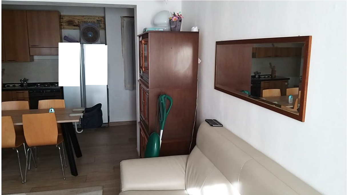
Foto n° 90 – Lotto 2 - Comune di Azzano Decimo (PN) – Foglio 22, m.le 12 – Piano terra. Veduta, da posizione sud, della sala da pranzo (in primo piano) e della cucina (sullo sfondo nella foto).