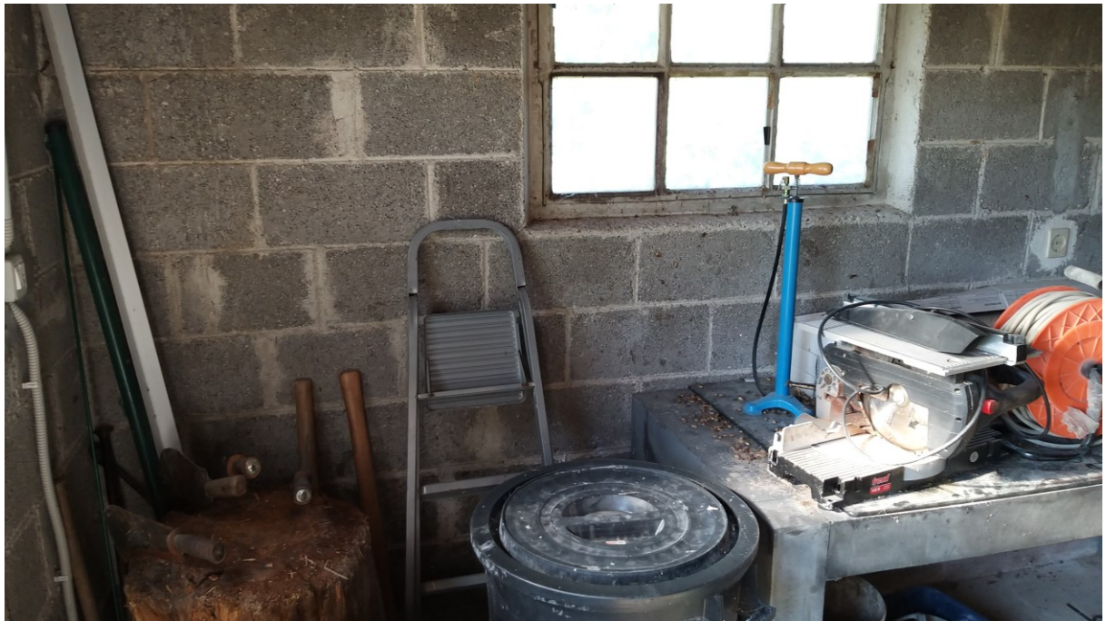
Foto n° 84 – Lotto 2 - Comune di Azzano Decimo (PN) – Foglio 22, m.le 12 – Particolare della parete finestrata nord, all'interno del deposito di cui alla foto precedente.