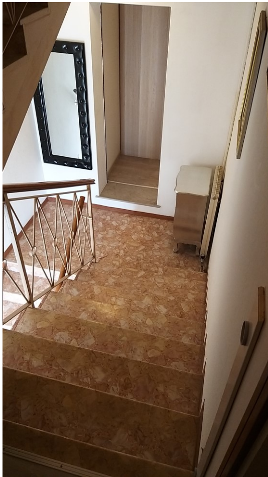
Foto n° 103 - Lotto 2 - Comune di Azzano Decimo (PN) - Foglio 22, m.le 12 - Veduta della seconda rampa di scale. Sullo sfondo l'ingresso ai vani ante-bagno e bagno del piano intermedio.