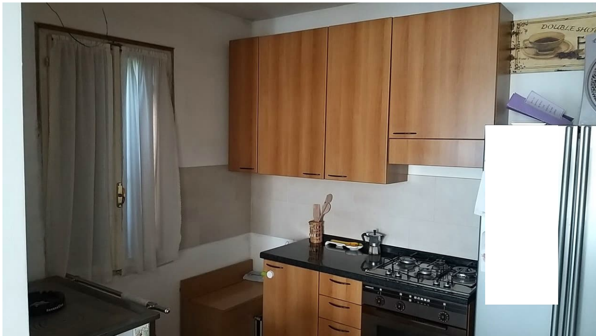
Foto n° 92 – Lotto 2 - Comune di Azzano Decimo (PN) – Foglio 22, m.le 12 – Piano terra. Veduta, di porzione nord del vano uso cucina.