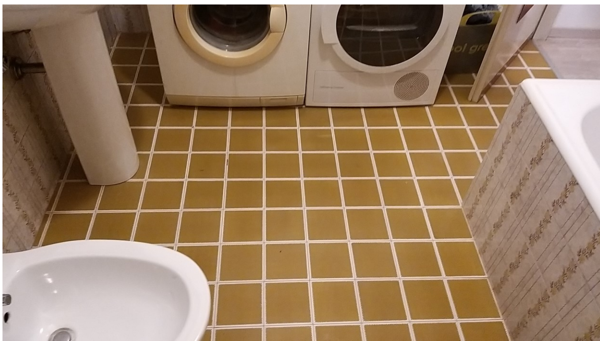
Foto n° 102 – Lotto 2 - Comune di Azzano Decimo (PN) – Foglio 22, m.le 12 – Particolare della pavimentazione del bagno al piano intermedio.