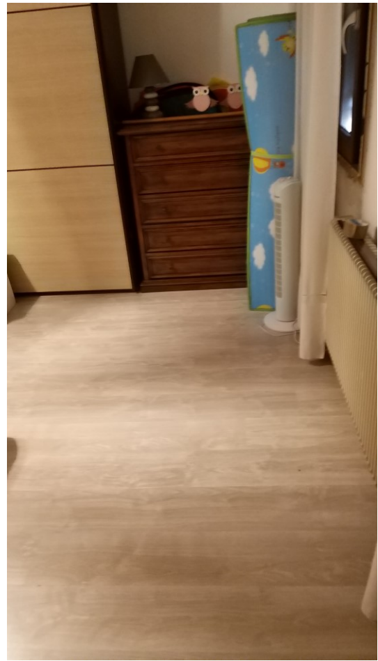
Foto n° 104 - Lotto 2 - Comune di Azzano Decimo (PN) - Foglio 22, m.le 12 - Primo piano. Veduta, dalla porta di entrata, di porzione della prima camera, posta a sinistra rispetto alle scale.