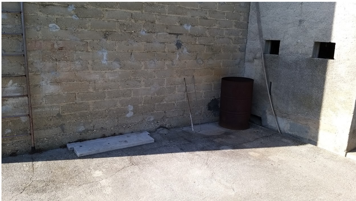
Foto n° 77 - Lotto 2 - Comune di Azzano Decimo (PN) - Foglio 22, m.le 12 - Particolare dello stesso muro al piano terra; a destra si nota parte del vano ex porcile, ora deposito materiali ed attrezzi.