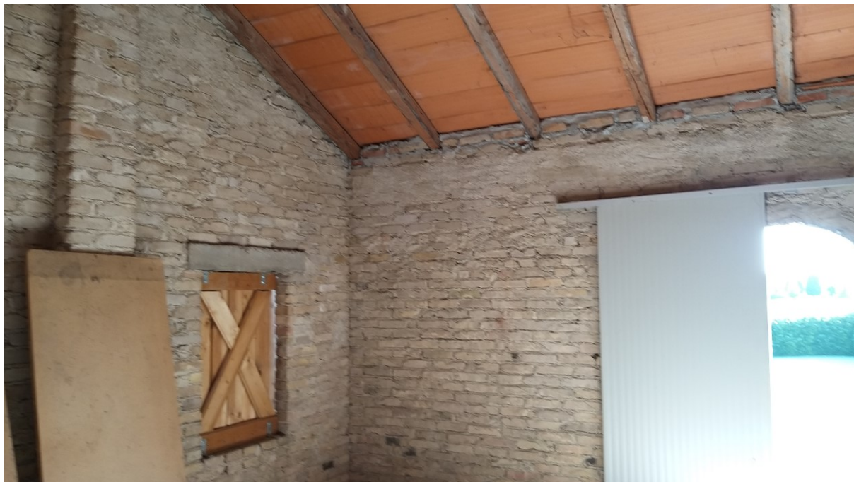
Foto n° 73 – Lotto 2 - Comune di Azzano Decimo (PN) – Foglio 22, m.le 12 – Veduta interna di porzione sud del deposito (ex fienile) situato al primo piano. A destra è visibile l'unica entrata, a cui si accede mediante una scala esterna a pioli.