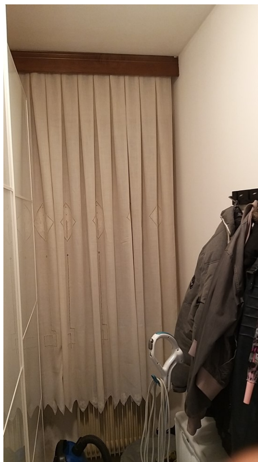
Foto n° 99 - Lotto 2 - Comune di Azzano Decimo (PN) - Foglio 22, m.le 12 - Veduta interna di porzione dell'ante-bagno posto al piano intermedio.