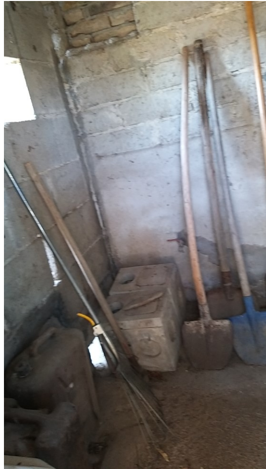
Foto n° 80 – Lotto 2 - Comune di Azzano Decimo (PN) – Foglio 22, m.le 12. Veduta di porzione opposta dello stesso vano.