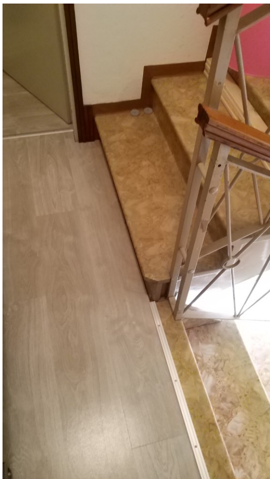
Foto n° 109 – Lotto 2 - Comune di Azzano Decimo (PN) – Foglio 22, m.le 12 – Ritornati sul pianerottolo del primo piano, particolare dell'ultima rampa di scale, che permette l'accesso alla soffitta.