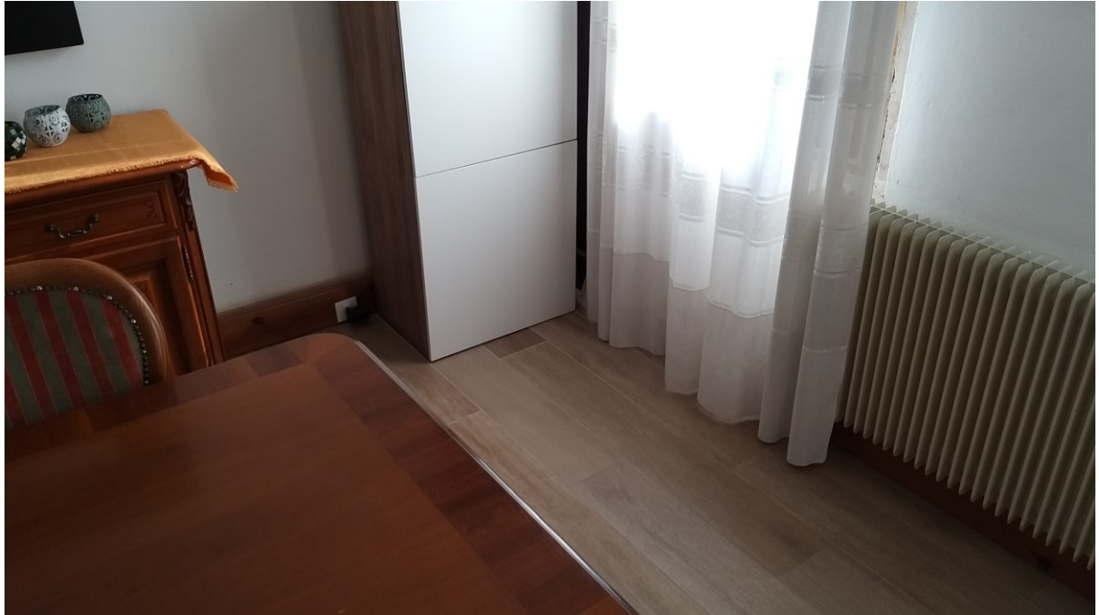
Foto n° 88 - Lotto 2 - Comune di Azzano Decimo (PN) - Foglio 22, m.le 12 - Piano terra. Particolare di porzione opposta dello stesso vano.