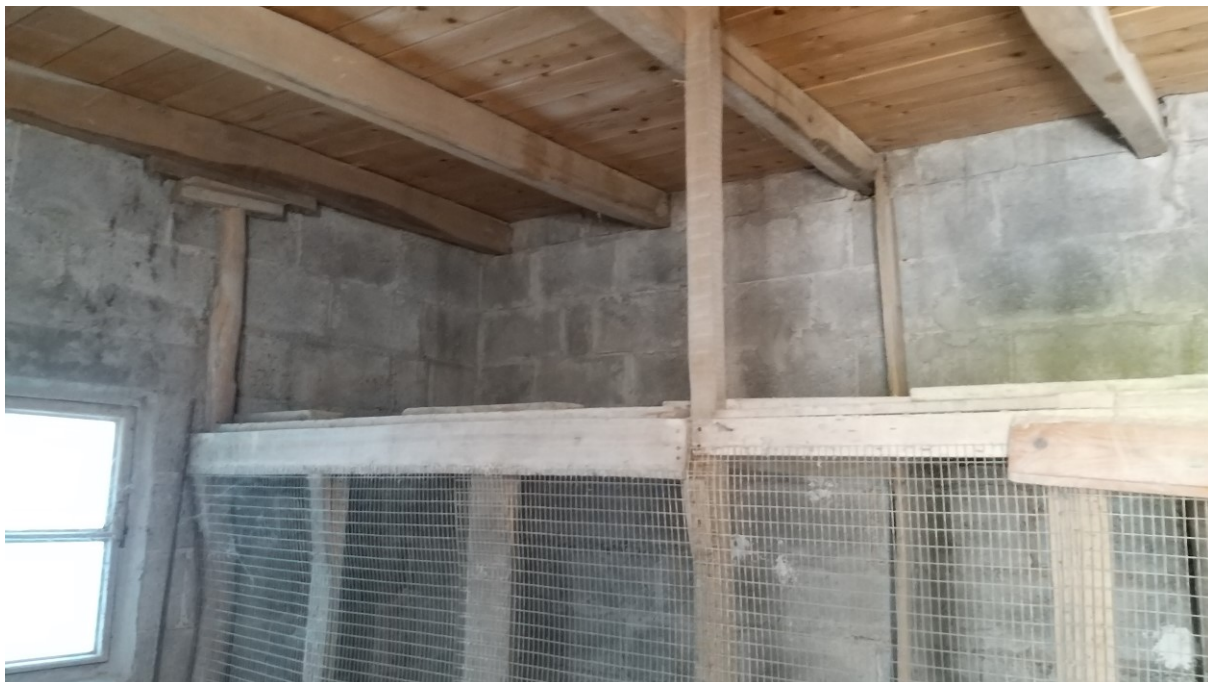
Foto n° 71 – Lotto 2 - Comune di Azzano Decimo (PN) – Foglio 22, m.le 12 – Particolare di porzione nord-est del vano uso pollaio.