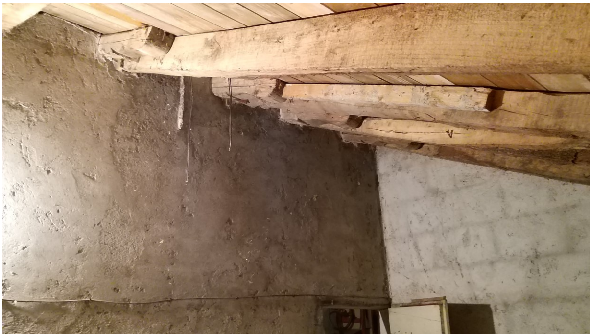
Foto n° 110 – Lotto 2 - Comune di Azzano Decimo (PN) – Foglio 22, m.le 12 – Veduta del sottotetto nel primo vano uso soffitta, di minori dimensioni, in prossimità della porta d’accesso.