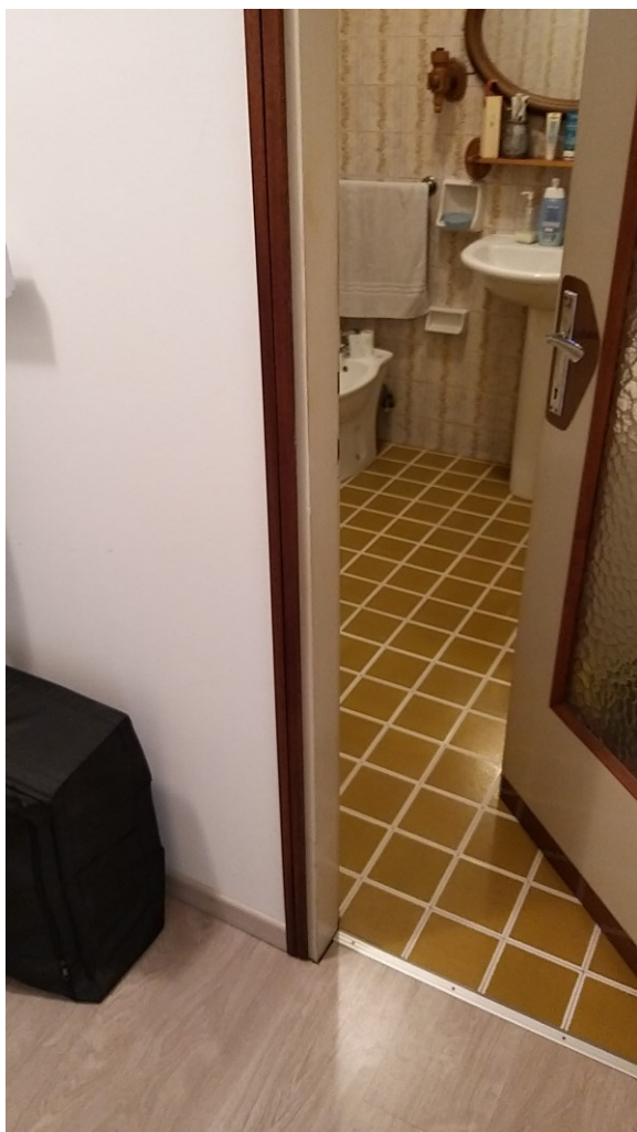
Foto n° 100 - Lotto 2 - Comune di Azzano Decimo (PN) - Foglio 22, m.le 12 - Particolare dell'ingresso al bagno posto al piano intermedio.