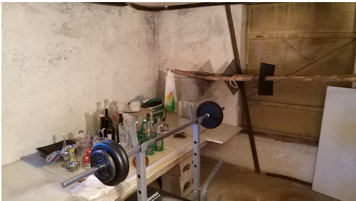
Foto n° 96 – Lotto 2 - Comune di Azzano Decimo (PN) – Foglio 22, m.le 12 – Particolare di porzione sud-est del vano ad uso cantina.