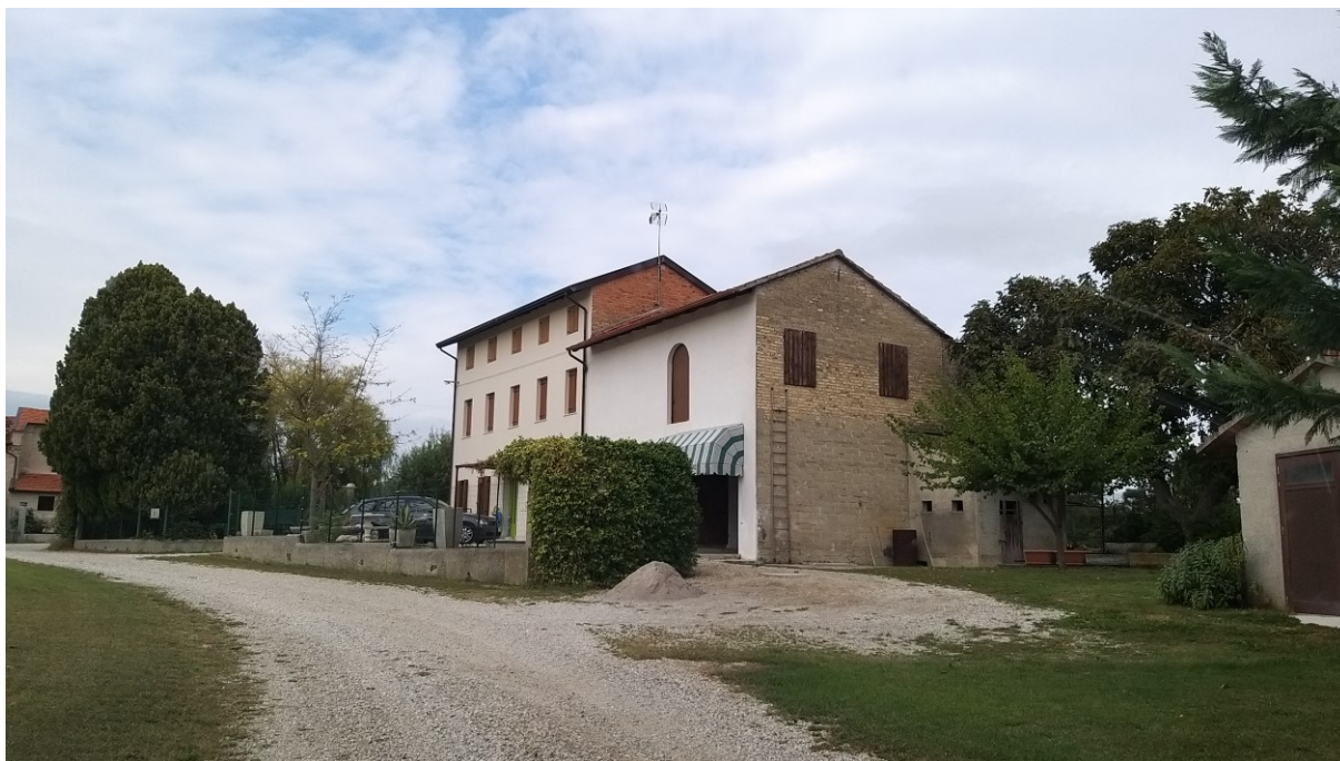
Foto n° 63 – Lotto 2 - Comune di Azzano Decimo (PN) – Foglio 22, m.le 12 – Veduta generale del compendio pignorato in Via Santa Croce n°130, che comprende anche il deposito separato visibile sulla destra nella foto.