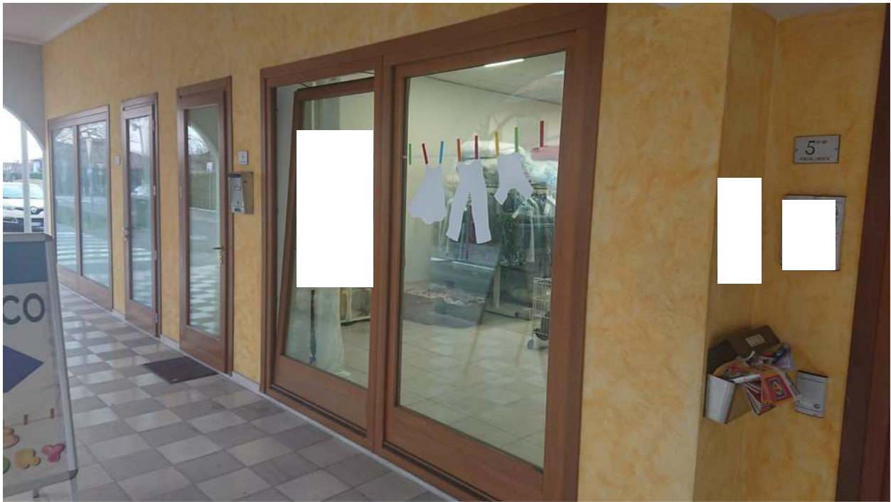
Foto n° 1 - 25/01/2022 - Comune di Pramaggiore, foglio 10, part.549, sub.34 – Porta di accesso all'immobile pignorato.