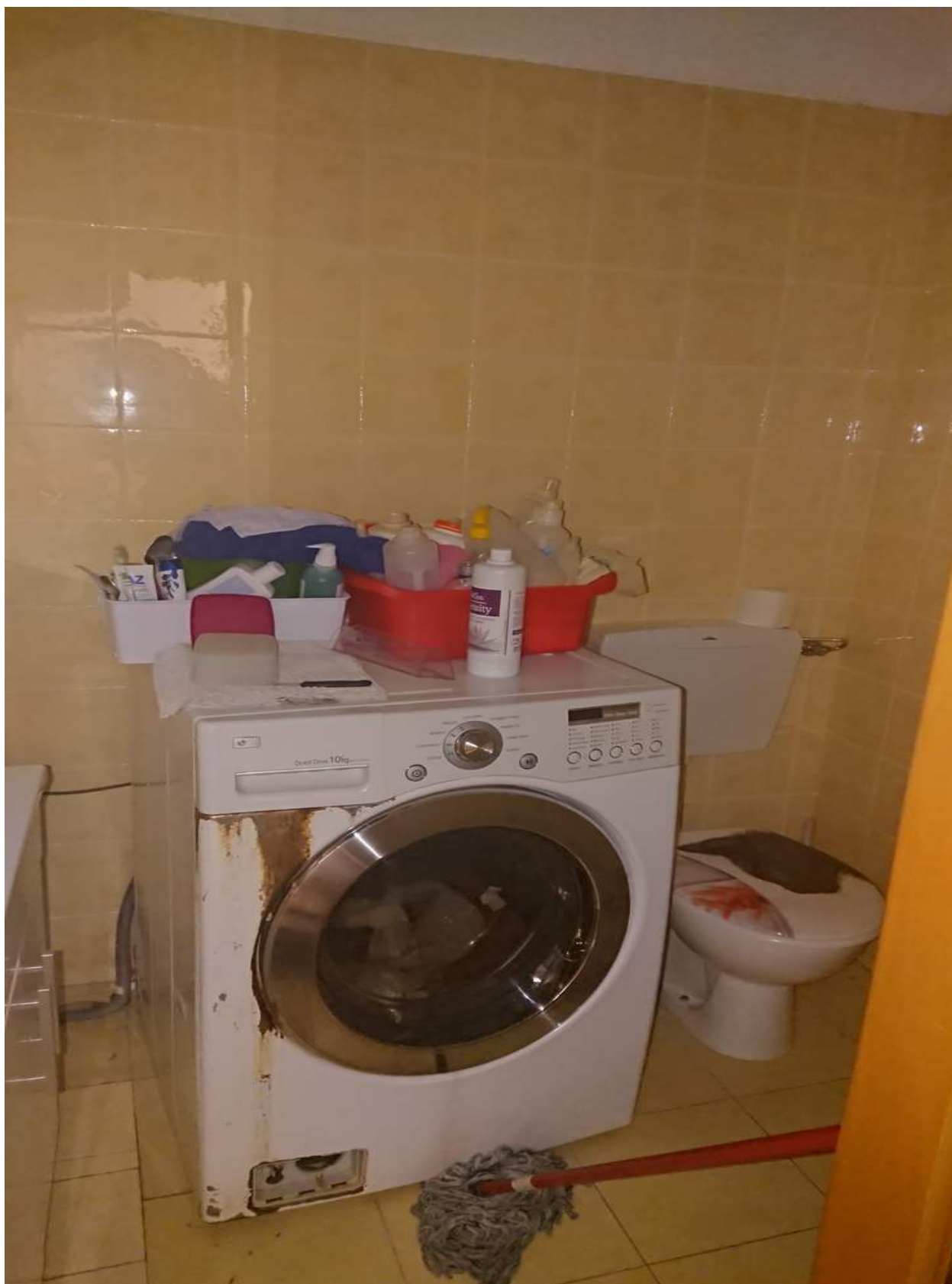
Foto n° 4 - 25/01/2022 - Comune di Pramaggiore, foglio 10, part.549, sub.34 – Locale wc.