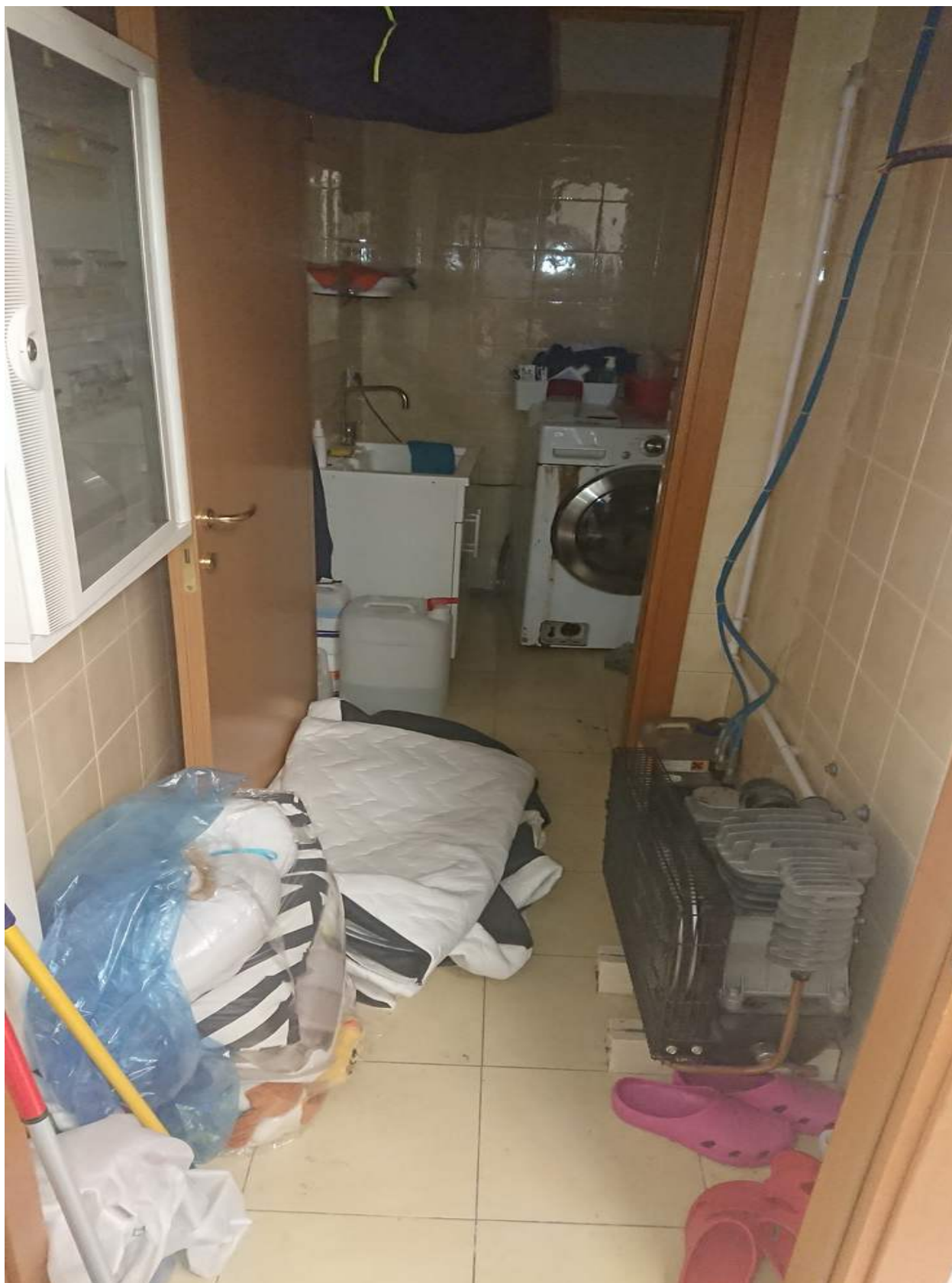
Foto n° 3 - 25/01/2022 - Comune di Pramaggiore, foglio 10, part.549, sub.34 – Antiwc.