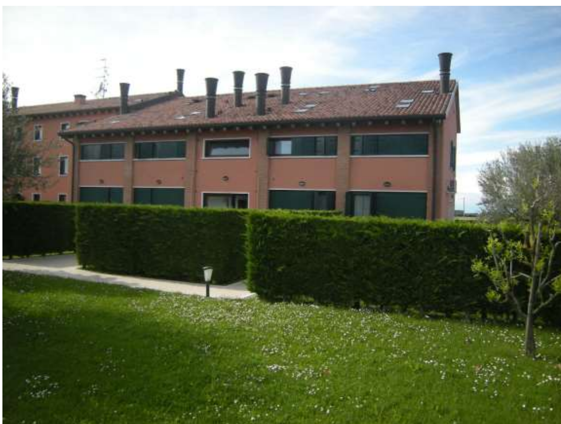
Ottava Presa (Caorle), Strada Fortuna n. 56 - Il prospetto a sud-est del fabbricato.