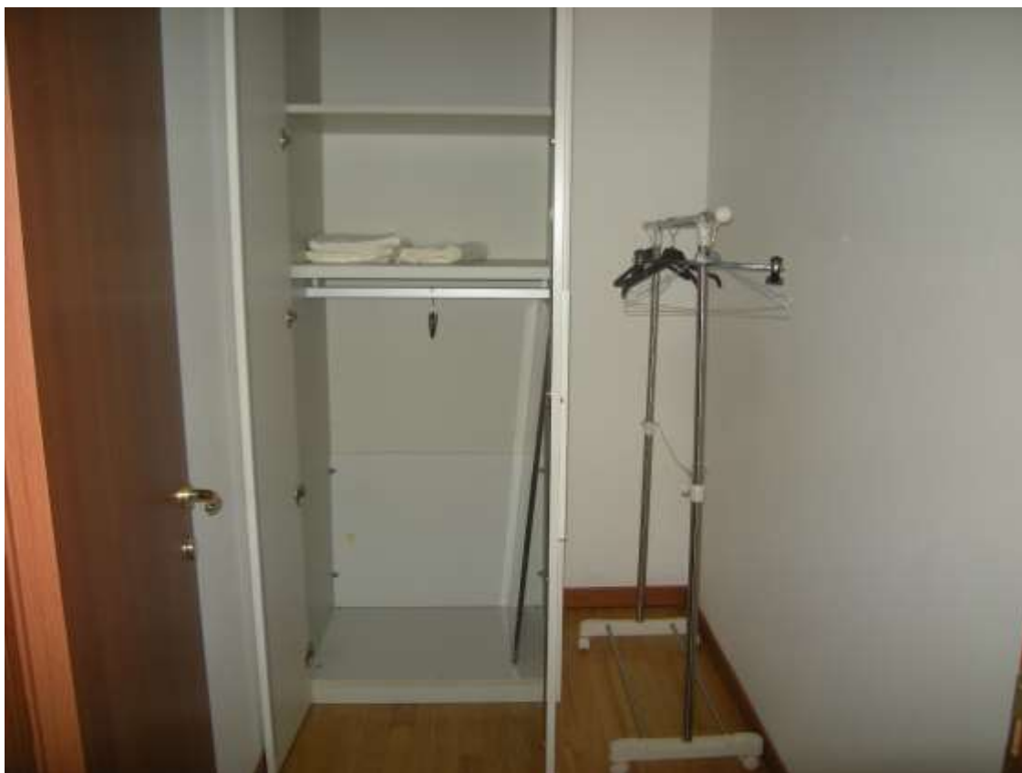
Ottava Presa (Caorle), Strada Fortuna n. 56 – Sopra il disimpegno, sotto il ripostiglio.