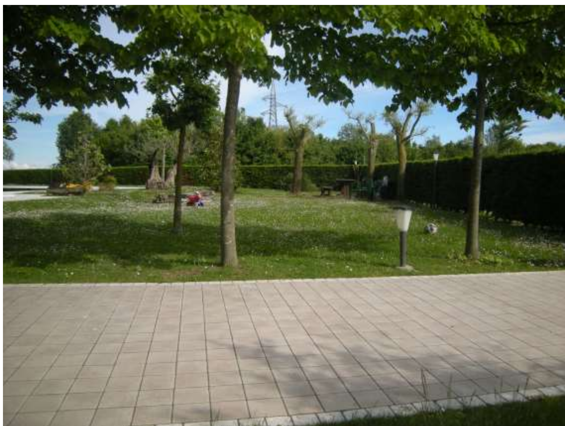
Ottava Presa (Caorle), Strada Fortuna n. 56 - La corte di pertinenza dell'immobile e la piscina.