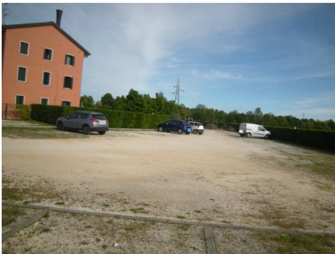
Ottava Presa (Caorle), Strada Fortuna n. 56 - I posti auto n. 51 e 52.