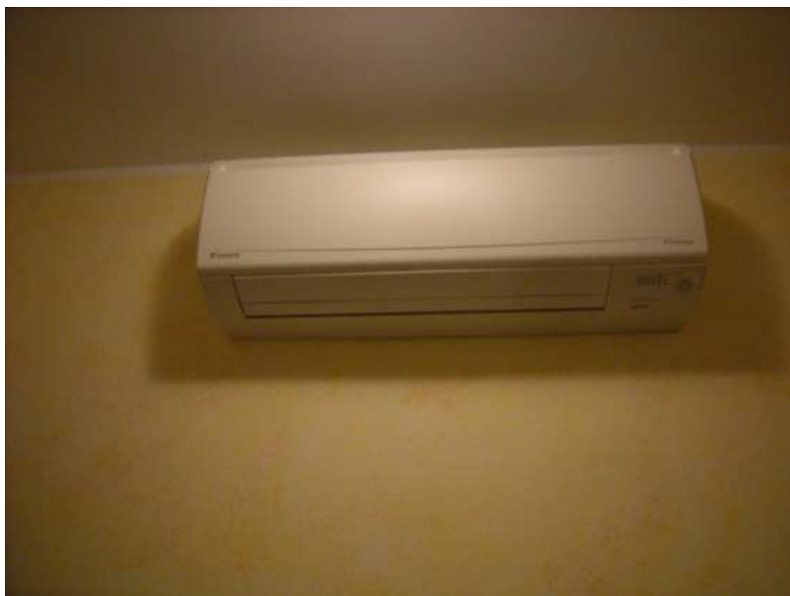
Ottava Presa (Caorle), Strada Fortuna n. 56 - Sopra il comando dell'irrigazione il condizionatore.