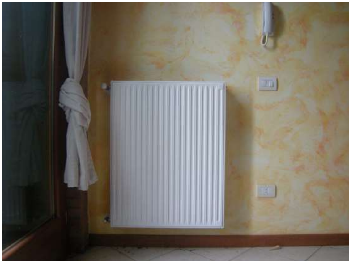
Ottava Presa (Caorle), Strada Fortuna n. 56 - Il termostato ambiente ed il radiatore.