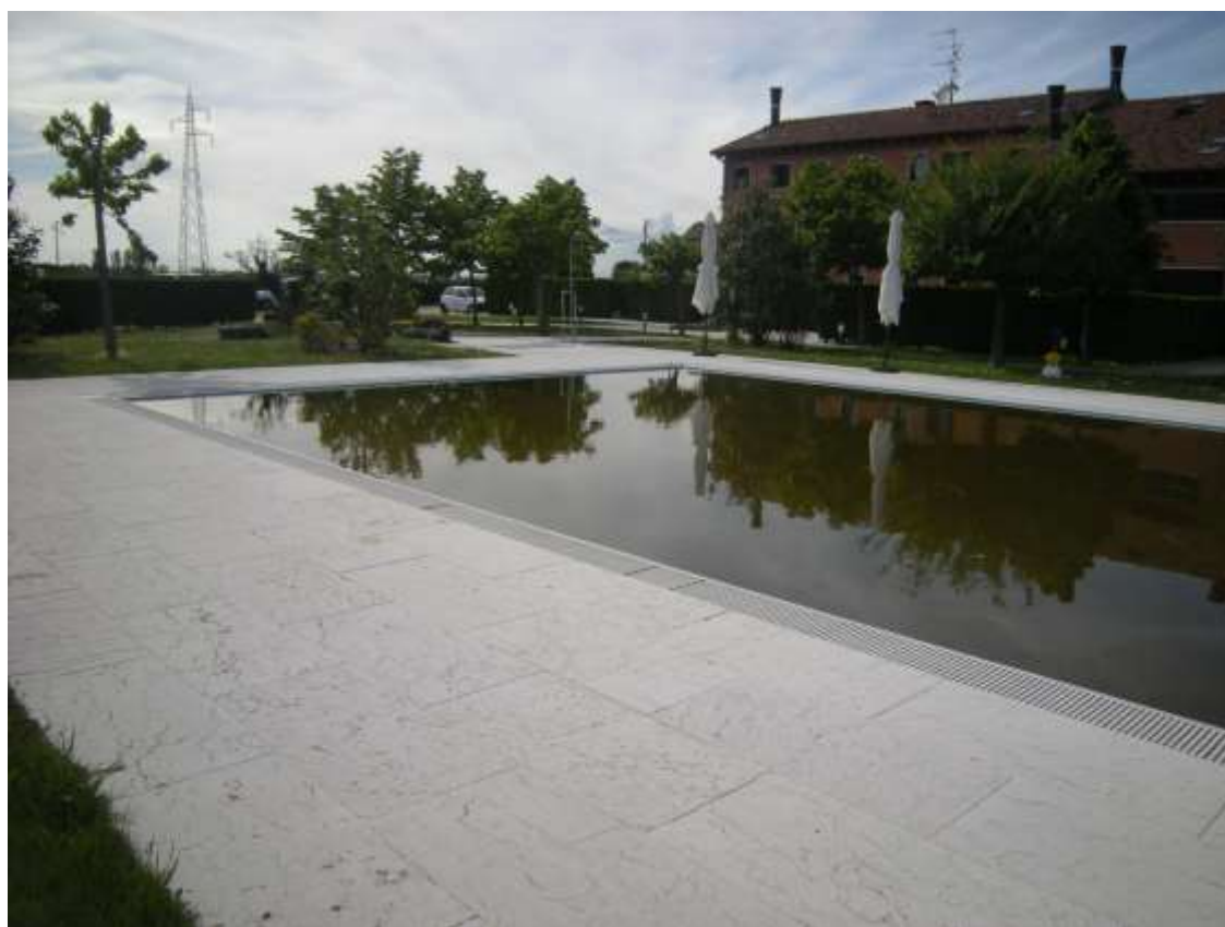
Ottava Presa (Caorle), Strada Fortuna n. 56 - La corte di pertinenza dell'immobile e la piscina.