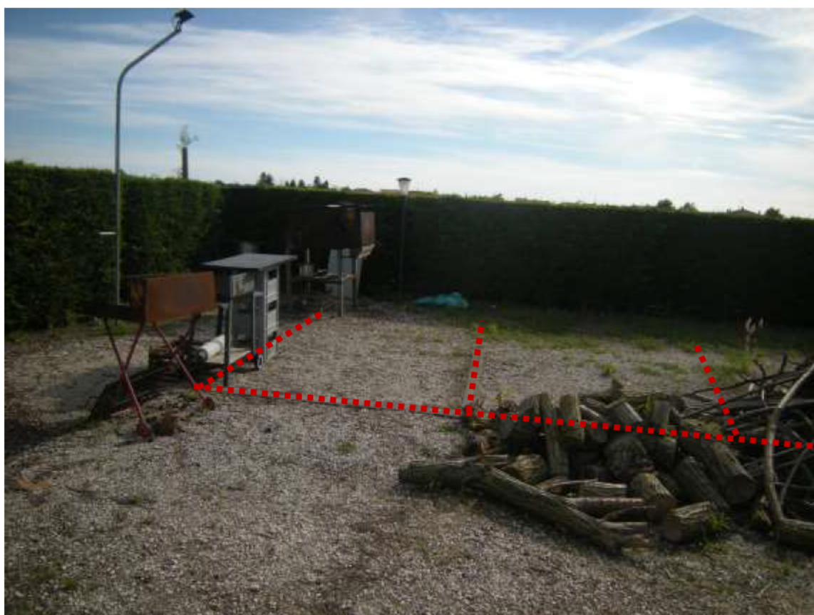
Ottava Presa (Caorle), Strada Fortuna n. 56 - I posti auto n. 15, 16, 17.