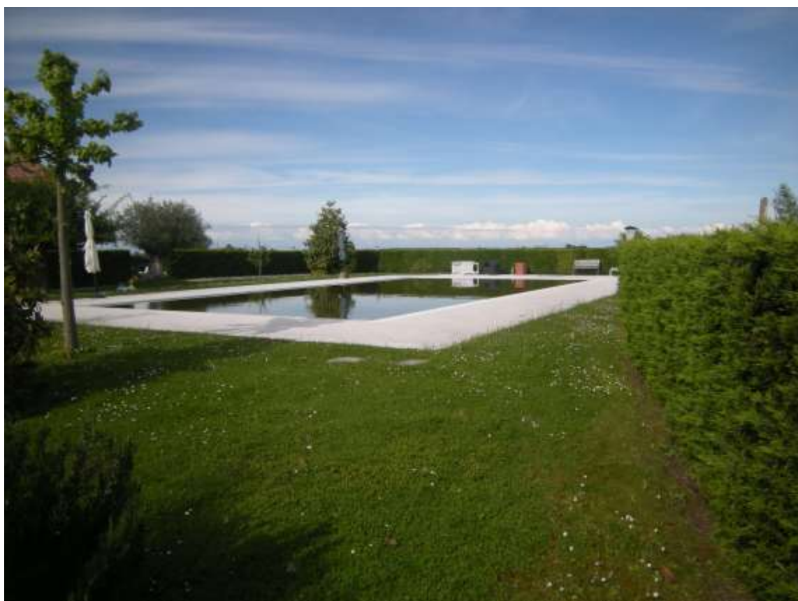
Ottava Presa (Caorle), Strada Fortuna n. 56 - La corte di pertinenza dell'immobile e la piscina.