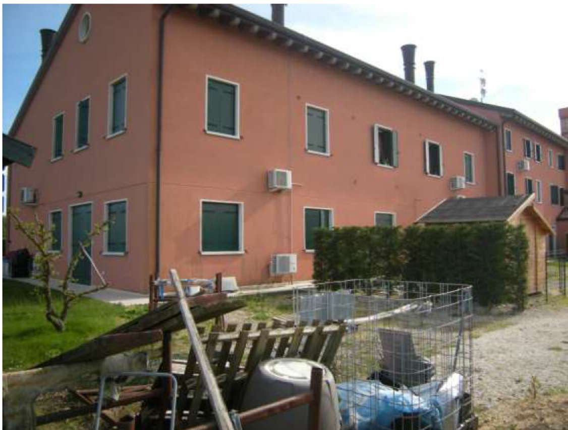
Ottava Presa (Caorle), Strada Fortuna n. 56 – Sopra i prospetti a sud-est e nord-ovest, sotto i prospetti ad nord -ovest ed a nord – est.