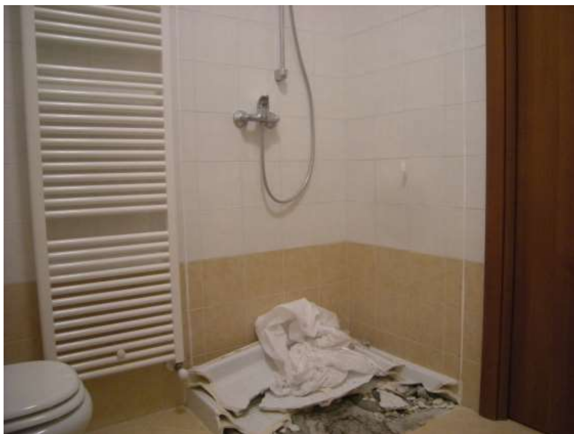
Ottava Presa (Caorle), Strada Fortuna n. 56 – Il locale bagno.