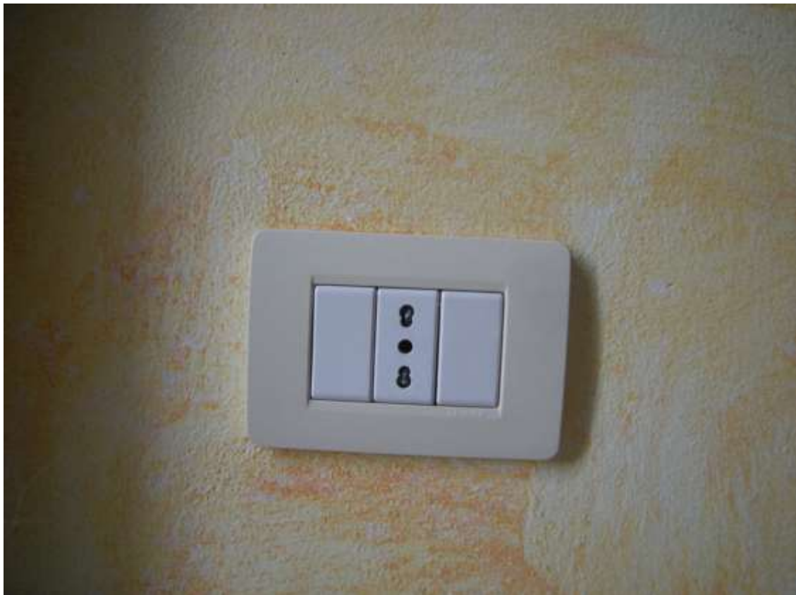
Ottava Presa (Caorle), Strada Fortuna n. 56 – Sopra il quadro elettrico, sotto gli interruttori.