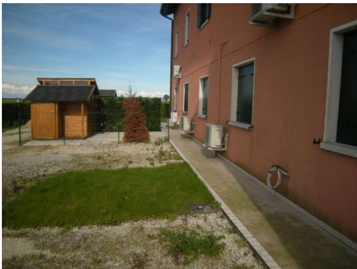
Ottava Presa (Caorle), Strada Fortuna n. 56 – Lo scoperto esclusivo sul retro dell'immobile.