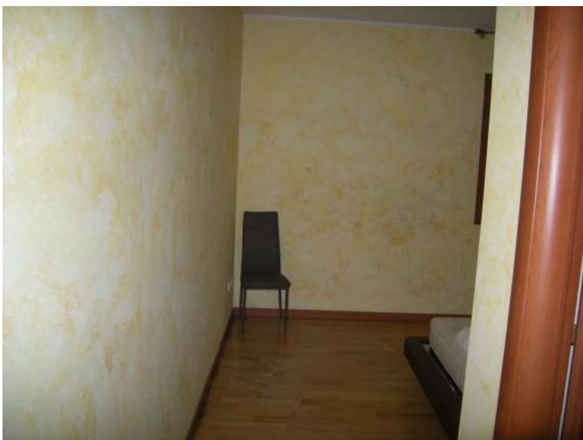
Ottava Presa (Caorle), Strada Fortuna n. 56 – La camera.