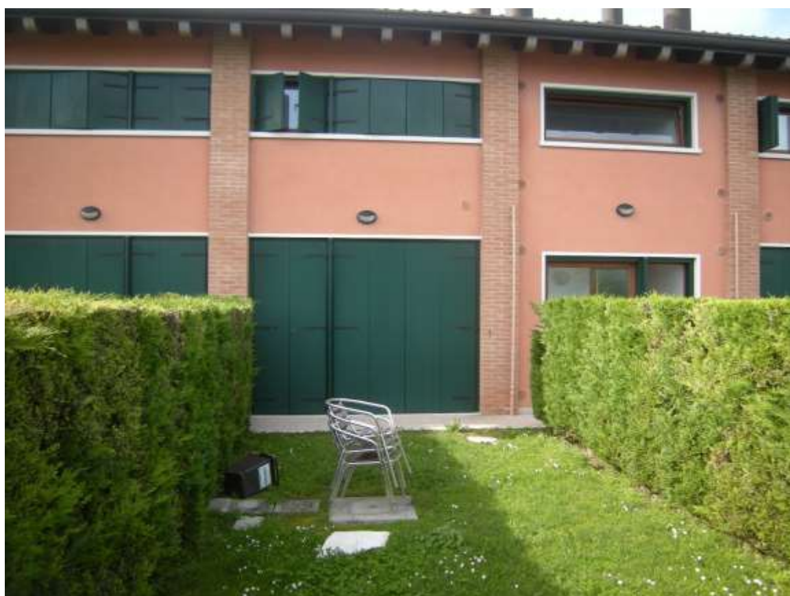
Ottava Presa (Caorle), Strada Fortuna n. 56 – L'ingresso all'unita immobiliare.