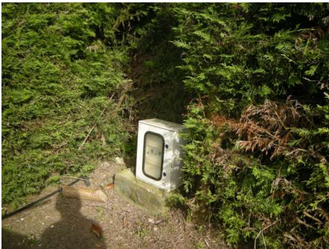
Ottava Presa (Caorle), Strada Fortuna n. 56 – Sopra vano contatori elettricit  e telefonia, sotto armadietto di comando luci esterne.