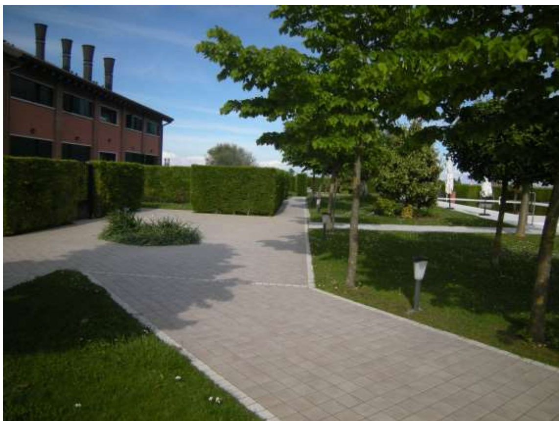
Ottava Presa (Caorle), Strada Fortuna n. 56 - La corte di pertinenza dell'immobile e la piscina.