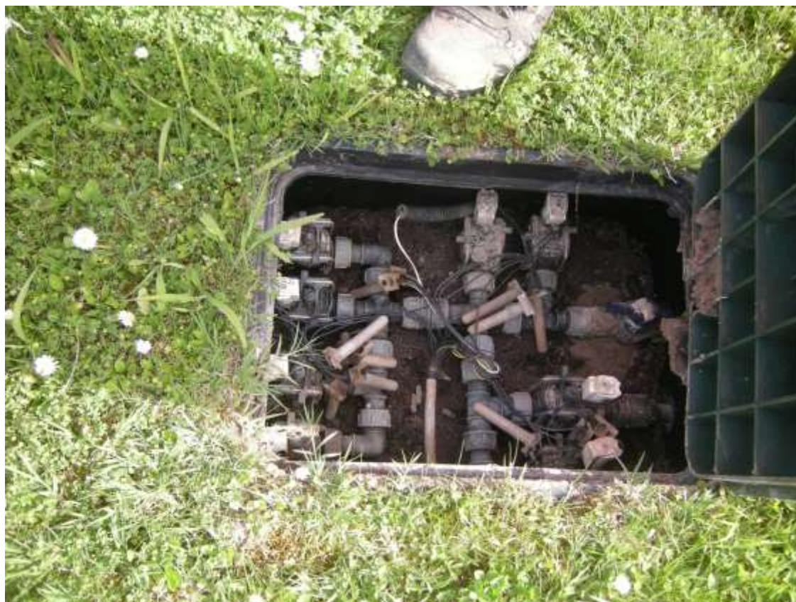
Ottava Presa (Caorle), Strada Fortuna n. 56 – Sopra pozzetto contatori acqua, sotto pozzetto irrigazione corte comune.