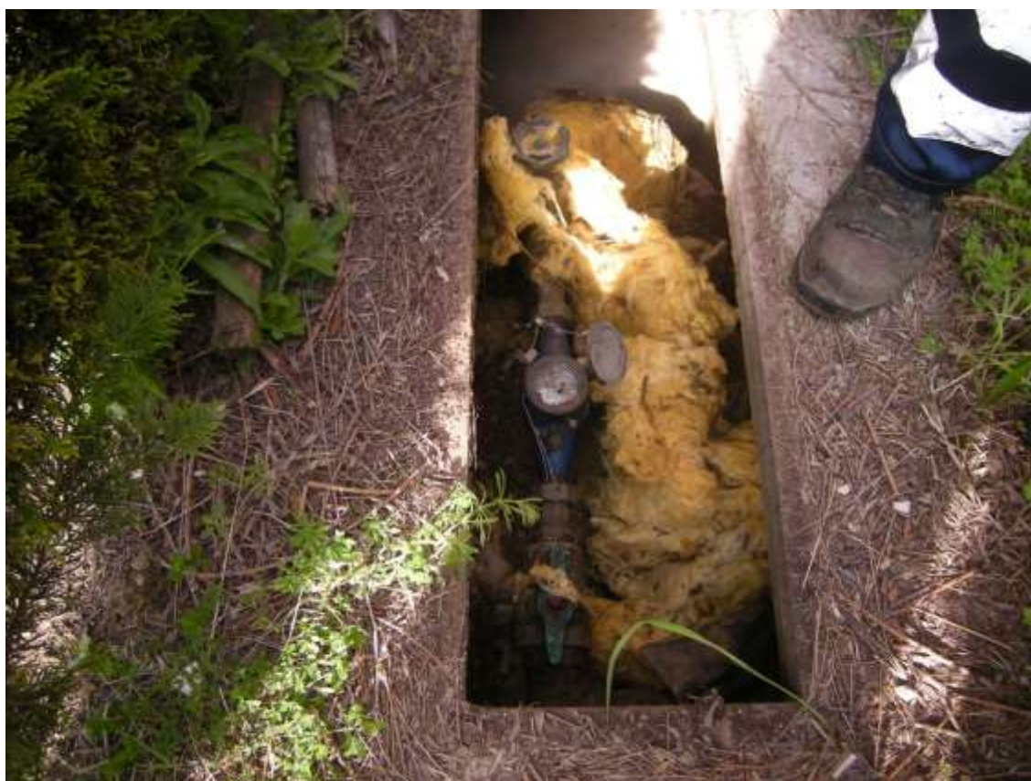
Ottava Presa (Caorle), Strada Fortuna n. 56 – Sopra nicchia contatori gas, sotto pozzetto contatore generale acqua.