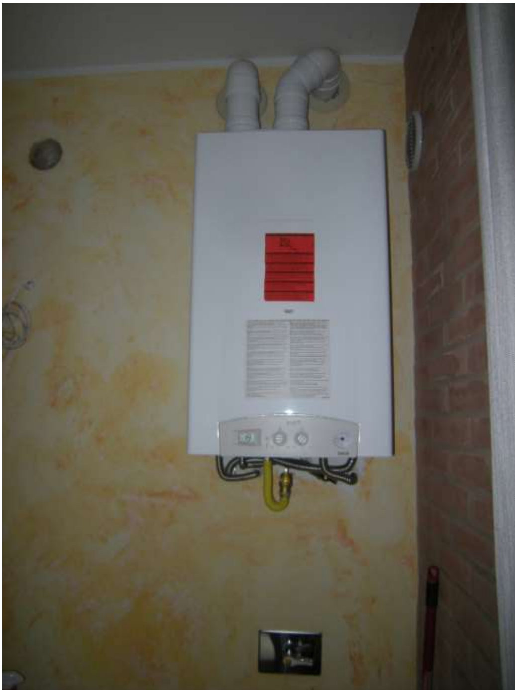
Ottava Presa (Caorle), Strada Fortuna n. 56 - La caldaia murale.