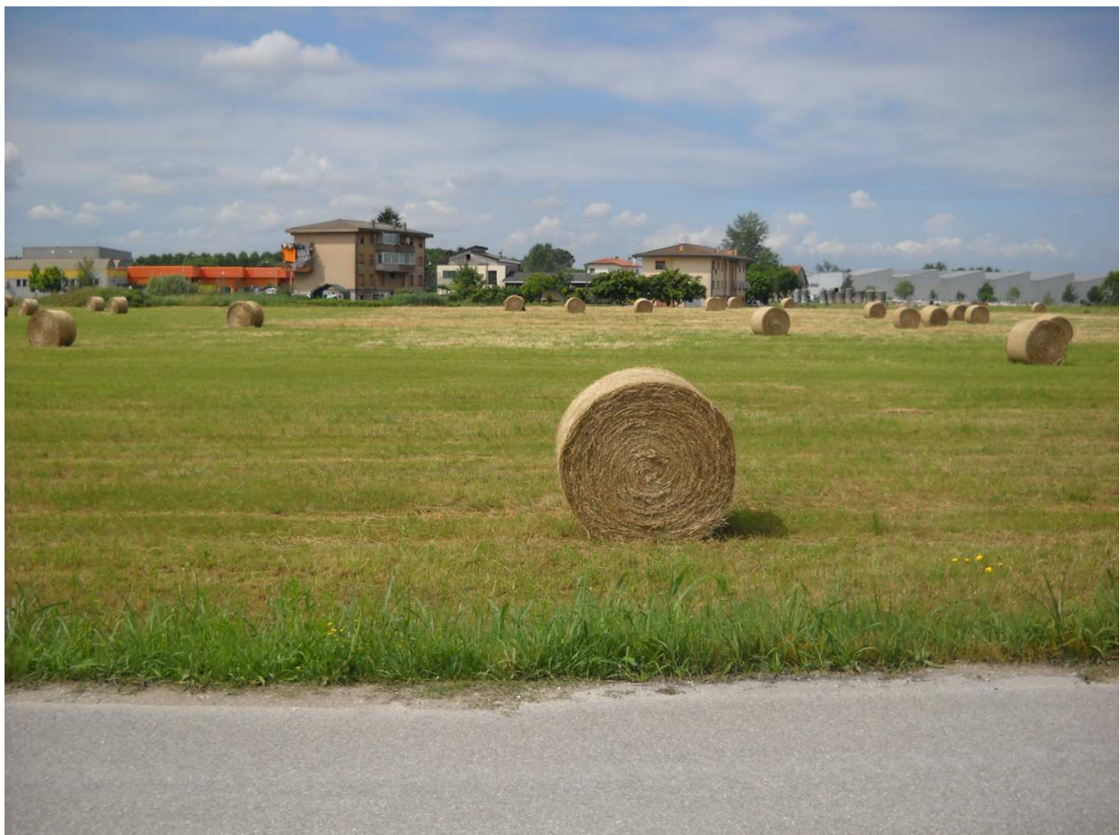
Foto 2 Utilizzo in atto al momento del sopralluogo