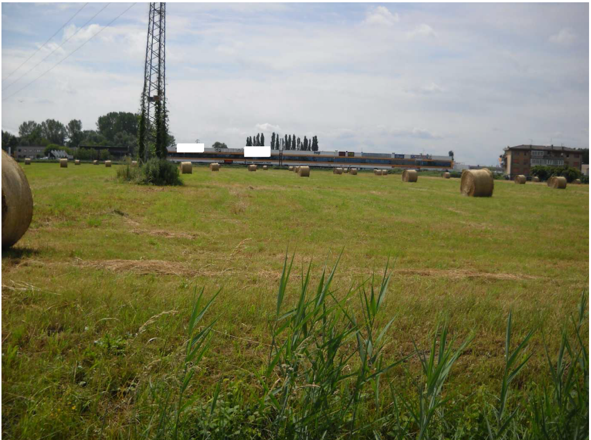
Foto 4 Elettrodotto