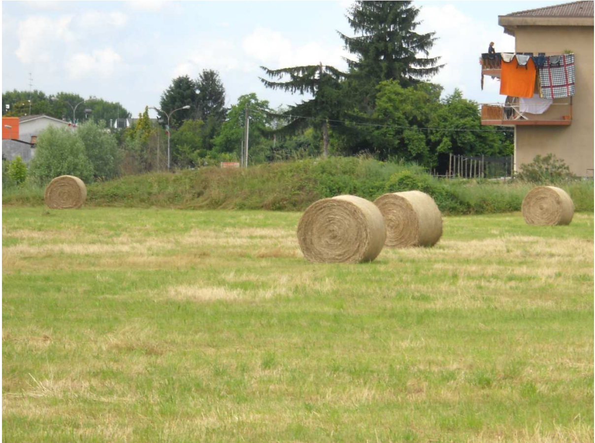
Foto 5 Confine con edificio residenziale