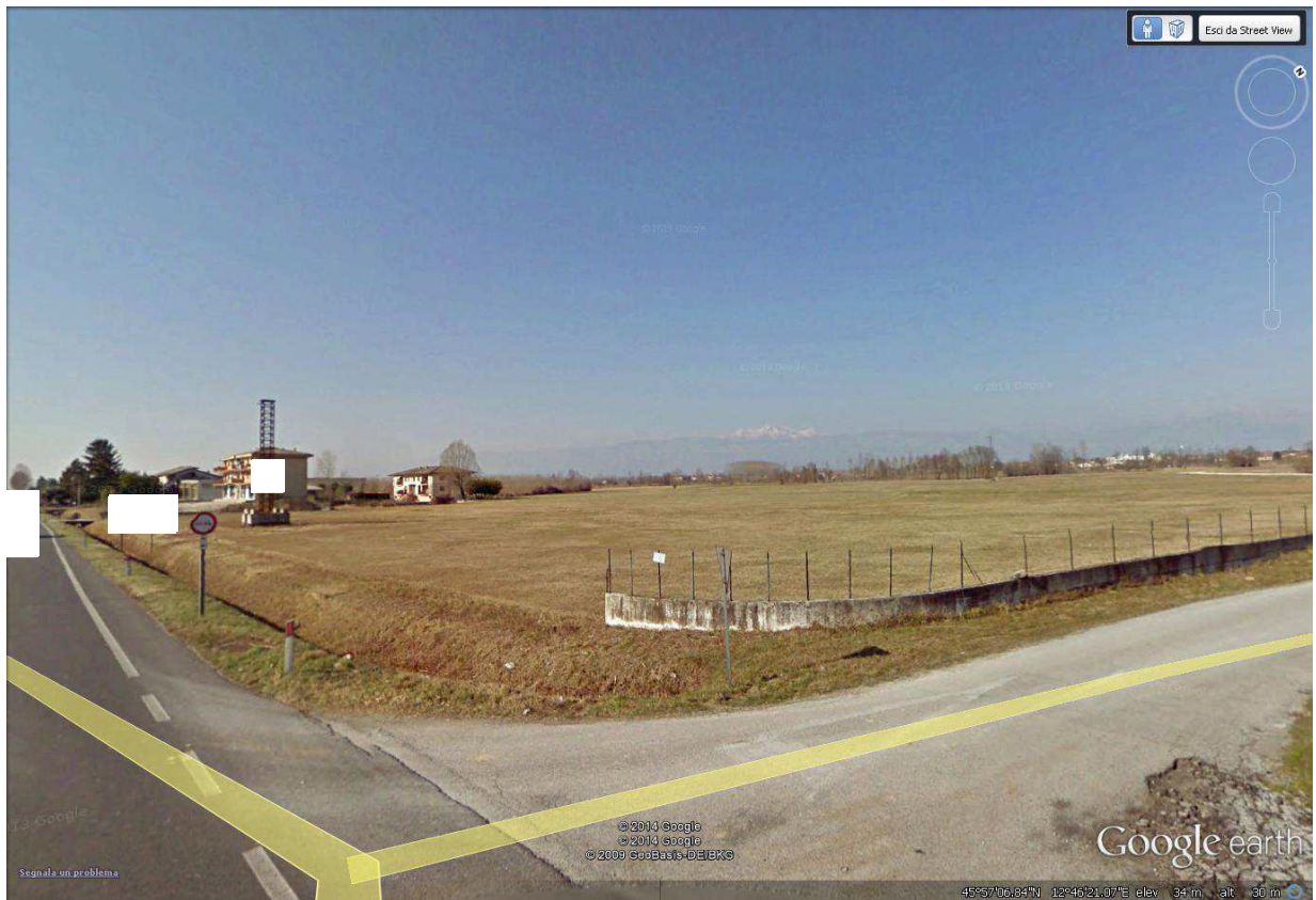
Foto 1 Vista dei terreni da S.S. 14 Pontebbana