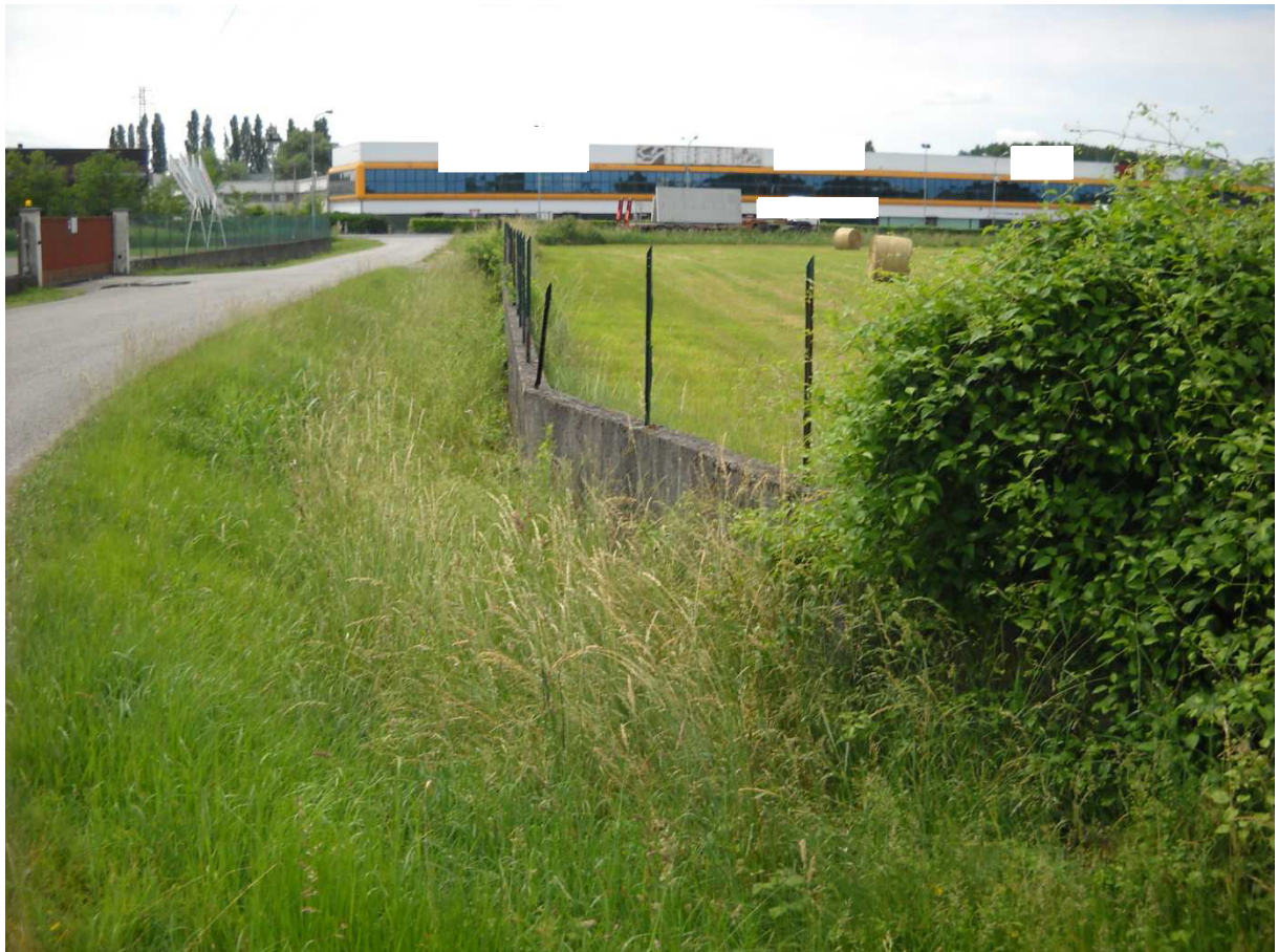
Foto 3 recinzione parziale esistente