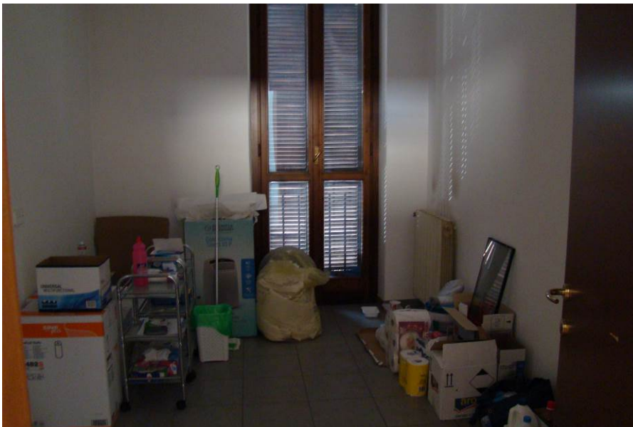
19. Vista della cucina.