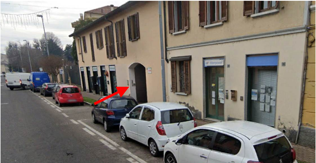
1. Rilievo fotografico del contesto. Vista dell'ingresso pedonale/carrabile su strada.