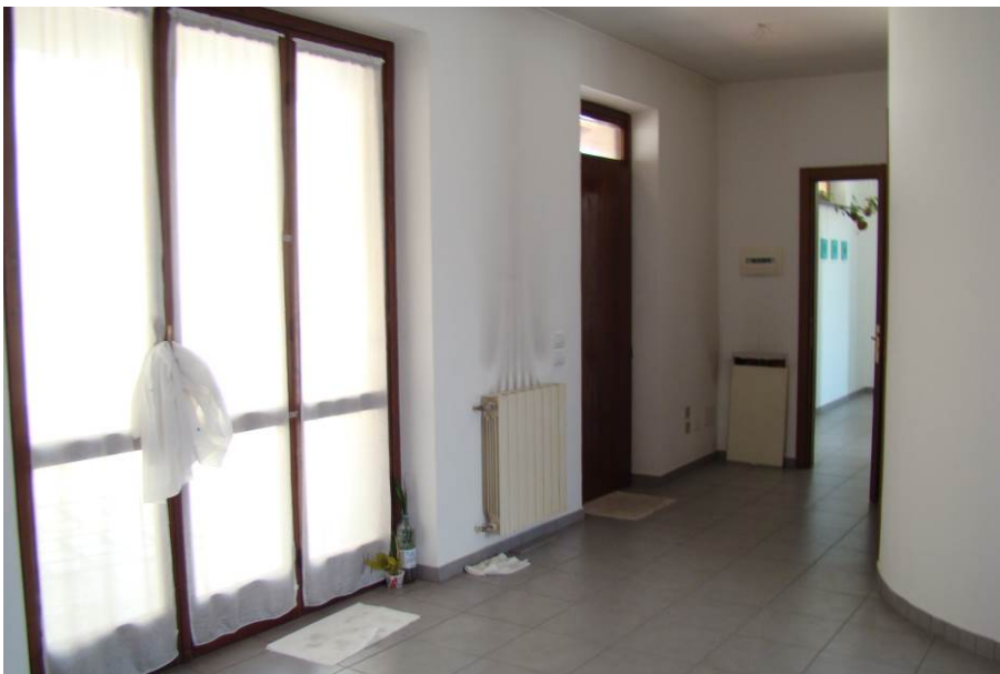
20. Vista della sala.