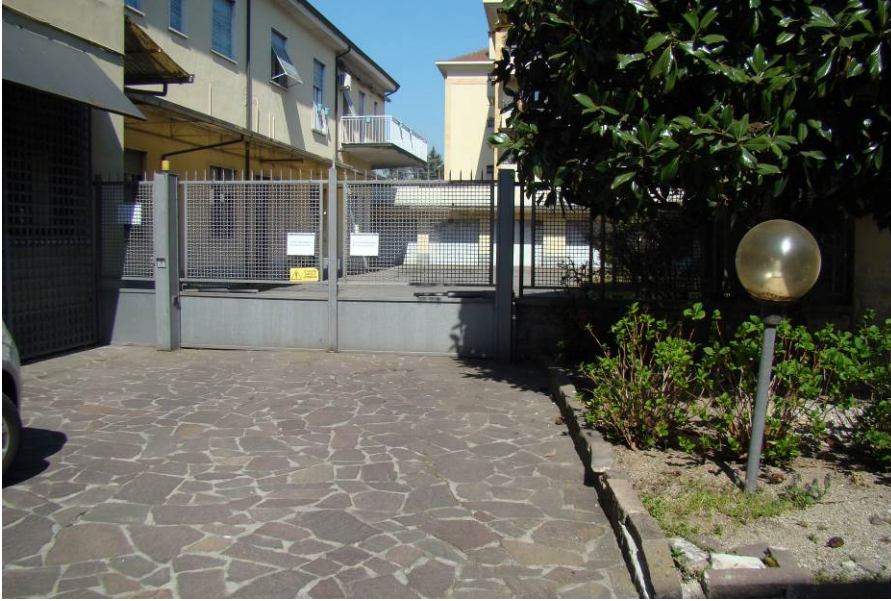
9. Dettaglio del cancello del mappale limitrofo, con accesso dal medesimo androne sulla via Milano.