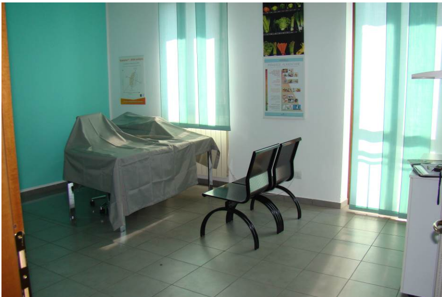
15. Vista di una stanza.