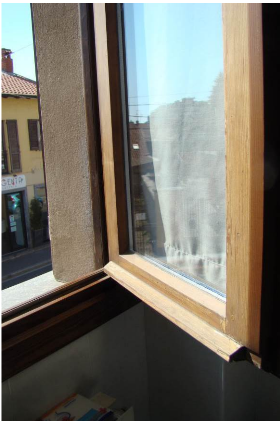
23. Dettaglio del serramento.