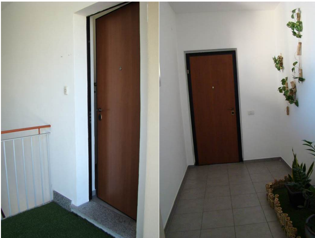
13. Viste del nuovo accesso sul pianerottolo della scala, dall'esterno e dall'interno.