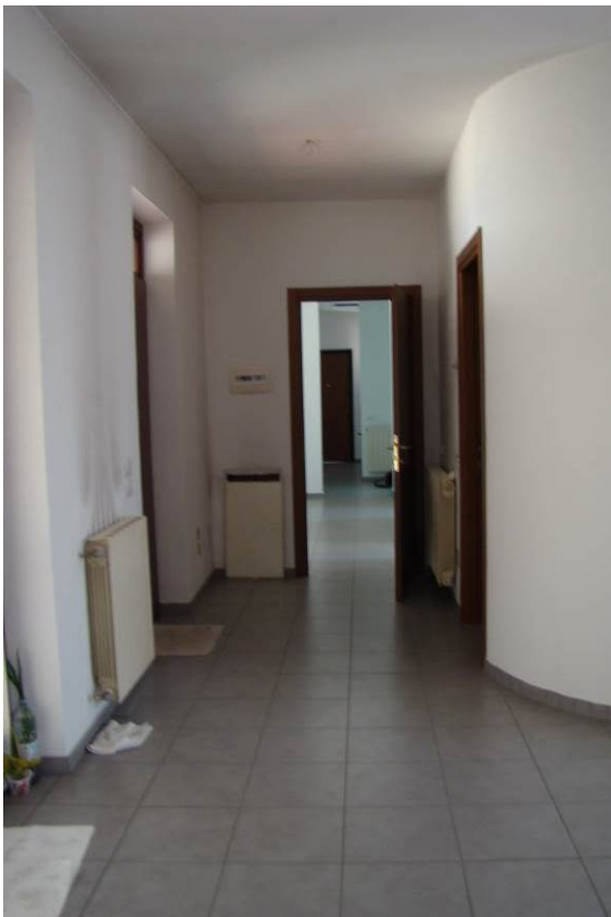
14. Vista interna del corridoio verso il nuovo accesso.