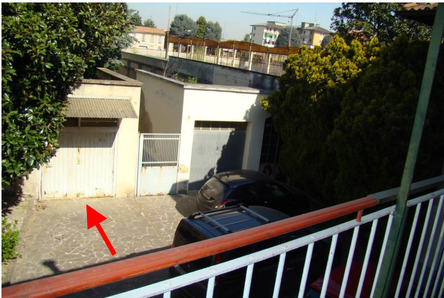
5. Individuazione del box.