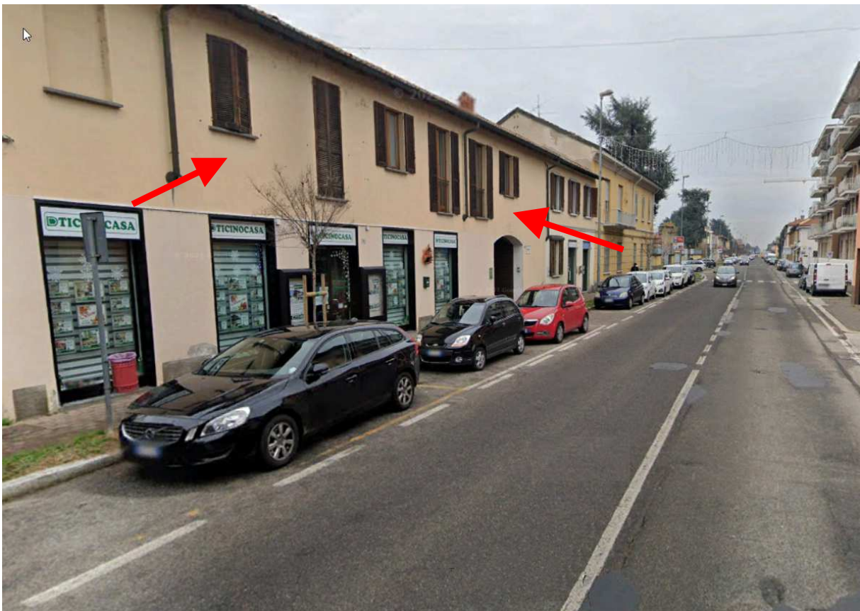
4. Vista del contesto con individuazione degli affacci dell'immobile.