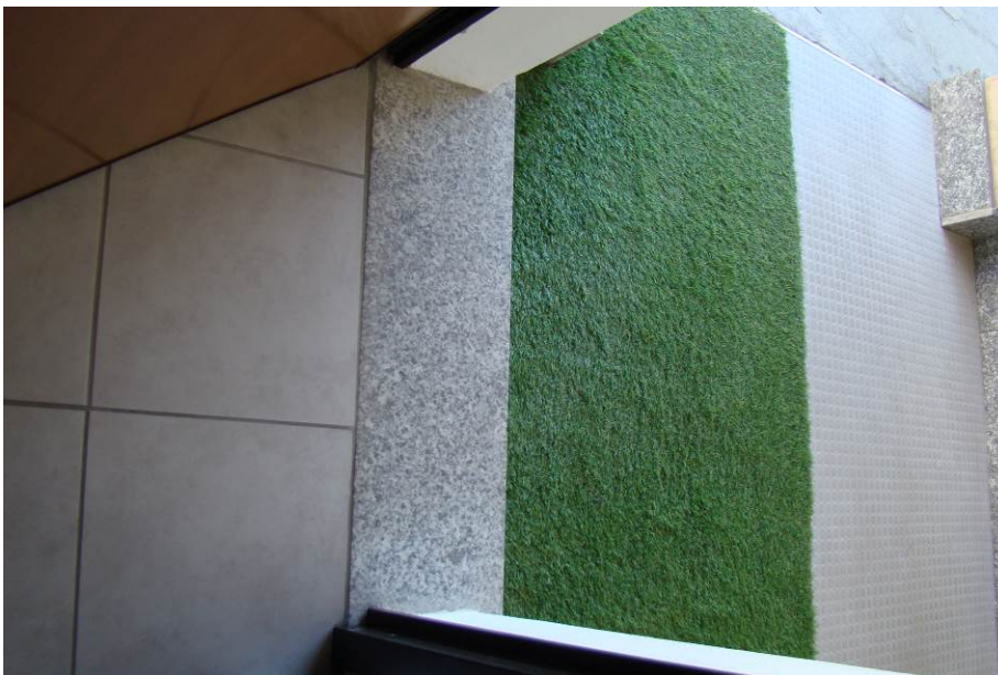
22. Dettaglio del pavimento.