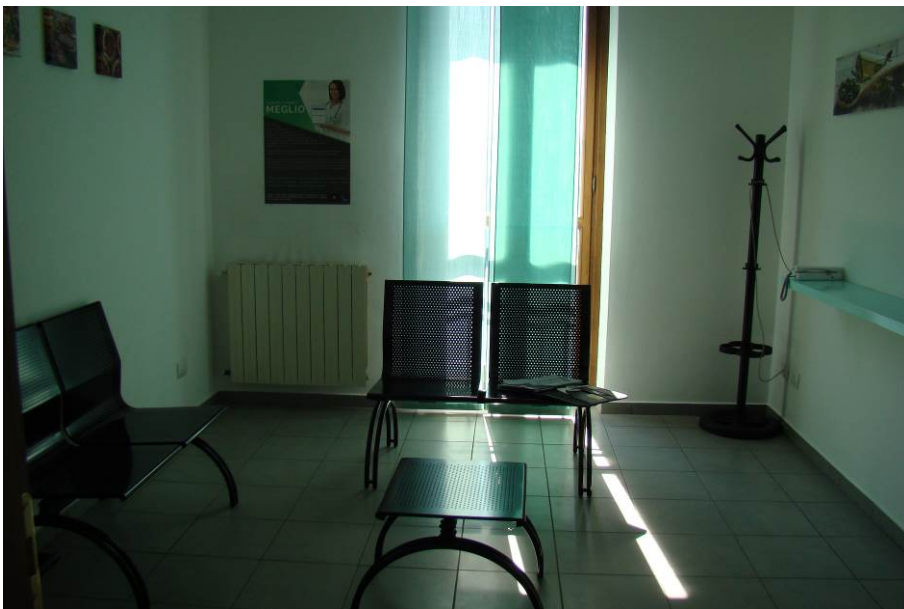
16. Vista dell'altra stanza.