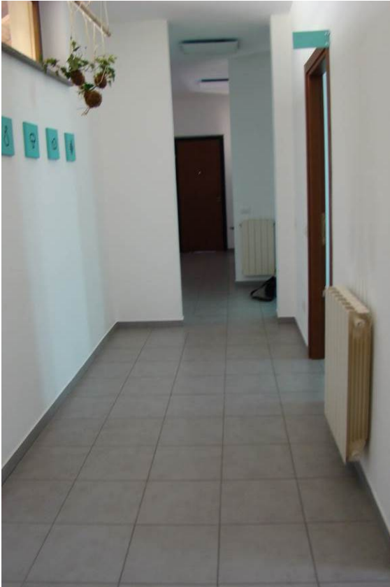
17. Vista del corridoio.