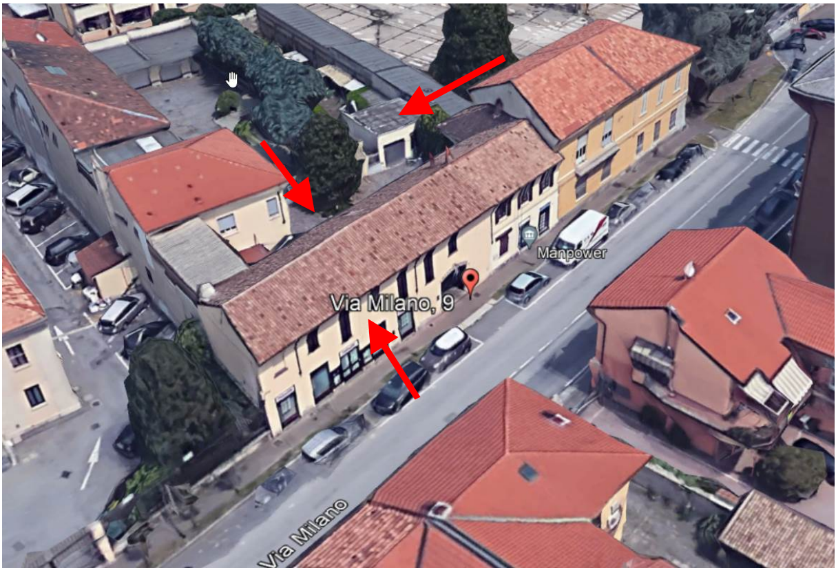
3. Vista aerea del contesto con individuazione degli affacci dell'immobile e del corpo box all'interno del cortile.