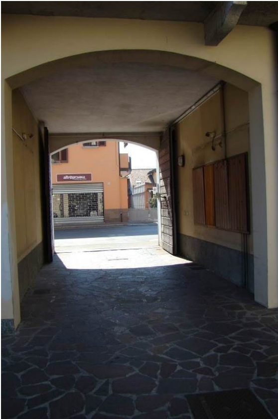
3. Rilievo fotografico del contesto. Dettaglio dell'androne.