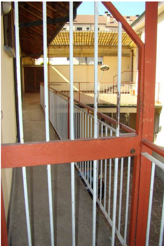
11. Vista del ballatoio a piano primo.