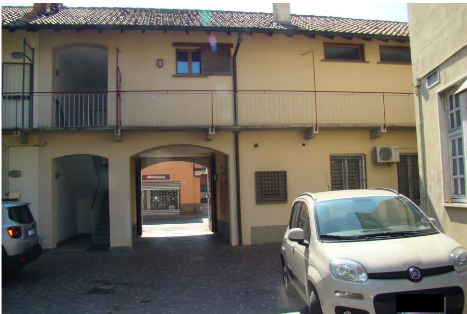
2. Rilievo fotografico del contesto. Vista del cortile interno.