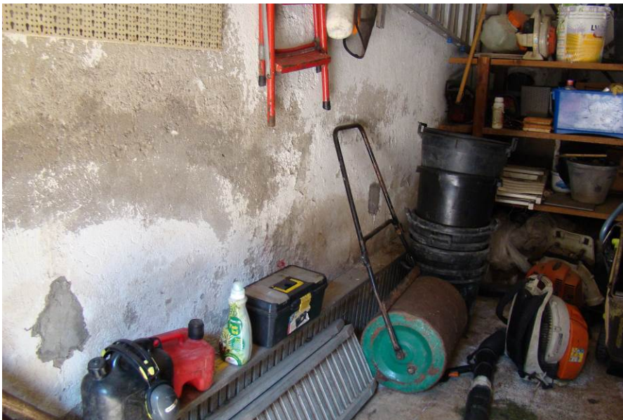
7. Dettaglio dell'interno del box.