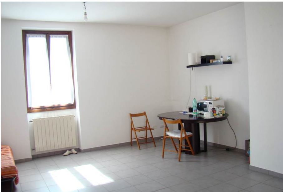
21. Vista della sala.