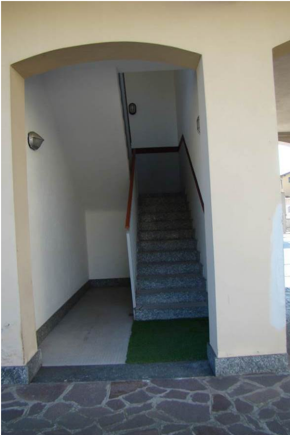
10. Dettaglio della scala comune di accesso al ballatoio del primo piano.