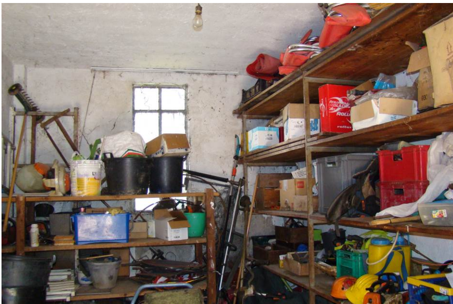
6. Vista interna del box.