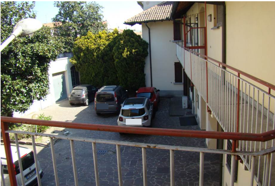
4. Vista del cortile e del corpo box.