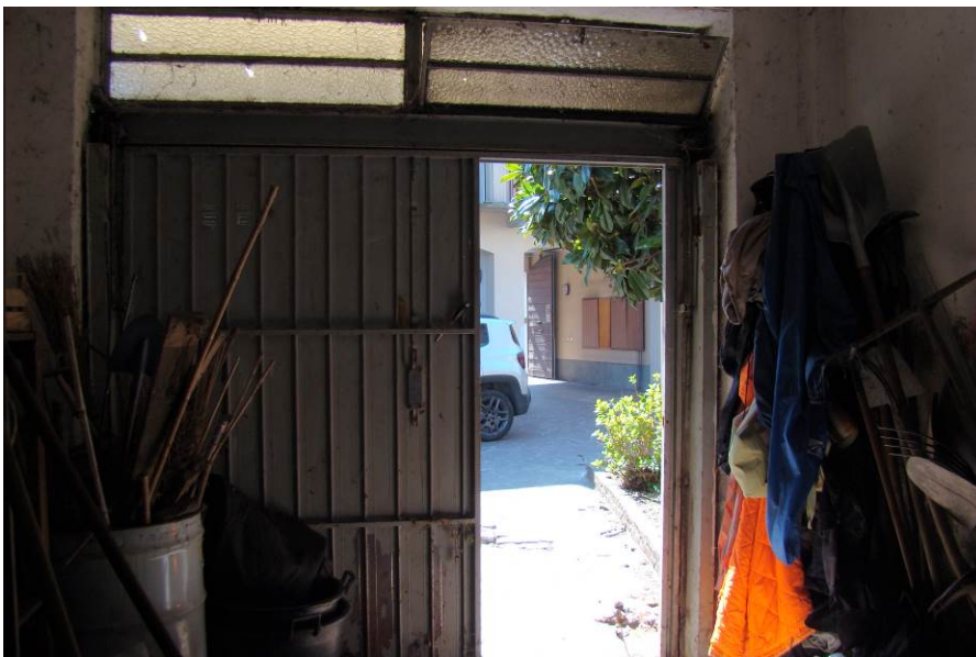
8. Vista del box dall'interno.