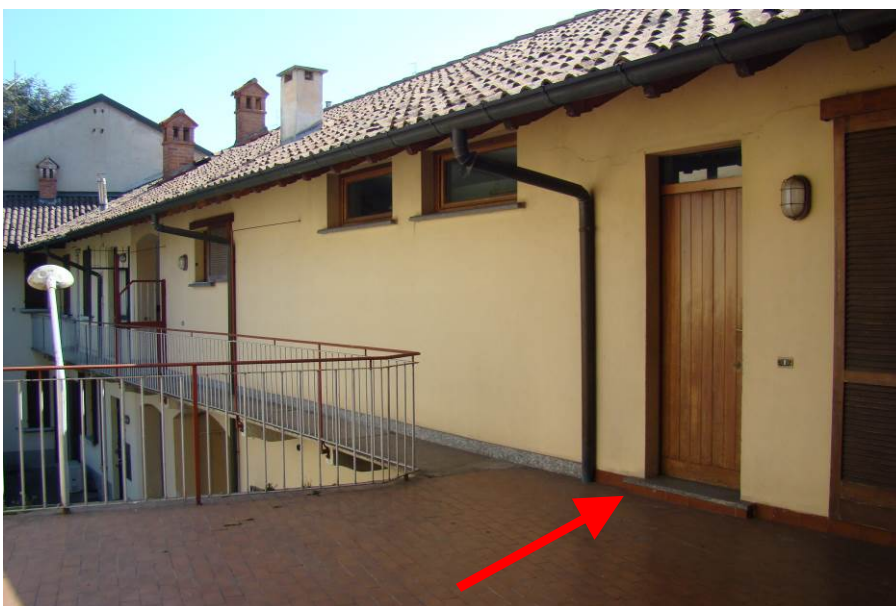
12. Vista del ballatoio e del "vecchio" accesso all'alloggio.