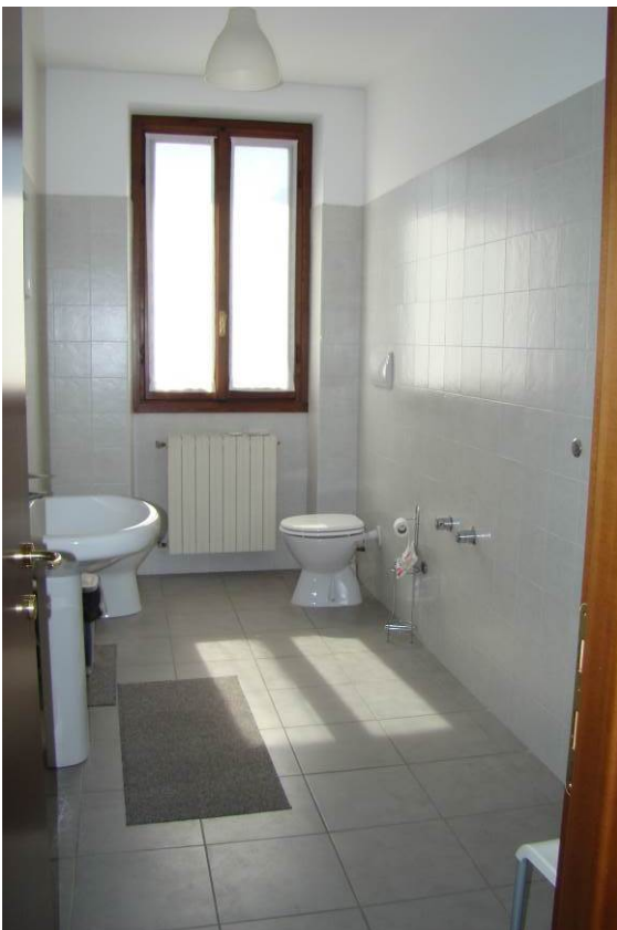
18. Vista del bagno.