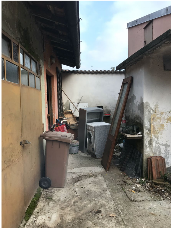
Immagine 15. Il ripostiglio inquadrato dall'esterno.