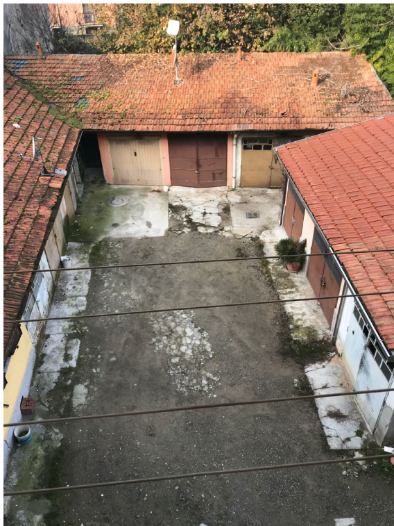
Immagine 20. Il cortile interno inquadrato dall'alto.