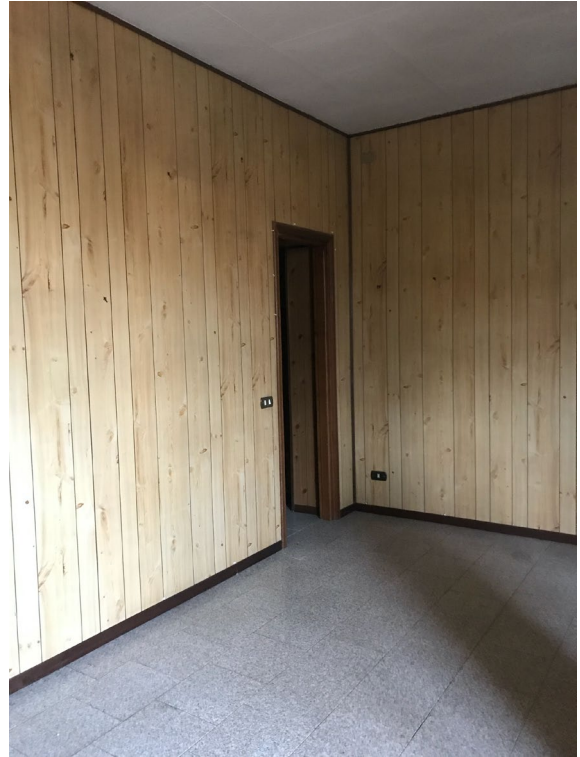
Immagini 21 e 22. Il soggiorno.