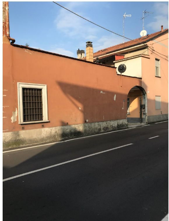
Immagini 3 e 4. Il fabbricato inquadrato da via XXV Aprile, dettaglio della facciata di ingresso e dell'accesso al cortile interno.