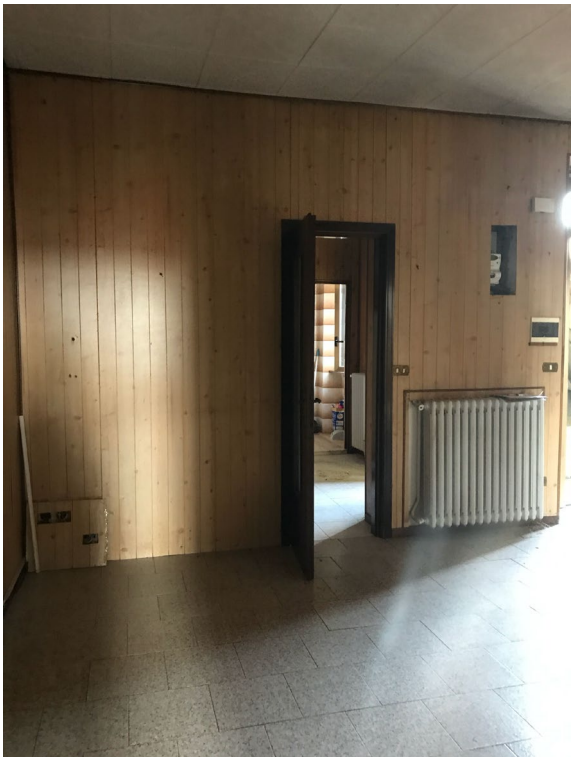
Immagini 22 e 23. Il soggiorno.