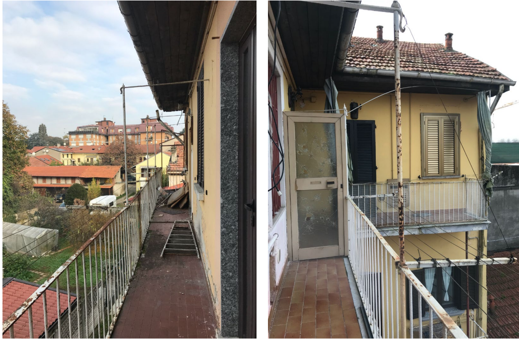
Immagine 18 E 19. Il ballatoio con 'accesso all'unità immobiliare.