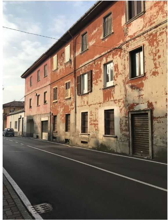
Immagini 1 e 2. Il fabbricato inquadrato da via XXV Aprile.