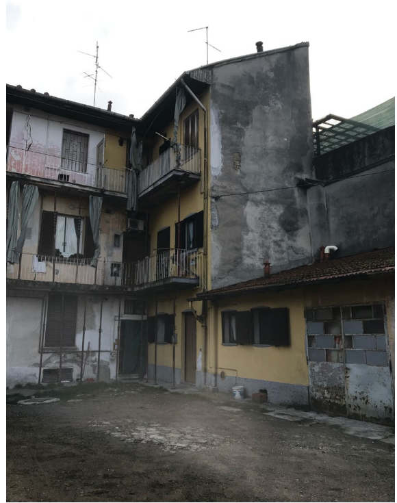
Immagini 11 e 12. Il fabbricato in cui si colloca l'appartamento inquadrato dal cortile interno.