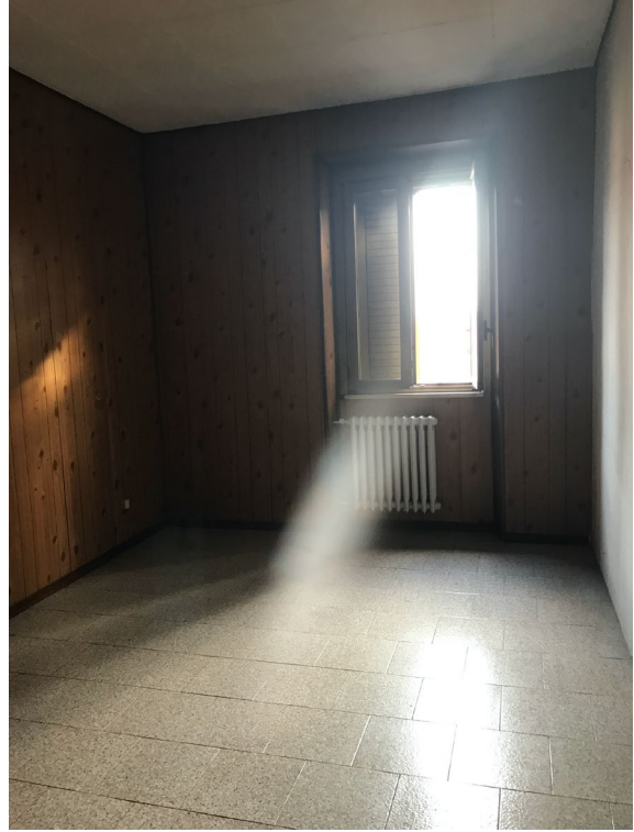
Immagini 24 e 25. Le due camere da letto.