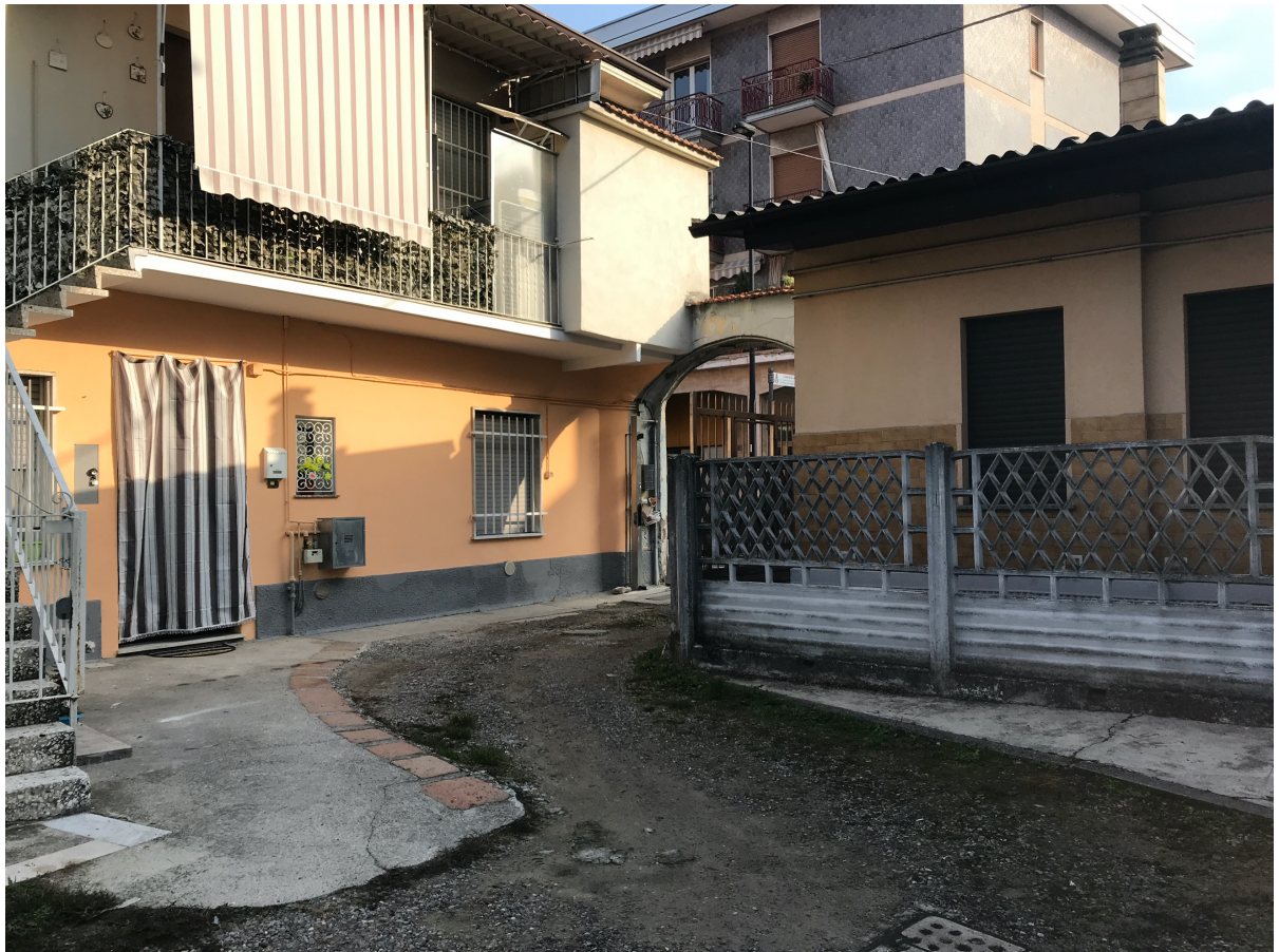
Immagine 10. Il cortile interno.