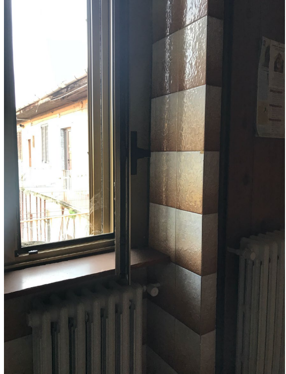
Immagini 32 e 33 Il bagno.