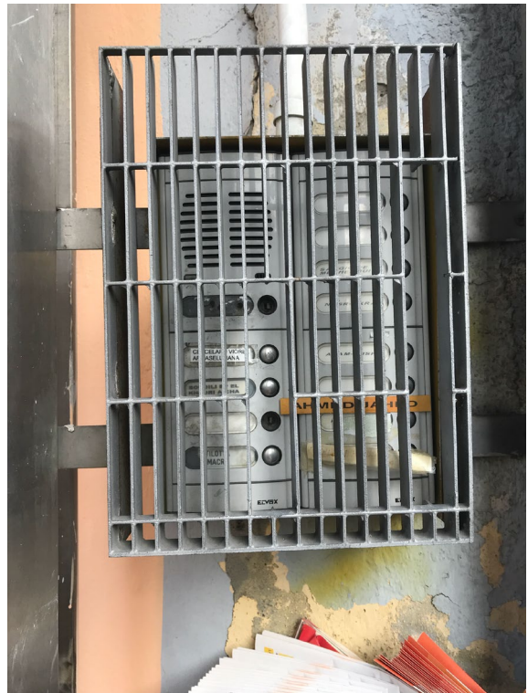
Immagini 7 e 8. Dettaglio del portone di ingresso e dei citofoni.