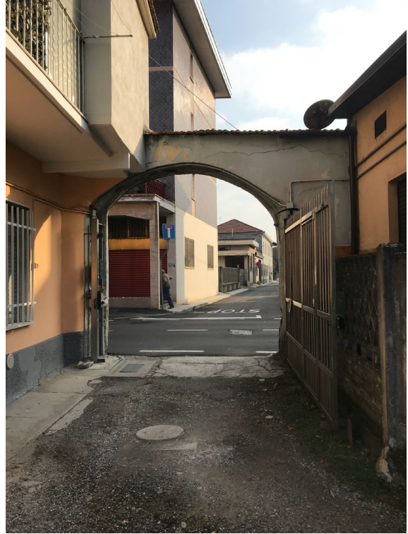
Immagini 5 e 6. Il Portone che consente l'accesso al cortile interno.