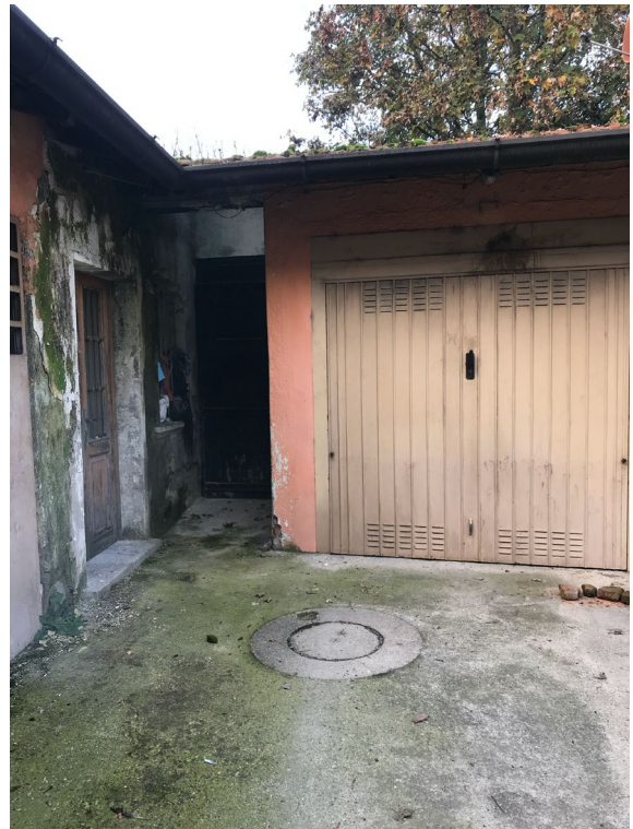
Immagini 13 e 14. I fabbricati in cui si colloca il ripostiglio.