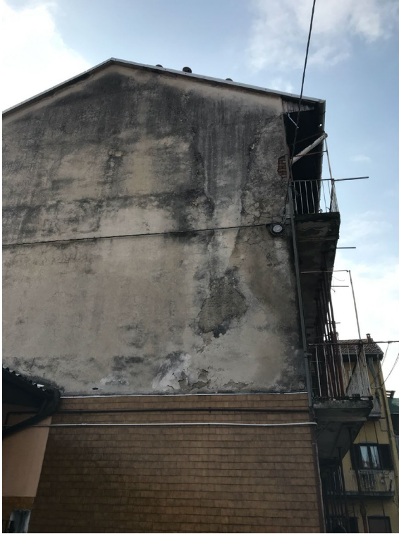
Immagine 9. Il fronte cieco del corpo di fabbrica principale, inquadrato dal cortile interno.