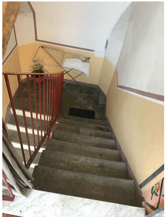
Immagini 16 e 17. La scala che consente di accedere ai diversi livelli del fabbricato.