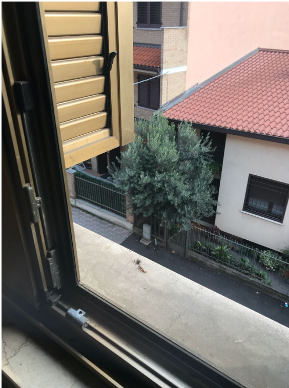
Immagine 26. Dettaglio del serramento esterno.