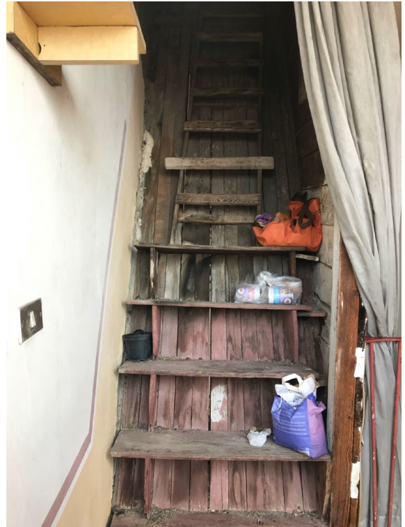
Immagini 36 e 37 La scala che consente l'accesso al sottotetto dal ballatoio del secondo piano.