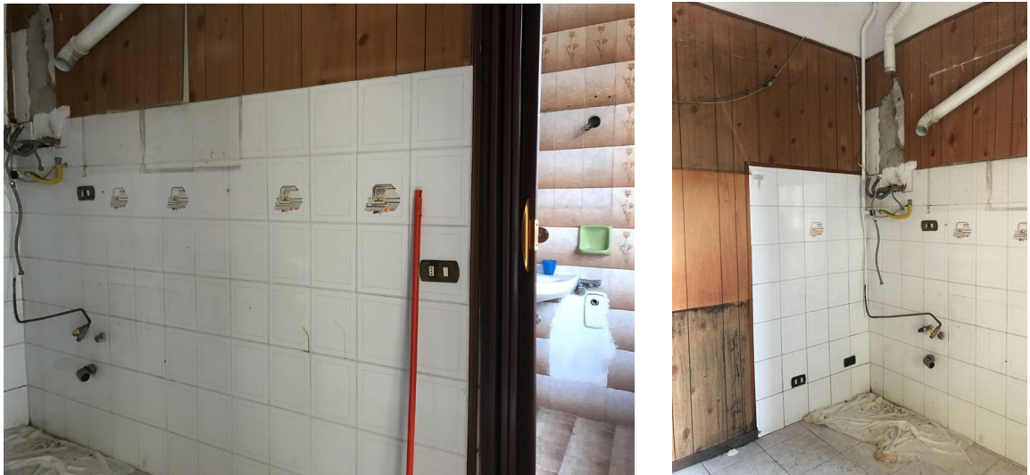
Immagini 28 e 29. La cucina.