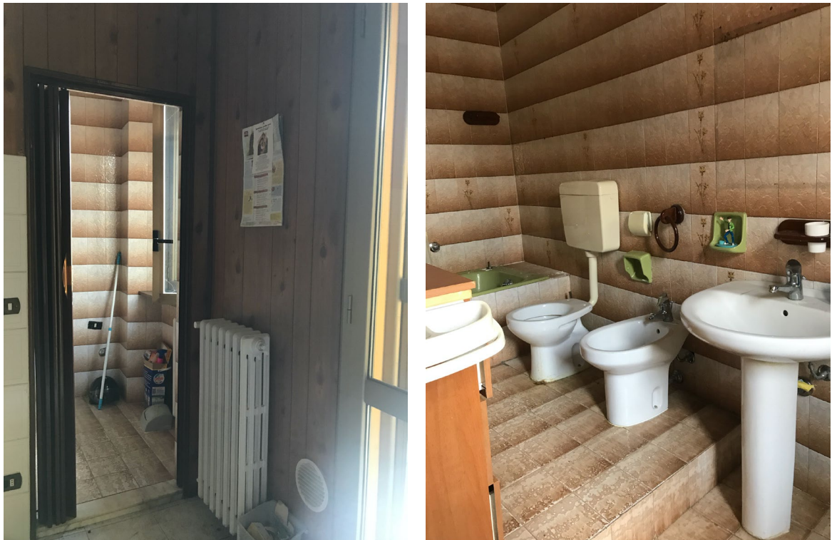
Immagini 30 e 31 La porta che consente l'accesso al bagno dalla cucina e l'interno del bagno.