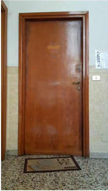
PORTA SUB 2