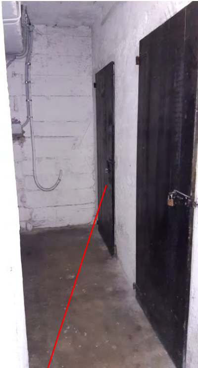
CANTINA SUB 2