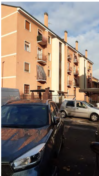
VIA R. SANZIO, 7 - FRONTE