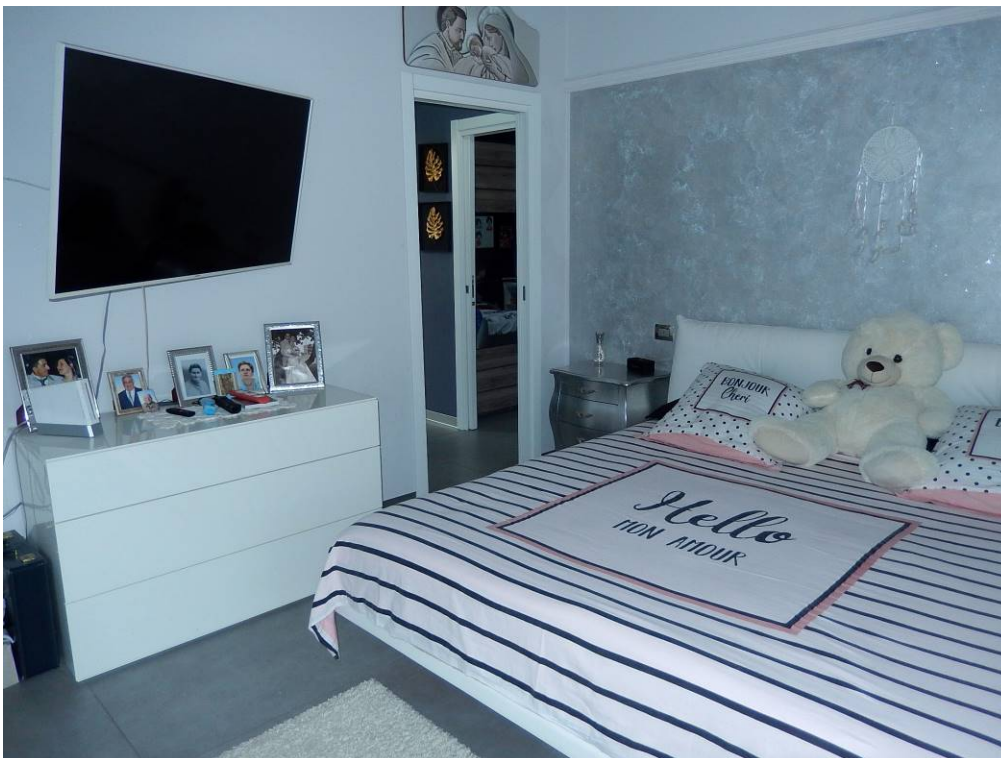
Foto 12 – La camera da letto matrimoniale al piano secondo (sub. 712).