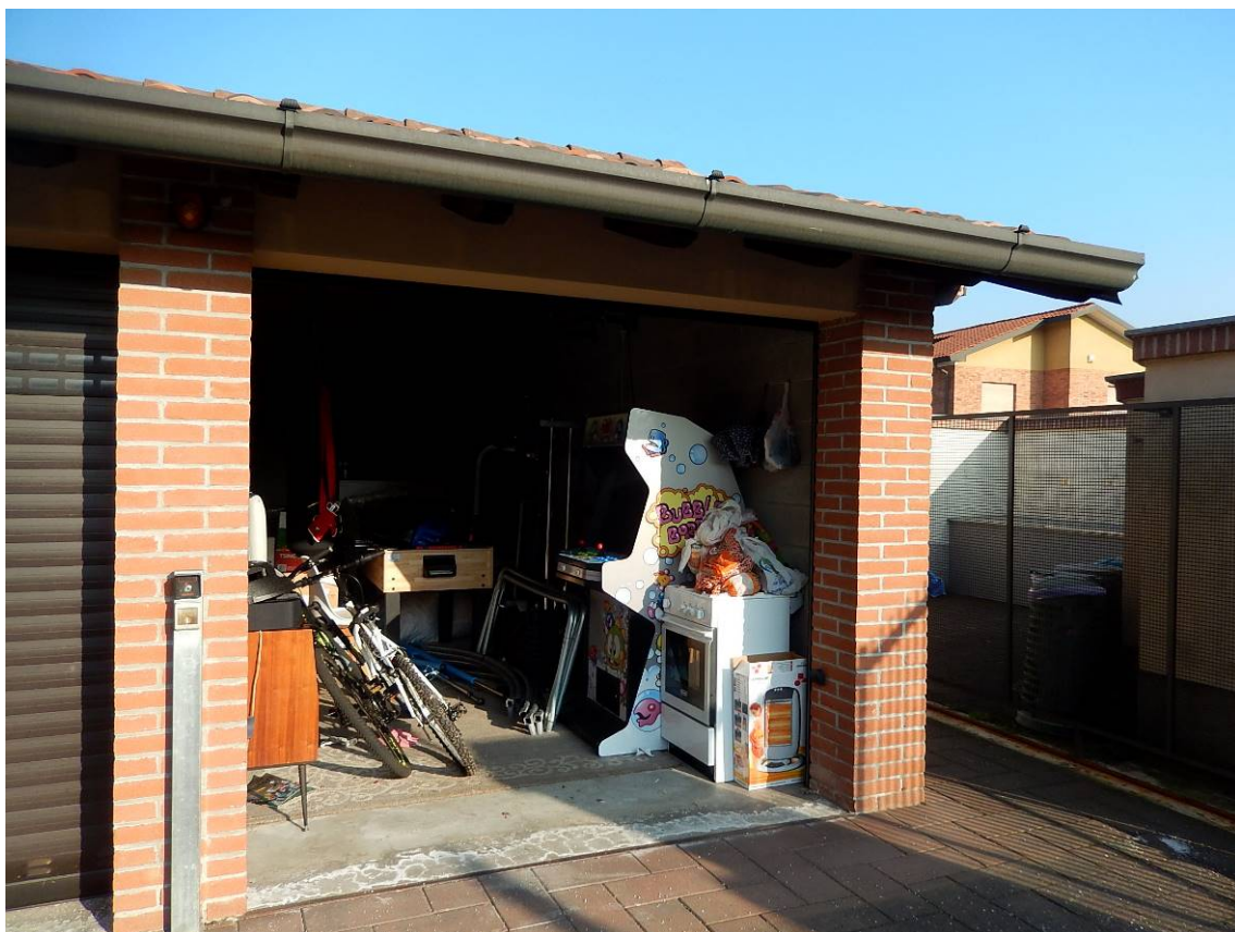
17 – Il box sub. 722.