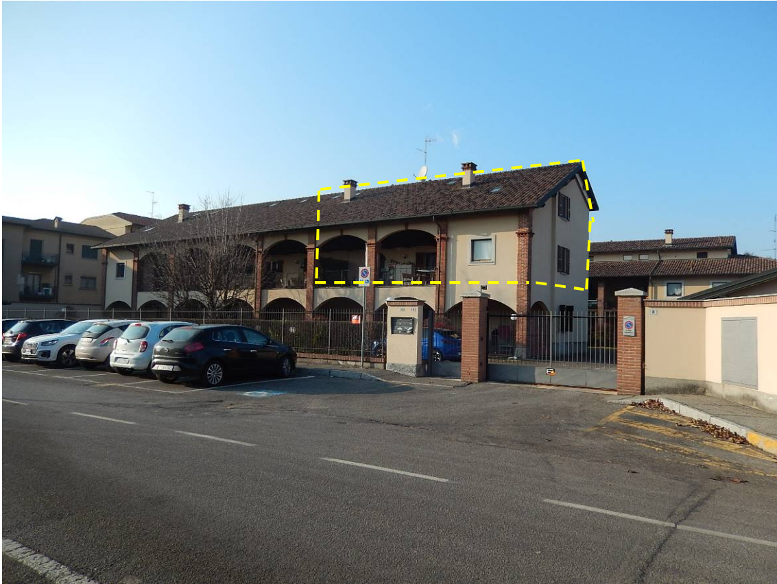
Foto 1 – Vista d'insieme dell'edificio, dalla via De Nicola. L'unità in esame è evidenziata dal tratteggio.