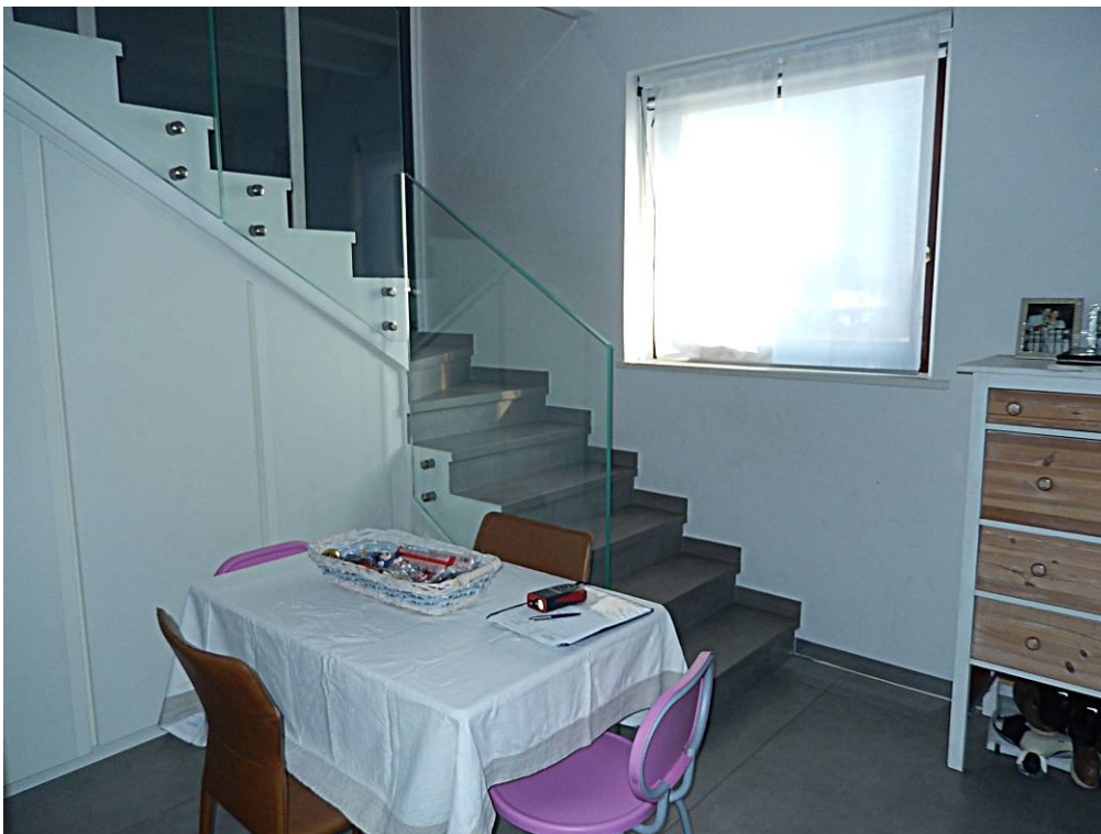
Foto 8 – Il locale hobby al piano primo, con la scala interna di collegamento.