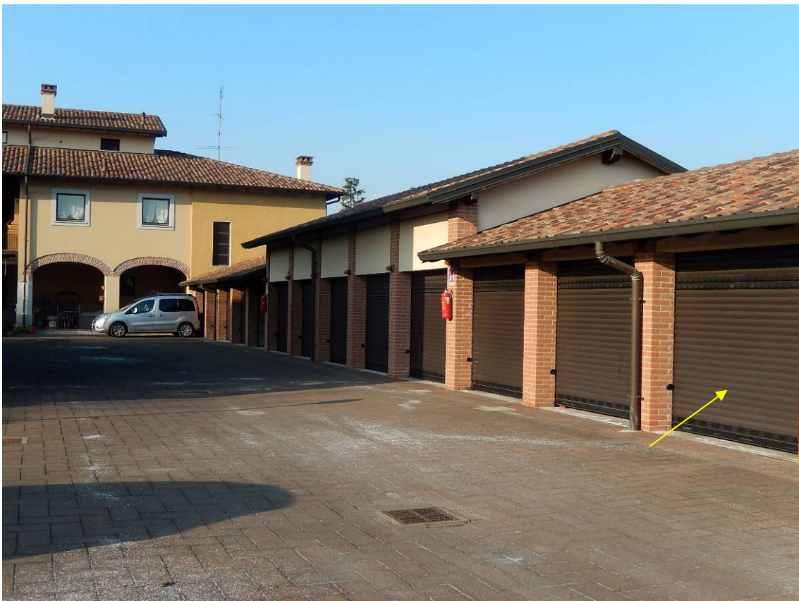
Foto 16 – Altra vista della stecca dei box. Indicato dalla freccia il box 716.