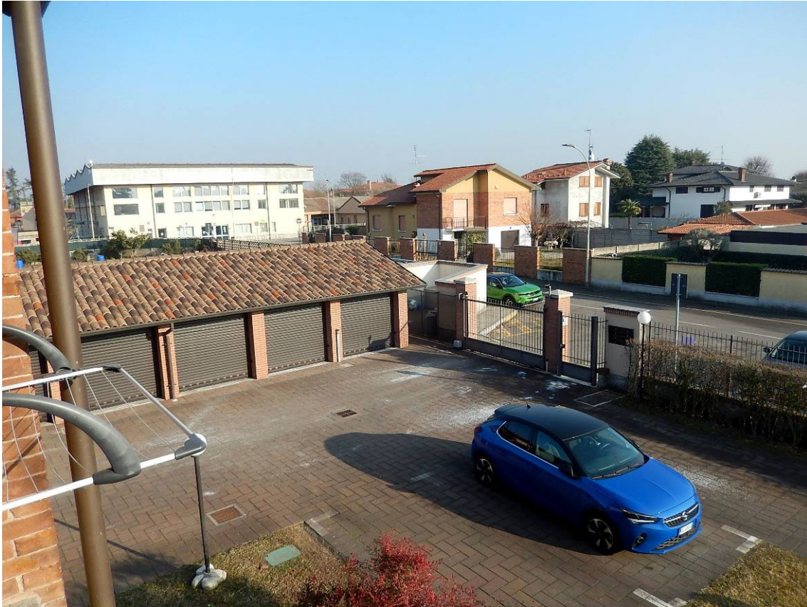
Foto 15 – Vista parziale del cortile con in evidenza la stecca dei box.