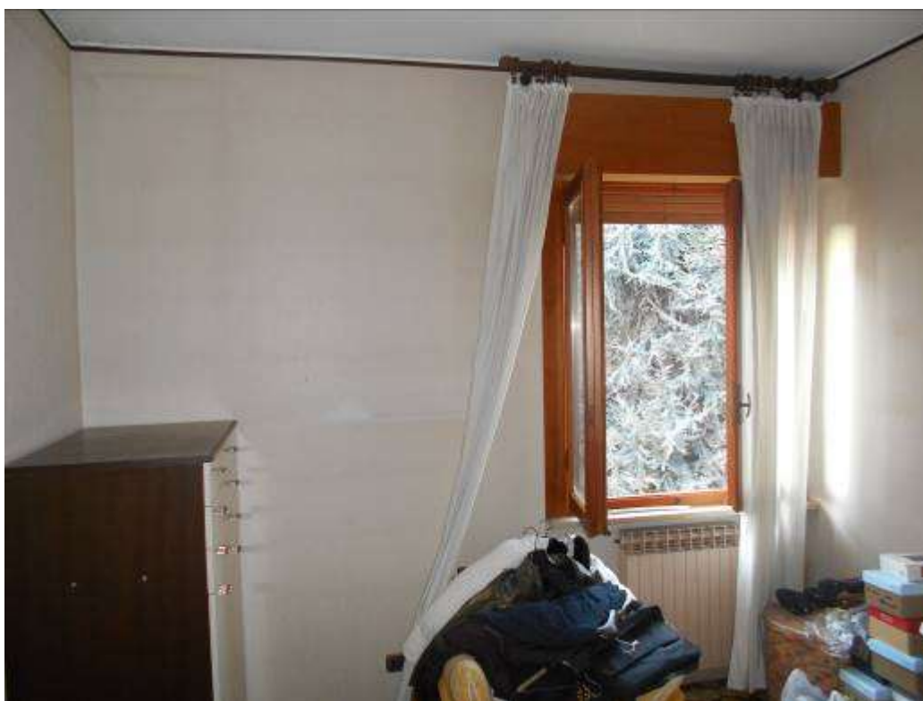
Camera con finestra sul vialetto