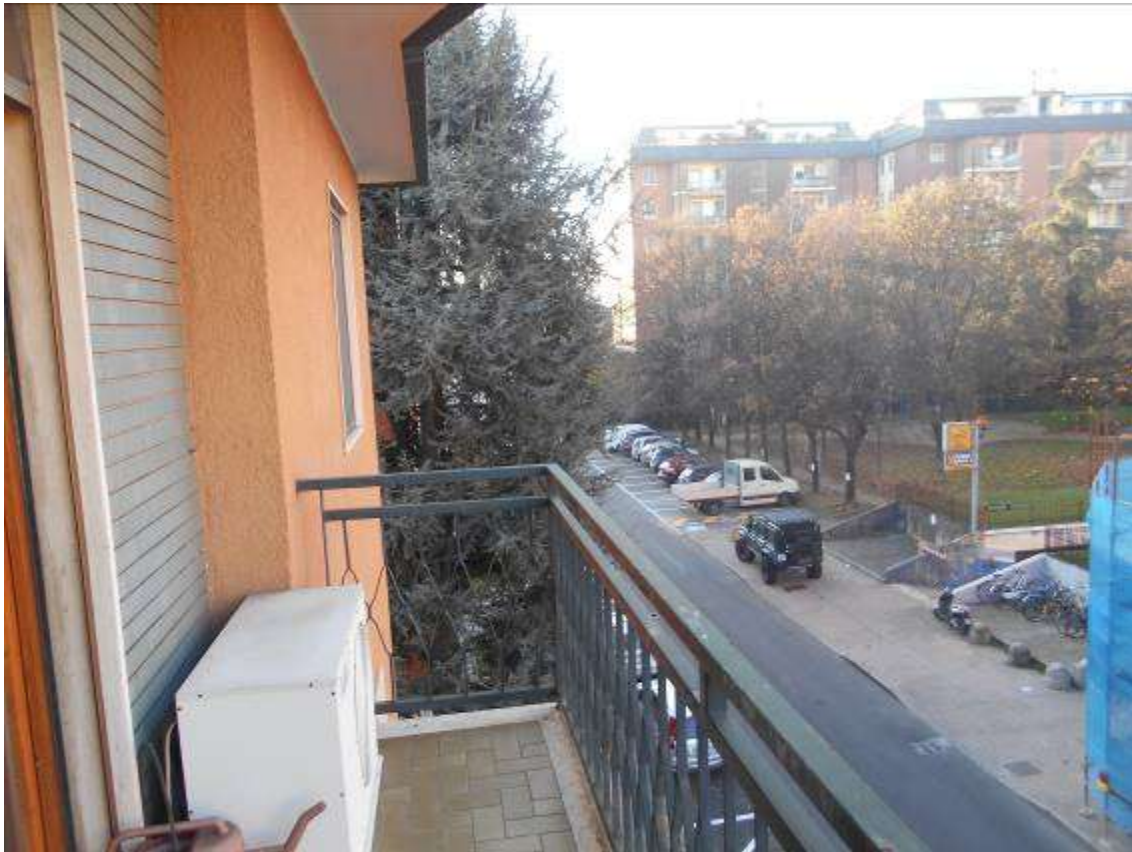
Vedute dai balconi