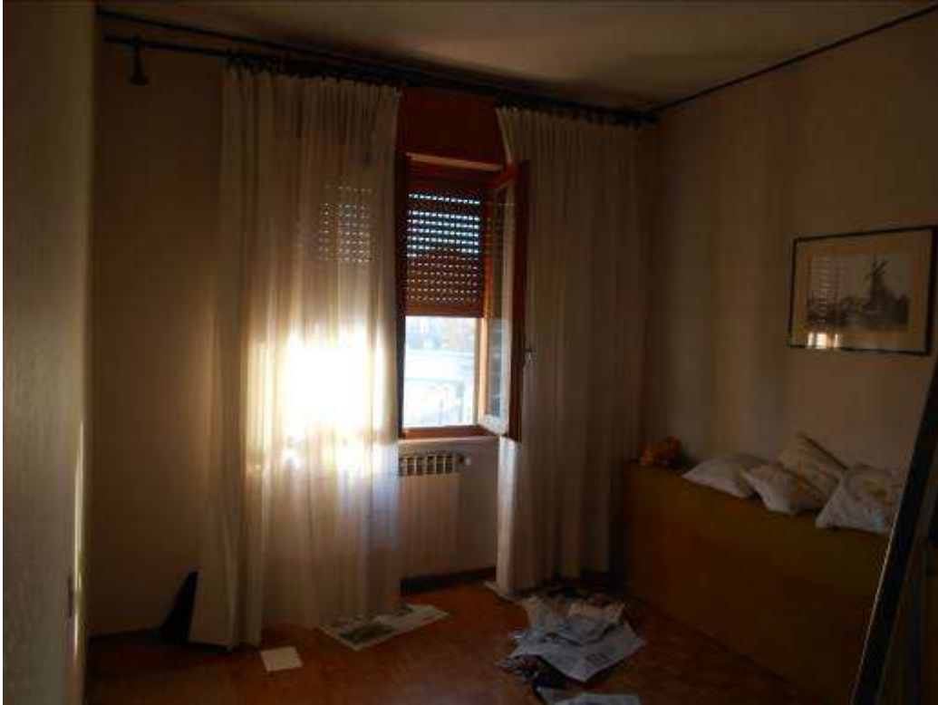
Camera con finestra sul retro