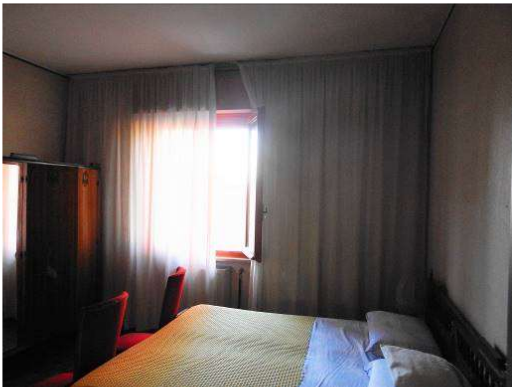
Camera con finestra sulla strada