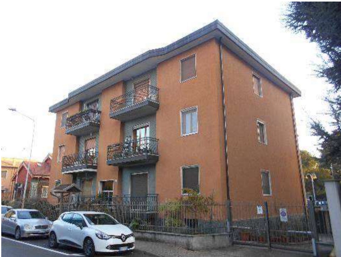
Opera Via Mazzini 18 – complesso condominiale