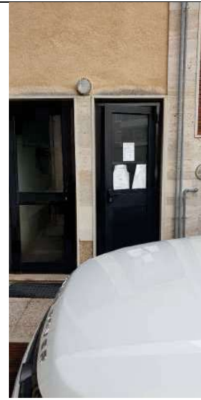
Porta ingresso cantinato