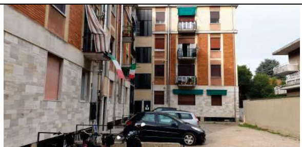
Cortile lato Sud