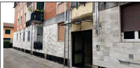
Prospetto lato strada