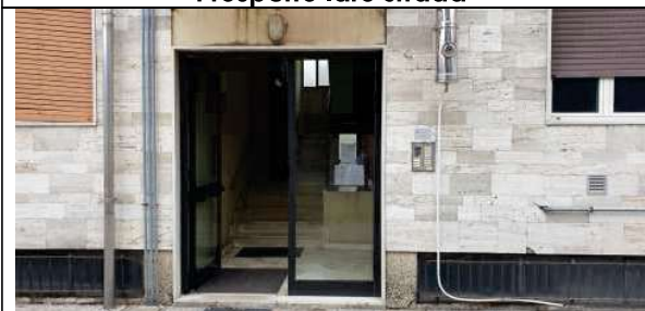
Portone di ingresso lato Nord