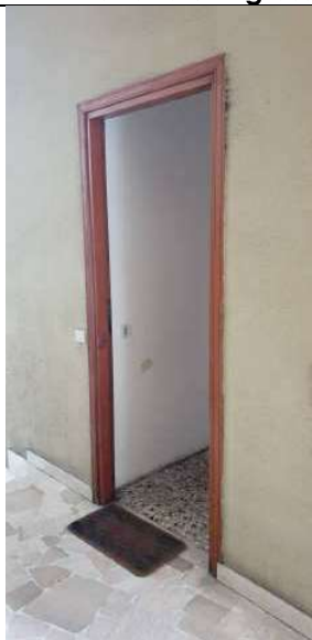
Porta di ingresso