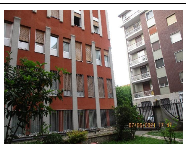
Vista dei serramenti delle unità dal cortile comune