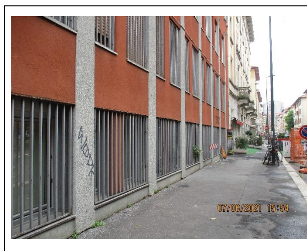
Vista dei serramenti delle unità verso Via Barrili

Principali collegamenti pubblici: tram linea 3, MM2 fermata Abbiategrasso