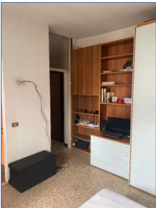
Foto 21 - zona giorno-notte