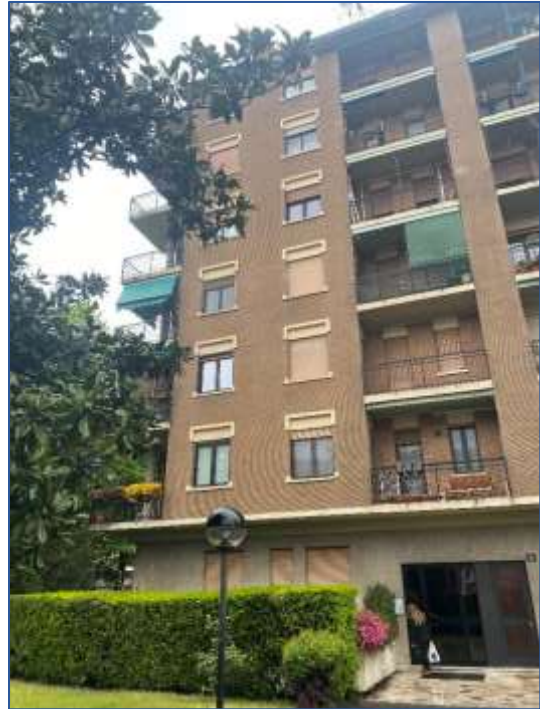
Foto 2 - immobile di via Zurigo n. 16