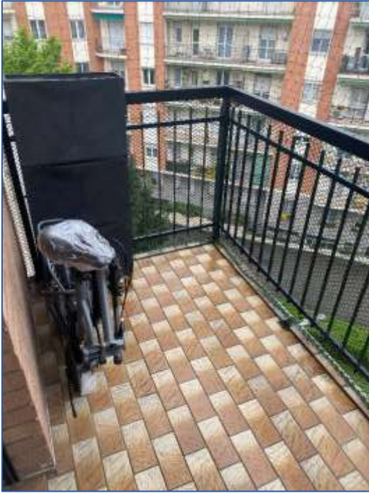
Foto 29 - balcone