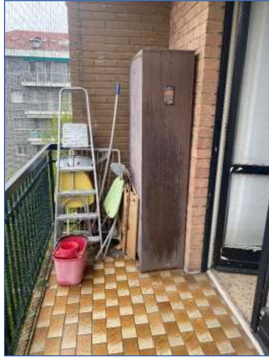
Foto 30 - balcone