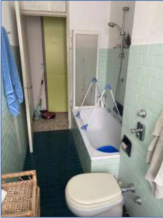
Foto 25 - bagno