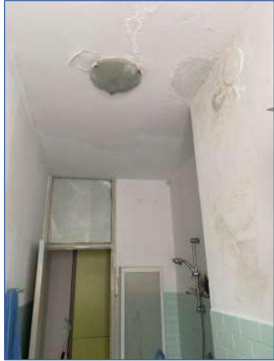
Foto 26 - bagno