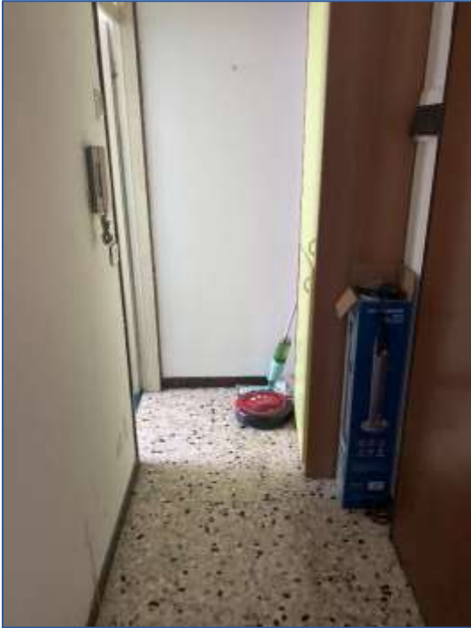
Foto 13 - ingresso appartamento