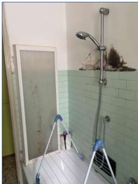
Foto 24 - bagno