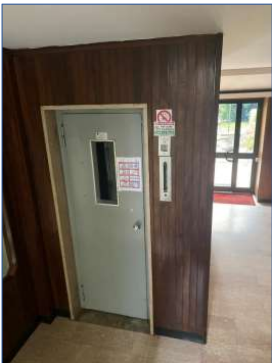
Foto 7 - ascensore comune