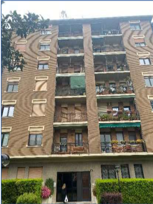
Foto 1 - immobile di via Zurigo n. 16