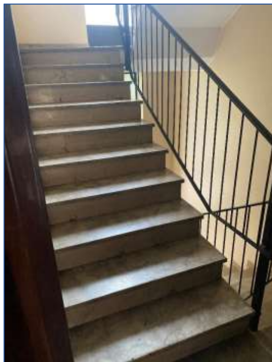
Foto 8 - vano scala comune