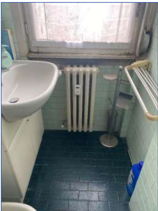
Foto 23 - bagno