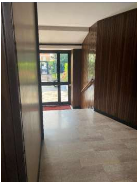
Foto 5 - spazi comuni di ingresso