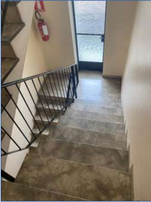
Foto 9 - vano scala comune