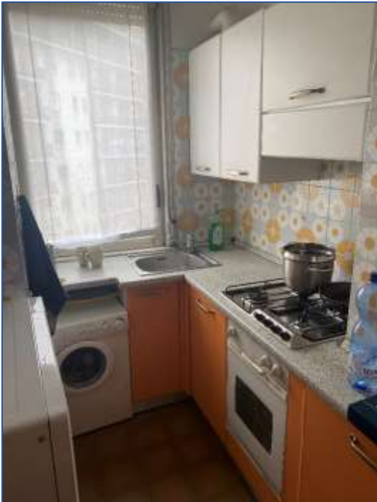
Foto 15 - cucina