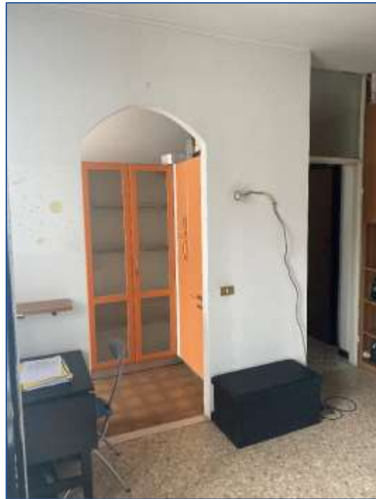
Foto 20 - zona giorno-notte