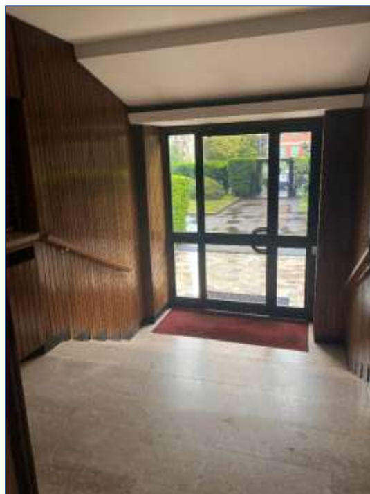
Foto 6 - spazi comuni di ingresso