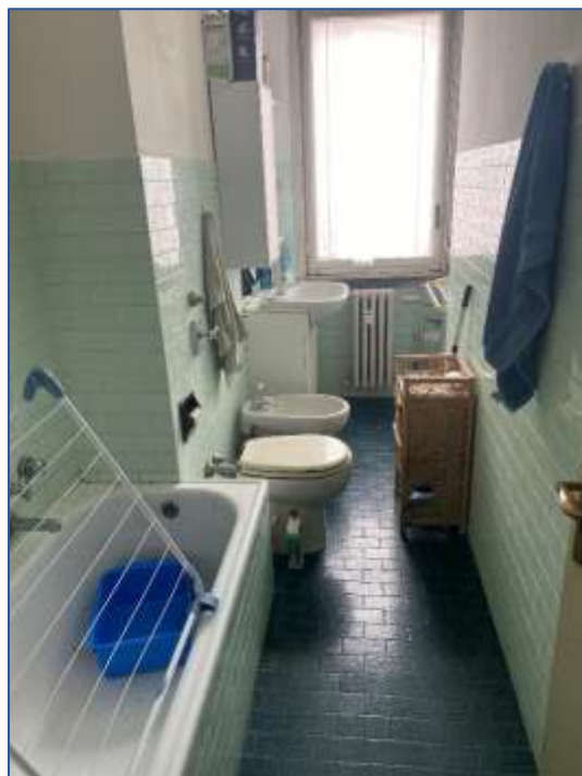
Foto 22 - bagno