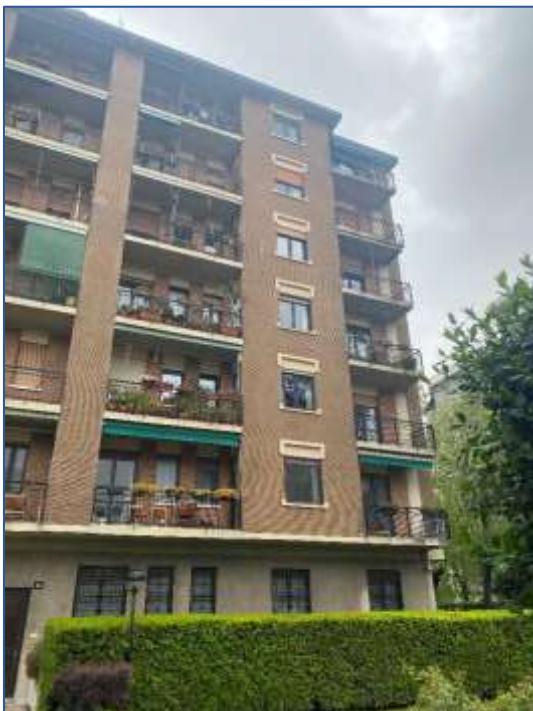
Foto 3 - immobile di via Zurigo n. 16