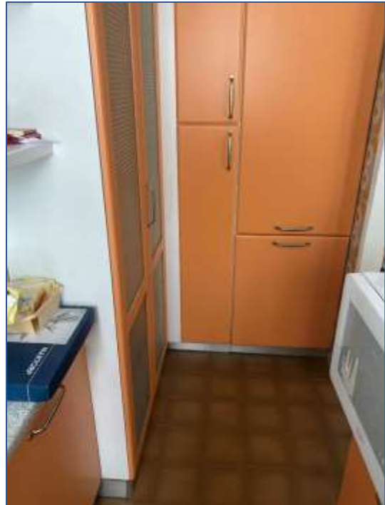
Foto 16 - cucina