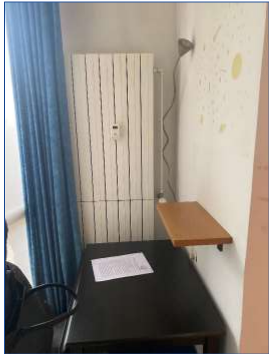
Foto 28 - dettaglio impianto