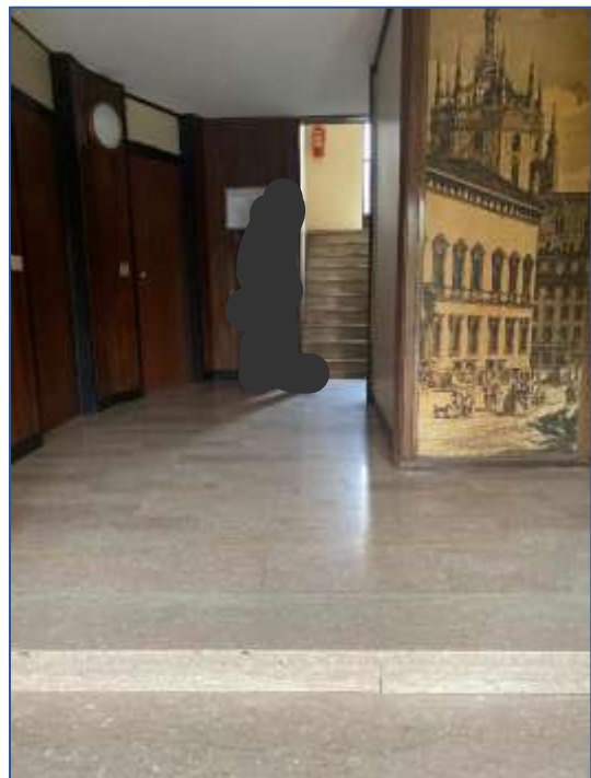
Foto 4 - spazi comuni di ingresso