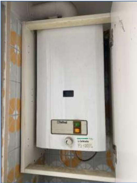
Foto 27 - dettaglio impianto