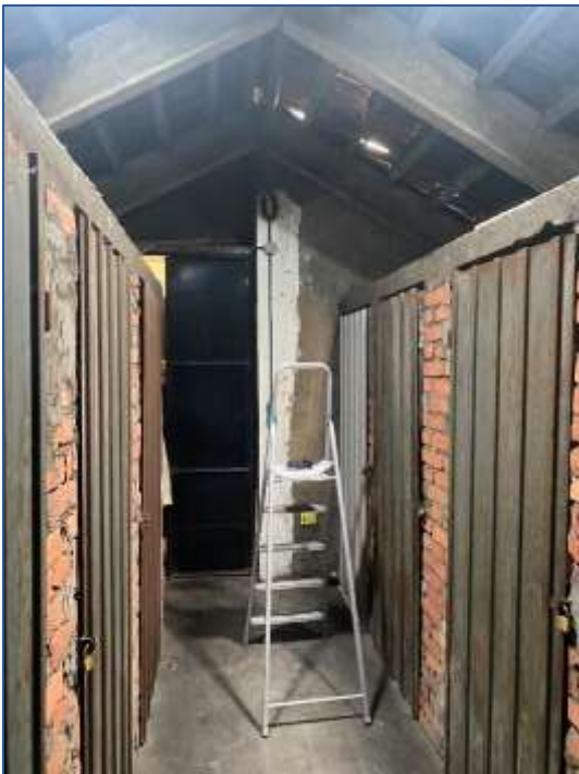
Foto 11 - spazi comuni piano sottotetto