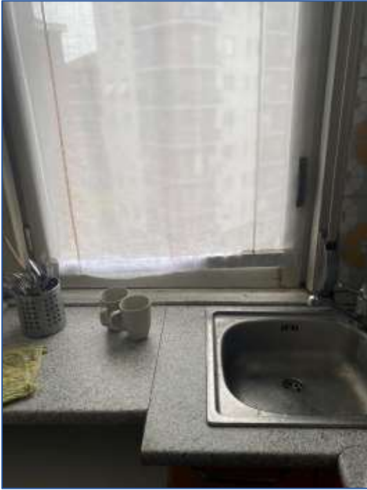
Foto 17 - cucina