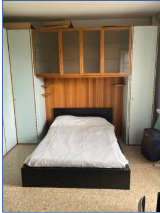
Foto 18 - zona giorno-notte