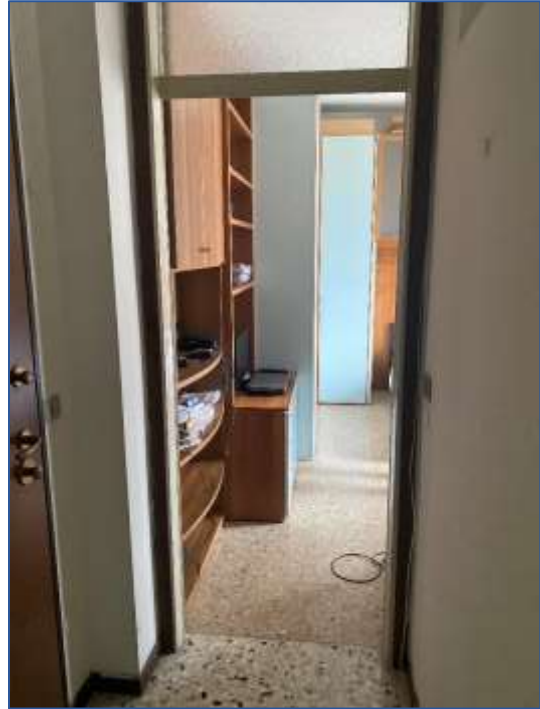
Foto 14 - ingresso appartamento