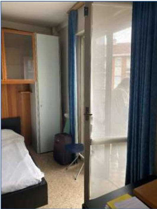
Foto 19 - zona giorno-notte