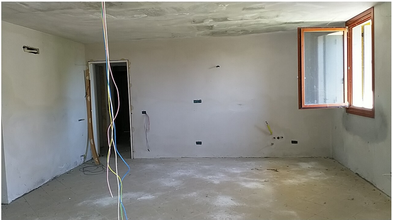
Sesto al Reghena, via Buse – Il soggiorno - pranzo.