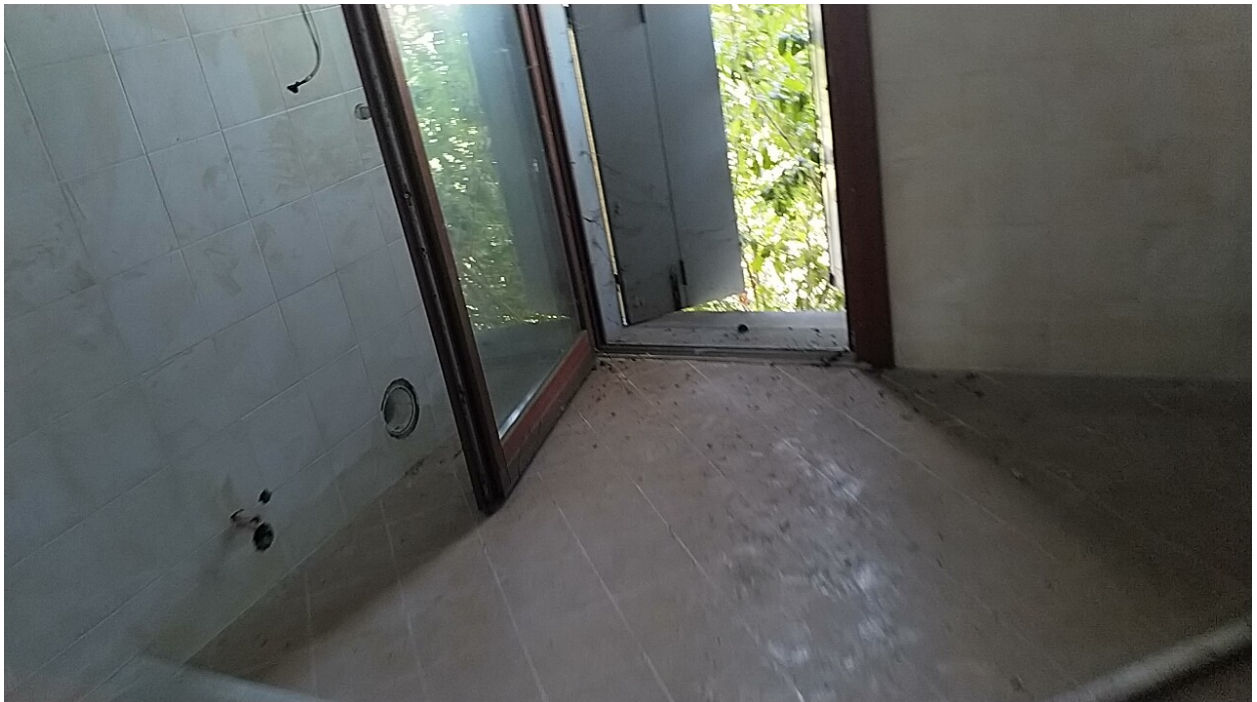
Sesto al Reghena, via Buse – Il bagno e le infiltrazioni dal soffitto e dalla tamponatura.