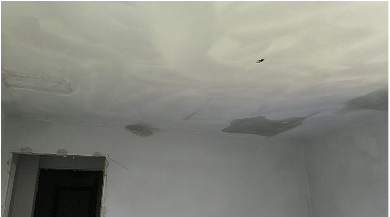
Sesto al Reghena, via Buse – La camera matrimoniale e le infiltrazioni dal soffitto e dalle tamponature.