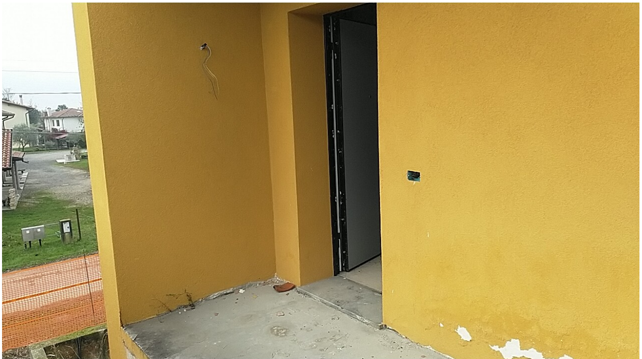
Sesto al Reghena, via Buse – Il prospetto ad ovest delle immobile 3 e l'accesso all'immobile .