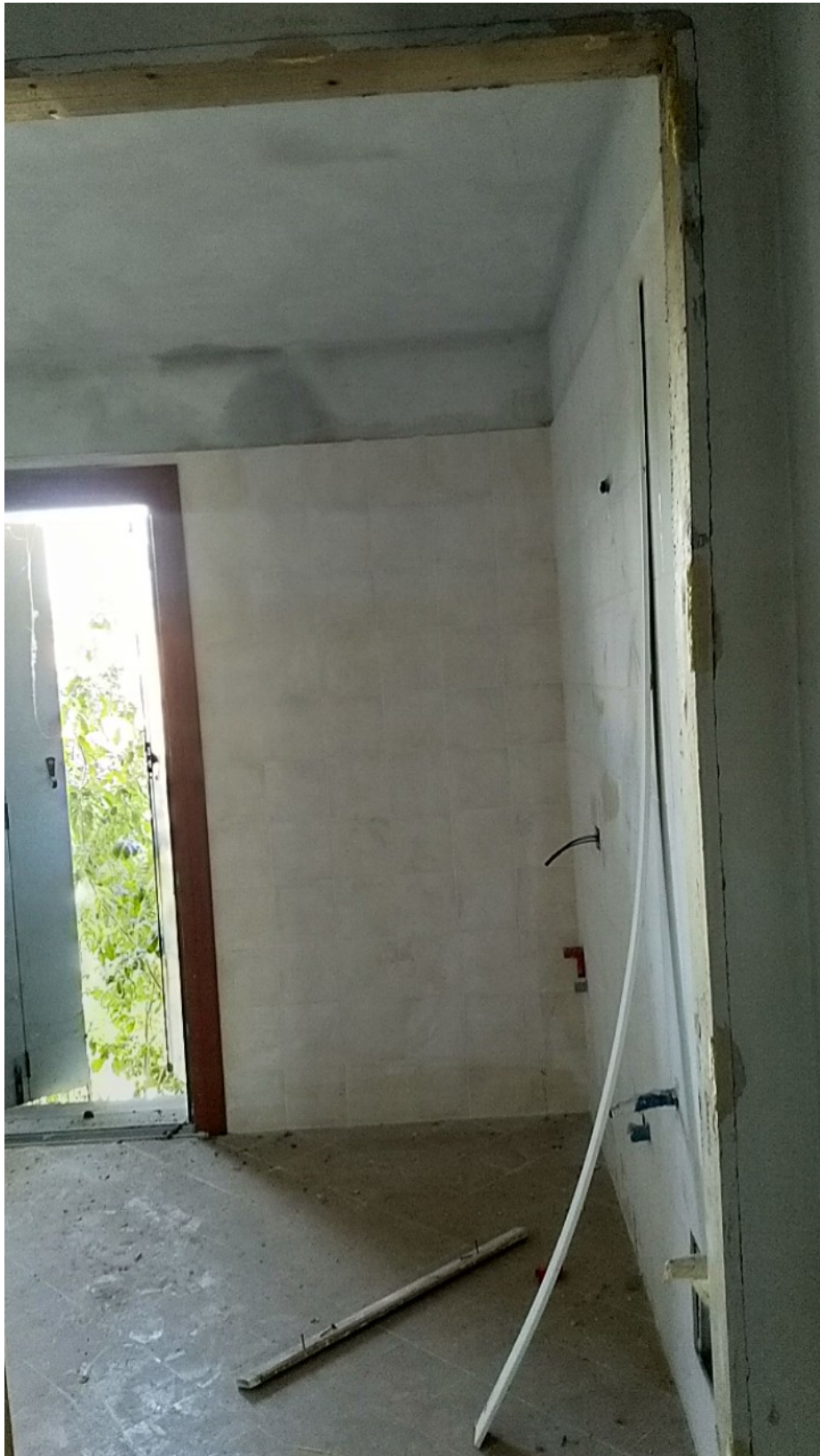
Sesto al Reghena, via Buse – Il bagno e le infiltrazioni dal soffitto e dalla tamponatura.