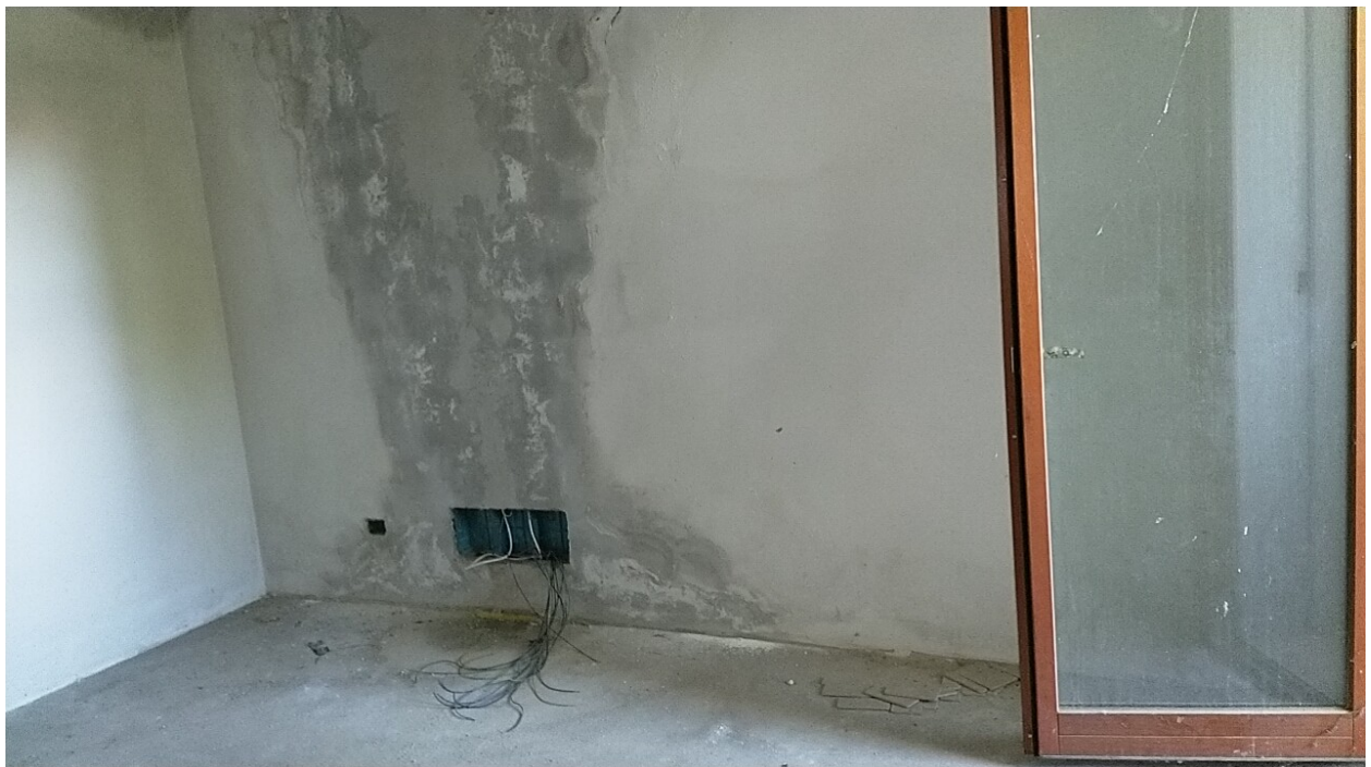
Sesto al Reghena, via Buse – La camera singola, danni da infiltrazione di acqua meteorica.