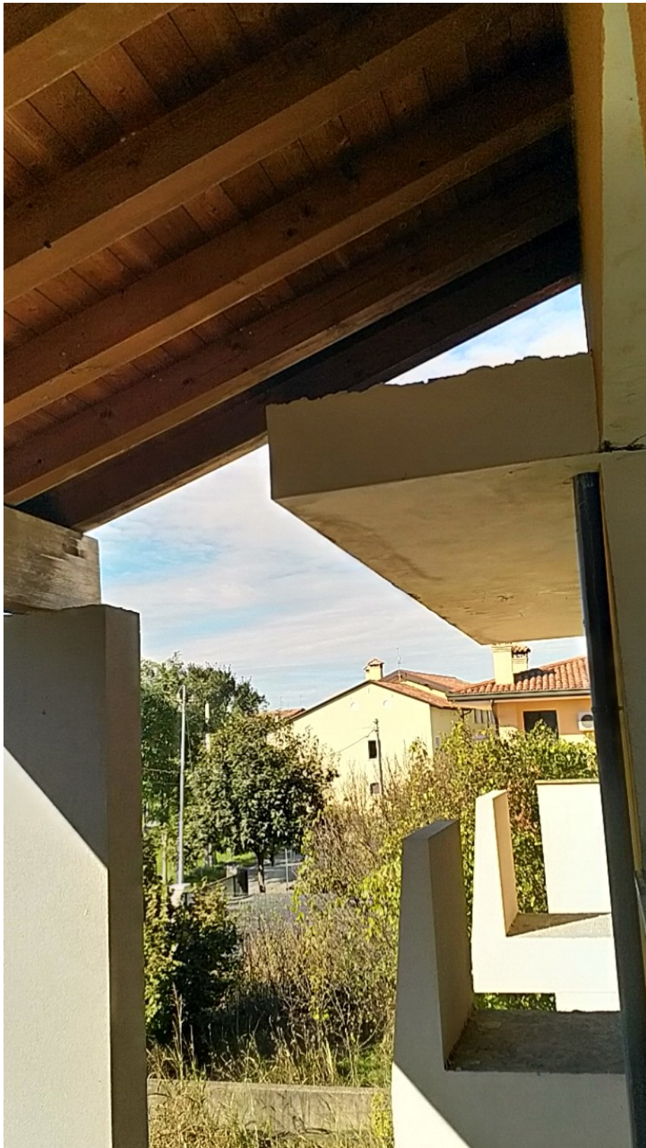
Sesto al Reghena, via Buse – Particolare dei poggioli.