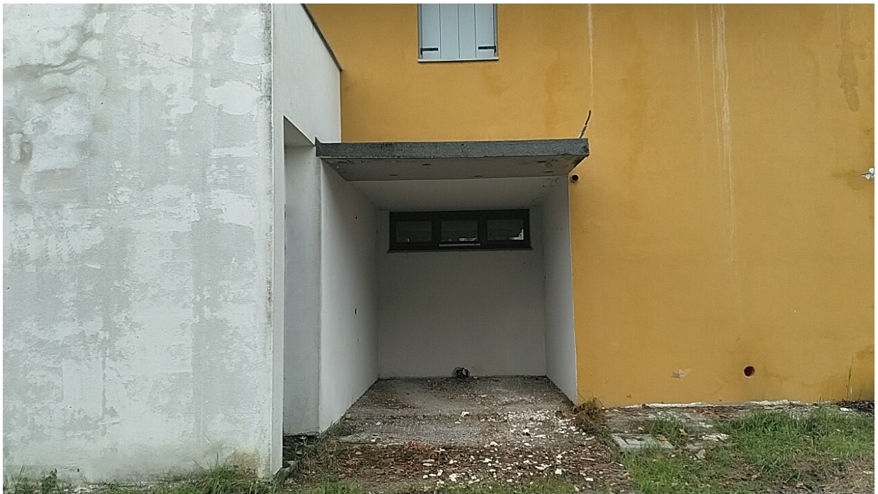
Sesto al Reghena, via Buse – Il posto auto.