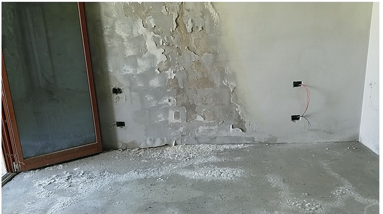
Sesto al Reghena, via Buse – La camera matrimoniale e le infiltrazioni dal soffitto e dalle tamponature.