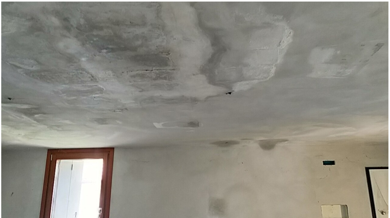
Sesto al Reghena, via Buse – Il soggiorno – pranzo, infiltrazioni dal soffitto.