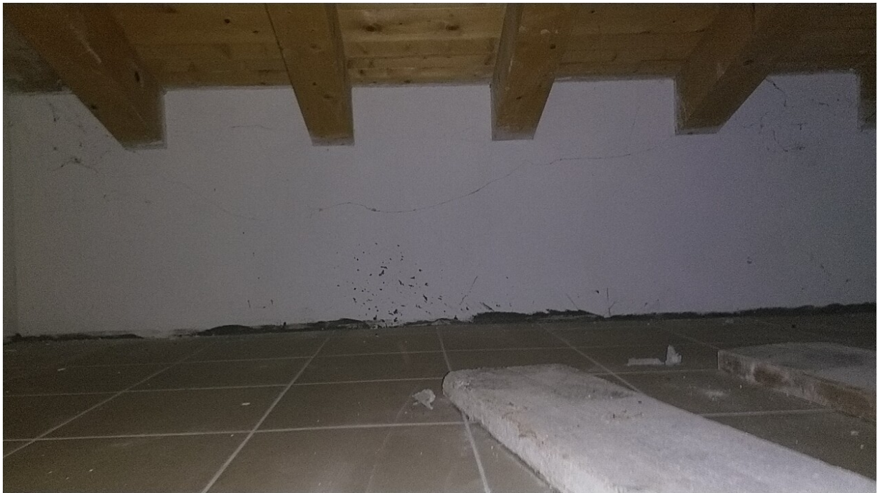
Sesto al Reghena, via Buse – Sottotetto praticabile.