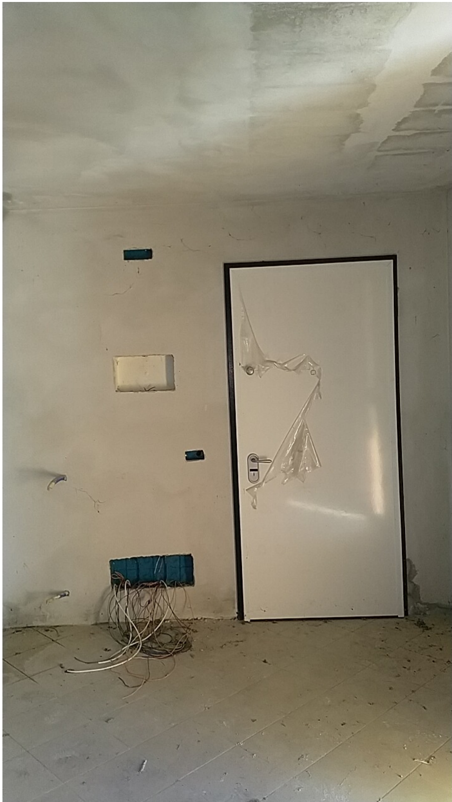
Sesto al Reghena, via Buse – Particolare della portoncino blindato.