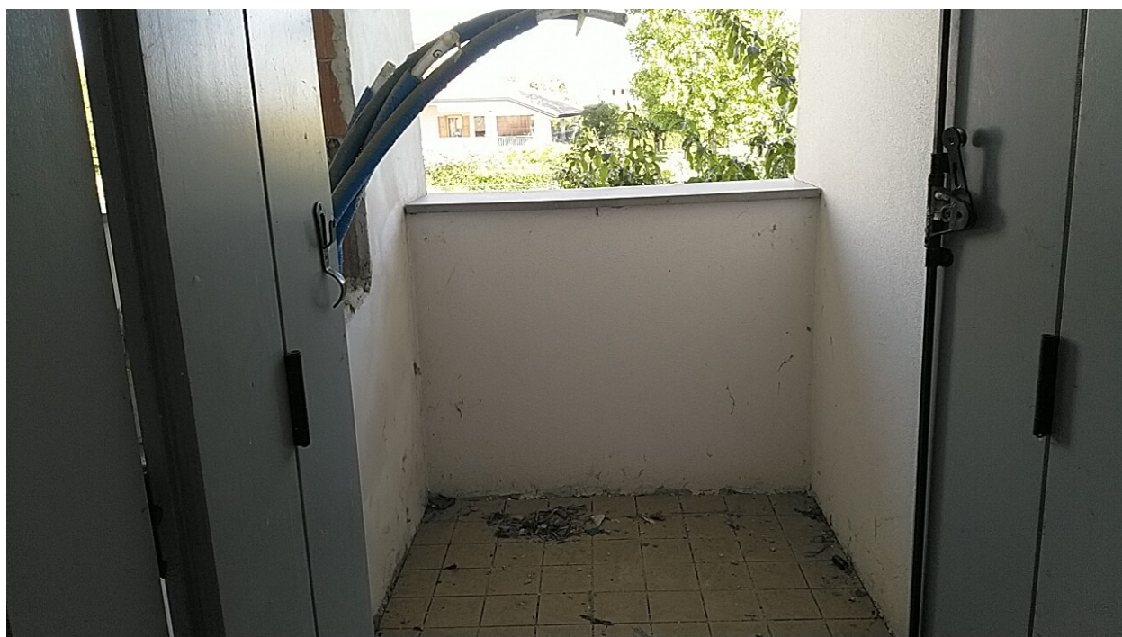
Sesto al Reghena, via Buse – Sopra il vano per l'installazione della caldaia e dei collettori, la soglia di marmo del davanzale della loggia n. 1.