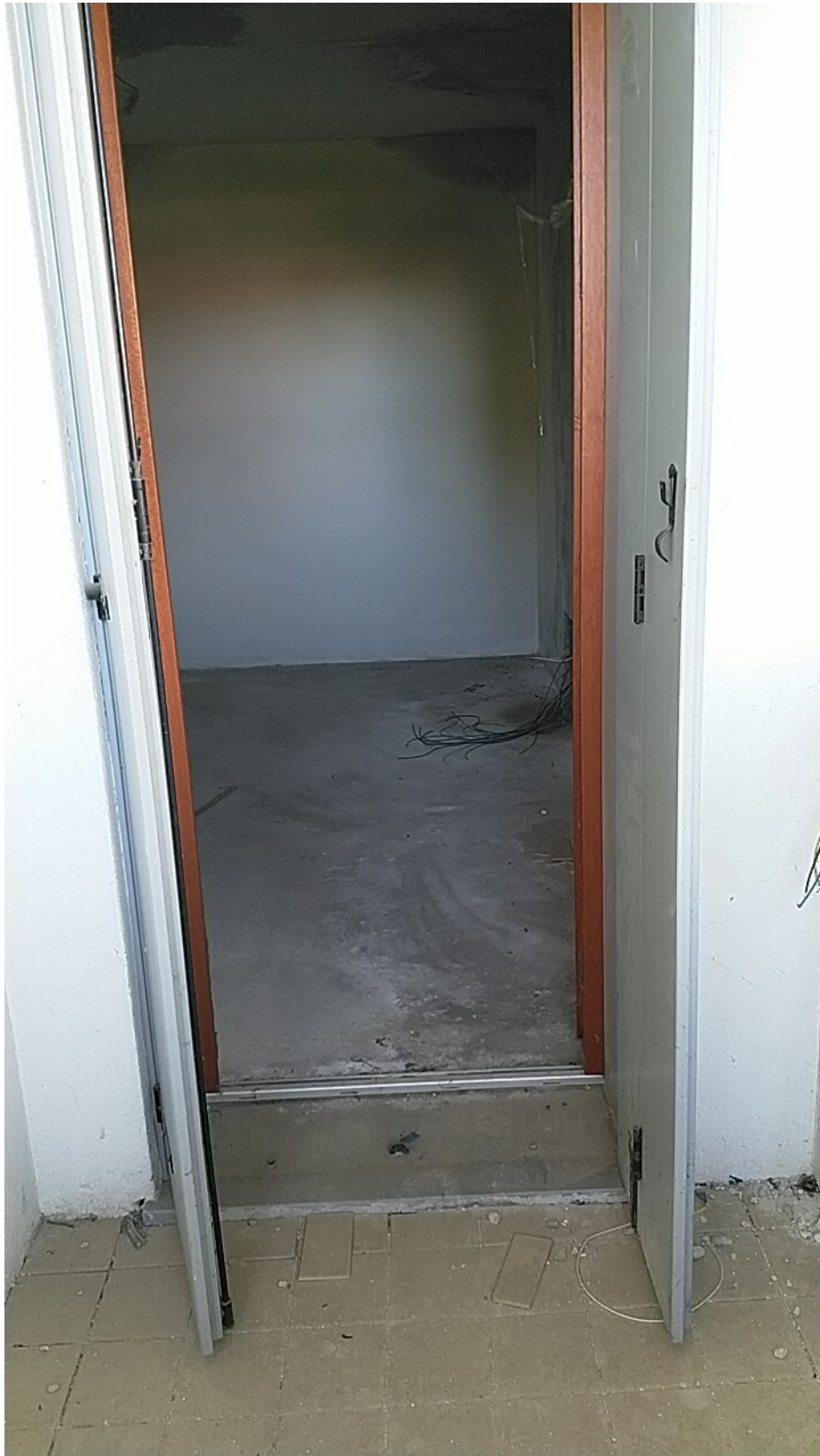
Sesto al Reghena, via Buse – La loggia.