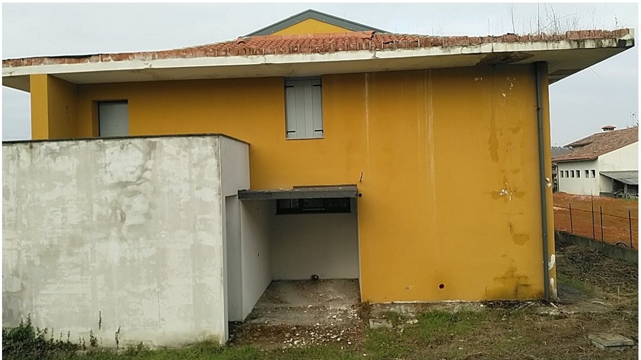
Sesto al Reghena, via Buse – Danni alla copertura e alle tramezzature.