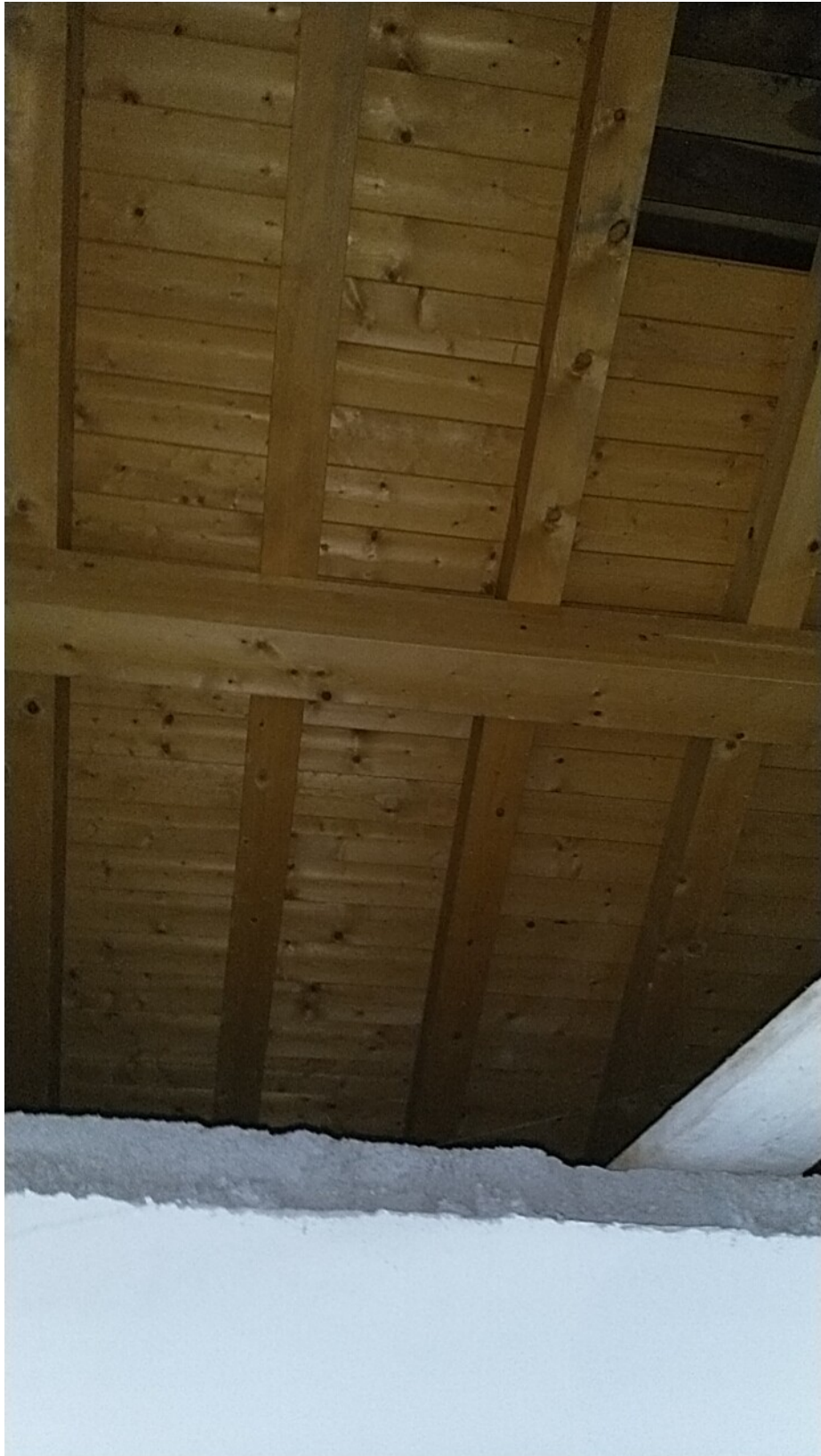
Sesto al Reghena, via Buse – Sottotetto praticabile.