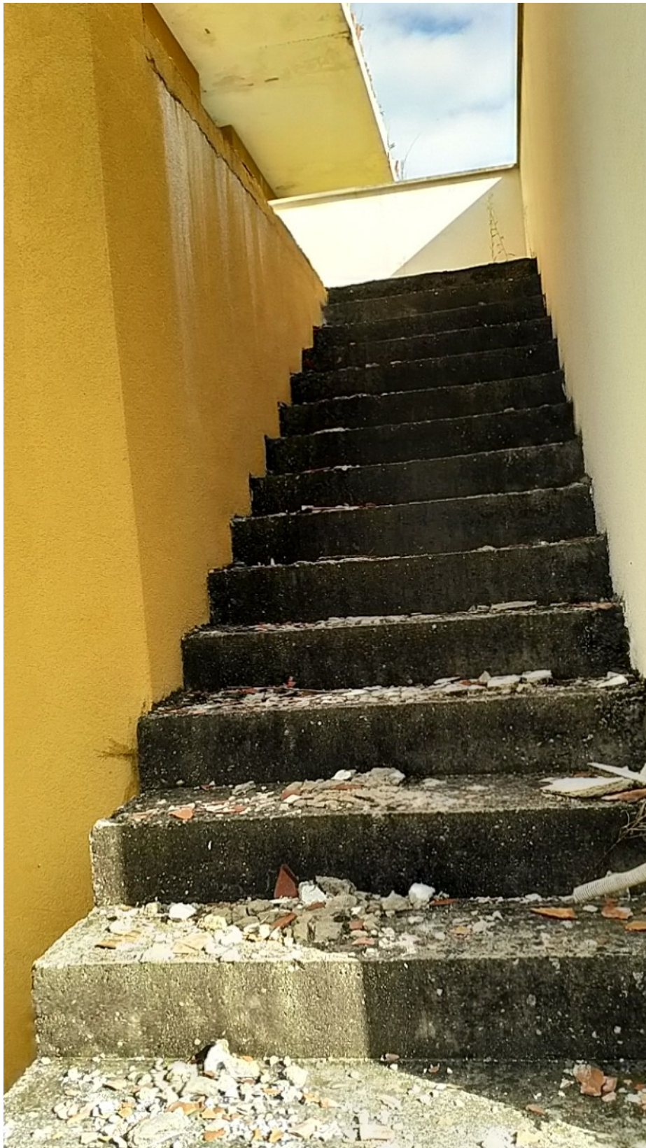
Sesto al Reghena, via Buse – La scala di accesso all'immobile.