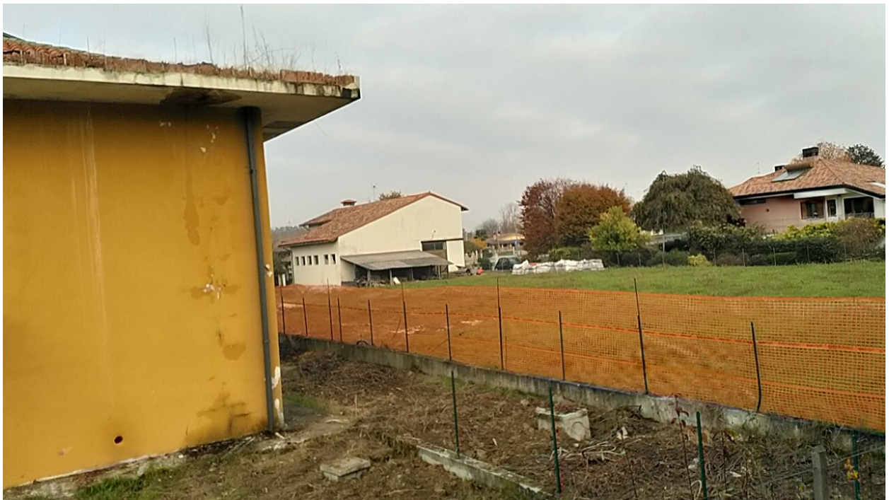
Sesto al Reghena, via Buse – Danni alla copertura e alle tramezzature.