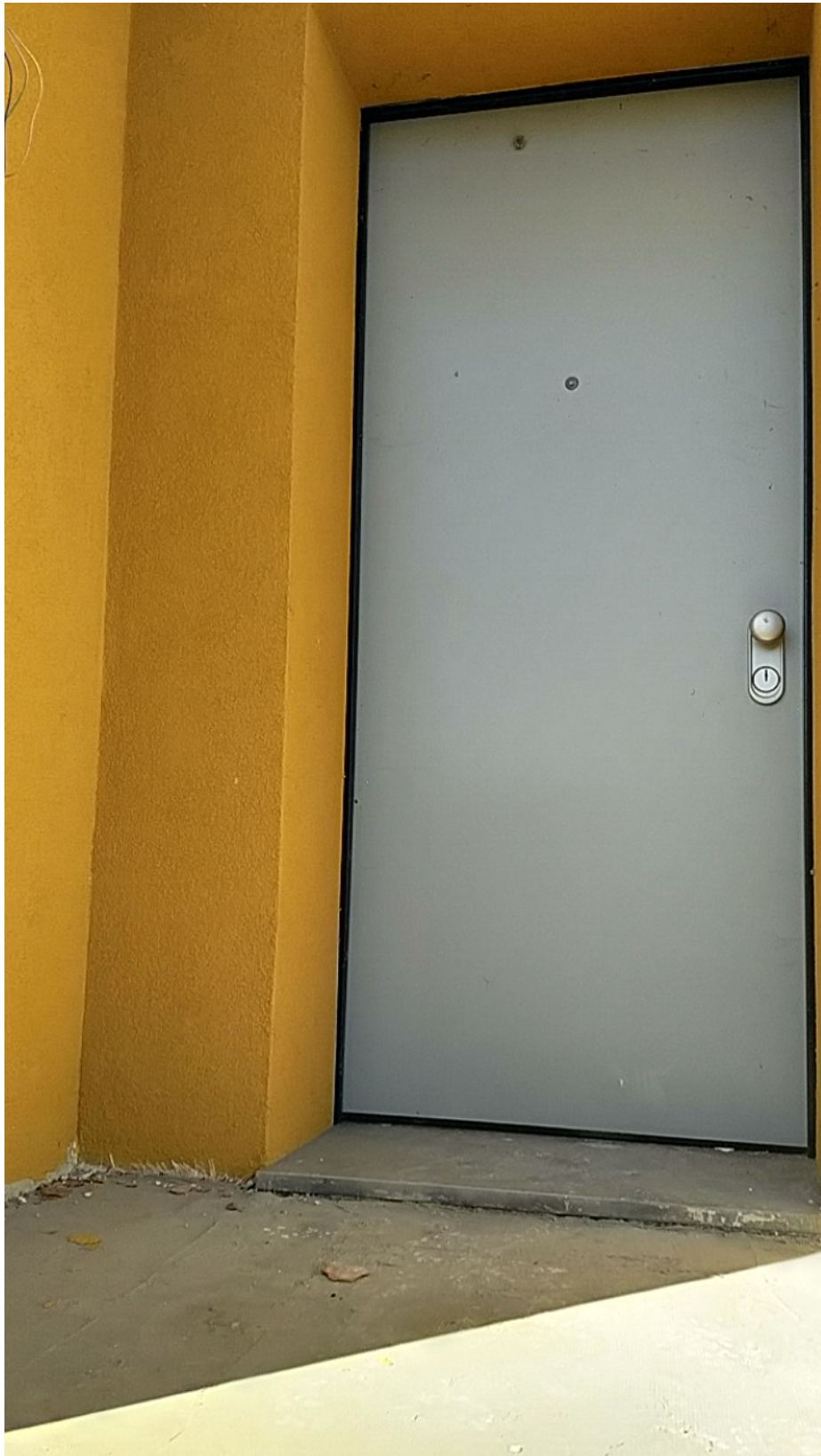
Sesto al Reghena, via Buse – Particolare della portoncino blindato.