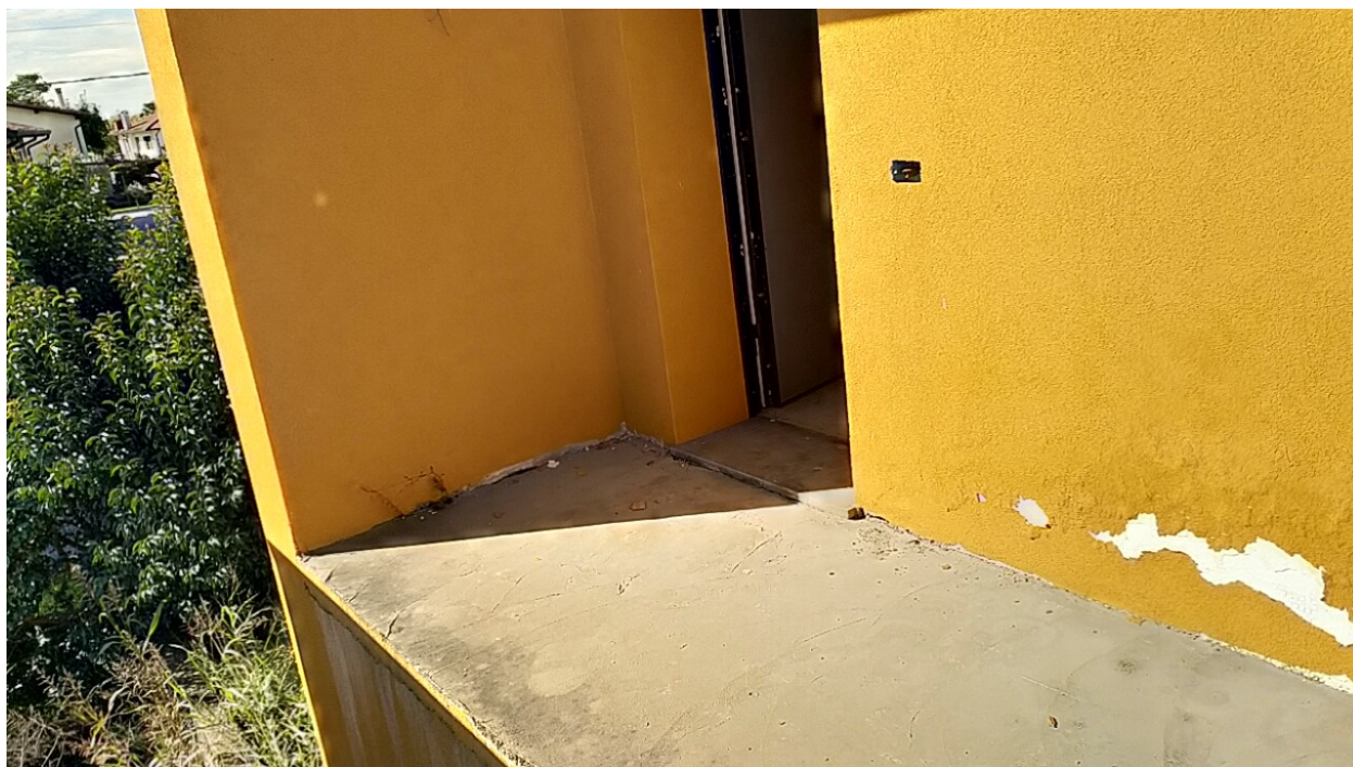
Sesto al Reghena, via Buse – Sopra particolare del collettore dell'impianto idrico, sotto particolare del raccordo tra pavimento e parete in corrispondenza del terrazzino esterno