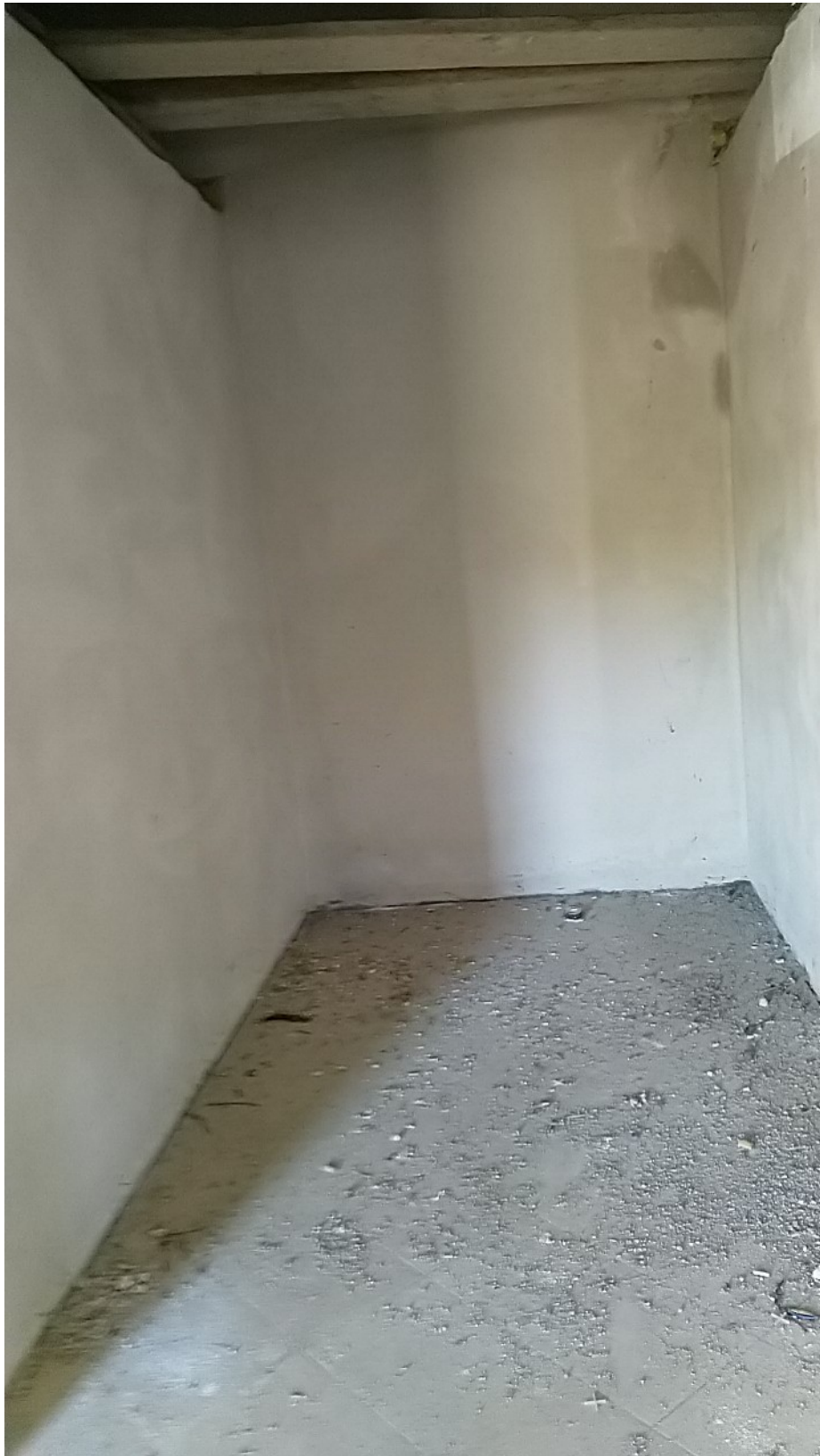
Sesto al Reghena, via Buse – Il soggiorno – pranzo e le infiltrazioni dal soffitto.