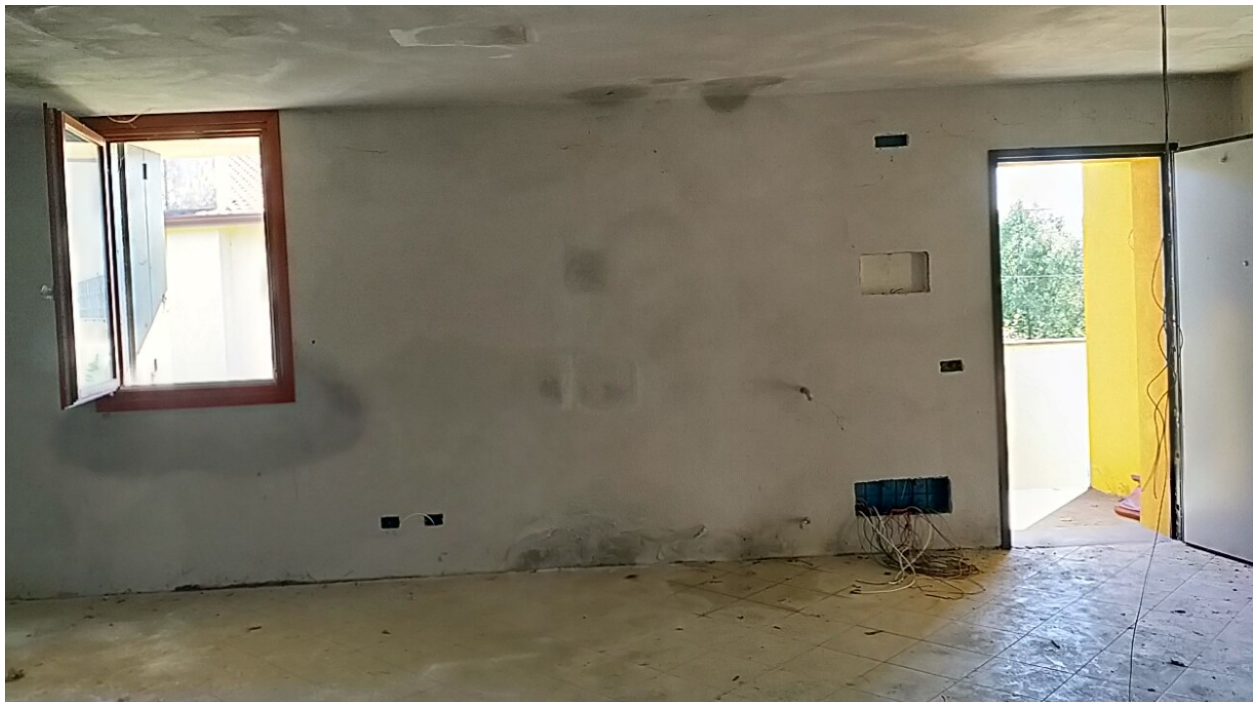
Sesto al Reghena, via Buse – Il soggiorno - pranzo.