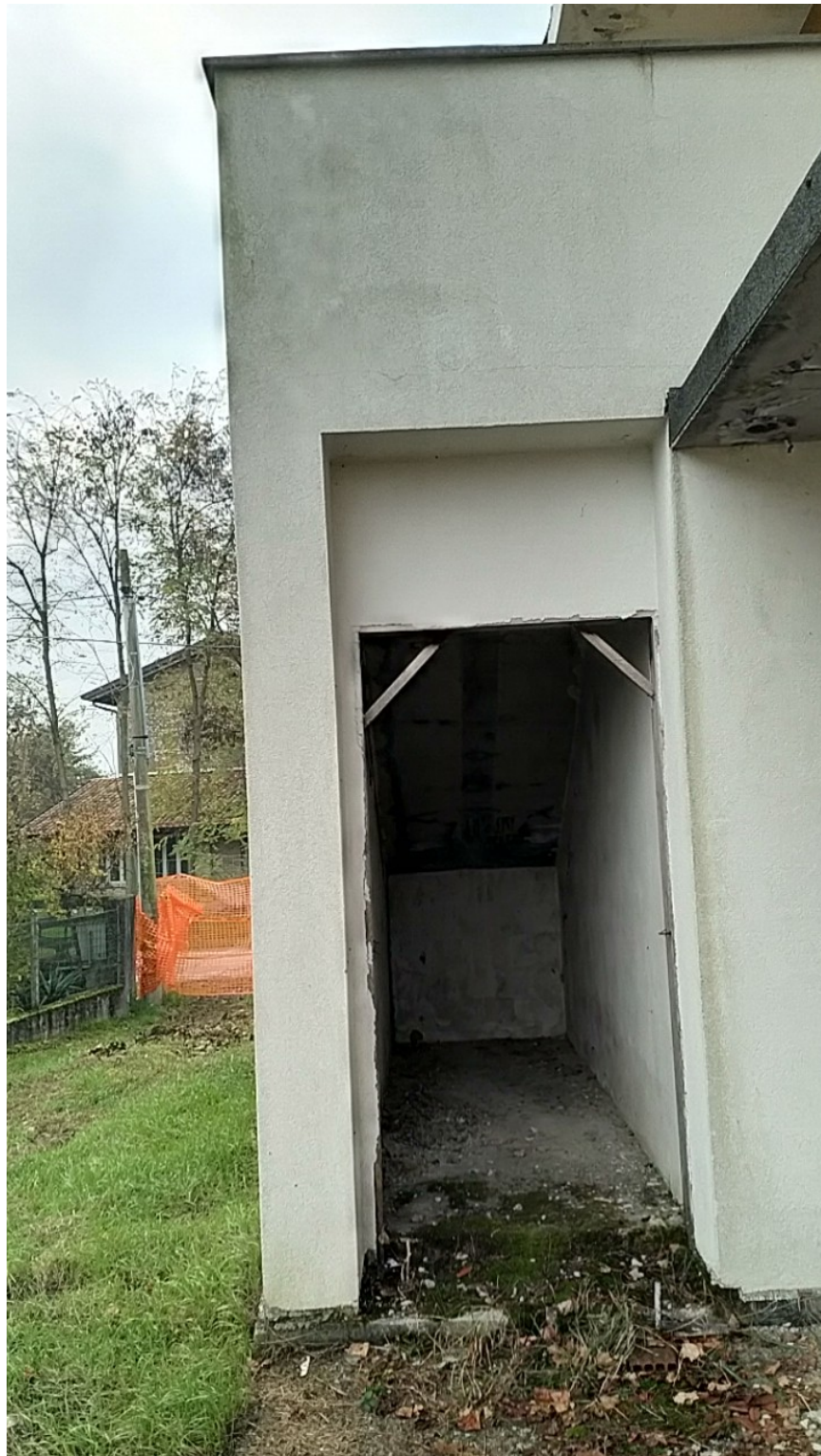
Sesto al Reghena, via Buse – Il sottoscala.