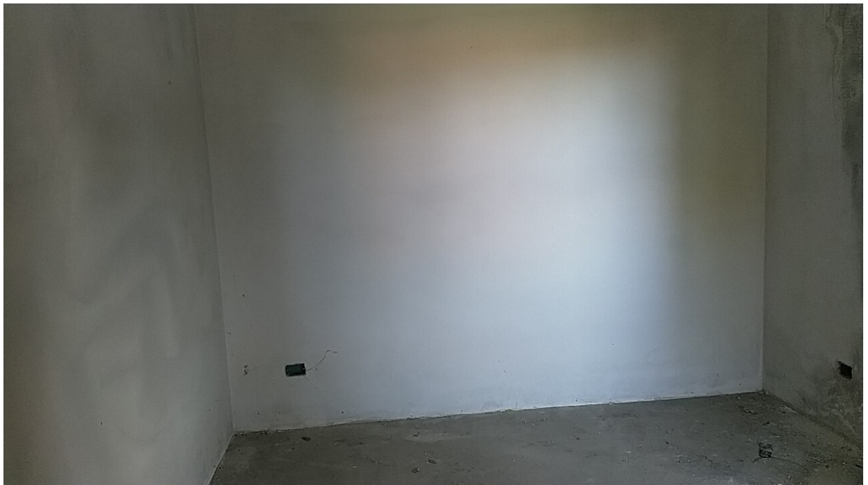
Sesto al Reghena, via Buse – La camera singola.