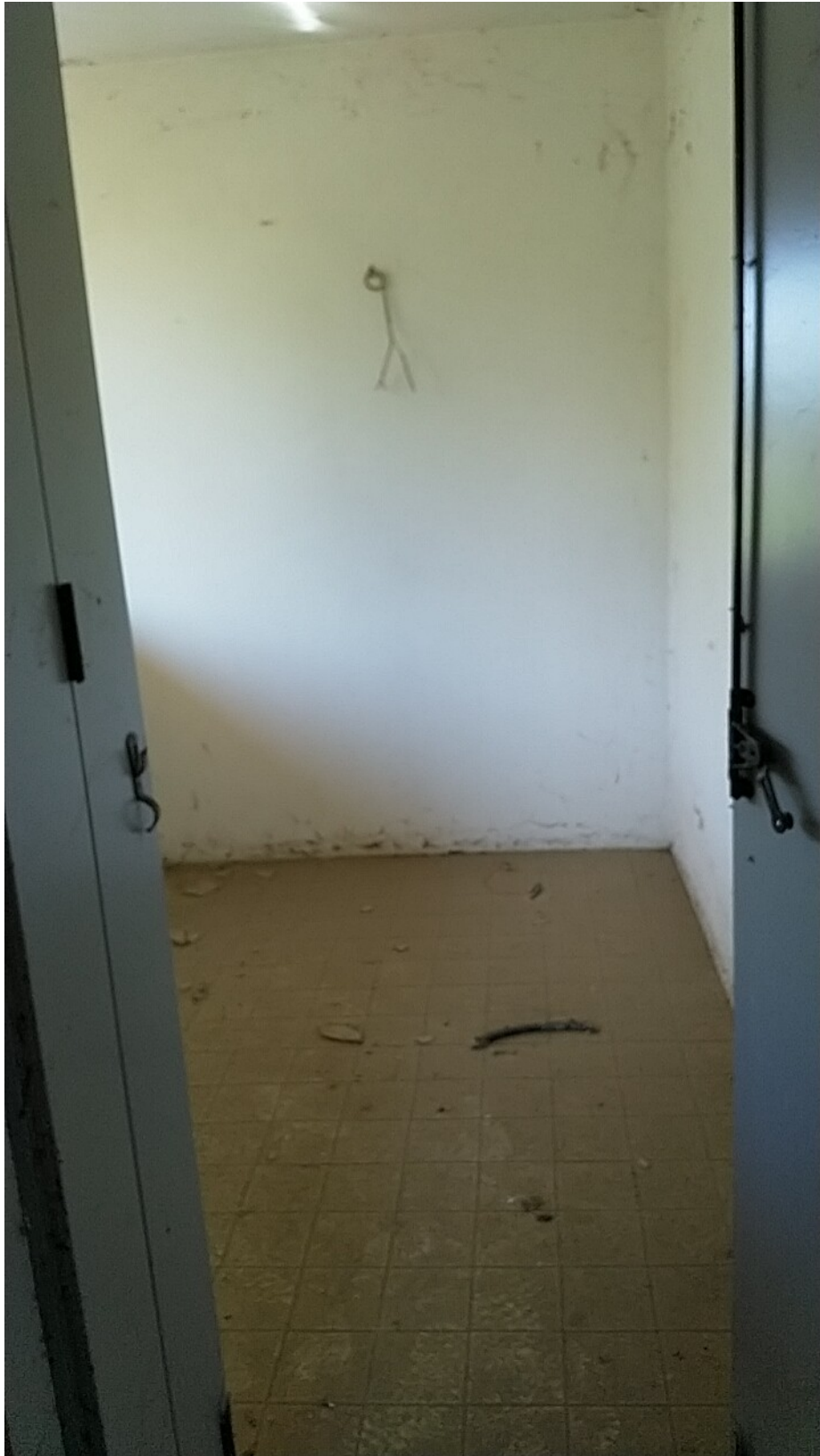
Sesto al Reghena, via Buse – Particolare della loggia n.2.