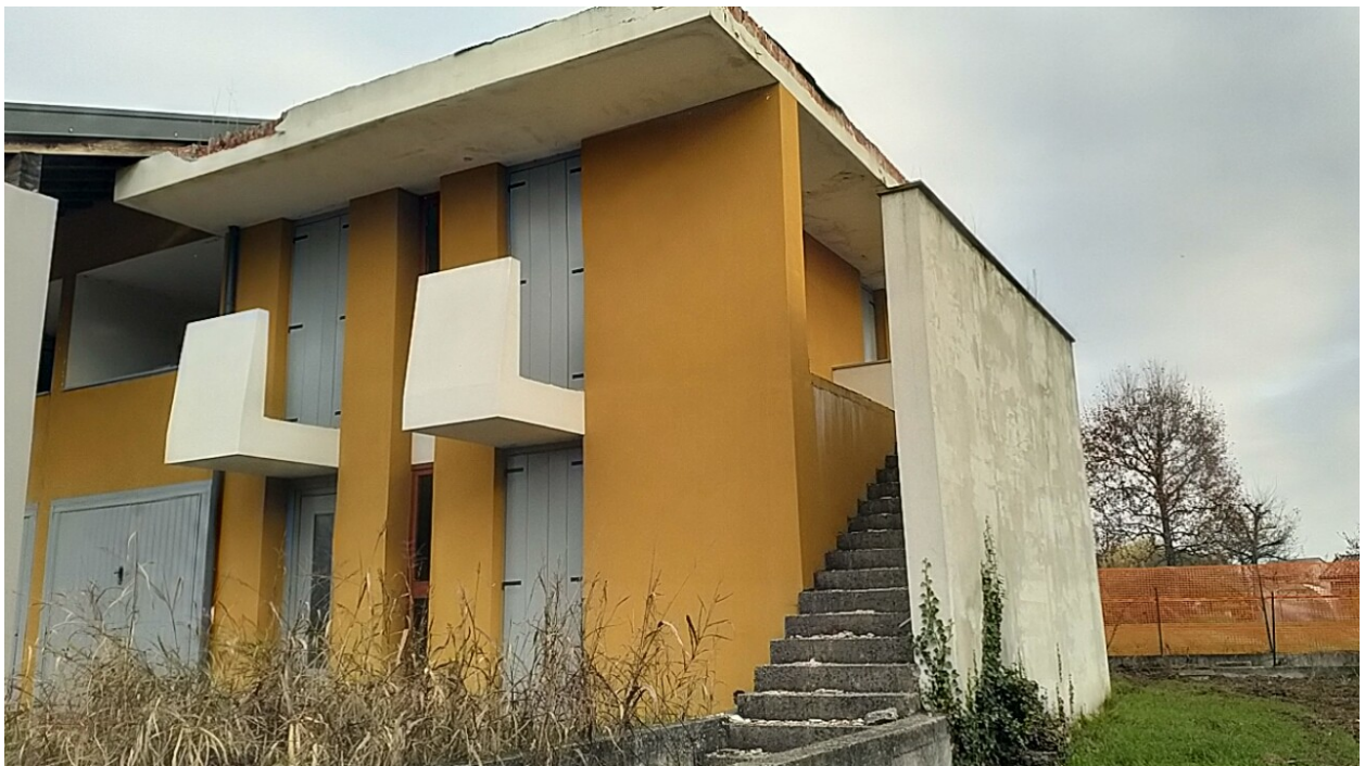
Sesto al Reghena, via Buse – Sopra il prospetto nord, sotto i prospetti nord ed ovest delle palazzina.