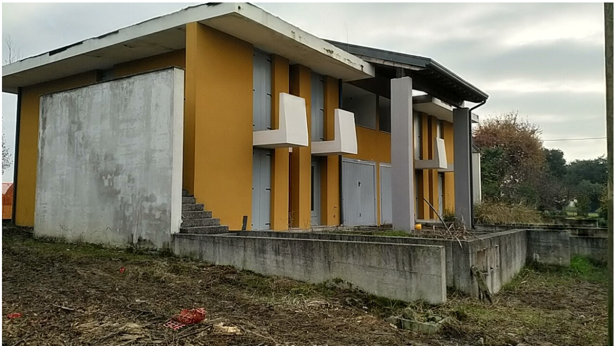
Sesto al Reghena, via Buse – Sopra il prospetto sud sotto il prospetto sud ed ovest delle palazzina.