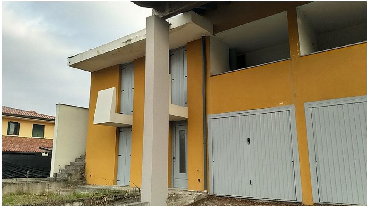
Sesto al Reghena, via Buse – Il prospetto ovest delle palazzina.