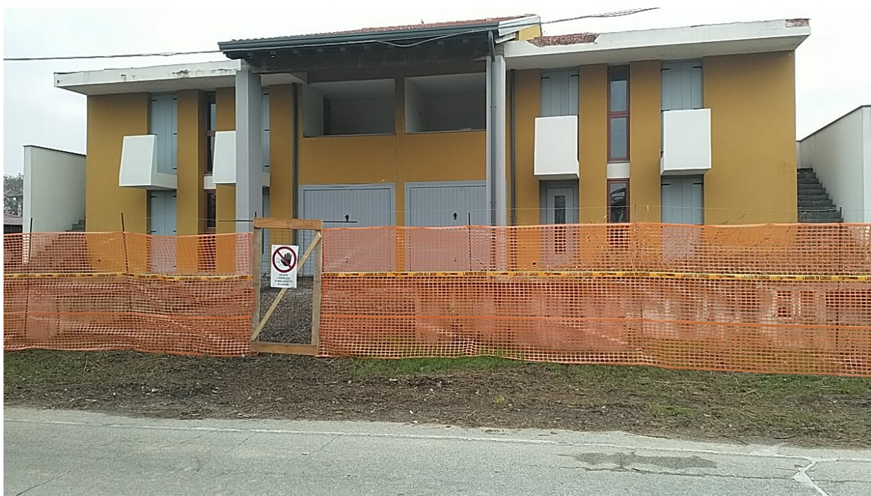
Sesto al Reghena, via Buse – Sopra l'aerofotogrammetria, sotto il prospetto ovest delle palazzina.