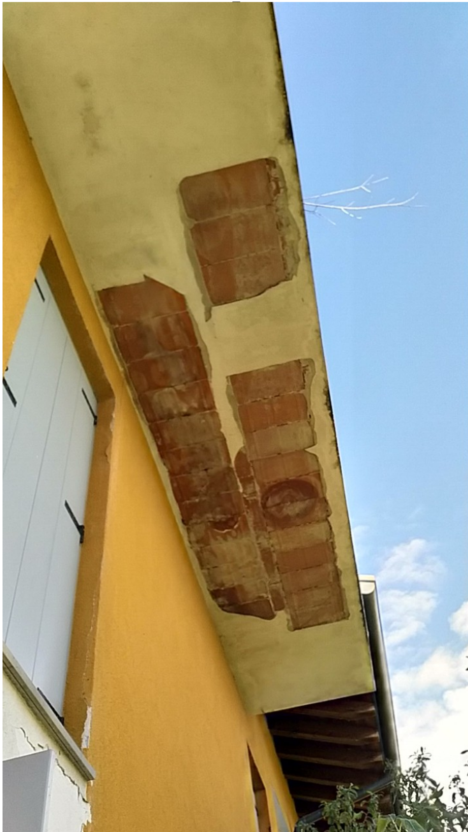
Sesto al Reghena, via Buse – Sopra danni dovuti ad infiltrazioni dalla copertura.