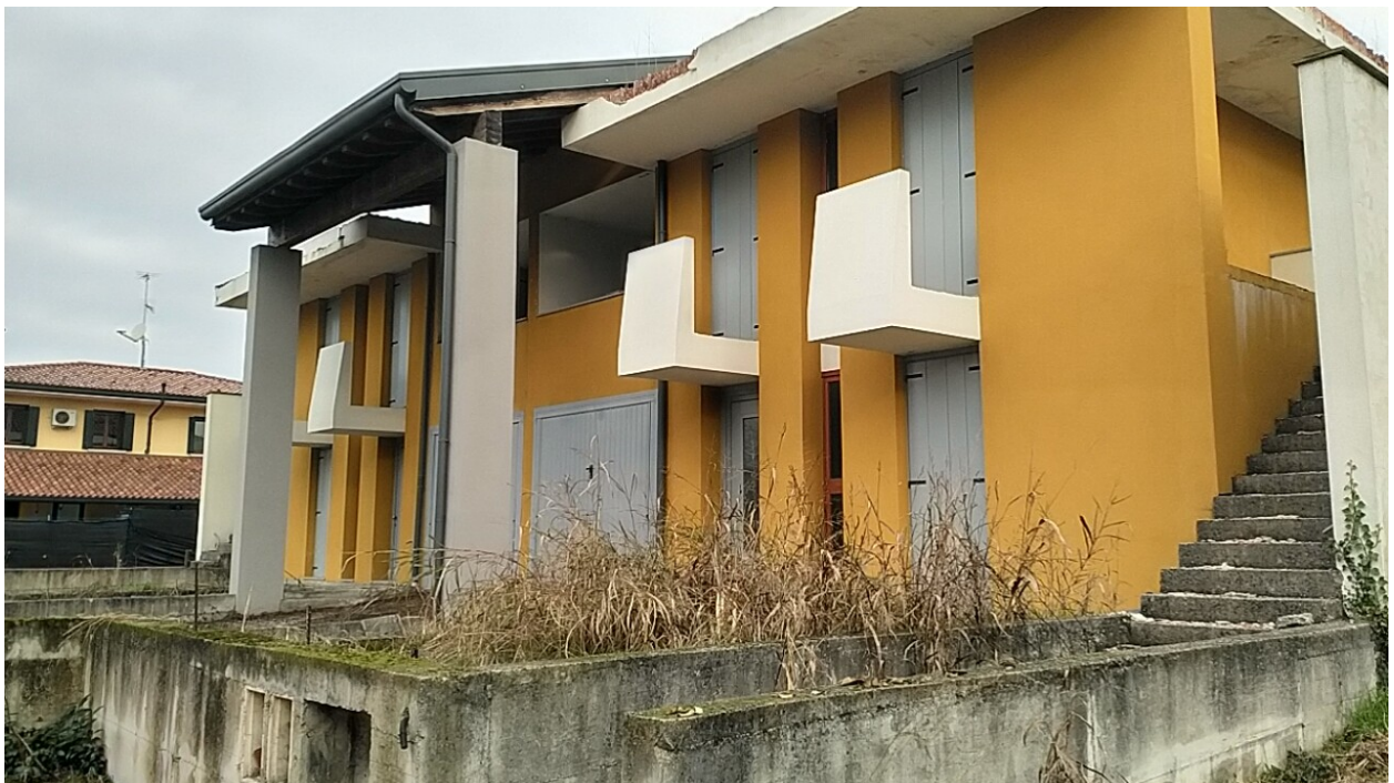
Sesto al Reghena, via Buse – Il prospetto ovest delle palazzina.