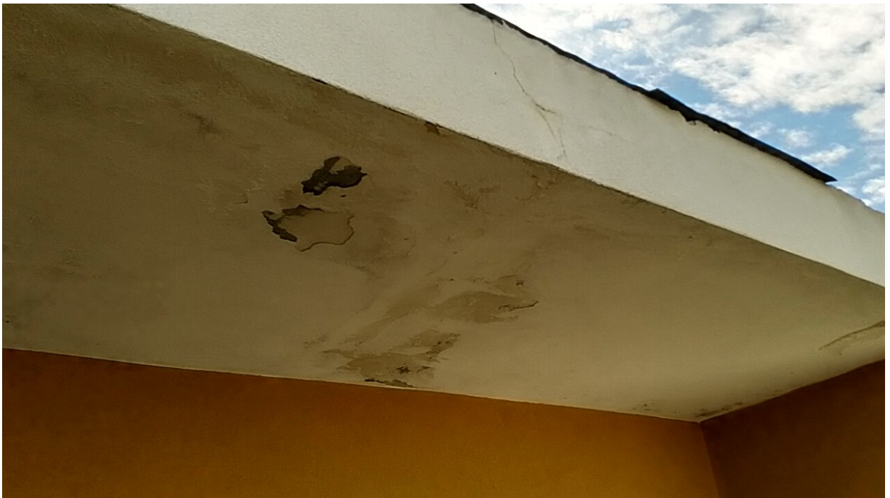
Sesto al Reghena, via Buse – Sopra danni dovuti ad infiltrazioni dalla copertura.