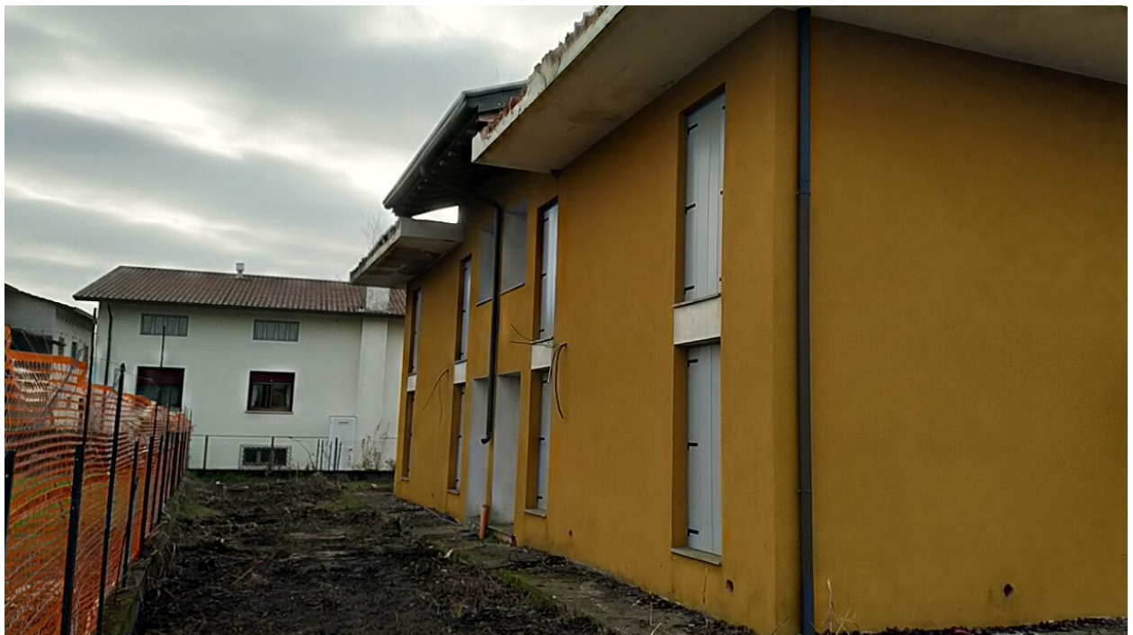
Sesto al Reghena, via Buse – Il prospetto ad est.