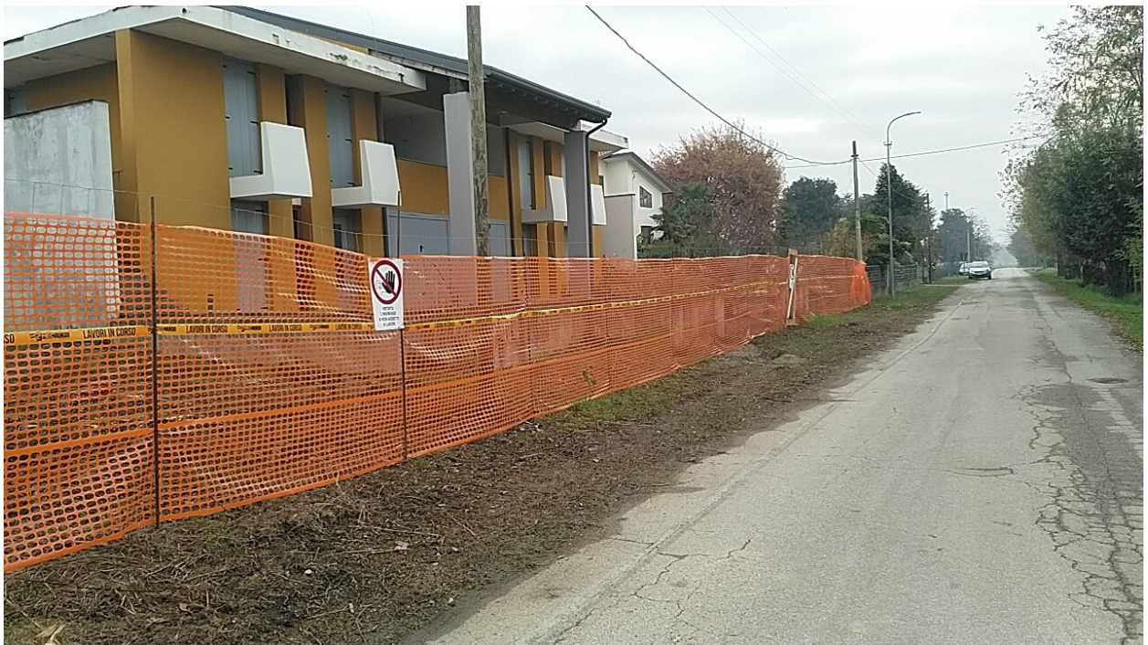
Sesto al Reghena, via Buse – La strada di accesso alla palazzina ed il suo prospetto ovest