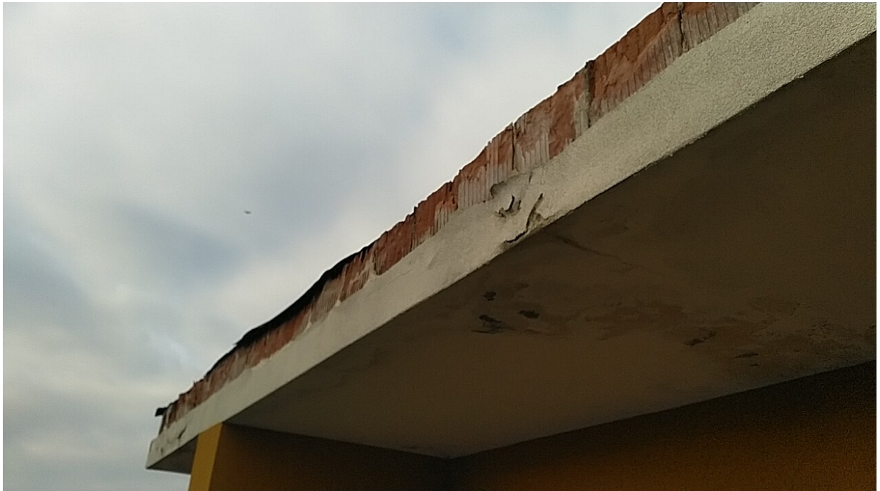
Sesto al Reghena, via Buse – Sopra danni dovuti ad infiltrazioni dalla copertura.