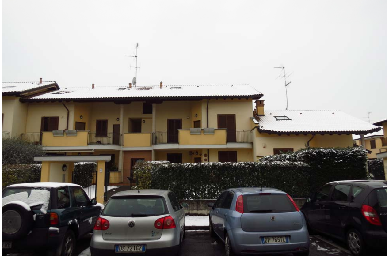
Vista immobile dalla via Ugo Foscolo