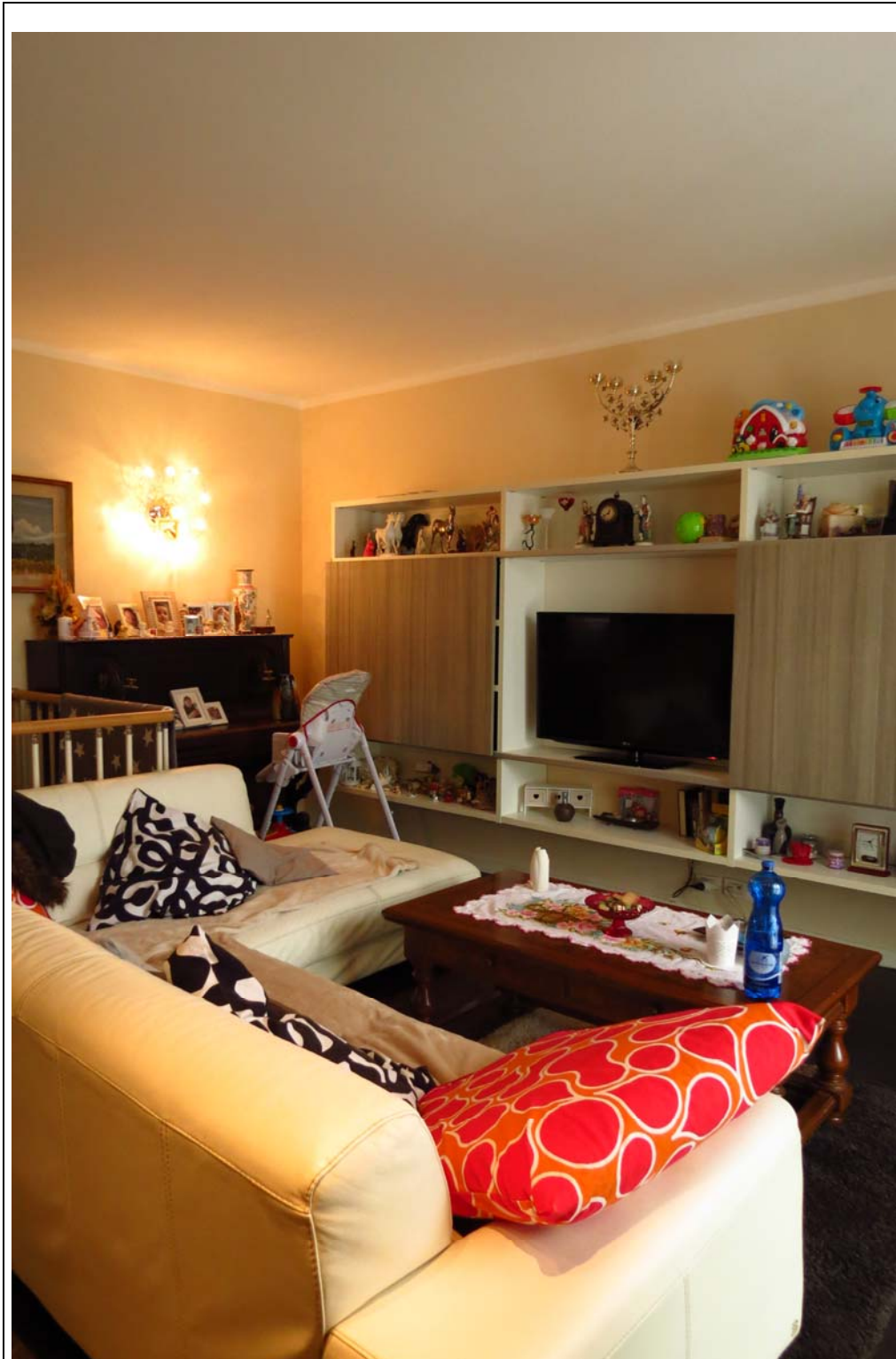
Vista soggiorno dall'ingresso