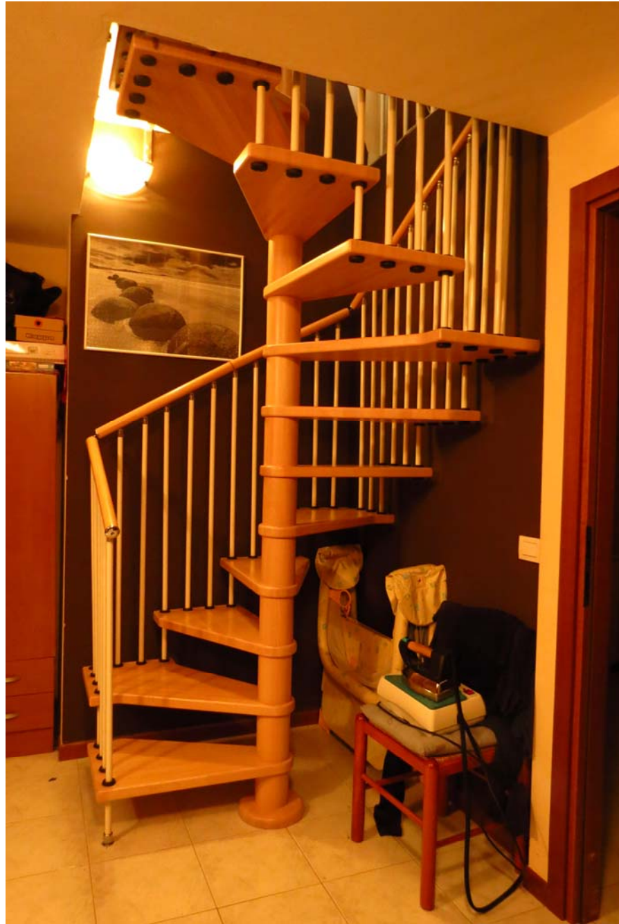
Scala interna di collegamento