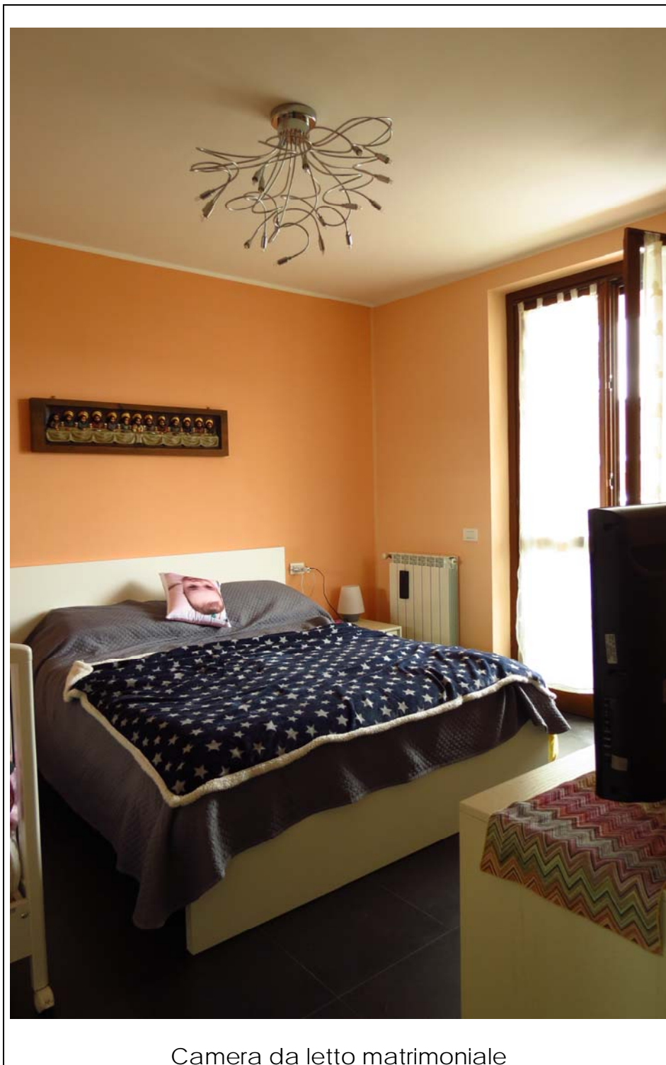
Camera da letto matrimoniale