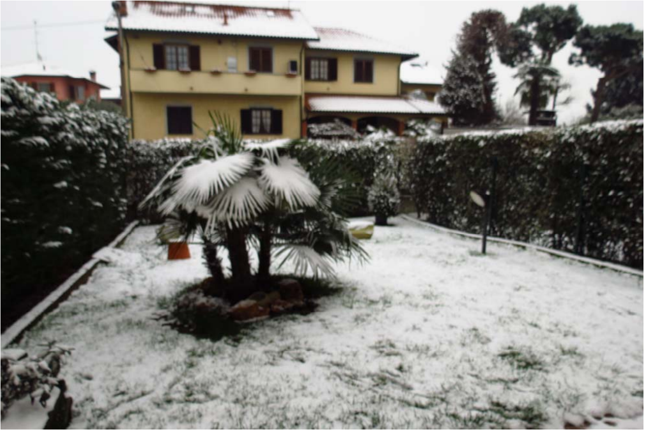
Giardino di proprietà