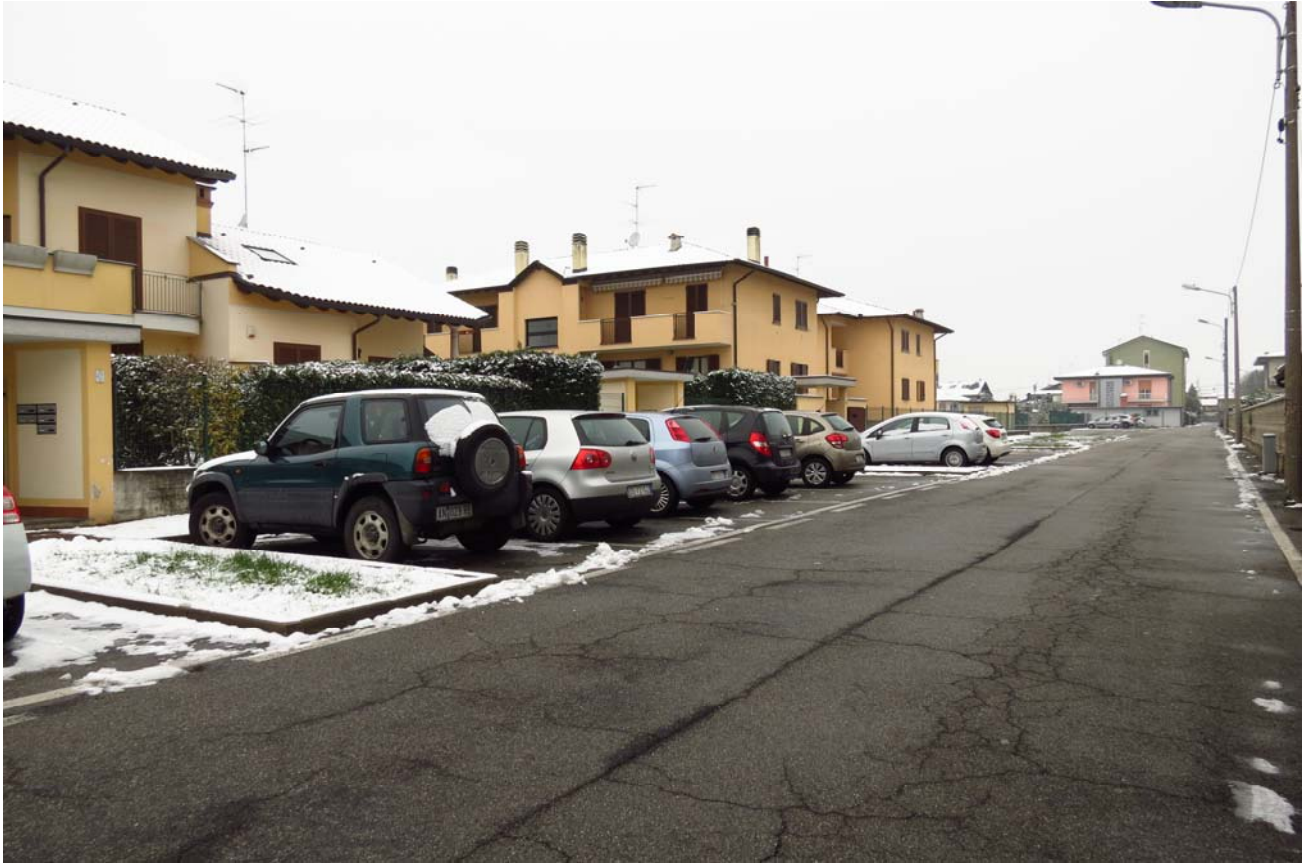
Via Ugo Foscolo