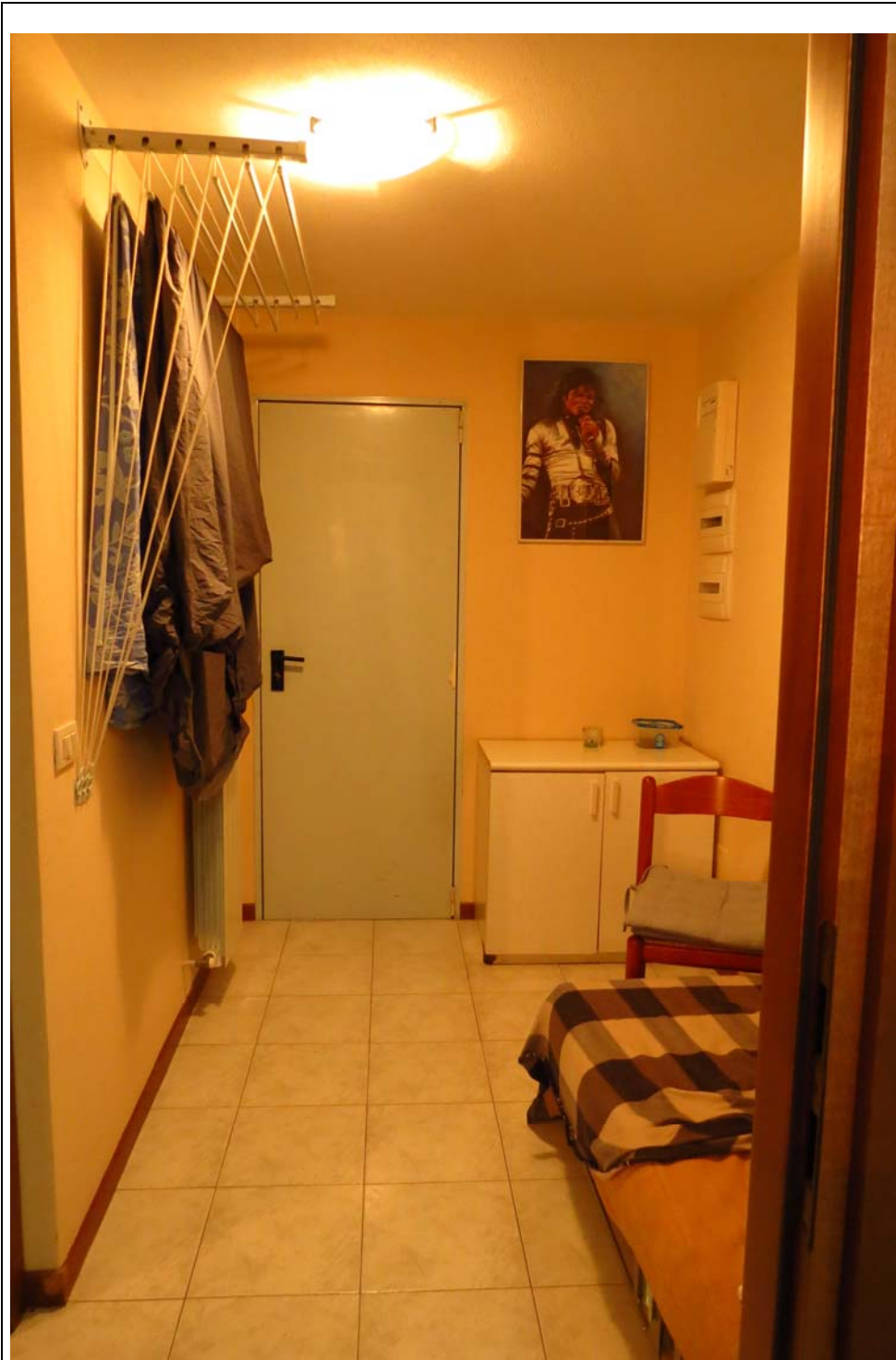
Locale ad uso ripostiglio, piano seminterrato