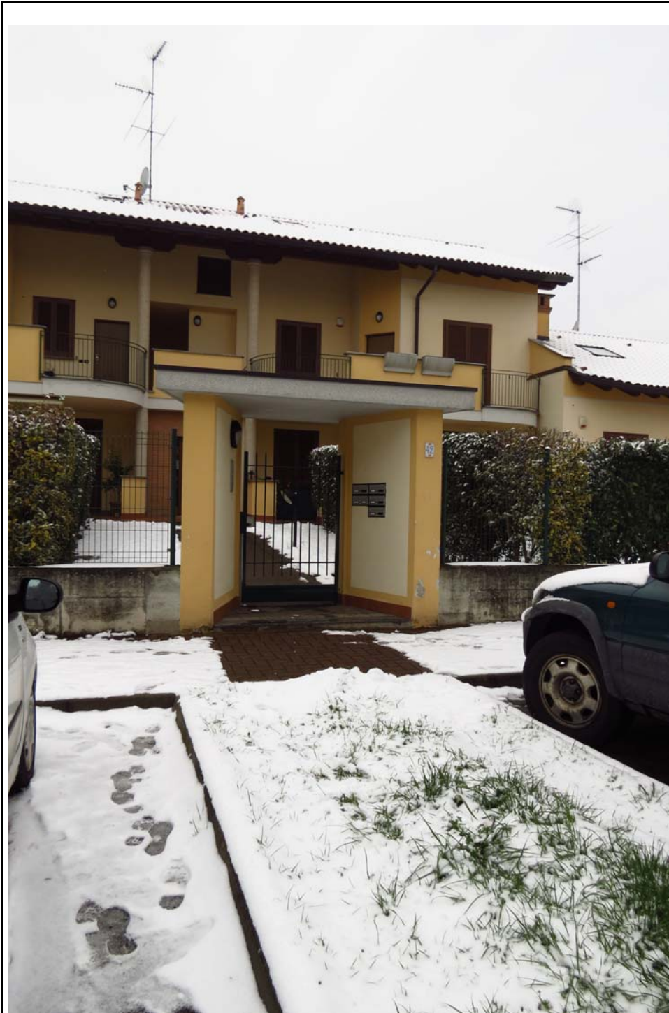
Ingresso condominiale sulla via Ugo Foscolo