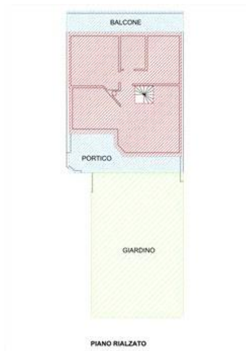
Calcolo consistenza piano rialzato