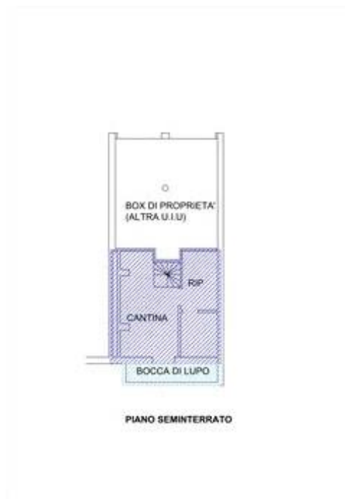
Calcolo consistenza piano seminterrato