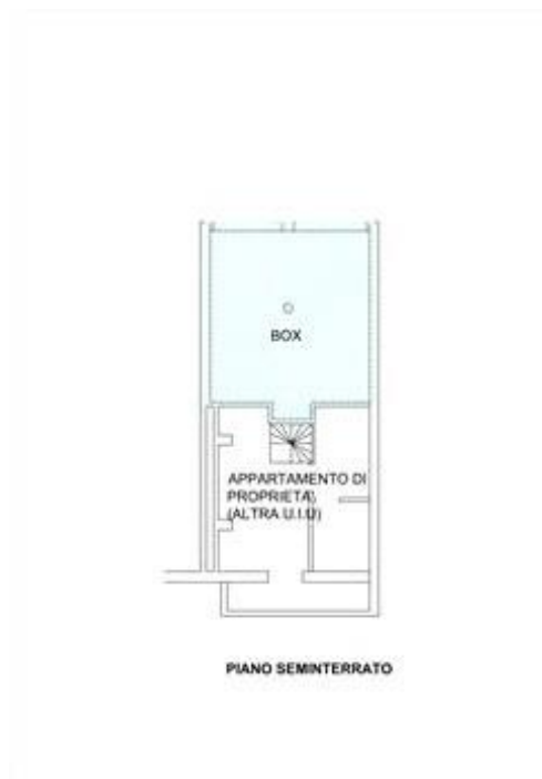
Calcolo consistenza Box al piano seminterrato