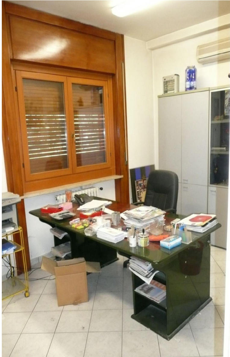
UFFICIO PIANO TERRA