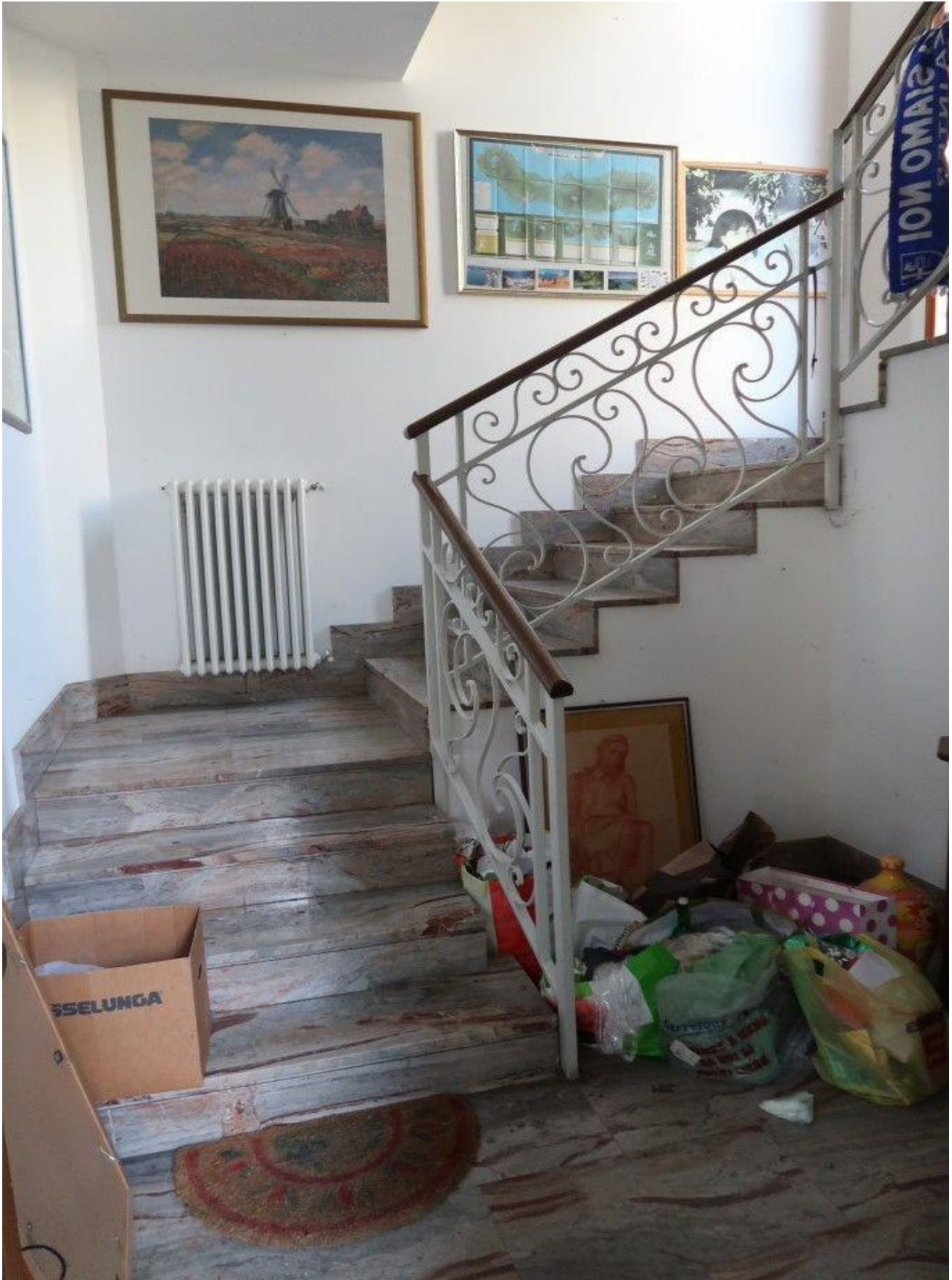
SCALA ACCESSO APPARTAMENTO PIANO PRIMO