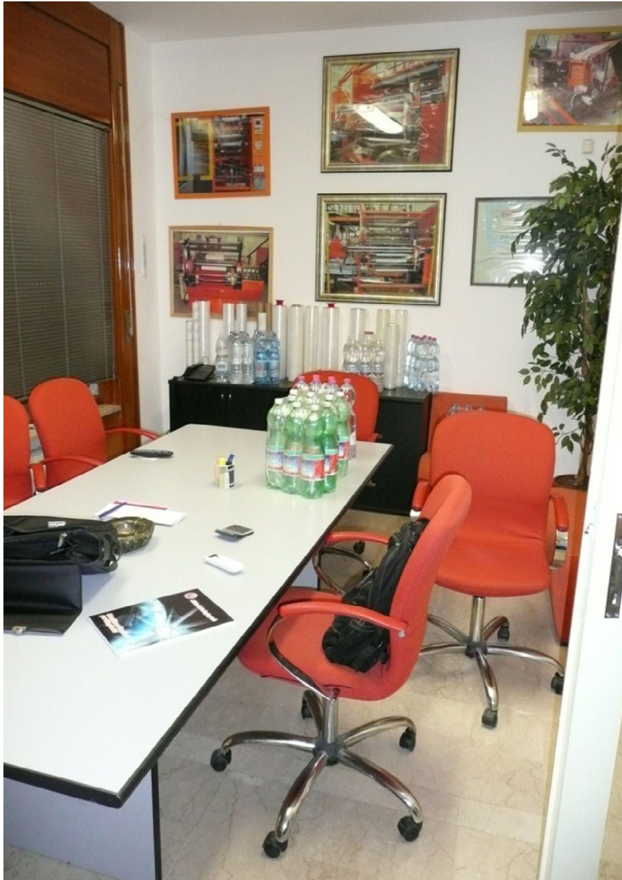
UFFICIO PIANO TERRA