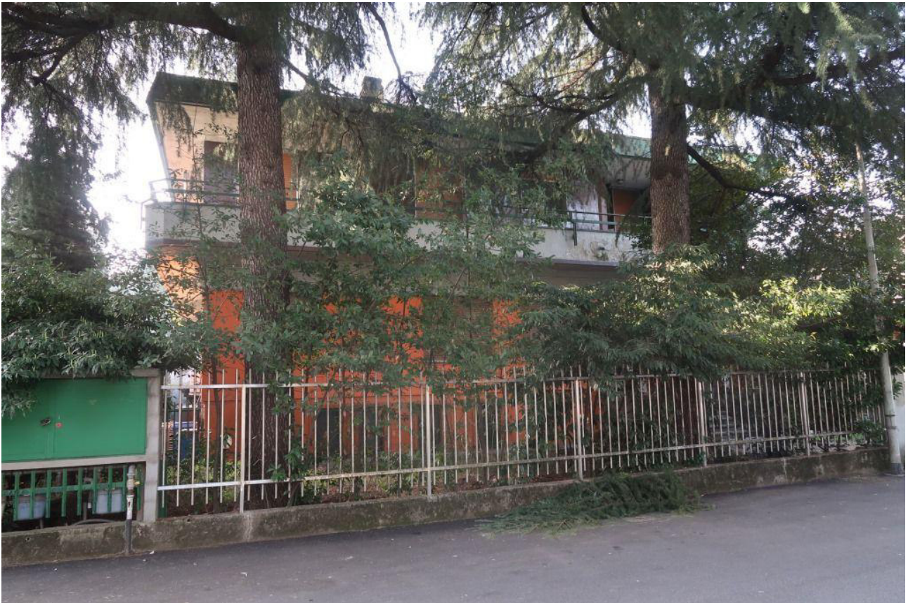
FACCIATA SU VIA PUECHER