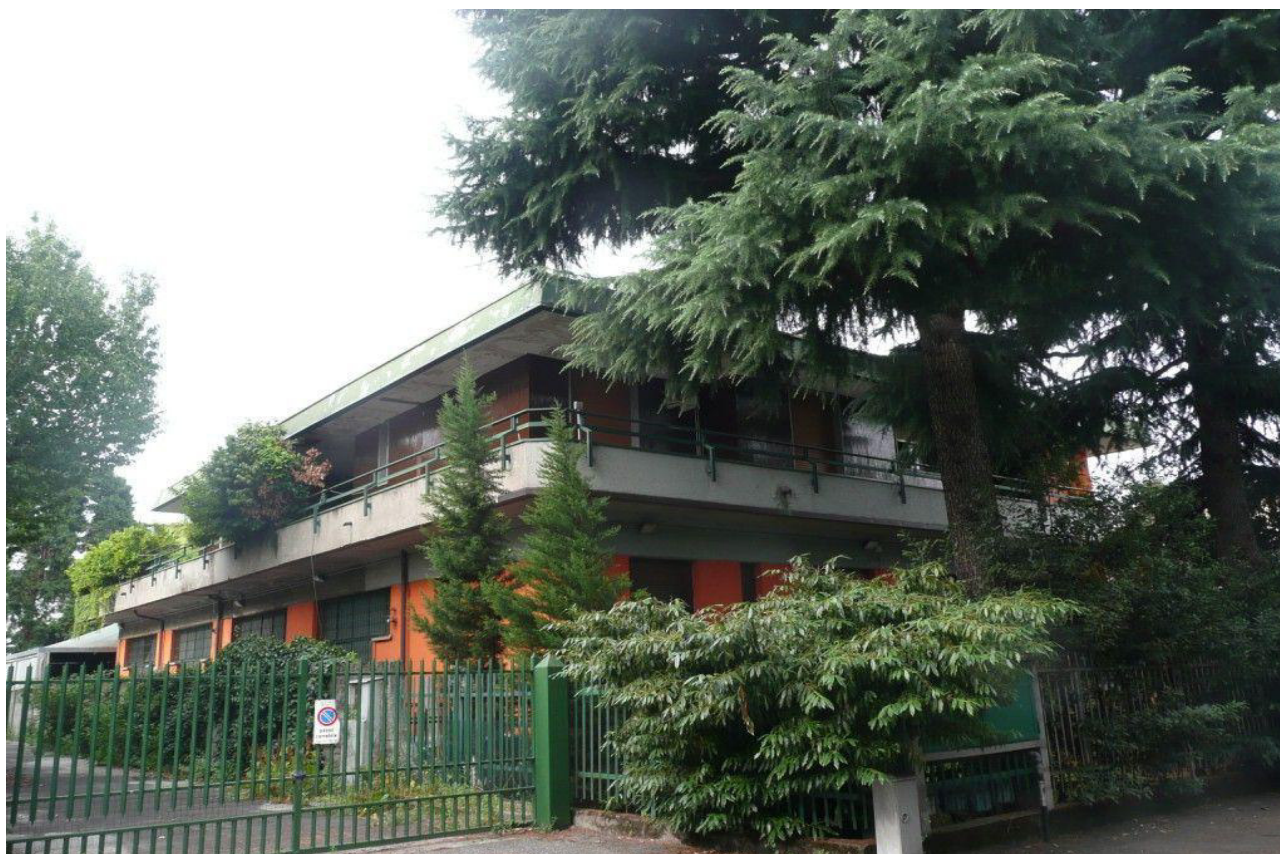
VISTA IMMOBILE DA VIA PUECHER