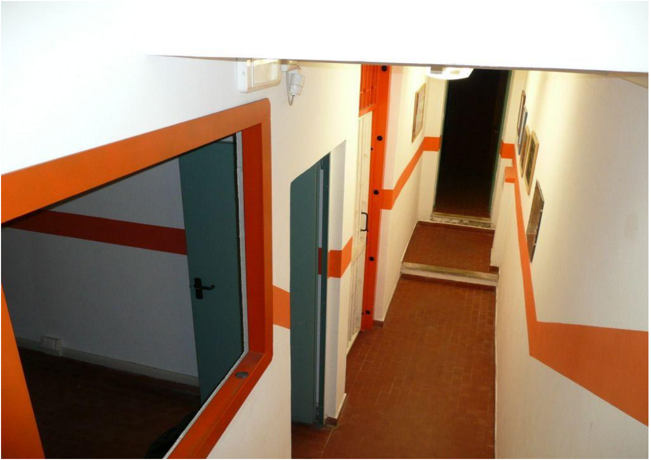
LOCALI NEL SEMINTERRATO