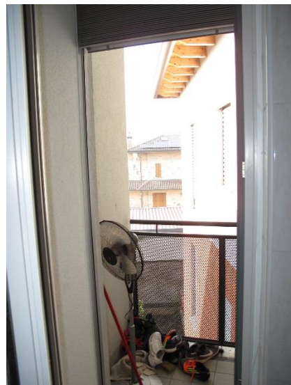
balconcino del bagno