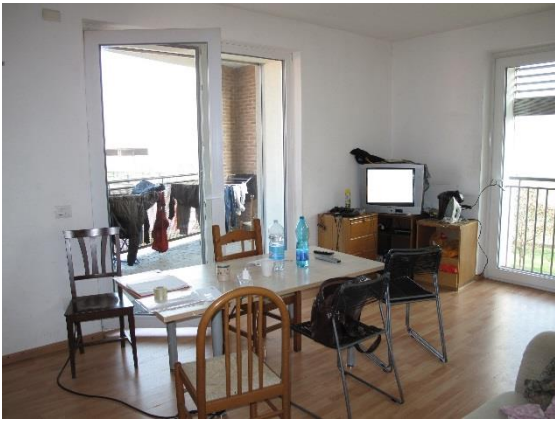
soggiorno con cucina