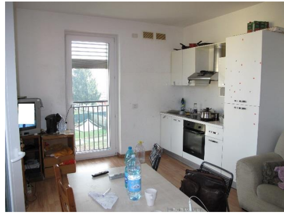
soggiorno con cucina