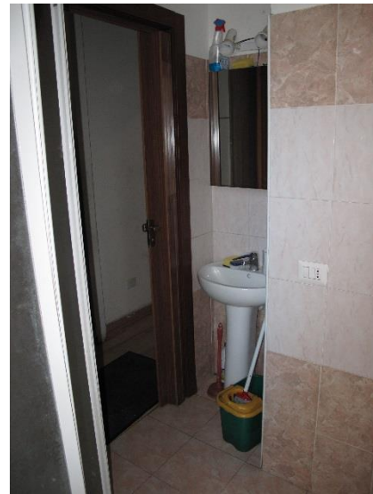
bagno con modifica abusiva