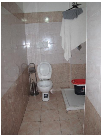
bagno cieco abusivo