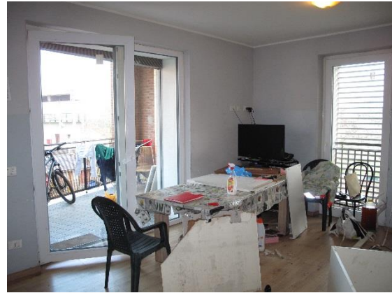
soggiorno con cucina