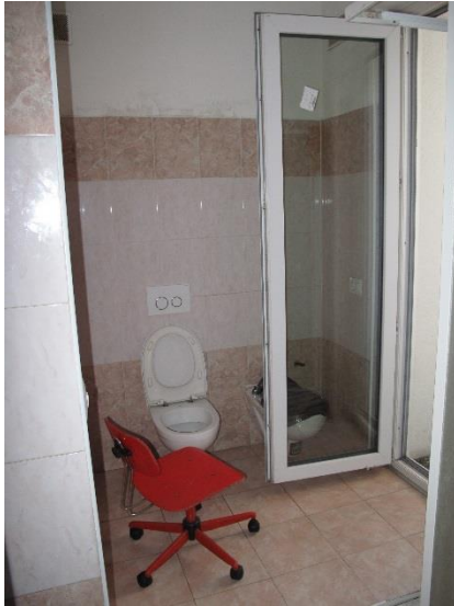
bagno con modifica abusiva