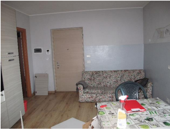
soggiorno con cucina