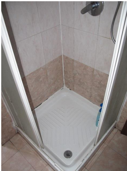
bagno con modifica abusiva