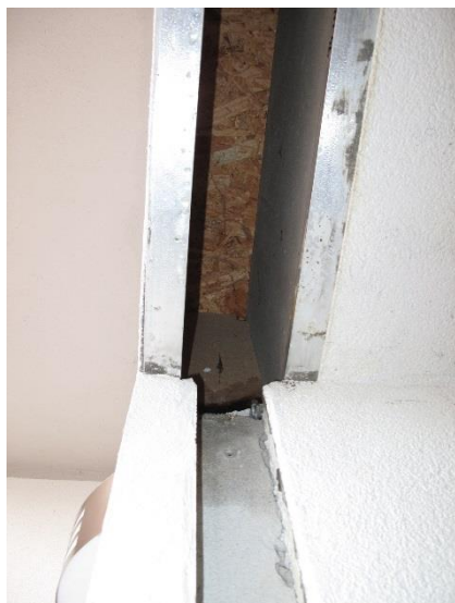
frangisole mancante nel bagno