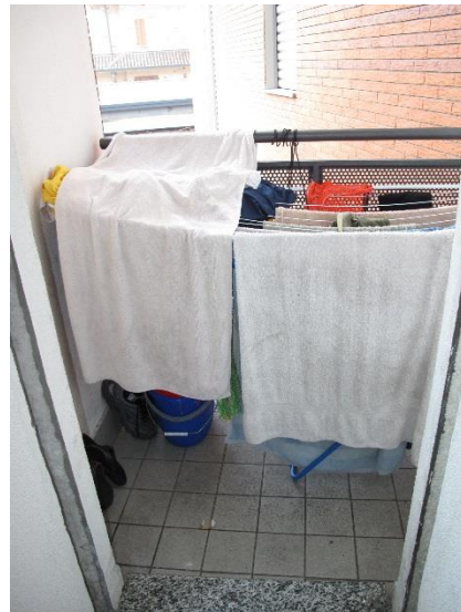
balconcino del bagno