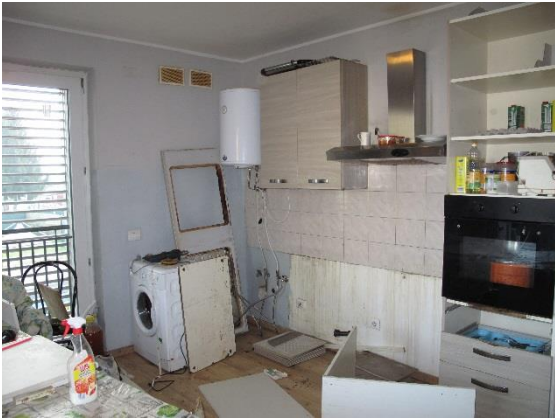
soggiorno con cucina