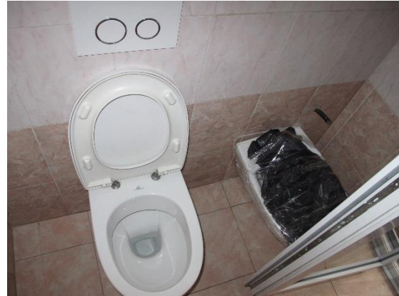
bagno con modifica abusiva