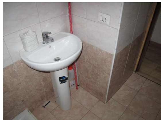
bagno cieco abusivo