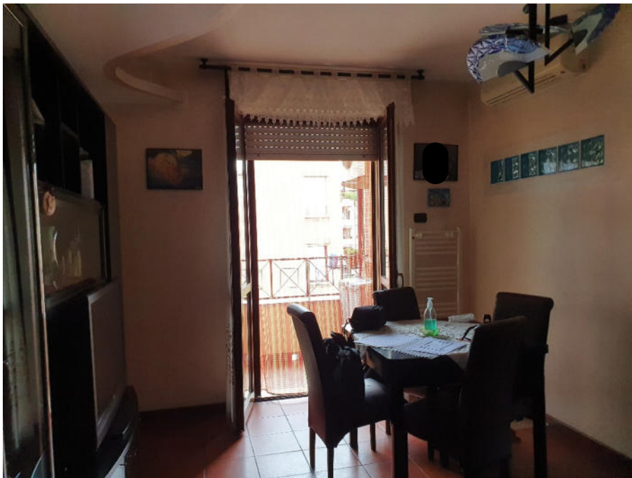
soggiorno e balcone