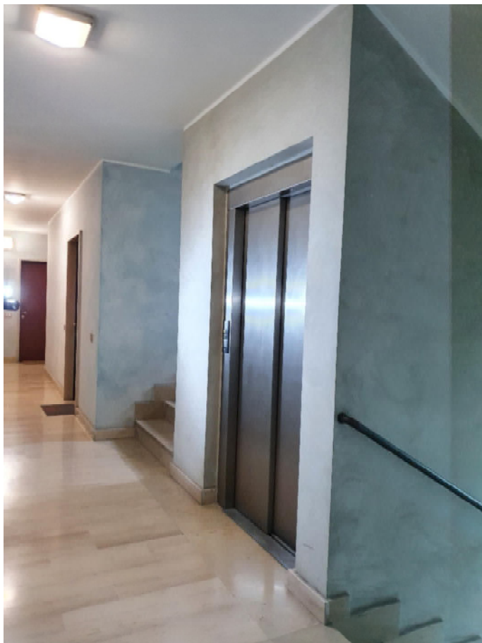
Parti comuni al 3° piano