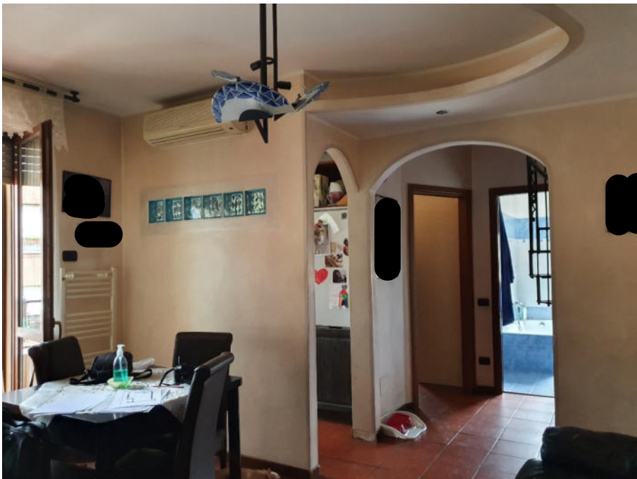
soggiorno – cottura – disimpegno