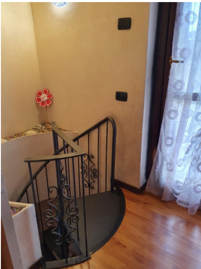
sbarco scala a piano 4° sottotetto