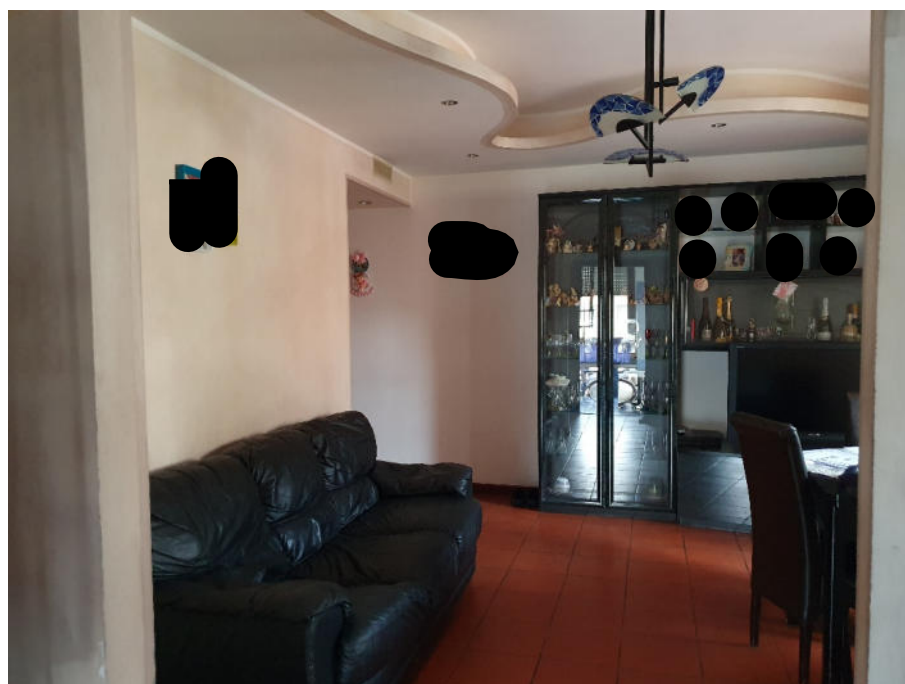
soggiorno - ingresso