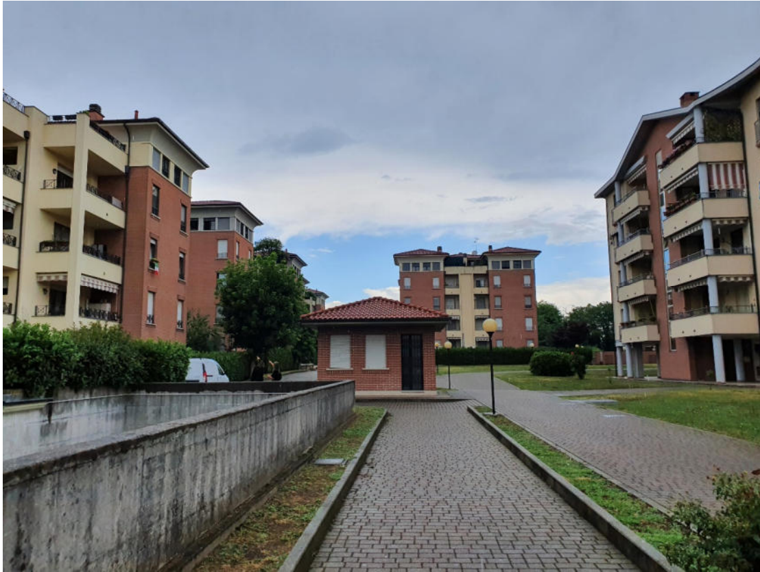
cortile del complesso edilizio