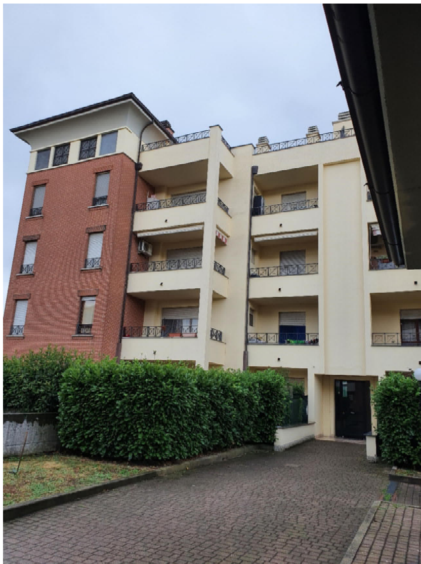
Ingresso al fabbricato 1