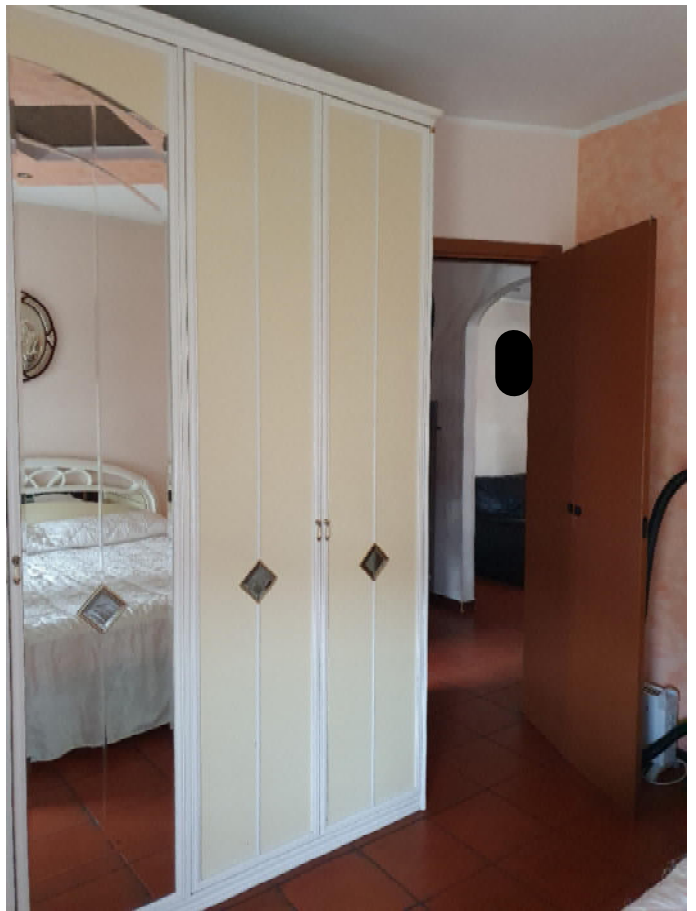
camera del terzo piano