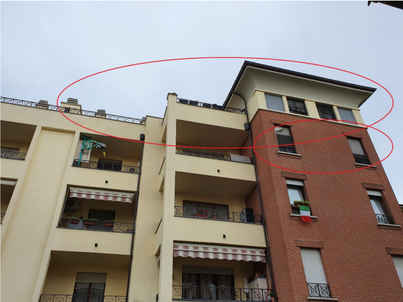
Parti comuni del fabbricato 1 - ingresso