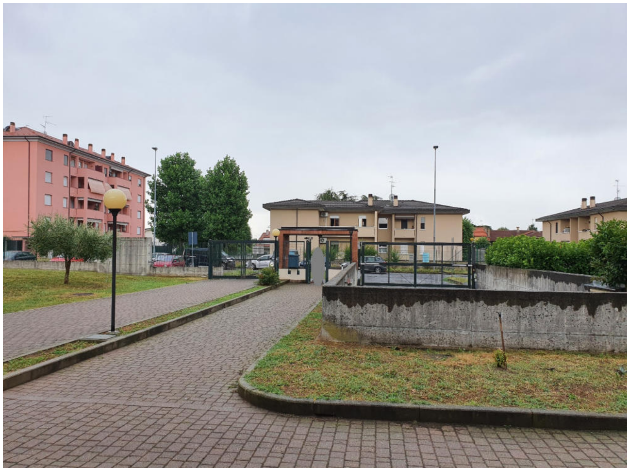
vista da cortile degli ingressi pedonale e carraio - via Della Liberazione 3