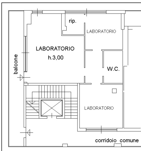
Fig. 1 - Planimetria catastale presentata il 12.07.2006

Spese complessive di regolarizzazione catastale: Euro 800,00