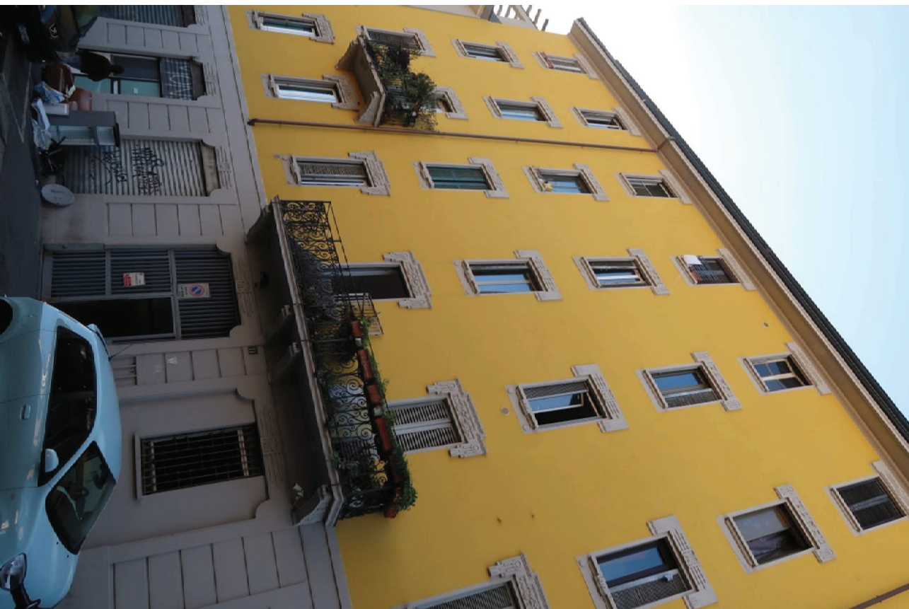
FACCIATA SU VIA CLITUMNO