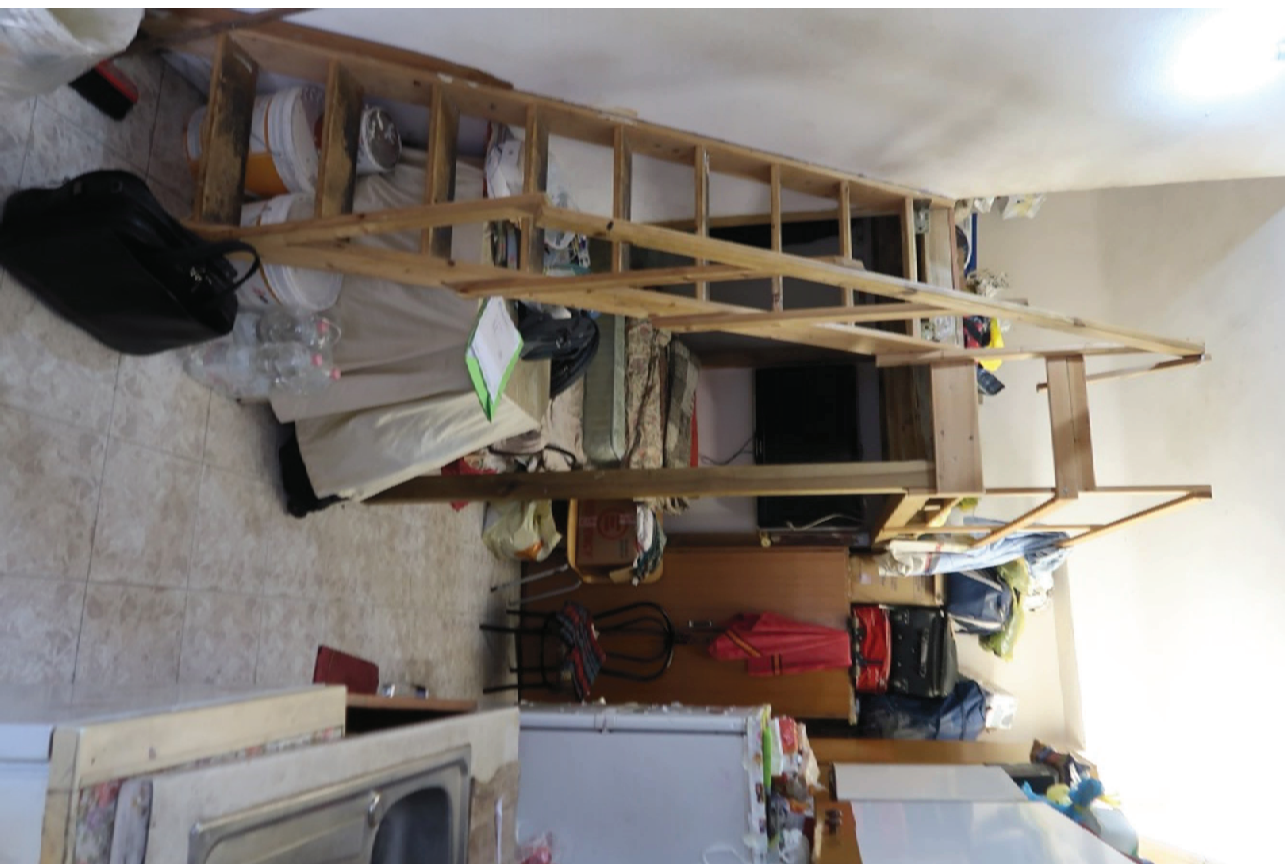
CAMERA CON SOPPALCO