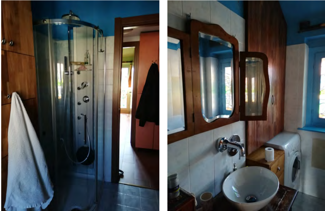
Fig. 22 - 23 - 24: bagno