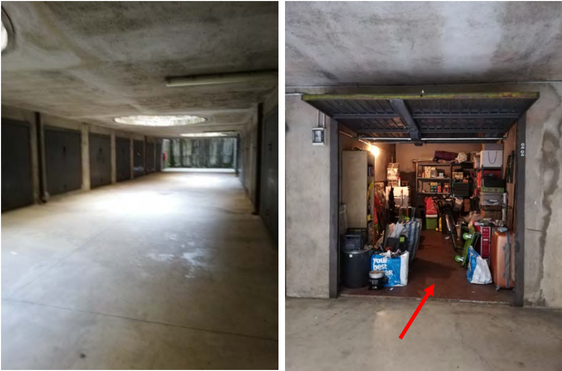
Fig. 12 - 13 - 14: box di pertinenza e corsello di manovra, accesso cantine