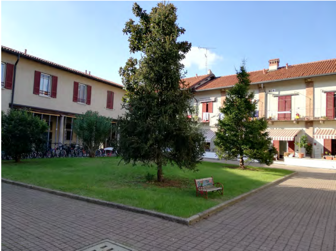
Fig. 8 - 9: vista della corte dei Piedi Bianchi, individuazione immobile