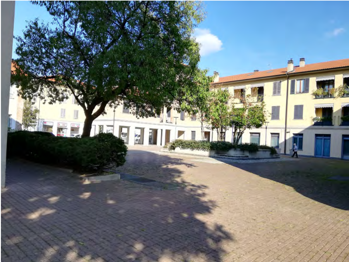
Fig. 6 - 7: vista della corte del Castello con accesso alle cantine, vista dell'accesso pedonale ai box via Pastrengo