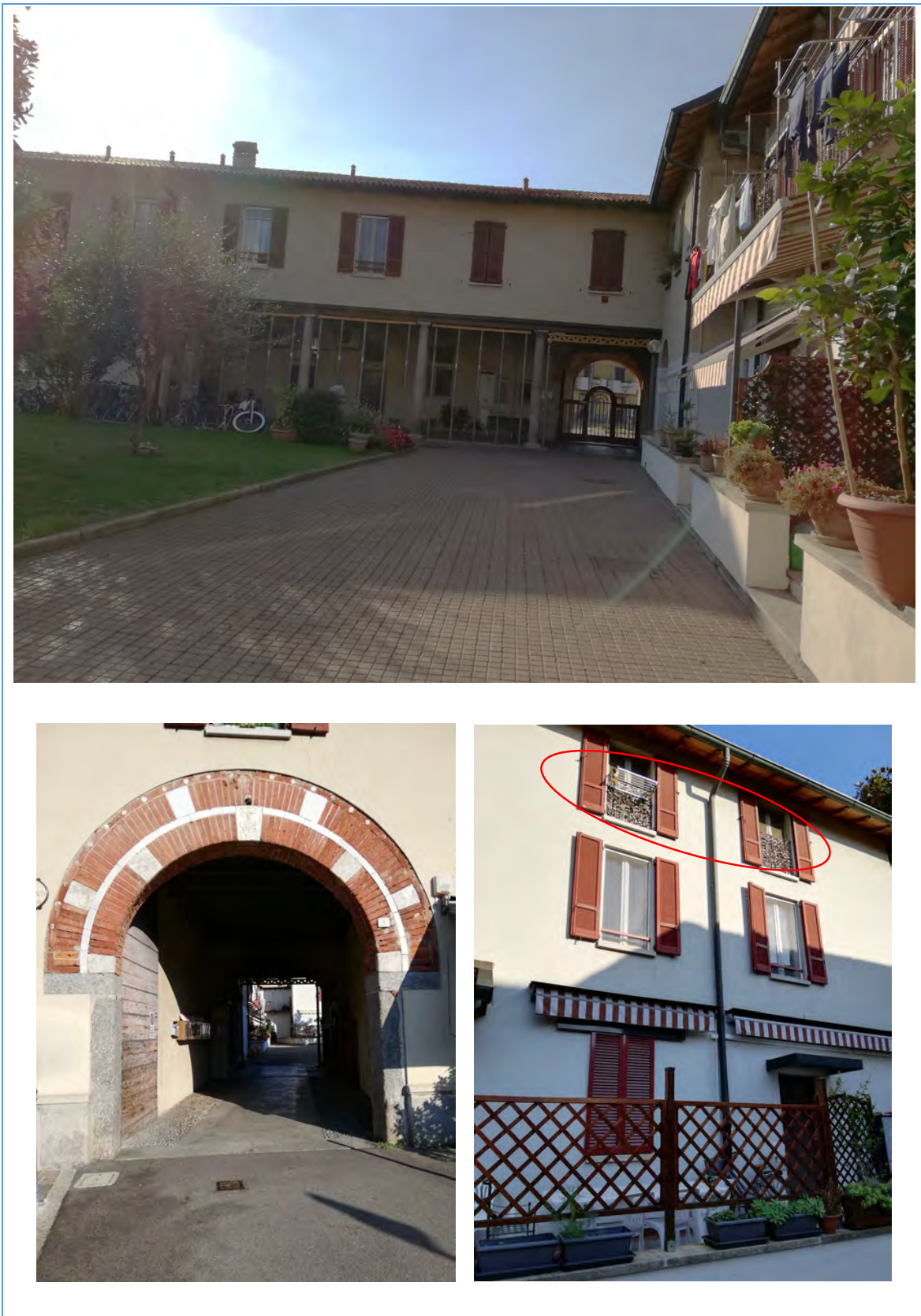
Fig. 3 - 4 - 5: vista del palazzo Arese e della corte dei Piedi Bianchi, vista del portone storico su via Piave, individuazione appartamento (mappale 3)