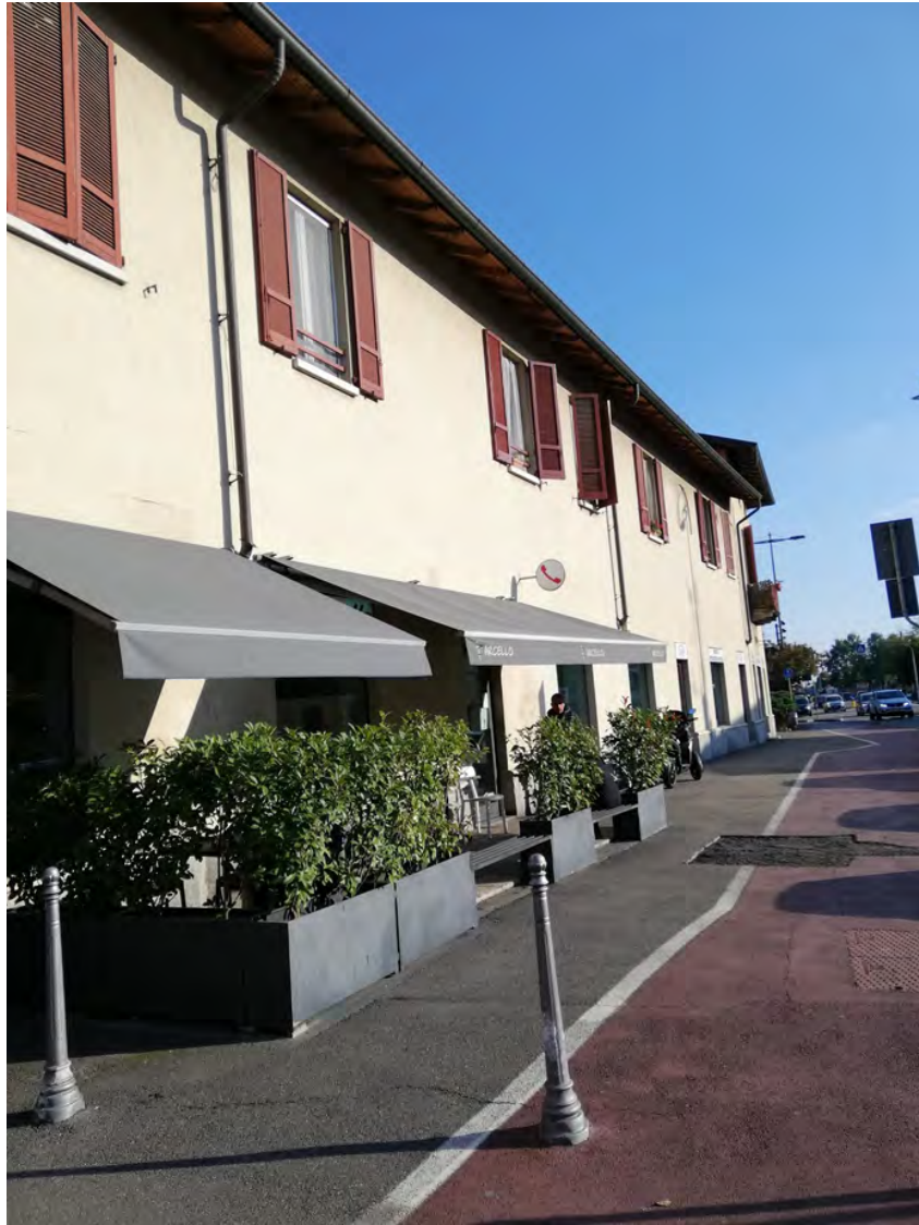
Fig. 27 - 28: vista di via Piave, contesto di riferimento