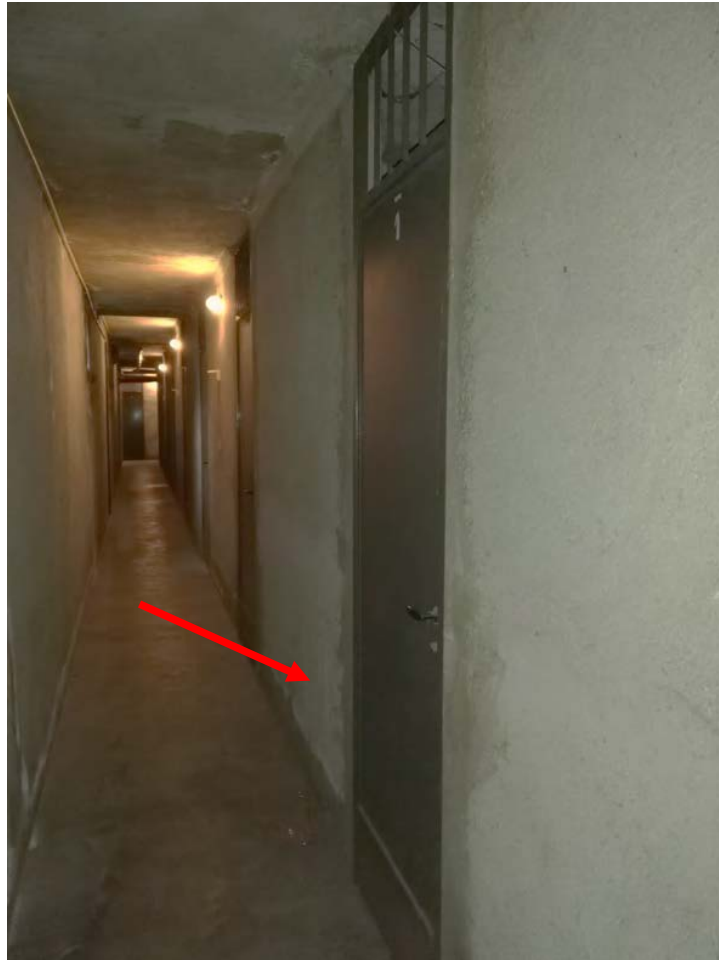
Fig. 15 - 16 - 17: cantina di pertinenza, vano scala e accesso all'immobile