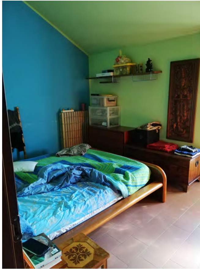
Fig. 25 - 26: camere e accesso al sottotetto