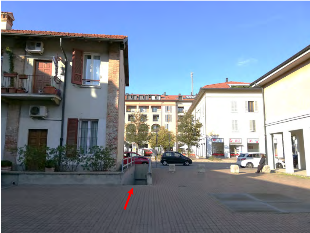
Fig. 10 - 11: vista della corte del Castello con accesso alle cantine, accesso ai box