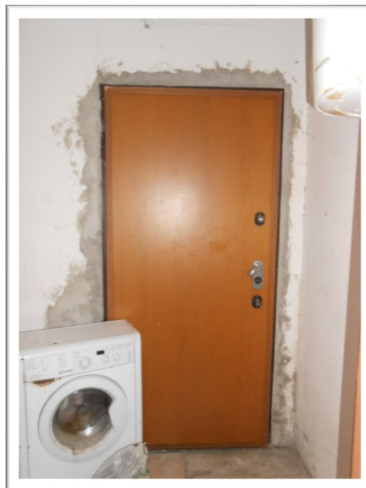
Foto 8 disimpegno e seconda porta d'ingresso