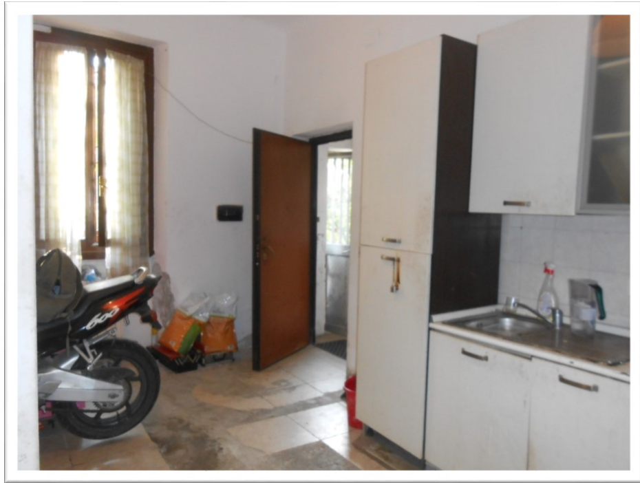
Foto 5 Soggiorno/cucina