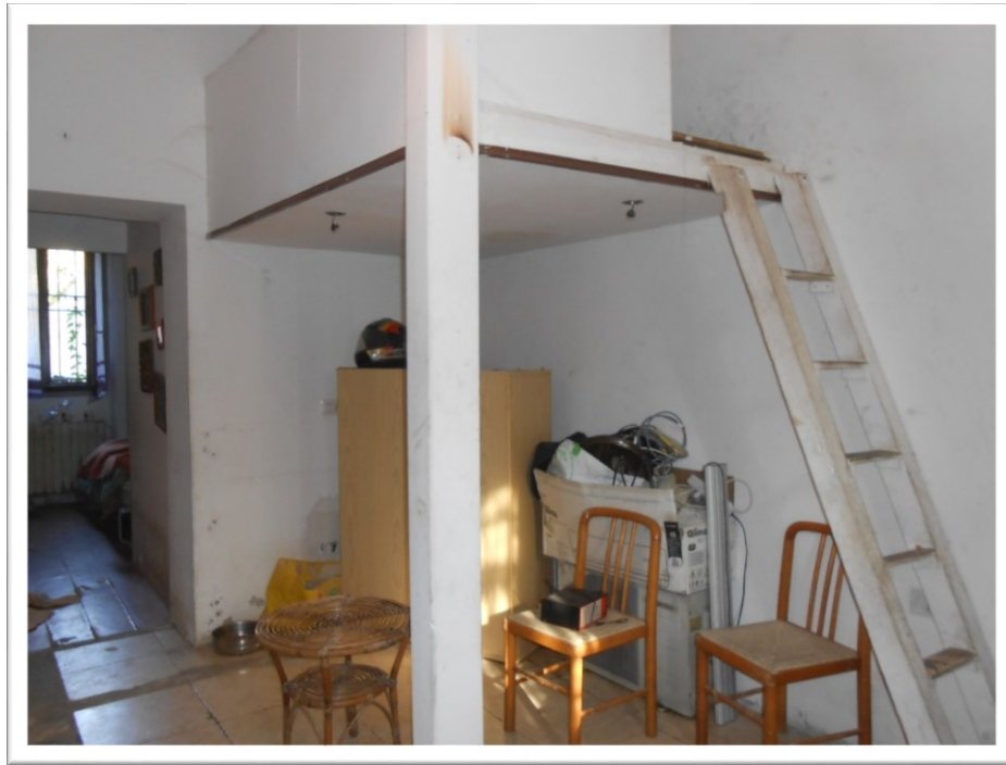
Foto 7 soggiorno/cucina