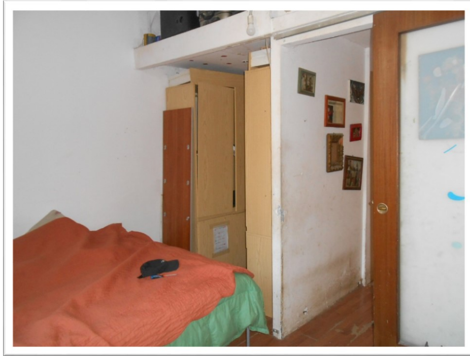
Foto 11 camera