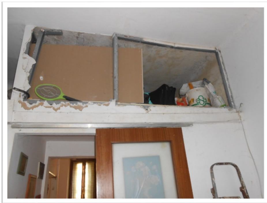
Foto 12 soppalco in quota