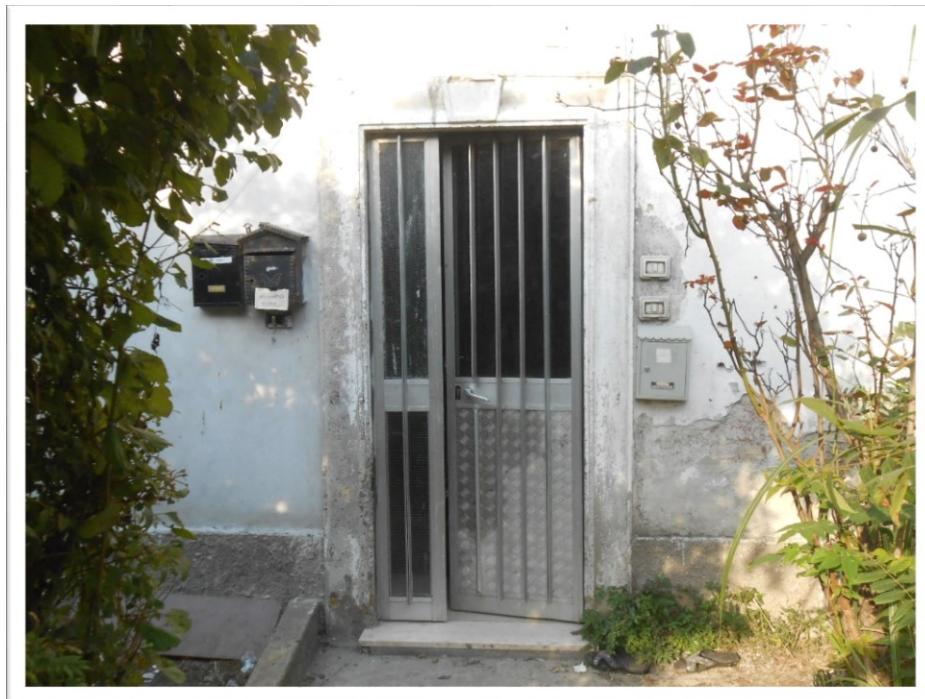
Foto 2 vista edificio