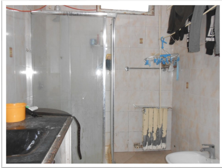
Foto 13 bagno