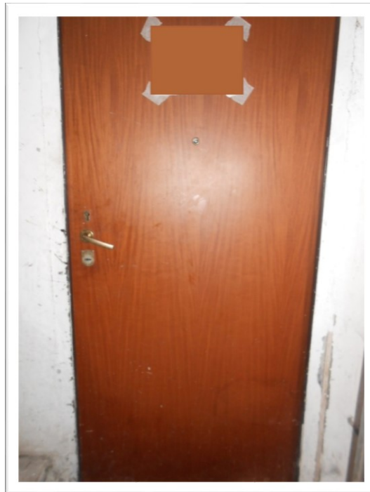
Foto 4 porta ingresso all'immobile