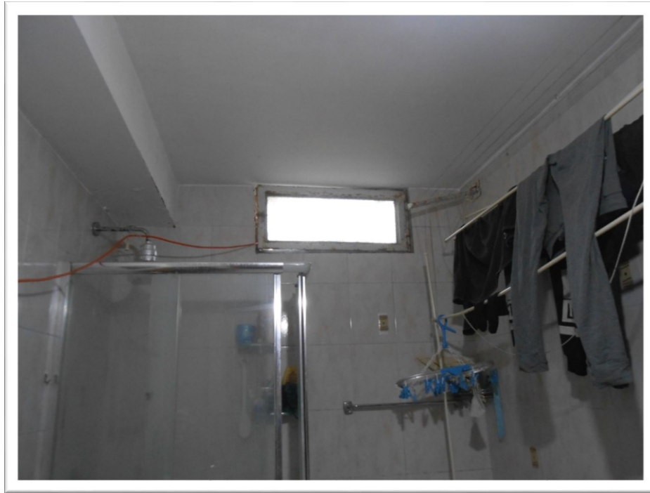
Foto 15 particolare della finestra