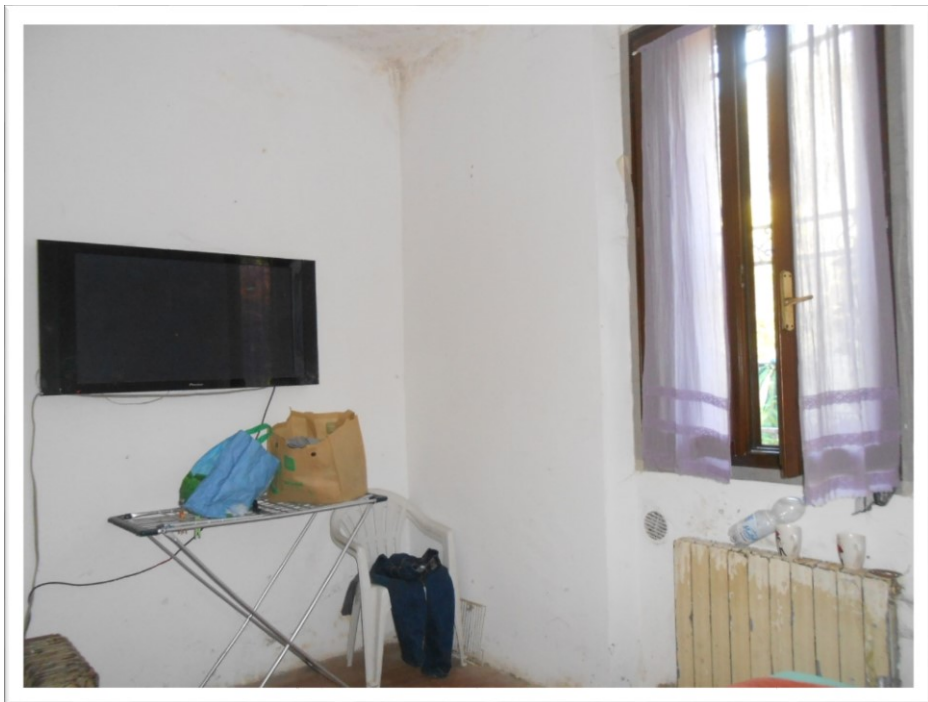
Foto 10 camera