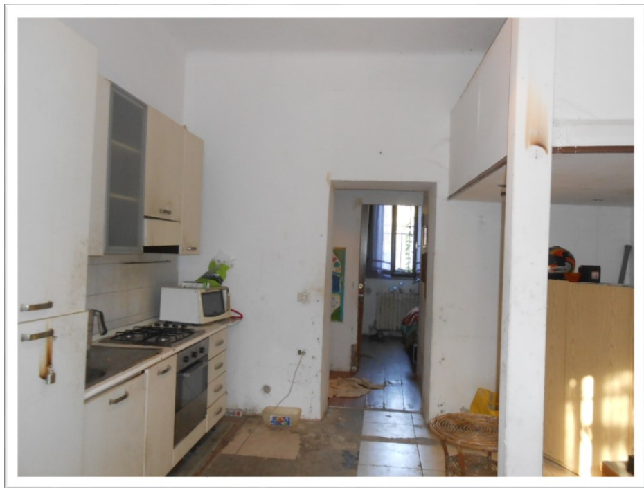
Foto 6 Soggiorno/cucina