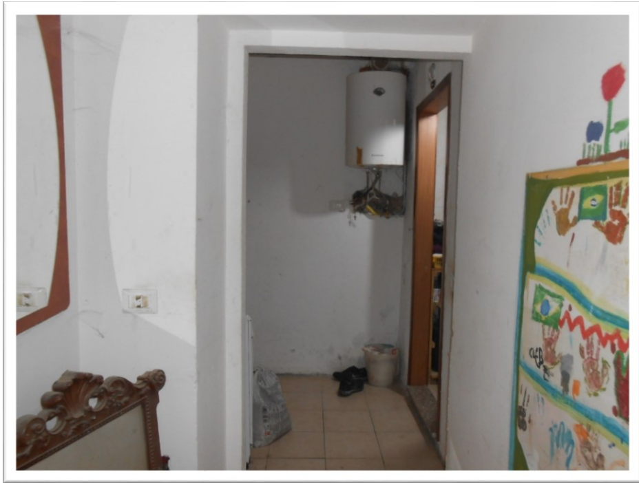
Foto 09 disimpegno