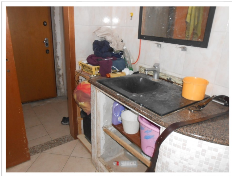
Foto 14 bagno