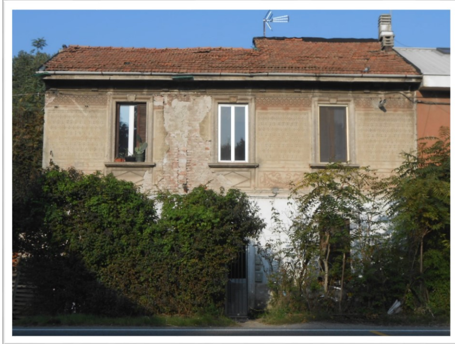
Foto 1 vista dell'edificio