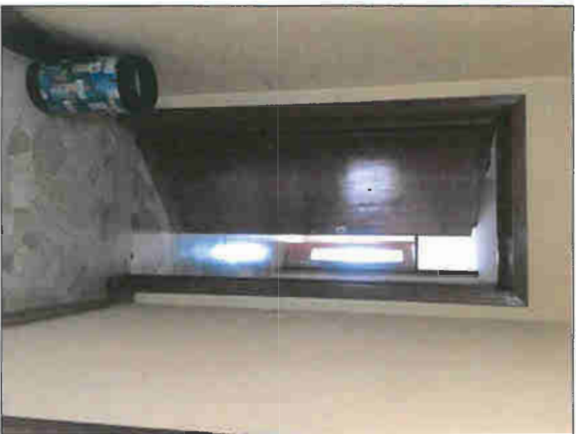
INGRESSO UNITA' IMMOBILIARE