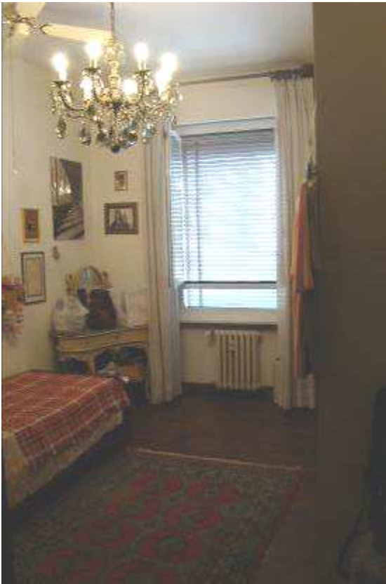
12. Vista dell'altra camera.