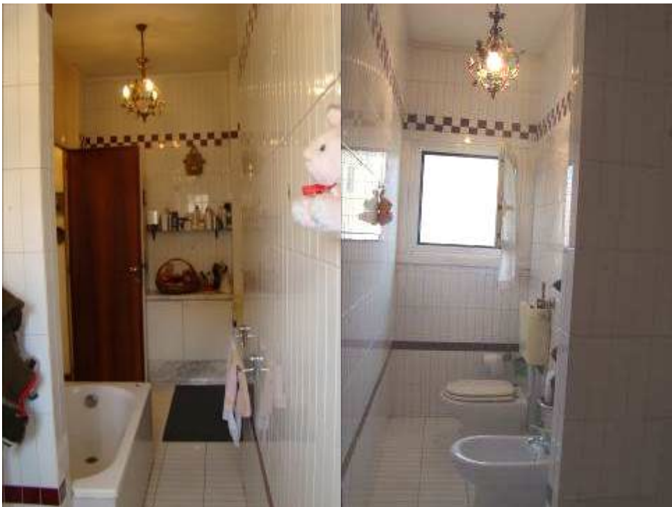
14. Viste dell'altro bagno.