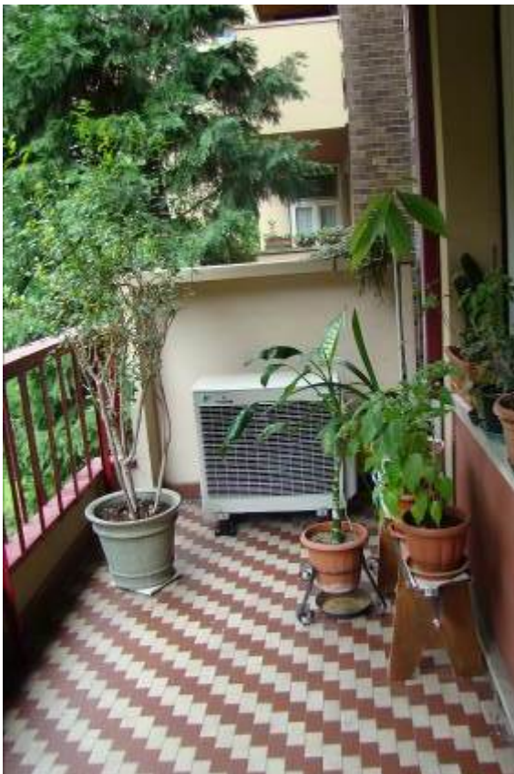
8. Vista del balcone sul giardino interno.