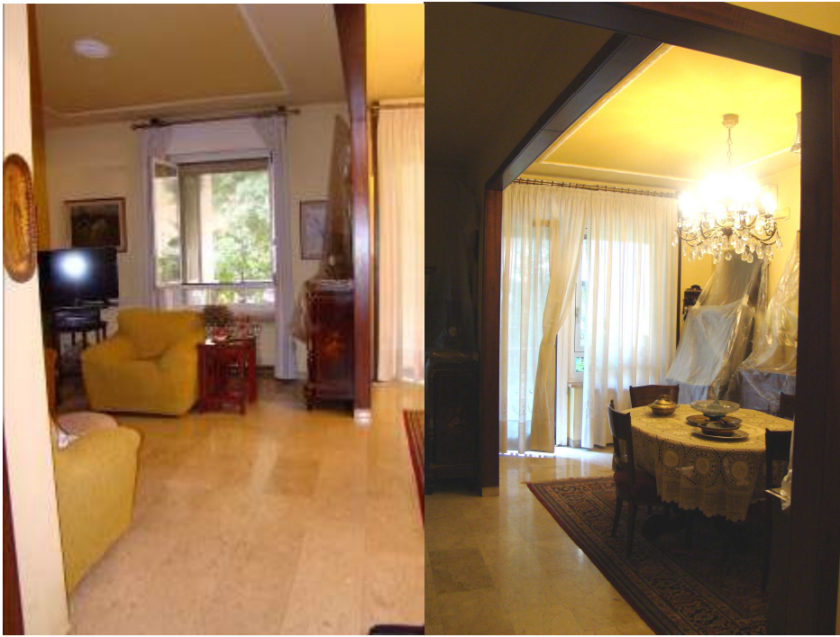
7. Viste del soggiorno.