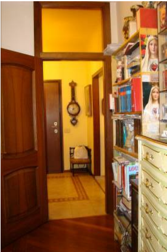
6. Vista dell'ingresso.