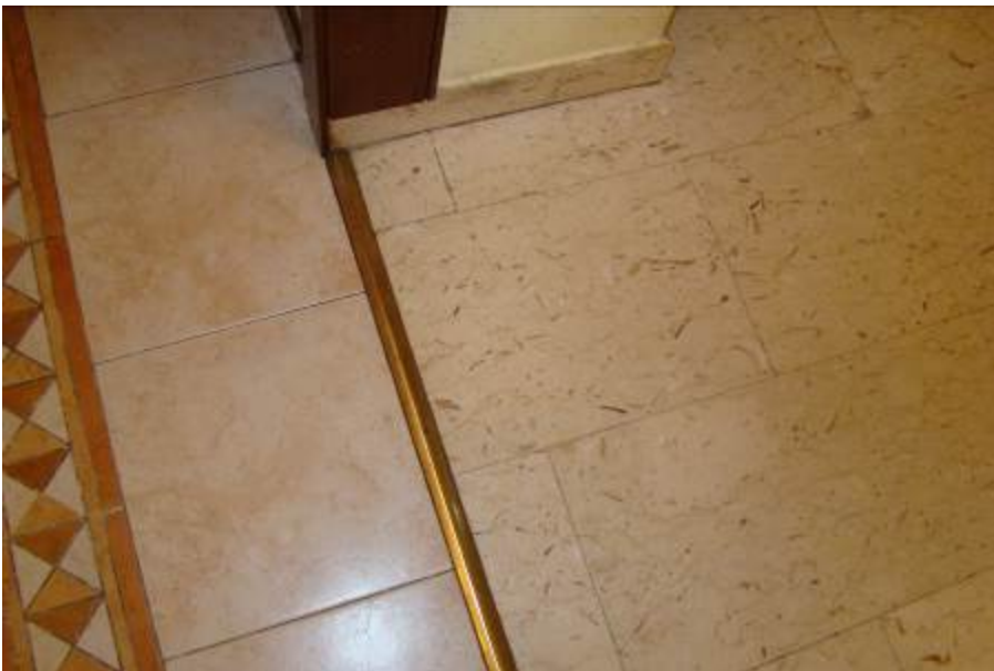
18. Dettaglio del pavimento tra ingresso e cucina.