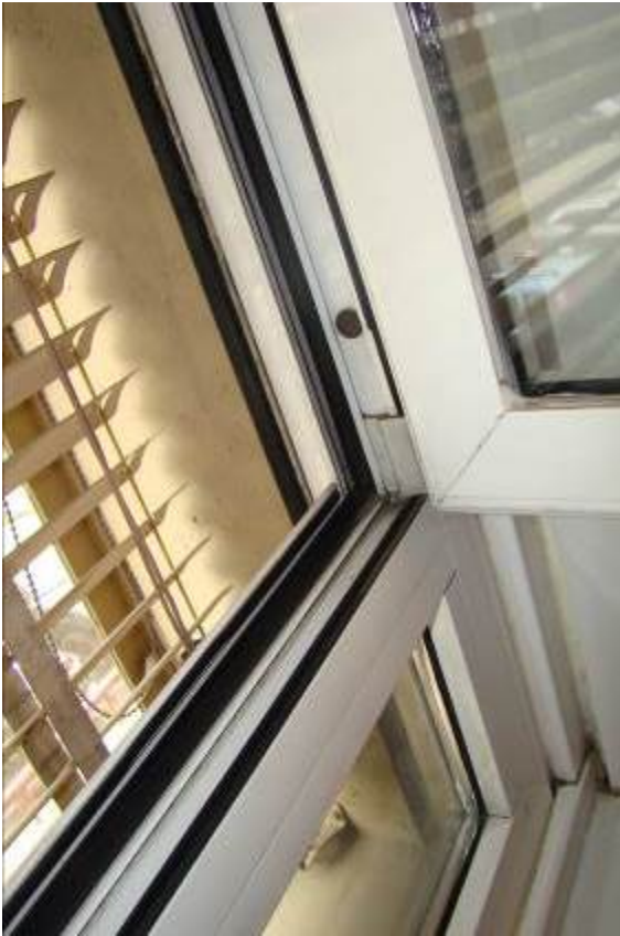
17. Dettaglio del serramento.