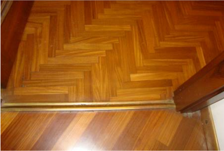
19. Dettaglio del parquet.