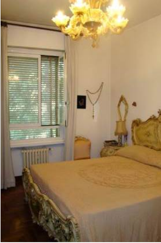
11. Vista della camera.