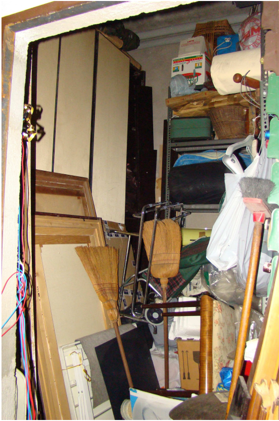
21. Vista interna della cantina.