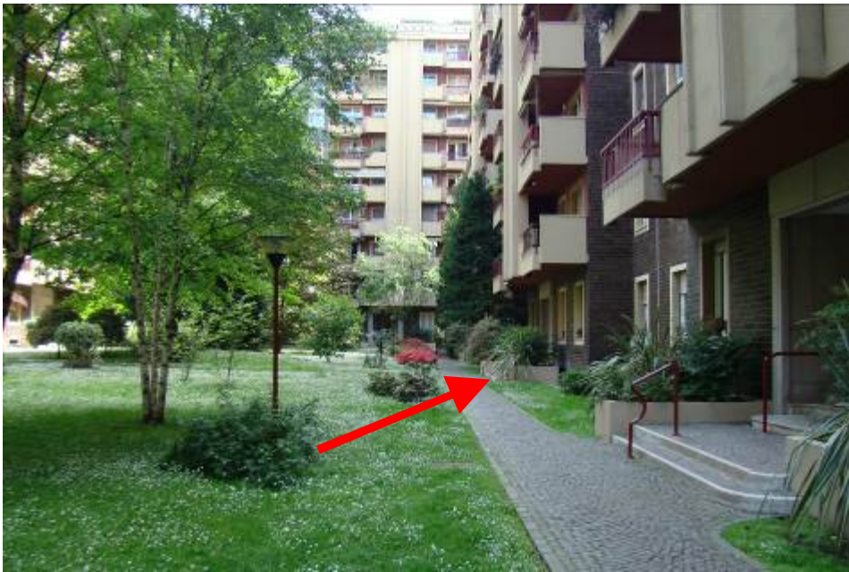
2. Rilievo fotografico del contesto. Vista del cortile interno con individuazione della scala di pertinenza.