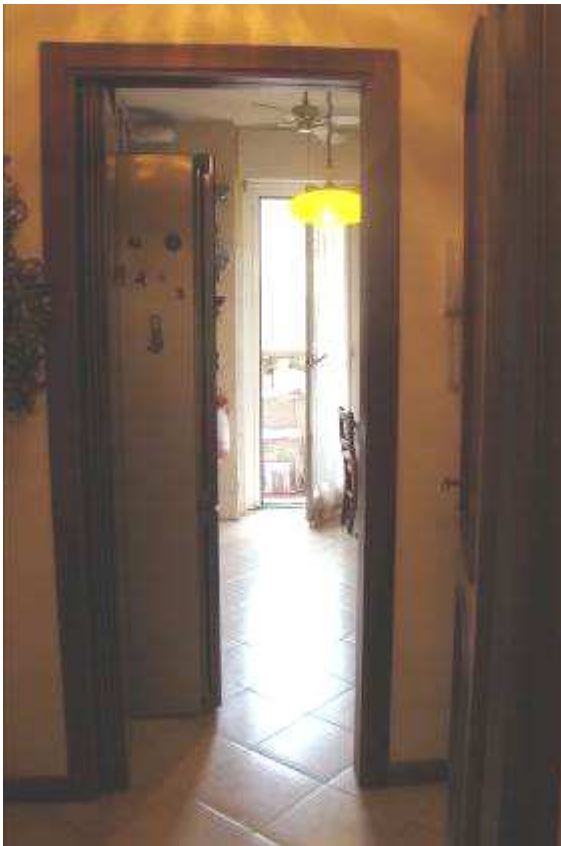
15. Vista della cucina.