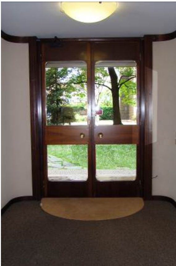
4. Dettaglio del portone di ingresso al palazzo.