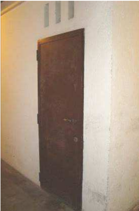
20. Individuazione della cantina.