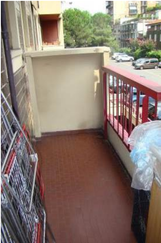
16. Vista del balcone.