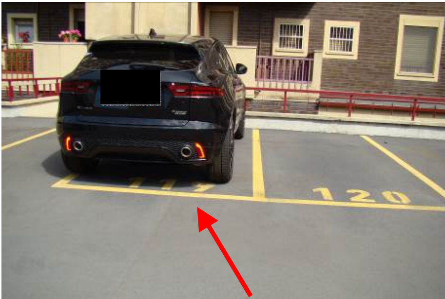
22. Vista del posto auto.