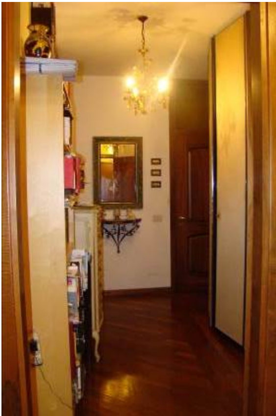
9. Vista del disimpegno.