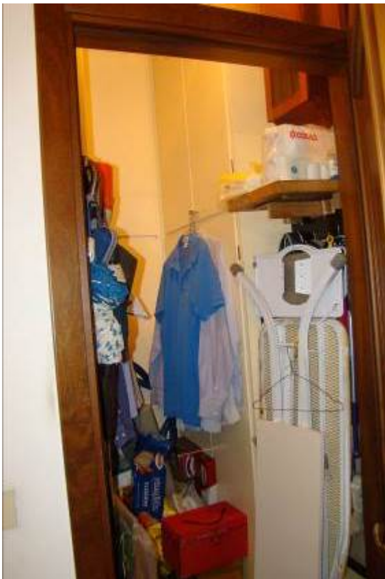
10. Vista del ripostiglio.