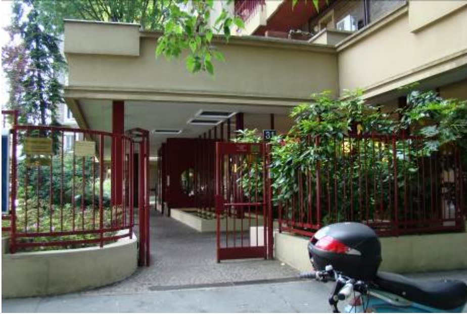
1. Rilievo fotografico del contesto. Vista dell'ingresso pedonale su strada.