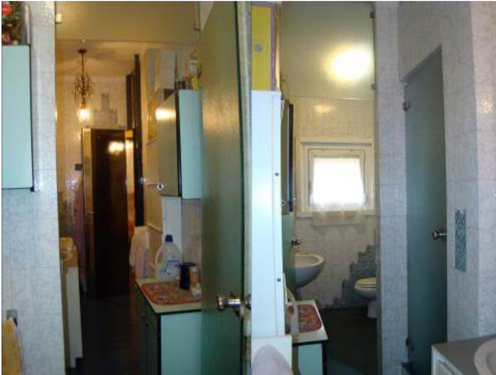
13. Viste del bagno.