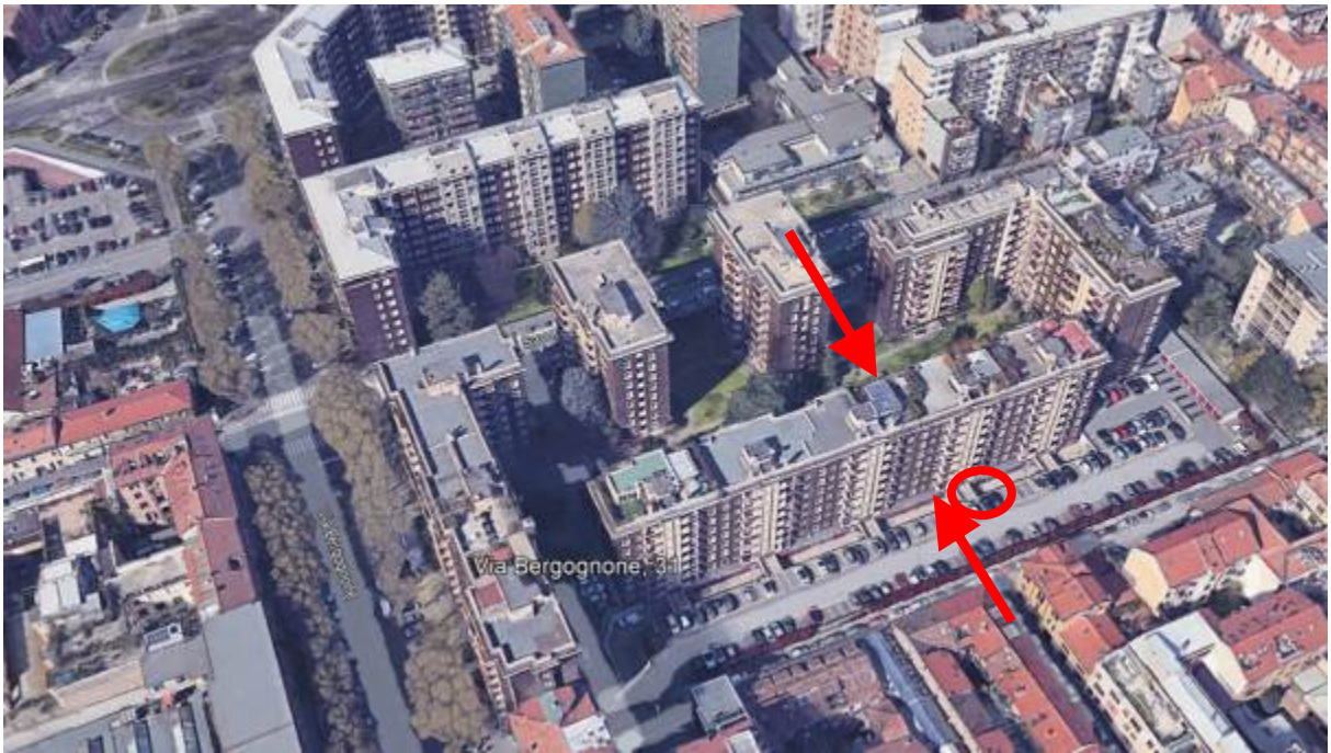
3. Vista aerea del contesto con individuazione del posto auto ed affacci dell'immobile.