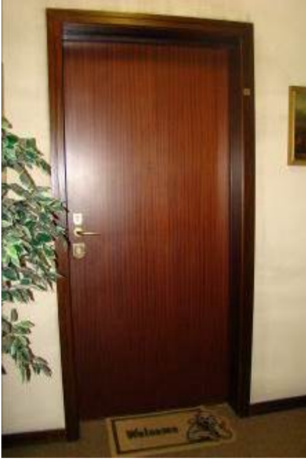
5. Vista della porta di accesso all'alloggio.