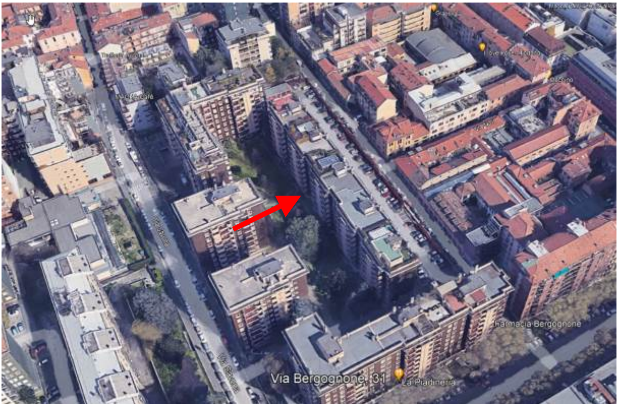
4. Vista aerea del contesto con individuazione degli affacci dell'immobile sul cortile interno.