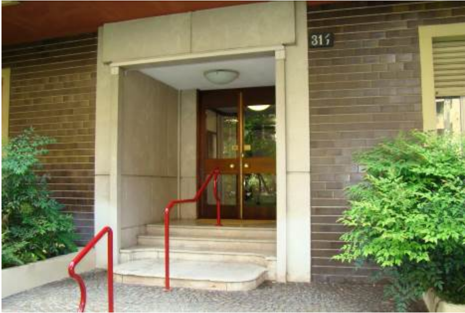
3. Rilievo fotografico del contesto. Vista dell'accesso alla scala di pertinenza.