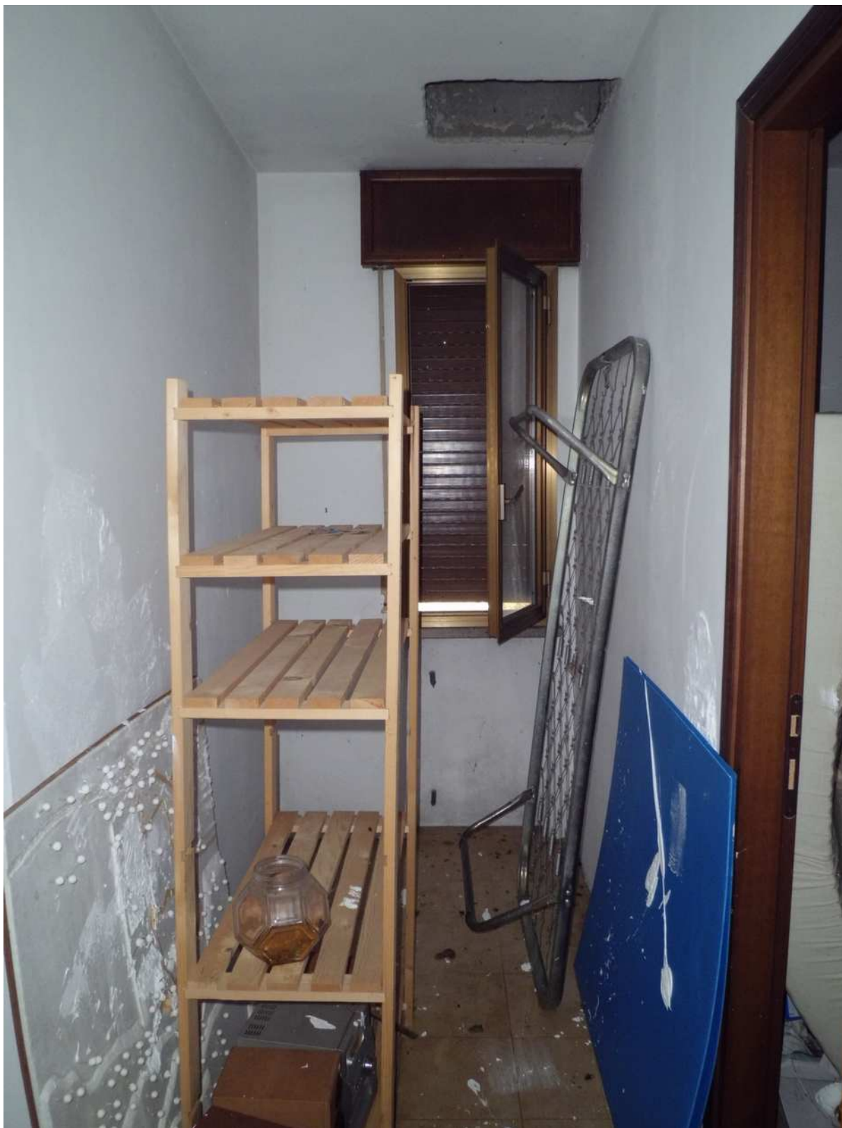
Foto n° 18 - 20/01/2019 - Comune di Meduno, foglio 19, part. 1509 – Disimpegno al livello rialzato del primo piano. In alto a destra visibile il varco che conduce al sottotetto.