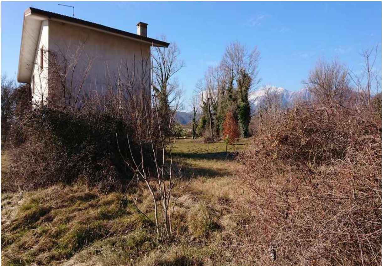
Foto n° 26 - 20/01/2019 - Comune di Meduno, foglio 19, part. 1509 – Terreno posto sul retro dell'abitazione.