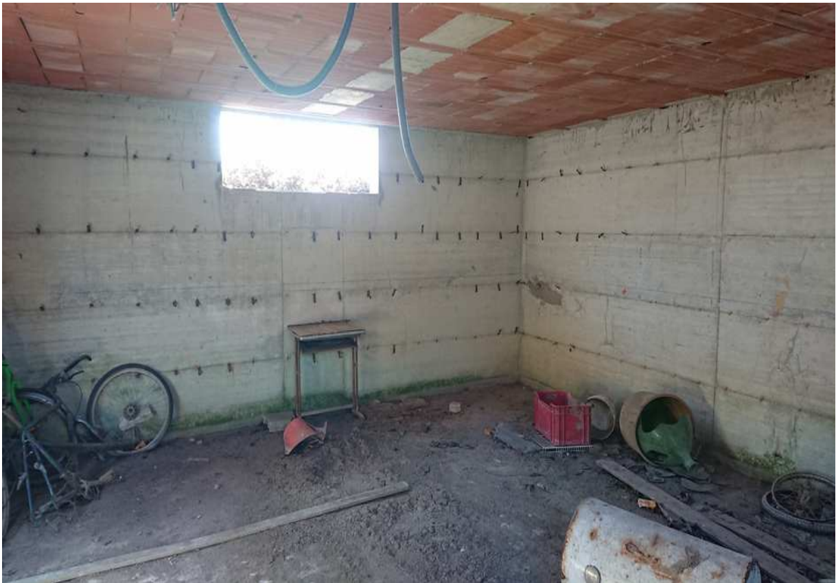
Foto n° 24 - 20/01/2019 - Comune di Meduno, foglio 19, part. 1509 – Vano al piano seminterrato catastalmente identificato come cantina.