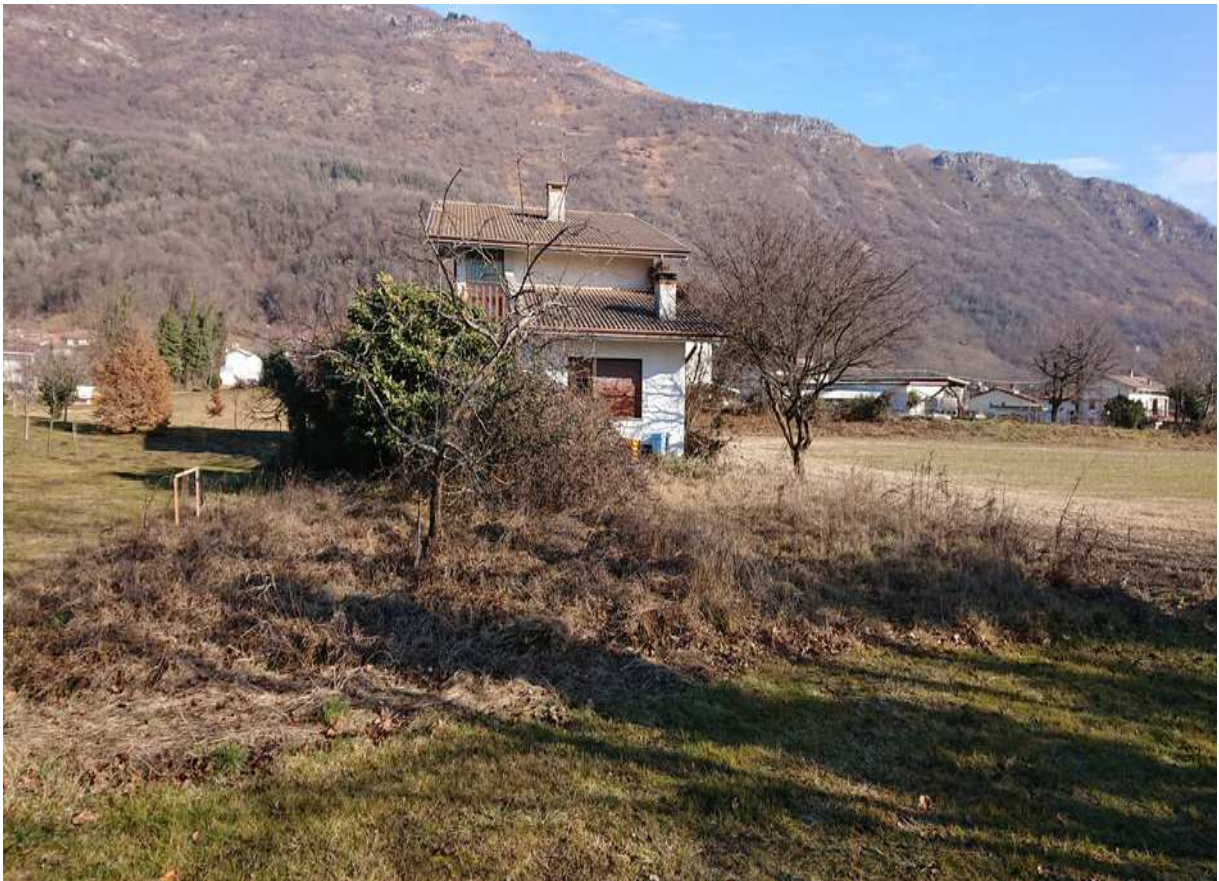
Foto n° 1 - 20/01/2019 - Comune di Meduno, foglio 19, part. 1509 – Visione esterna degli immobili pignorati.