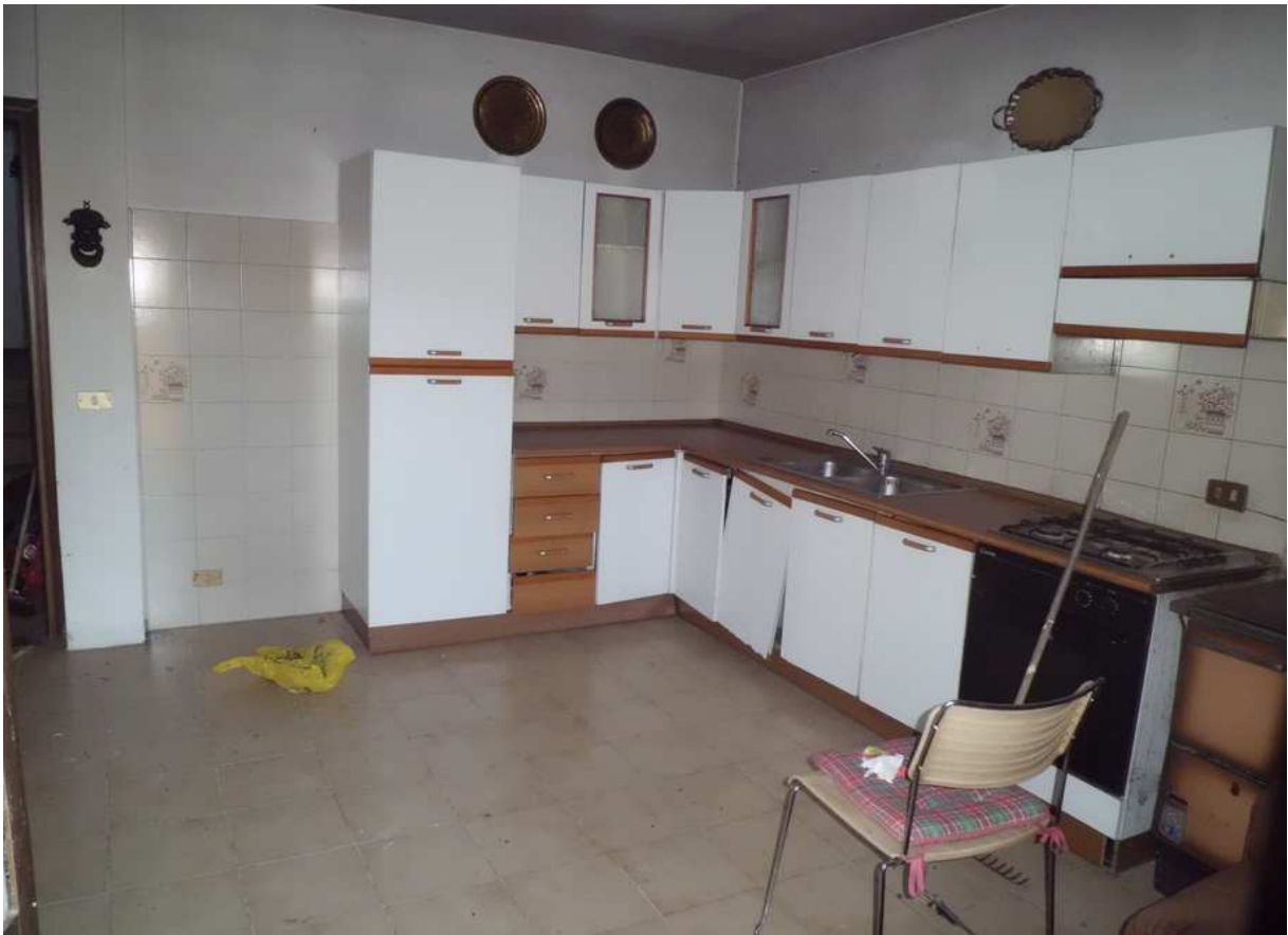
Foto n° 3 - 20/01/2019 - Comune di Meduno, foglio 19, part. 1509 – Stanza catastalmente identificata come cucina. Fotografia scattata dalla porta di accesso esterna.