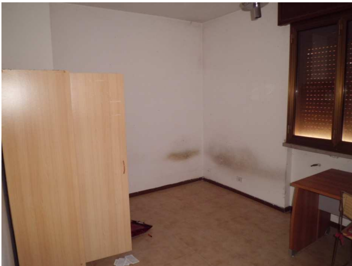
Foto n° 6 - 20/01/2019 - Comune di Meduno, foglio 19, part. 1509 – Soggiorno al piano terra.