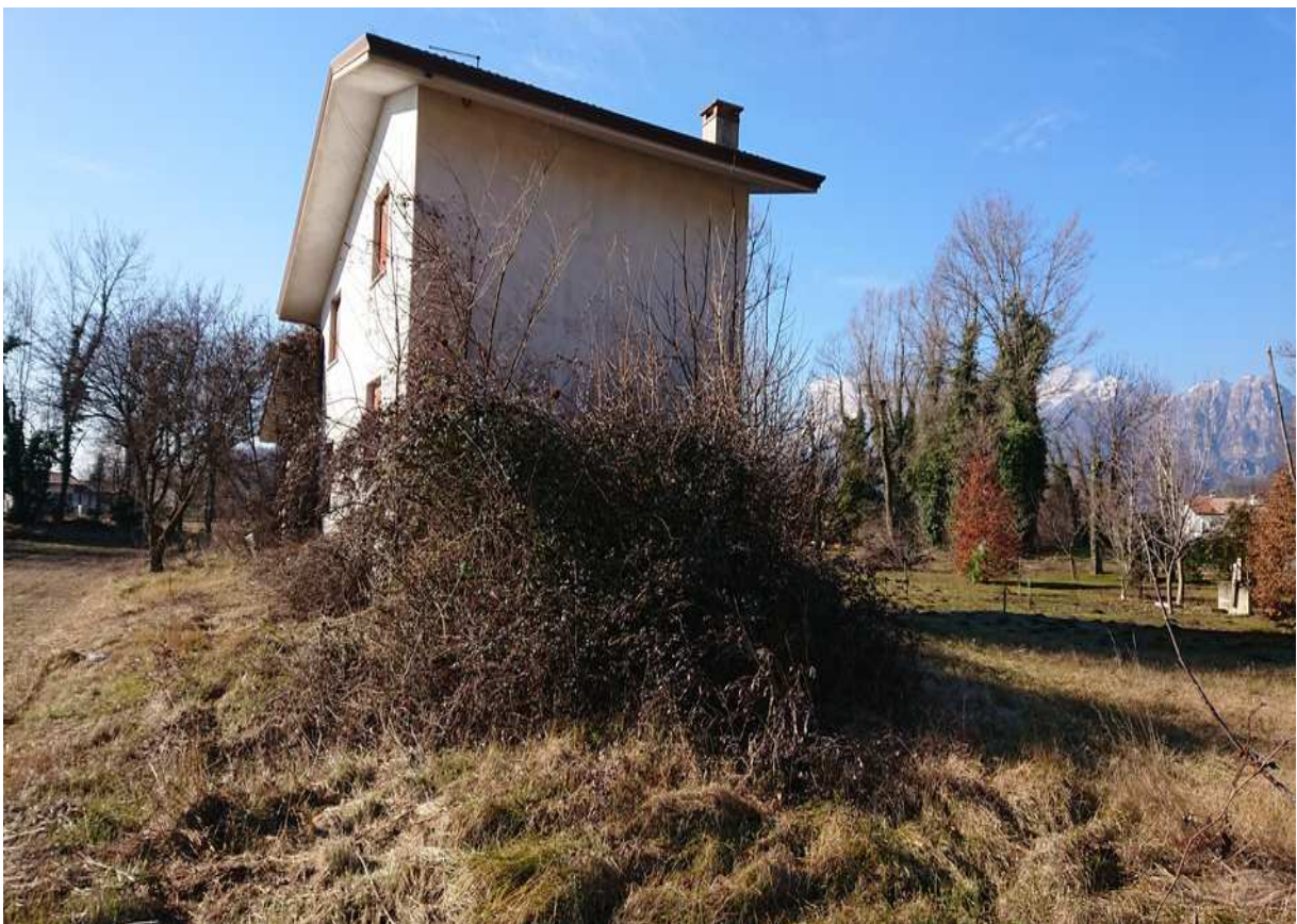
Foto n° 27 - 20/01/2019 - Comune di Meduno, foglio 19, part. 1509 – Terreno posto sul retro dell'abitazione.