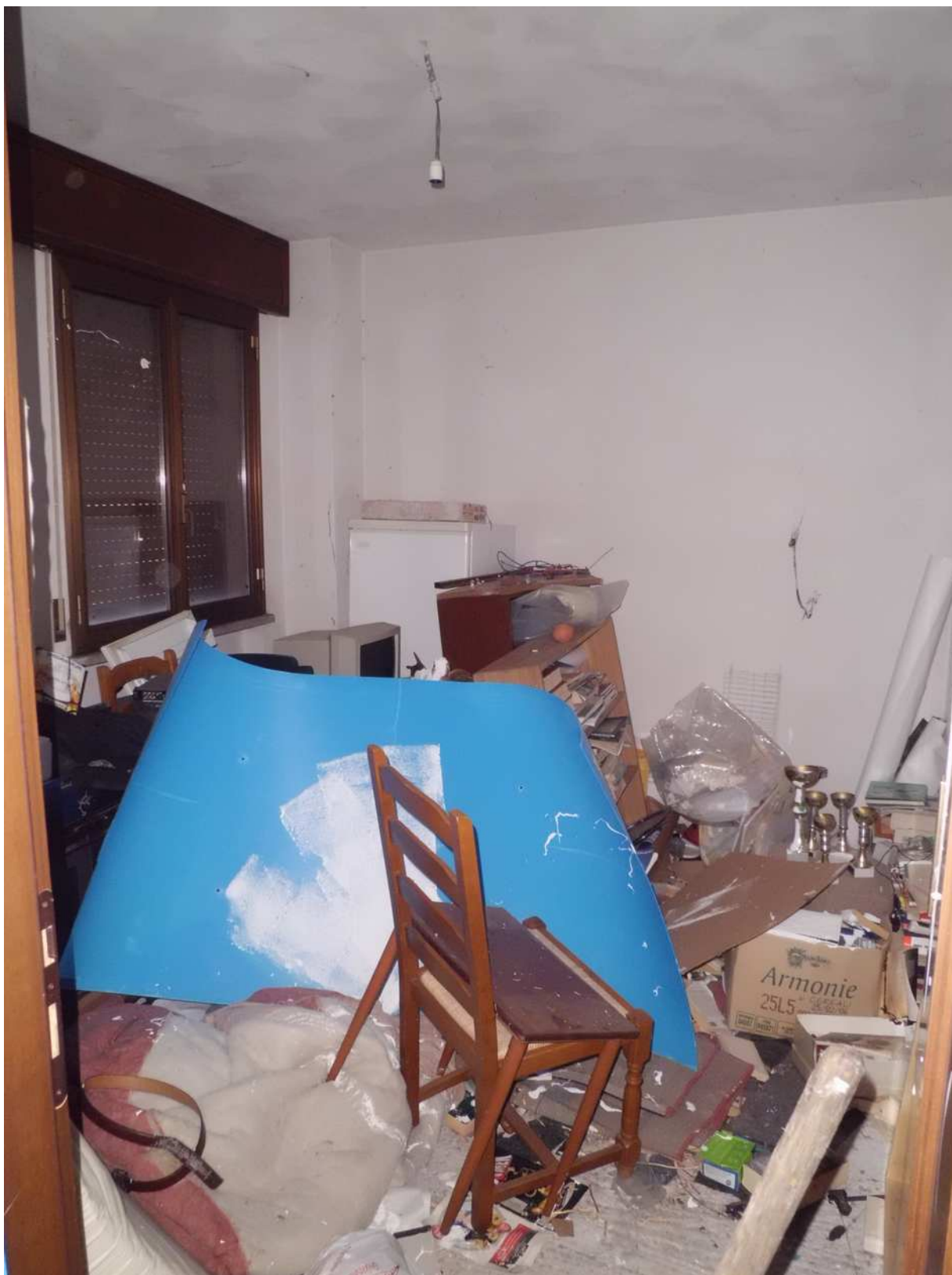
Foto n° 19 - 20/01/2019 - Comune di Meduno, foglio 19, part. 1509 – Stanza al primo piano catastalmente identificata come bagno, con pavimento al grezzo.