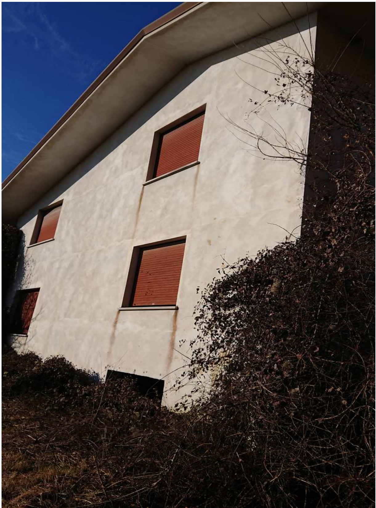
Foto n° 29 - 20/01/2019 - Comune di Meduno, foglio 19, part. 1509 – Esterno dell'edificio, lato sud-est.