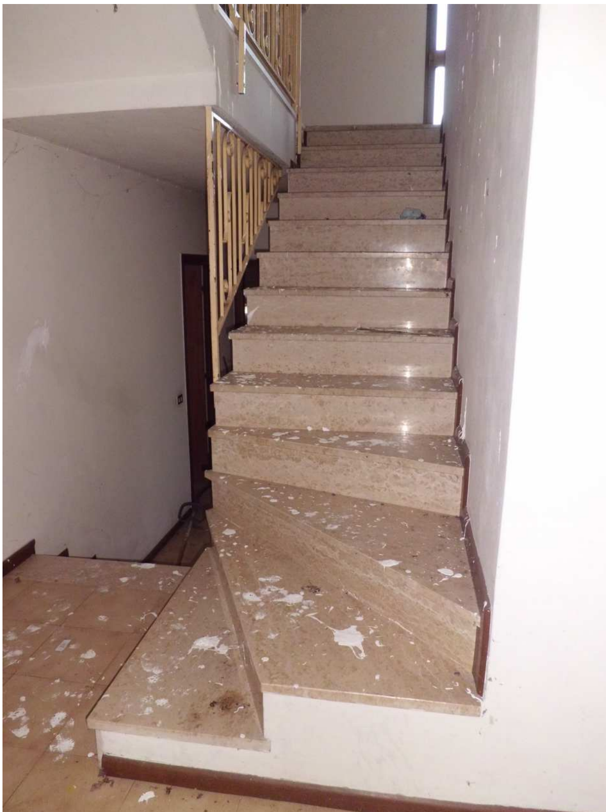
Foto n° 14 - 20/01/2019 - Comune di Meduno, foglio 19, part. 1509 – Scale interne che collegano i piani dell'edificio.