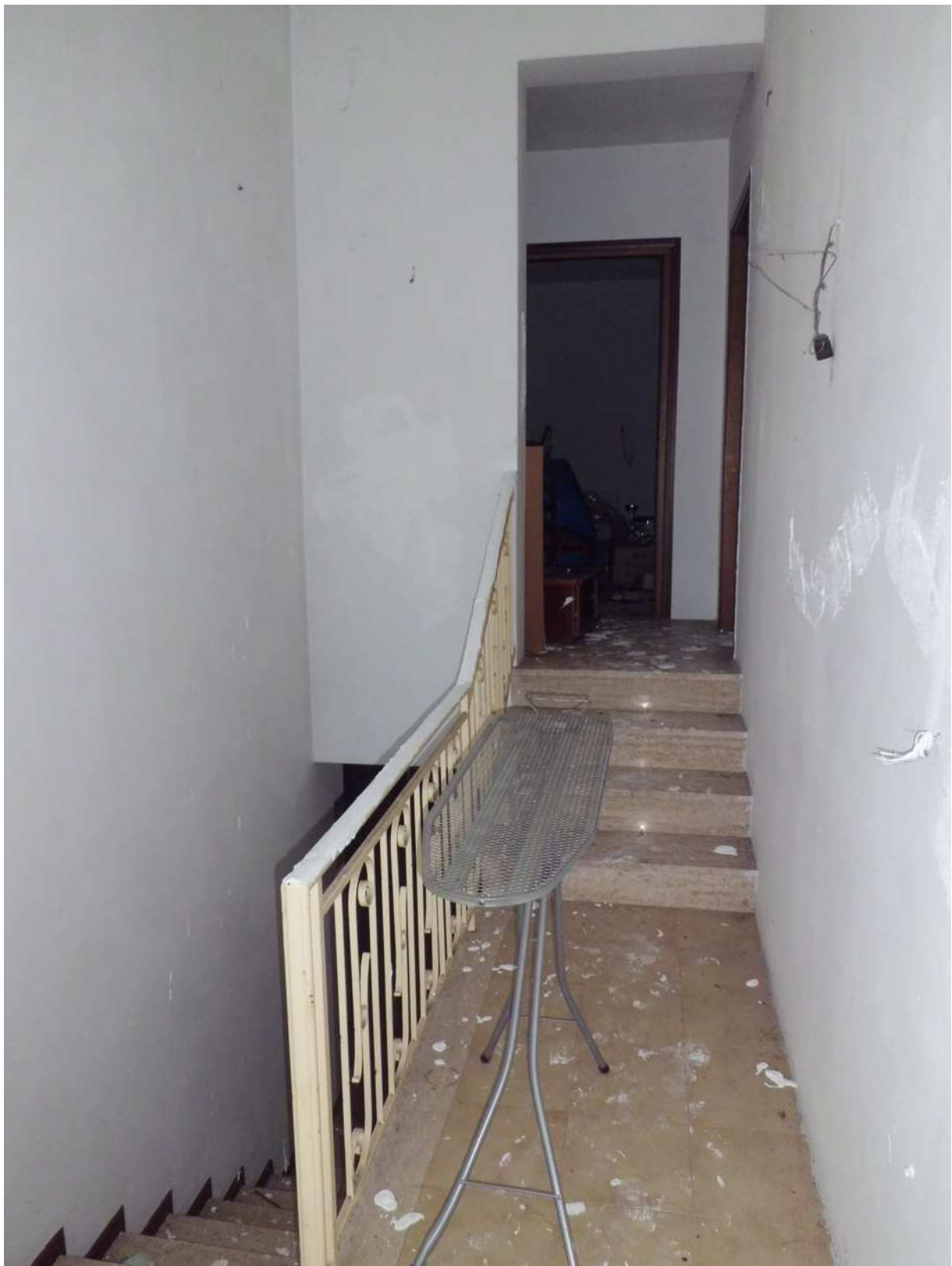
Foto n° 15 - 20/01/2019 - Comune di Meduno, foglio 19, part. 1509 – Corridoio al piano superiore. Visibili le scale che conducono al livello rialzato.