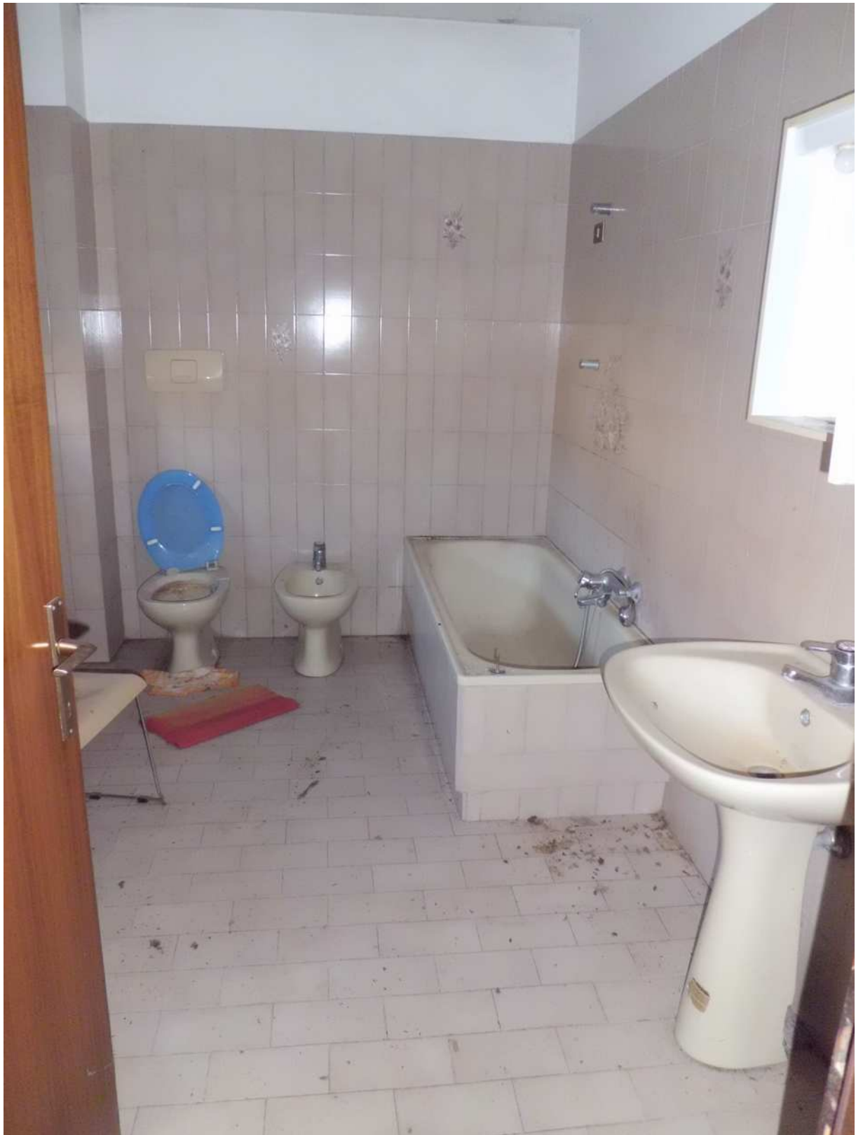
Foto n° 12 - 20/01/2019 - Comune di Meduno, foglio 19, part. 1509 – Bagno.