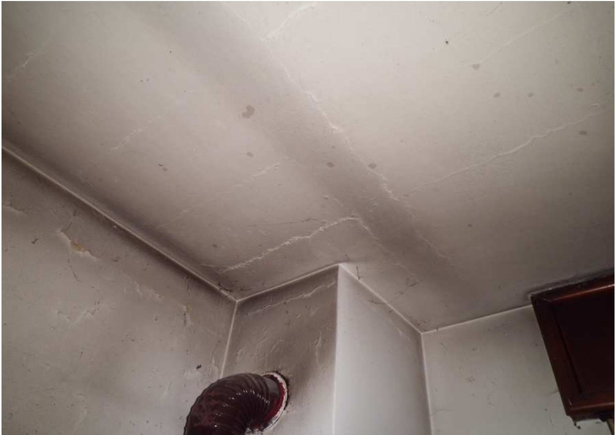
Foto n° 4 - 20/01/2019 - Comune di Meduno, foglio 19, part. 1509 – Stanza catastalmente identificata come cucina. Particolare del soffitto.