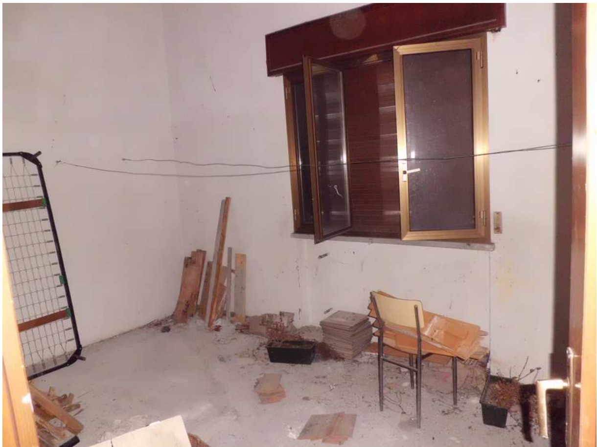
Foto n° 16 - 20/01/2019 - Comune di Meduno, foglio 19, part. 1509 – Stanza posta a sud-est dell'edificio catastalmente individuata come camera; visibile il pavimento al grezzo.