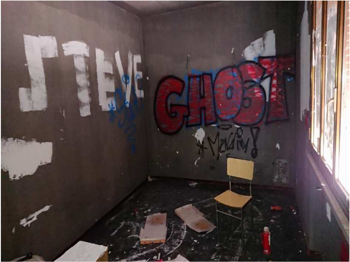
Foto n° 21 - 20/01/2019 - Comune di Meduno, foglio 19, part. 1509 – Stanza al primo piano catastalmento identificata come camera.