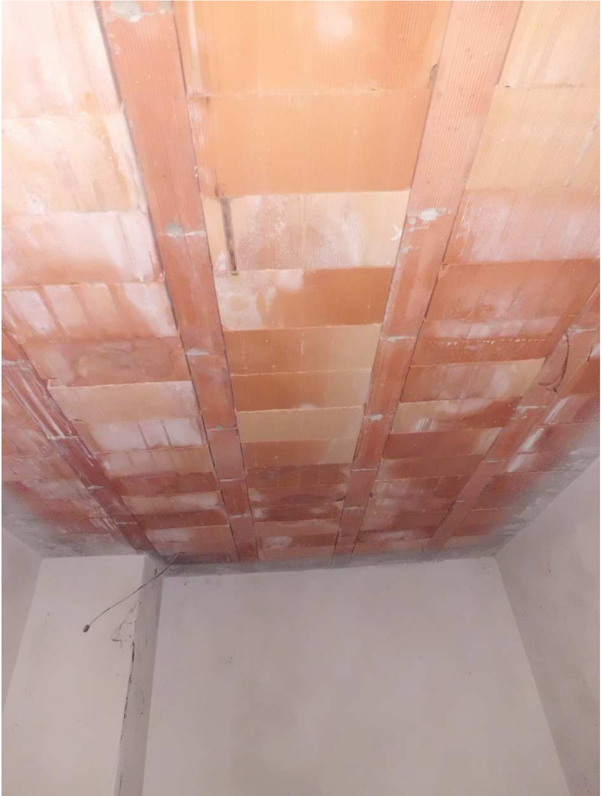
Foto n° 17 - 20/01/2019 - Comune di Meduno, foglio 19, part. 1509 – Stanza posta a sud-est dell'edificio catastalmente individuata come camera; visibile il soffitto al grezzo.