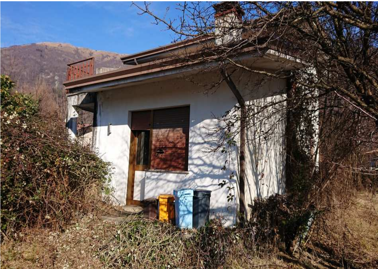
Foto n° 2 - 20/01/2019 - Comune di Meduno, foglio 19, part. 1509 – Visione esterna dell'abitazione pignorata. Porta di accesso alla cucina.