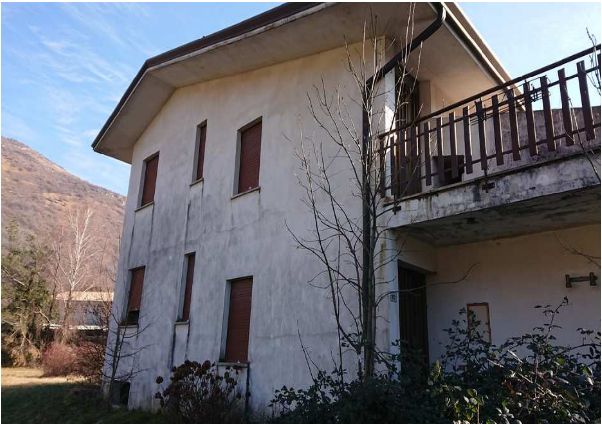
Foto n° 28 - 20/01/2019 - Comune di Meduno, foglio 19, part. 1509 – Esterno dell'edificio, lato nord-ovest.