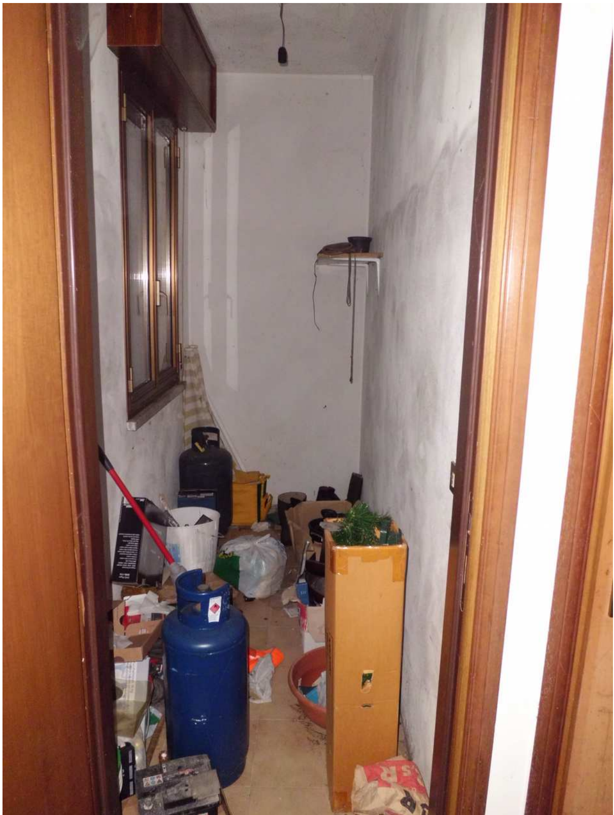
Foto n° 8 - 20/01/2019 - Comune di Meduno, foglio 19, part. 1509 – Ripostiglio al piano terra.