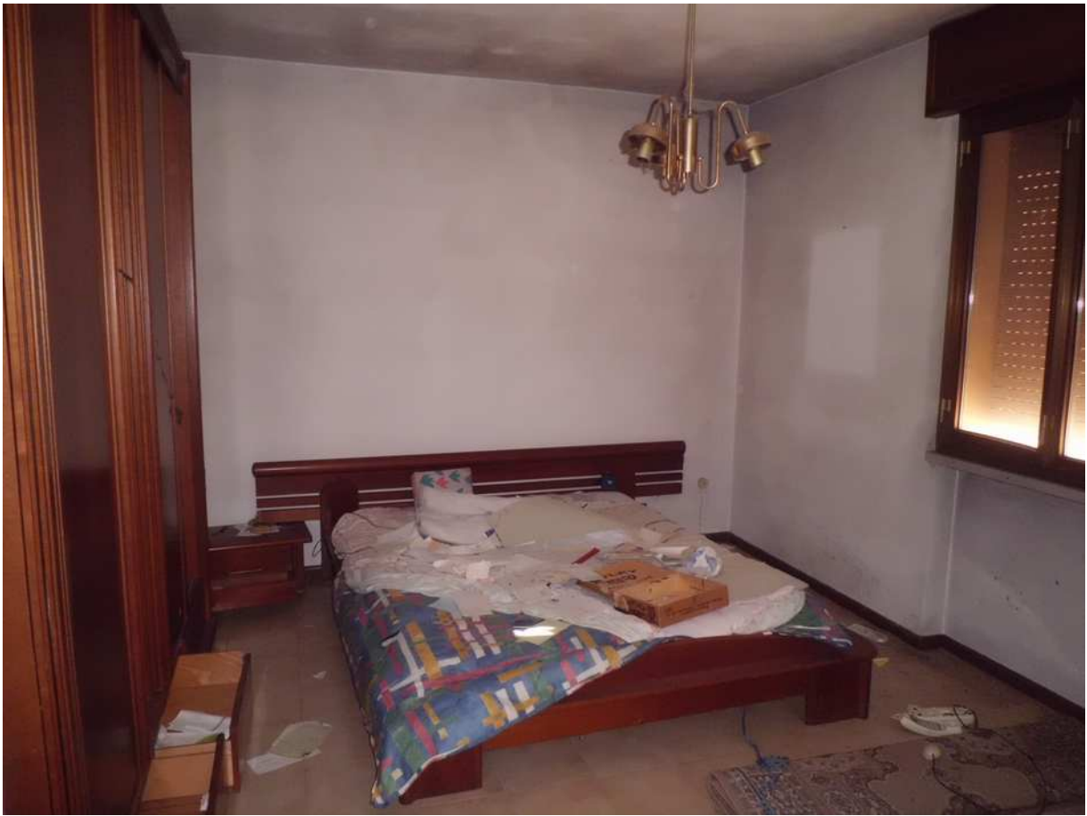
Foto n° 11 - 20/01/2019 - Comune di Meduno, foglio 19, part. 1509 – Camera.