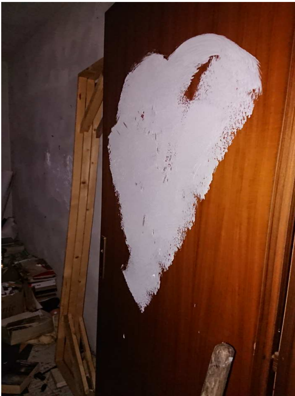
Foto n° 20 - 20/01/2019 - Comune di Meduno, foglio 19, part. 1509 – Stanza al primo piano catastalmente identificata come bagno. Visibile la porta di accesso danneggiata.