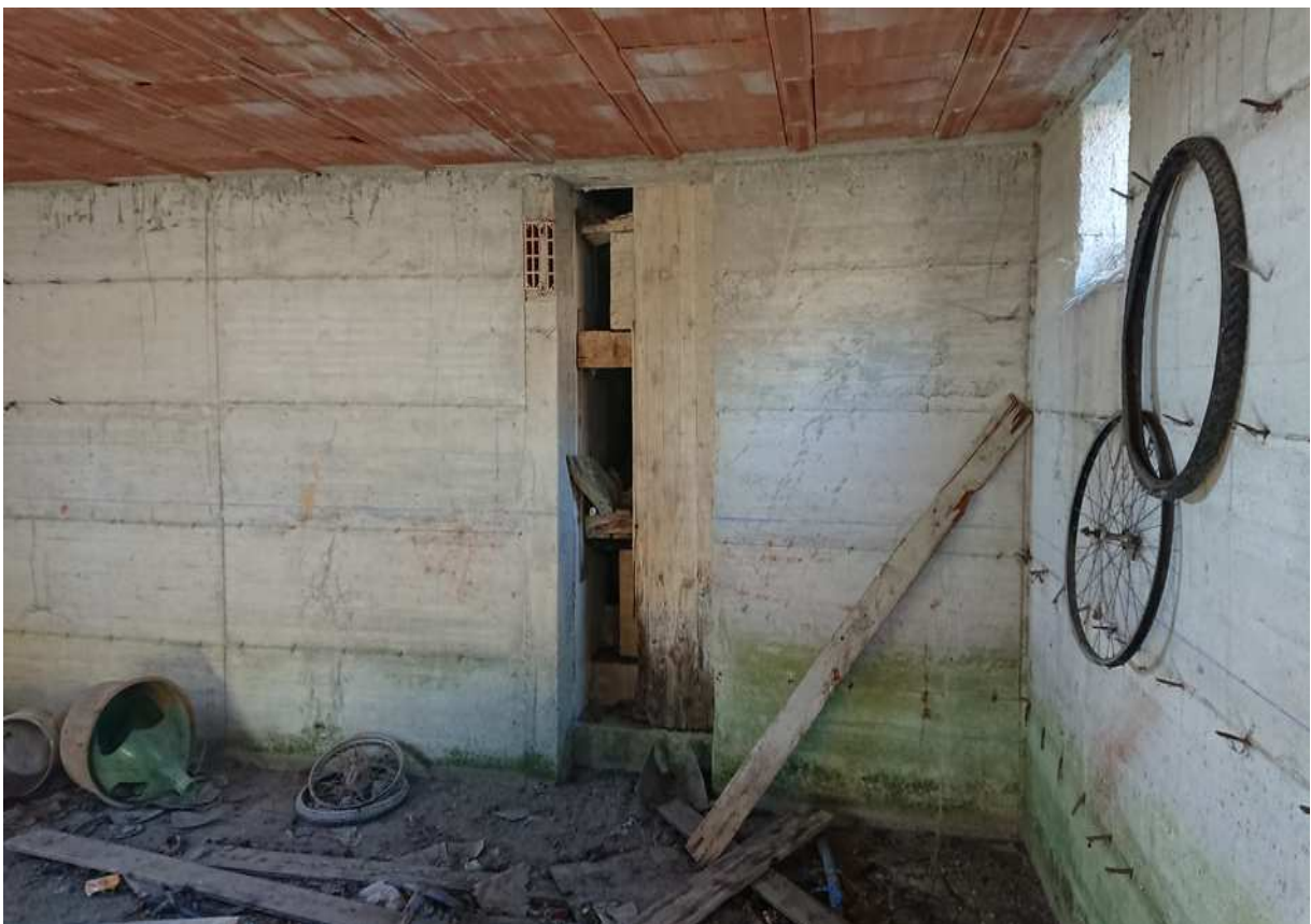
Foto n° 25 - 20/01/2019 - Comune di Meduno, foglio 19, part. 1509 – Vano al piano seminterrato catastalmente identificato come cantina. Visibile l'accesso alle scale che conducono al piano terra dell'abitazione.