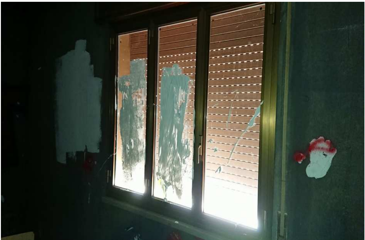
Foto n° 22 - 20/01/2019 - Comune di Meduno, foglio 19, part. 1509 – Stanza al primo piano catastalmento identificata come camera. Danneggiamenti alle finestre.