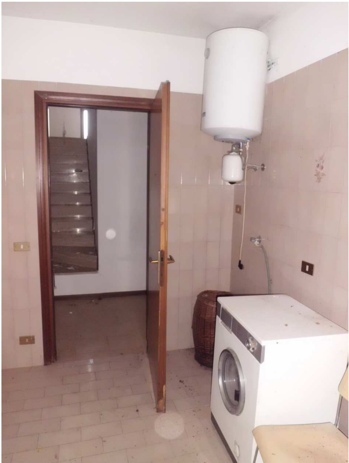
Foto n° 13 - 20/01/2019 - Comune di Meduno, foglio 19, part. 1509 – Bagno.