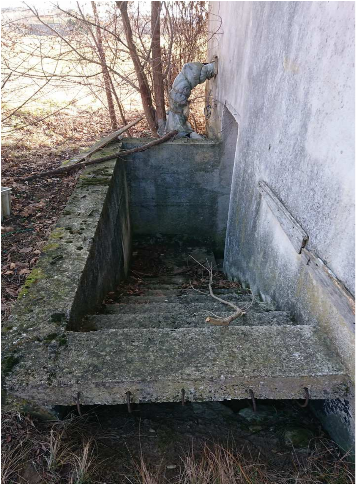
Foto n° 23 - 20/01/2019 - Comune di Meduno, foglio 19, part. 1509 – Scale esterne che conducono al piano seminterrato, catastalmente identificato come cantina.