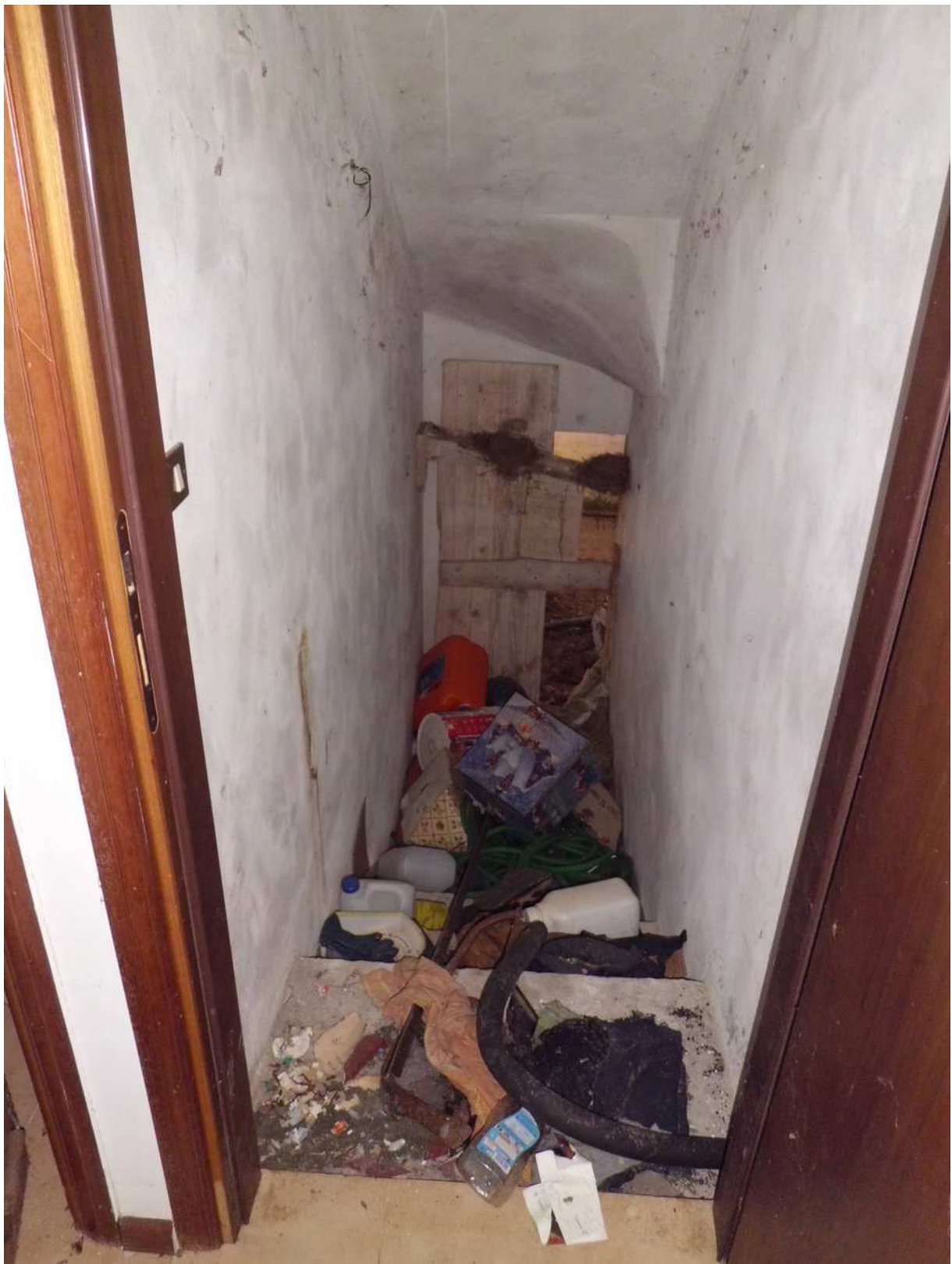
Foto n° 9 - 20/01/2019 - Comune di Meduno, foglio 19, part. 1509 – Scale che conducono alla cantina.