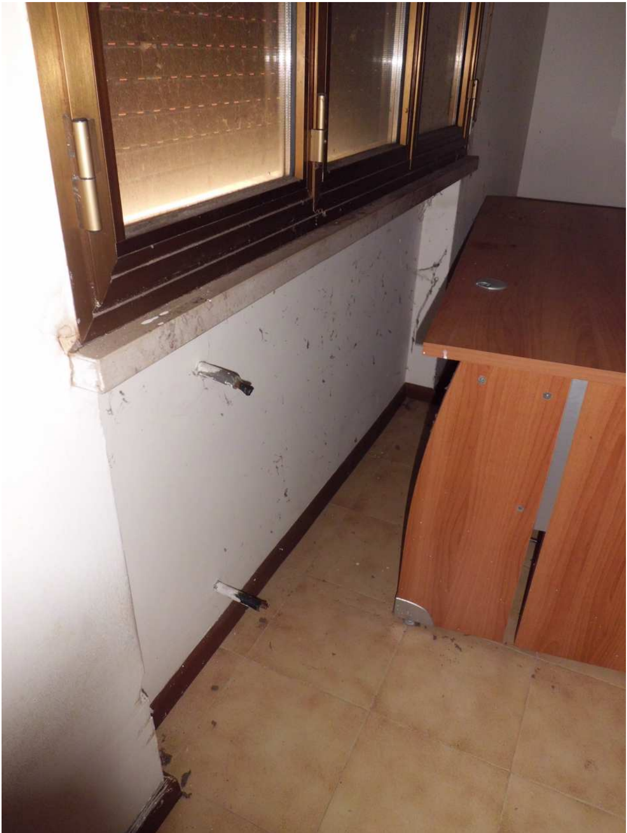
Foto n° 7 - 20/01/2019 - Comune di Meduno, foglio 19, part. 1509 – Soggiorno al piano terra. Particolare dell' impianto di riscaldamento.