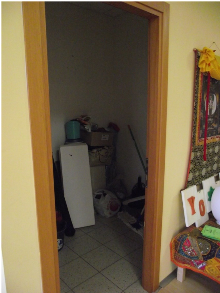
Foto 12 - ripostiglio