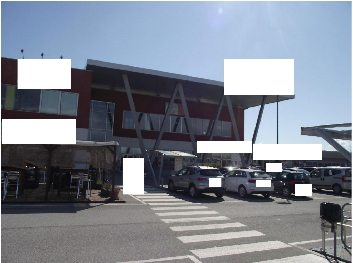
Foto 3 vista frontale stabile