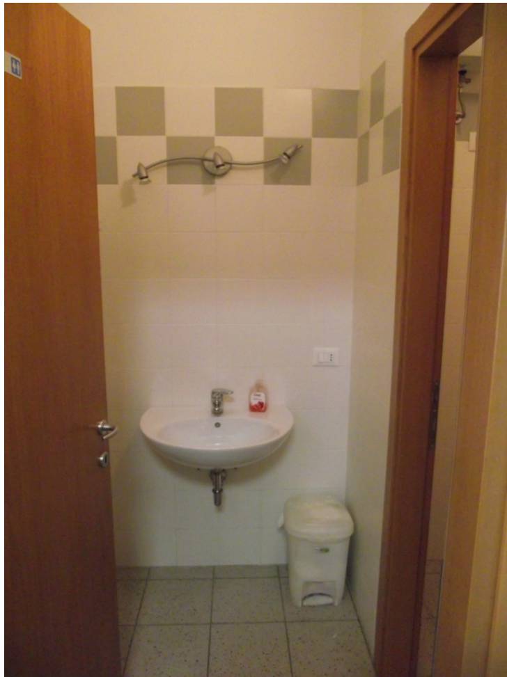
Foto 13 - antibagno