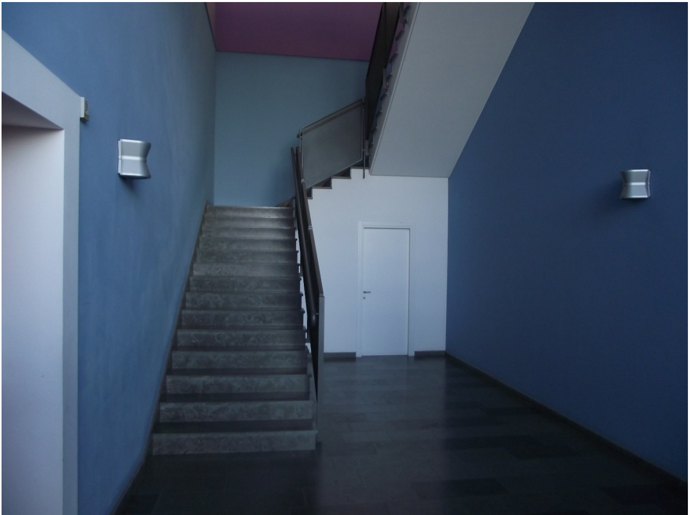
Foto 5 - Vano scale ingresso