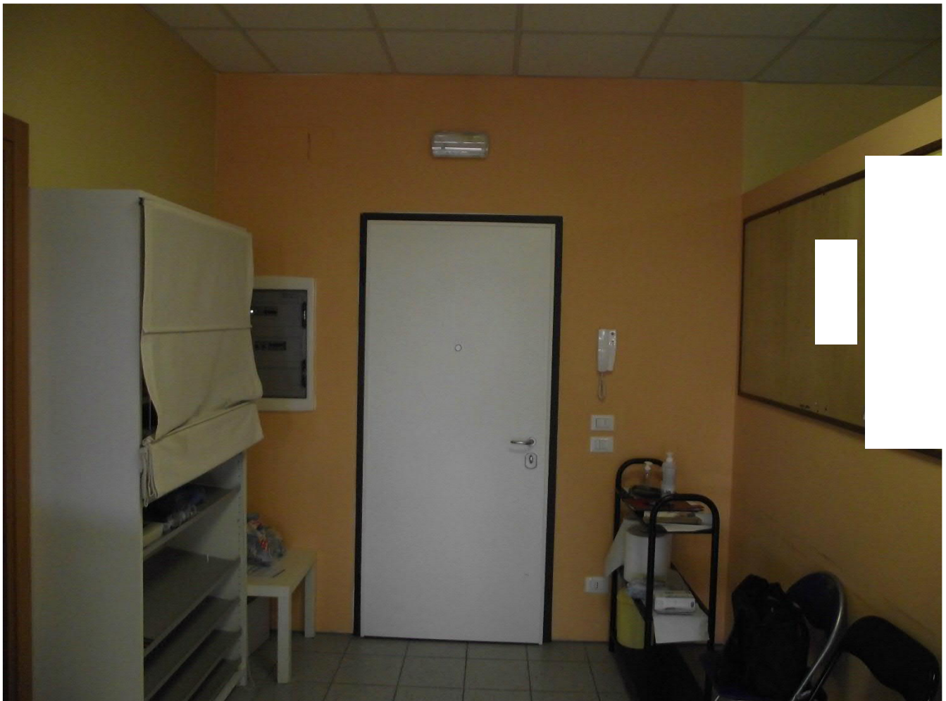
Foto 16 - ingresso