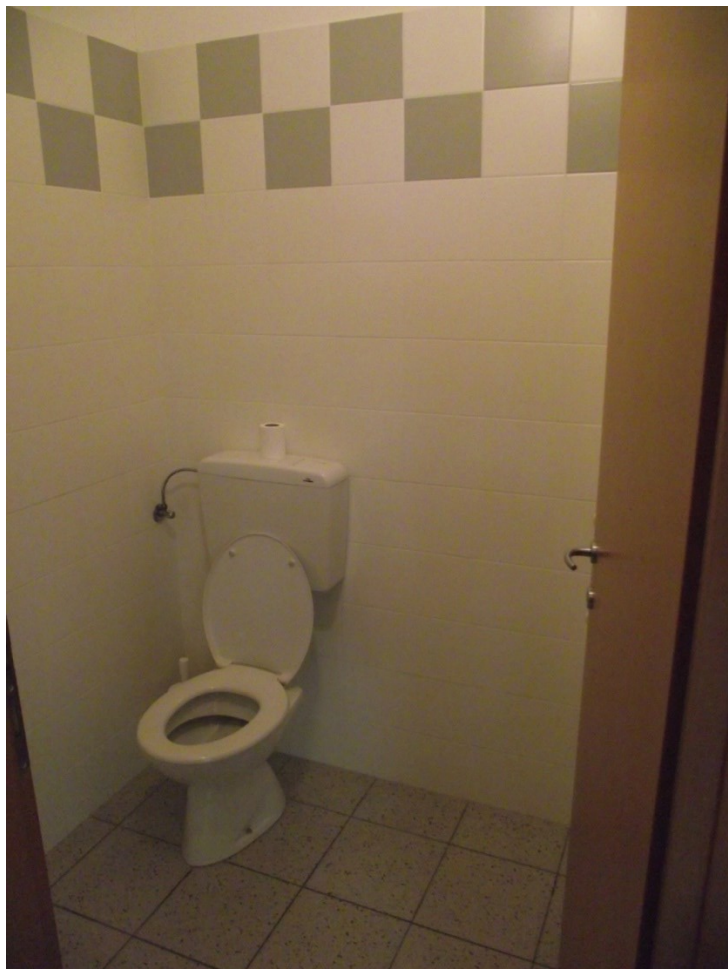
Foto 14 - bagno