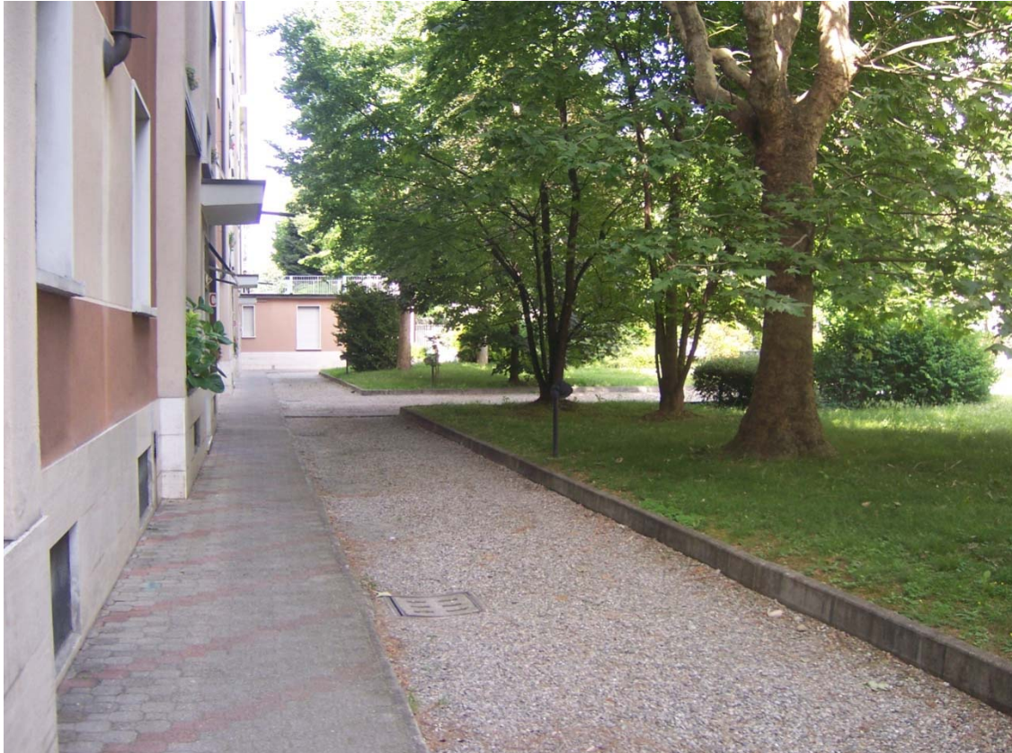
violetto di accesso ai corpi scale