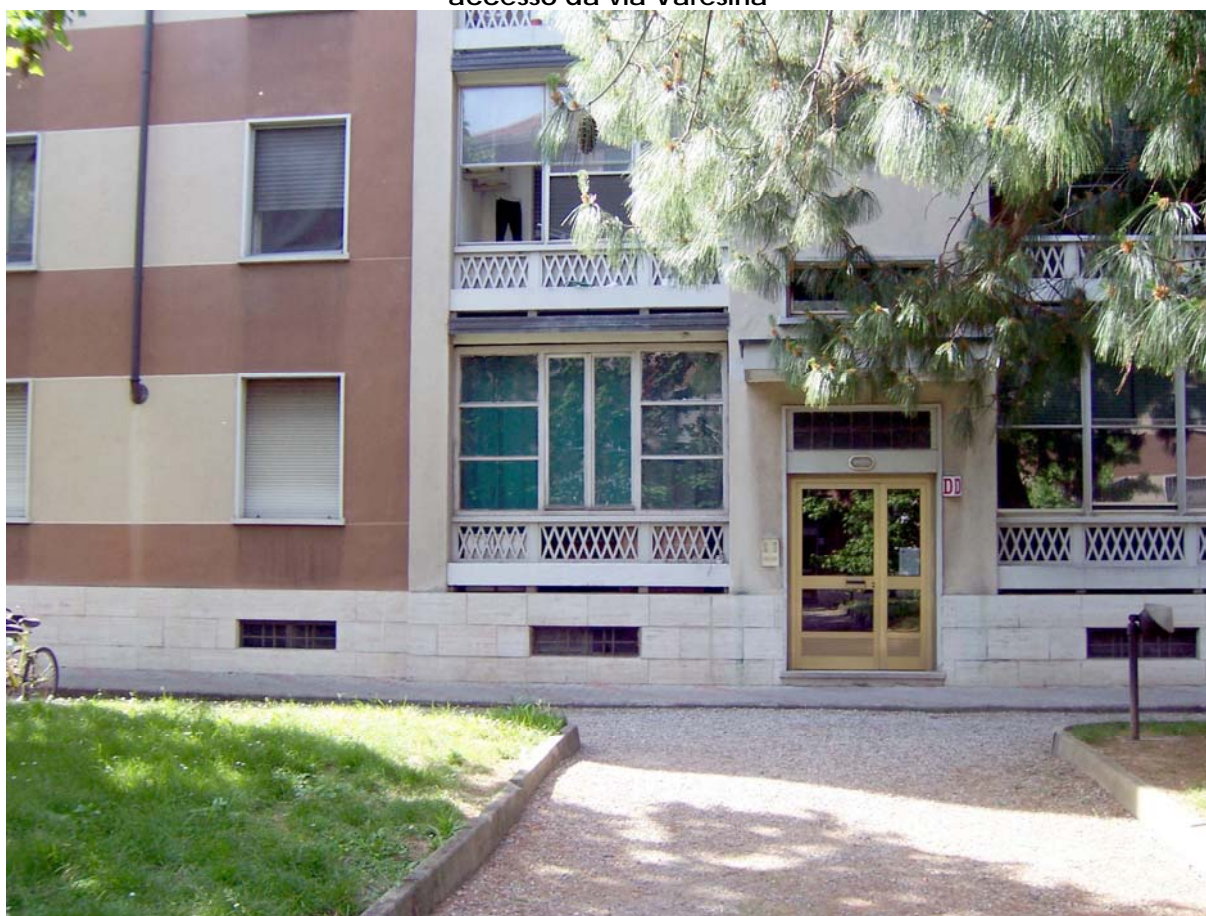
accesso scala D e veduta del balcone in loggia verandato