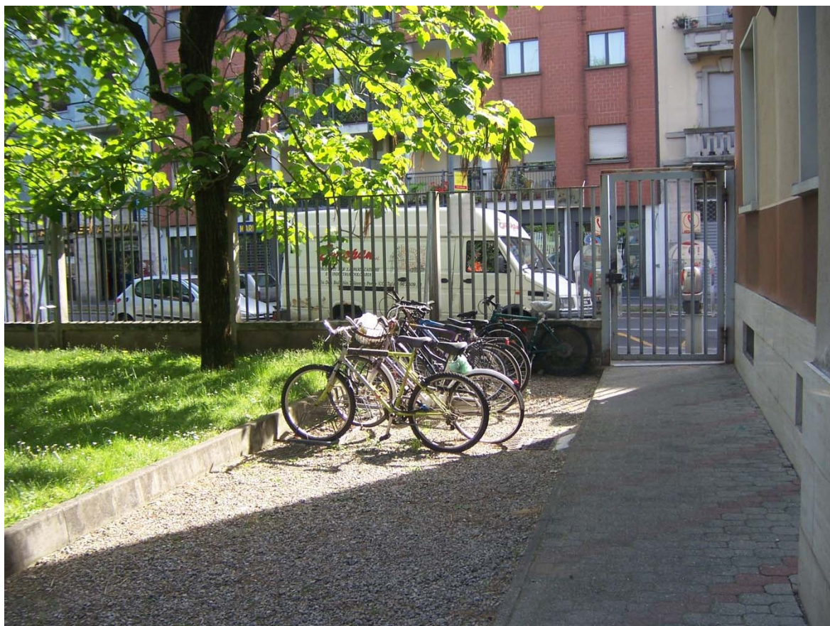
accesso da via Varesina