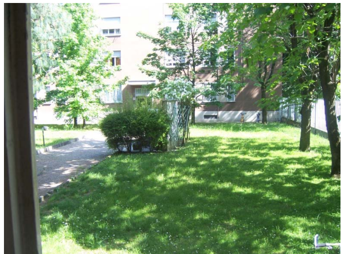
dettaglio pavimenti e veduta dalla finestra verso il cortile