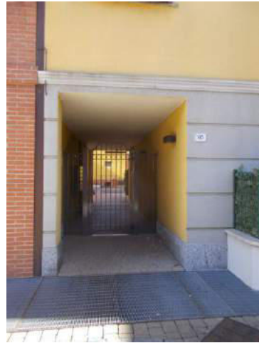
8. Ingresso pedonale