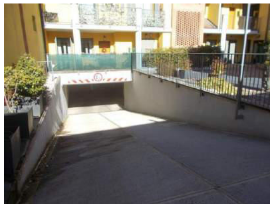
6. Rampa di accesso ai box