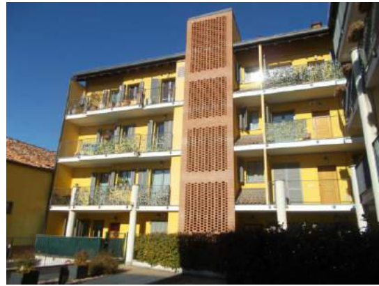
14. Facciata interna