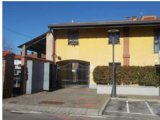
4. Ingresso carroia