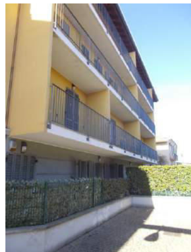
18. Facciata esterna lato est