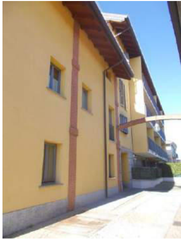
7. Vialetto di ingresso pedonale