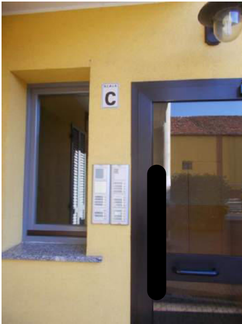
19. Ingresso al corpo scala