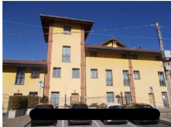
2. Facciata esterna dalla via Gramsci