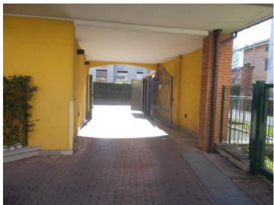
5. Ingresso carroia (dall'interno)