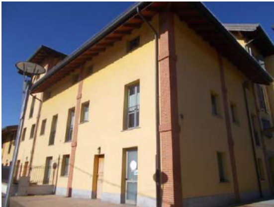
3. Facciata esterna