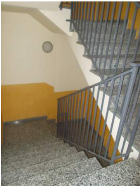
21. Corpo scala comune