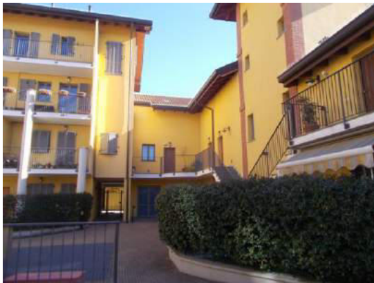
13. Cortile interno