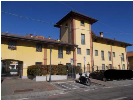
1. Facciata esterna dalla via Gramsci