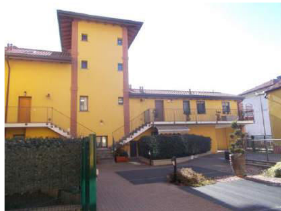
12. Cortile interno (Torretta)