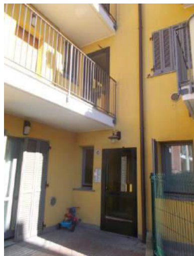
17. Dettaglio facciata interna