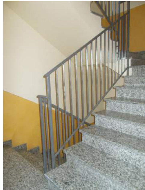
22. Corpo scala comune