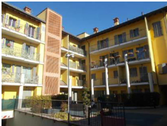
11. Cortile interno