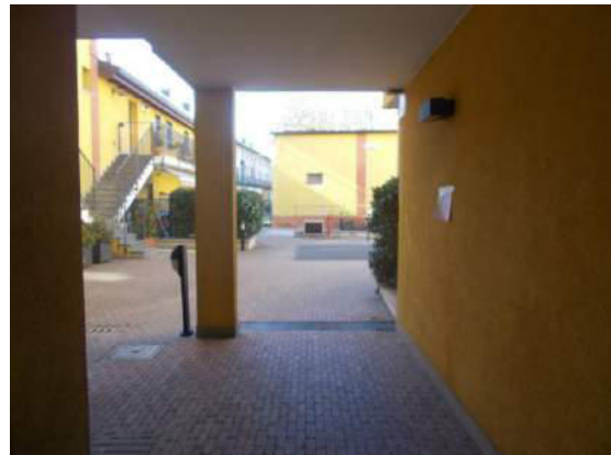
10. Ingresso pedonale (verso il cortile)