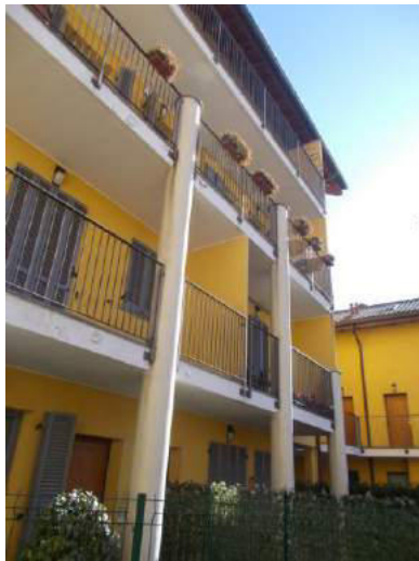
15. Dettaglio facciata interna