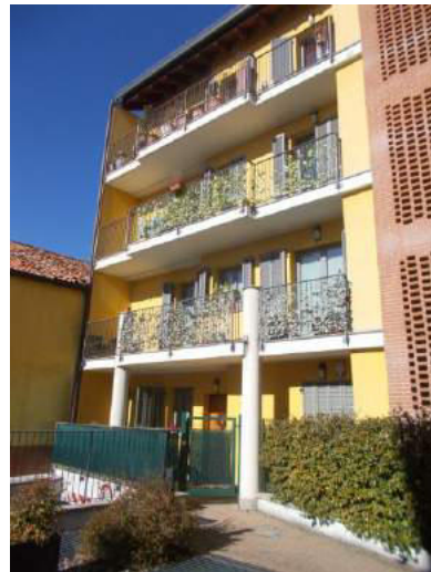
16. Dettaglio facciata interna