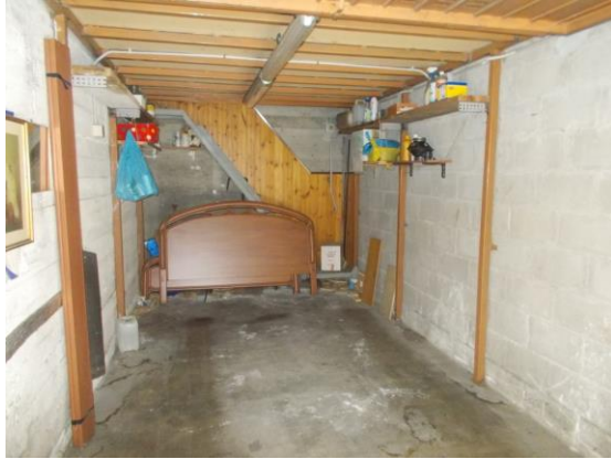
53. Interno del box