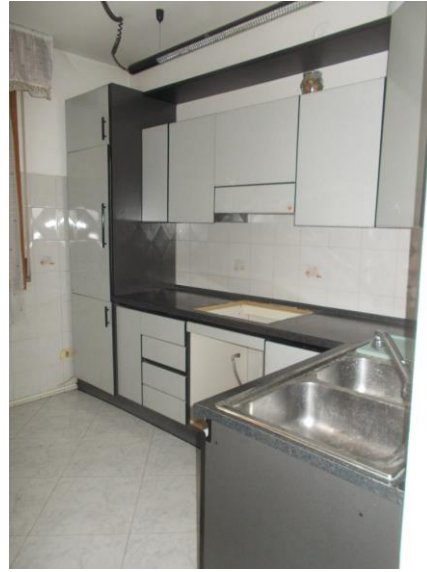
12. Angolo cucina