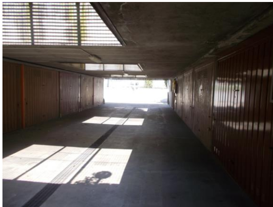
49. Corsello comune ai box