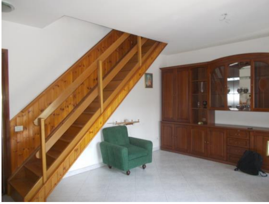
17. Locale principale cucina-soggiorno