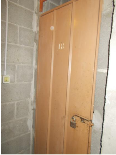
47. Cantina di pertinenza