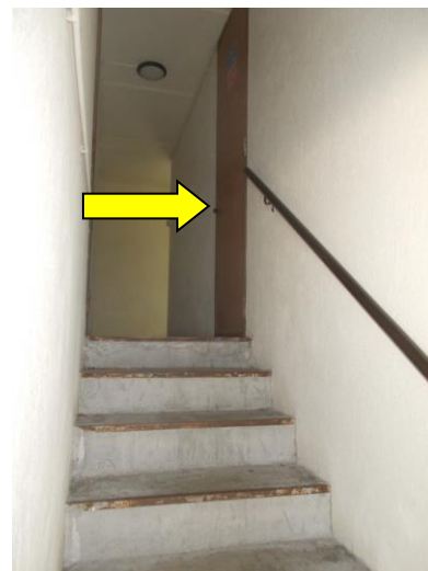
46. Porta di accesso alle cantine al PT