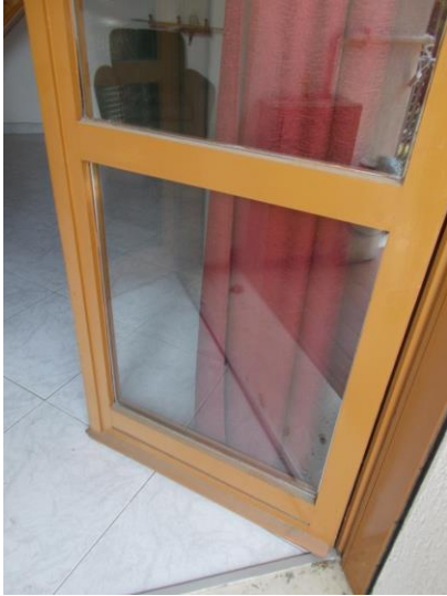
23. Serramento esterno