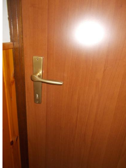
24. Porta interna