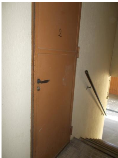
45. Porta di accesso alle cantine al PT