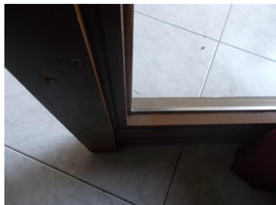
22. Serramento esterno