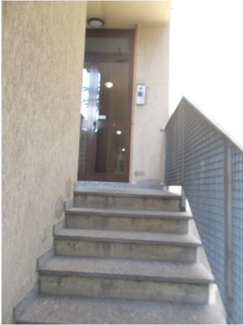
7. Scale comuni in arrivo al piano 2°