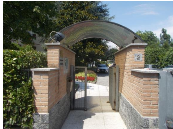
2. Ingresso pedonale al condominio