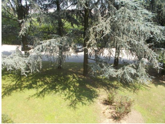
29. Veduta dal balcone