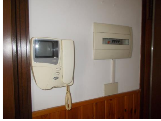
18. Dettagli videocitofono e quadro elettrico