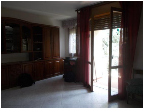
15. Locale principale cucina-soggiorno