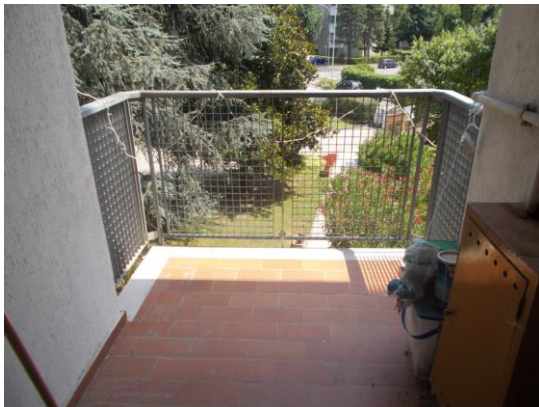
27. Veduta dal balcone