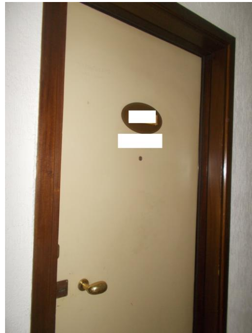
10. Ingresso all'immobile pignorato