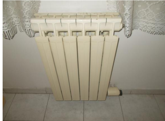
44. Dettaglio termosifone