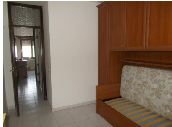
38. Camera 2