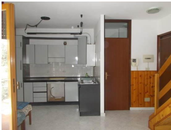
13. Locale principale cucina-soggiorno