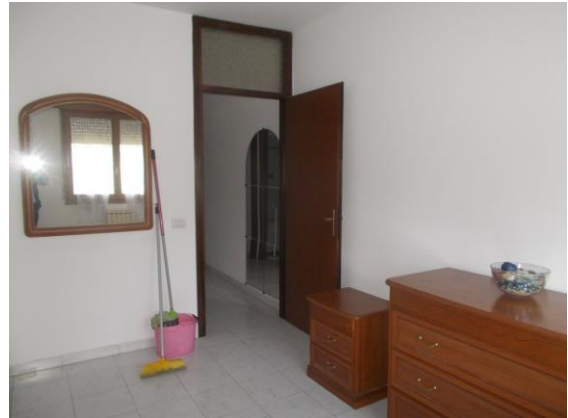
36. Camera 1