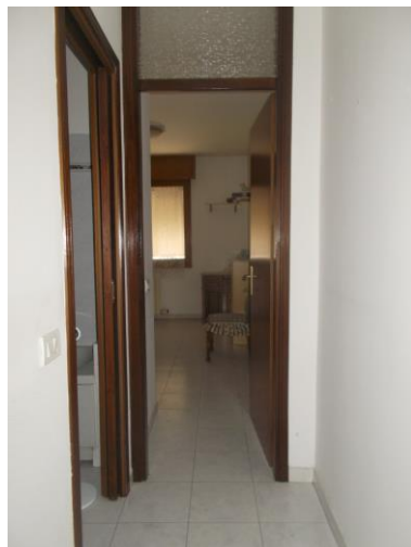
33. Disimpegno al piano 3°