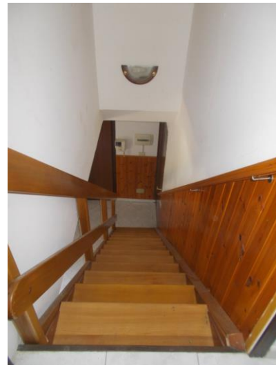
32. Scala dal piano 2° al 3° (dall'alto)