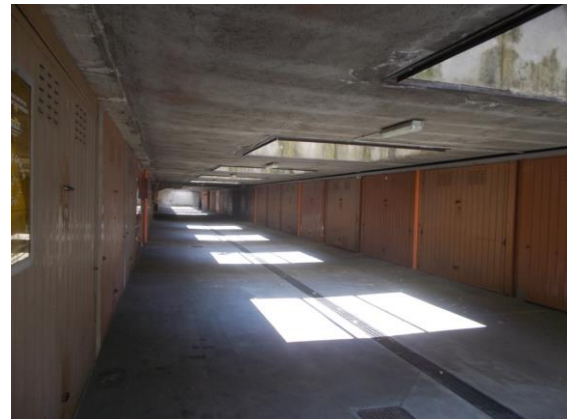
50. Corsello comune ai box