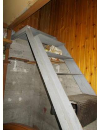
54. Scala di accesso al soppalco del box