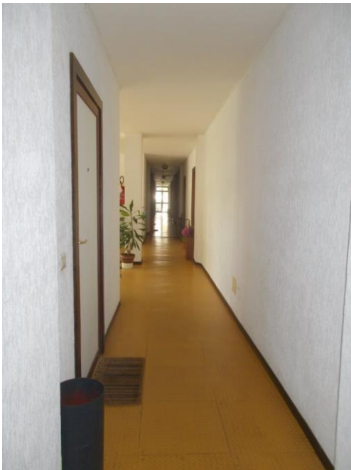
9. Corridoio comune al piano 2°