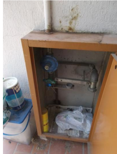
26. Attacco gas sul balcone