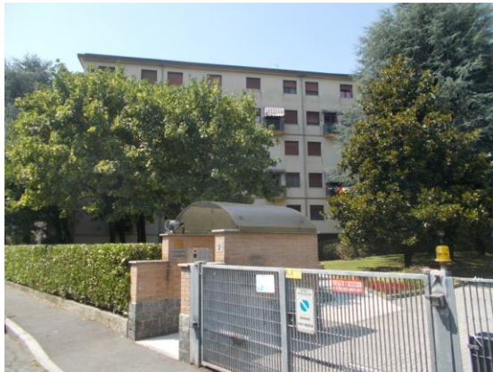
1. Facciata del condominio dalla strada