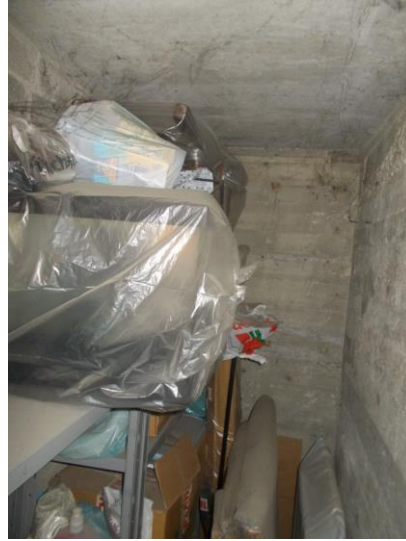
48. Interno della cantina