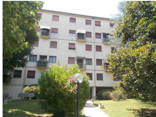
4. Facciata principale