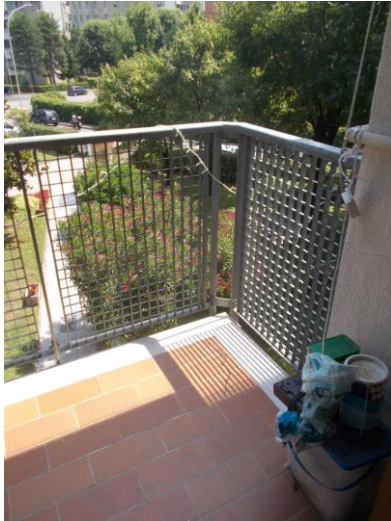
25. Balcone del locale cucina-soggiorno