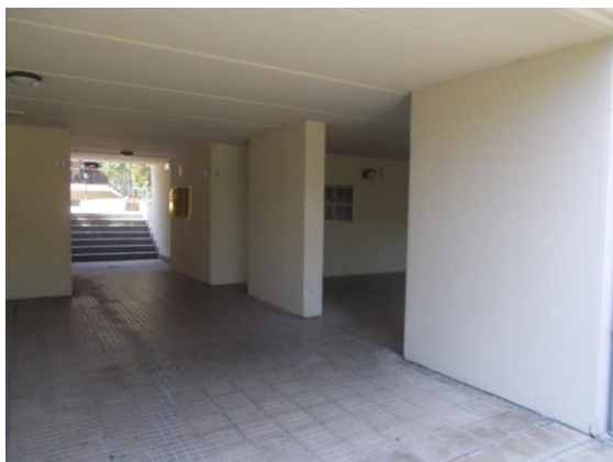
5. Piano terra