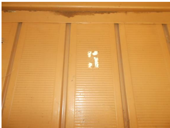
51. Box di pertinenza