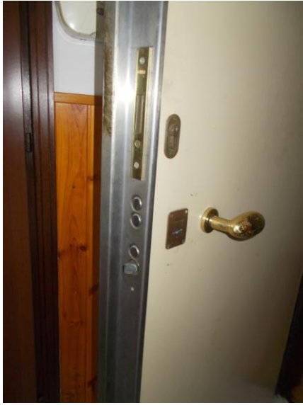
11. Portoncino di ingresso