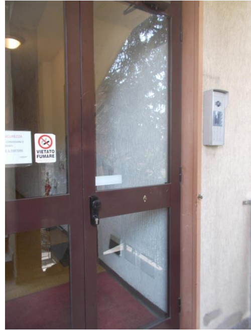
8. Portone di ingresso al piano 2°