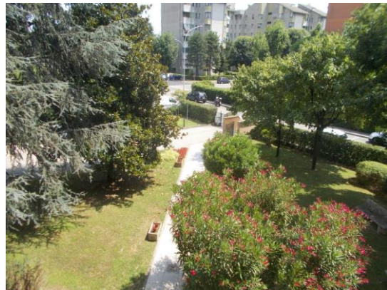
28. Veduta dal balcone