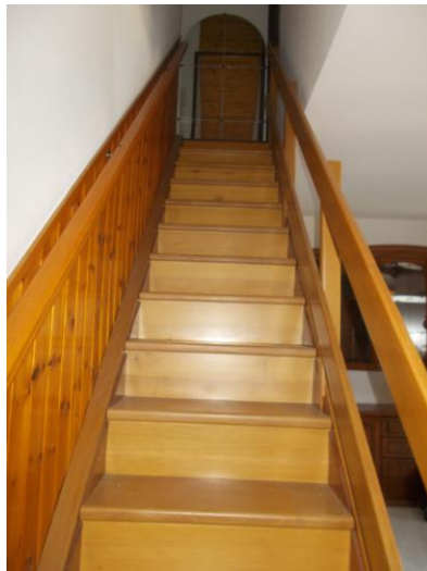
31. Scala dal piano 2° al 3° (dal basso)