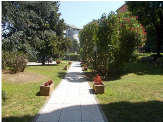
3. Vialetto di ingresso