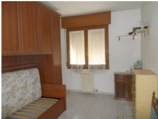
37. Camera 2