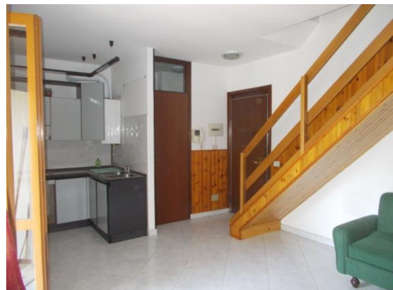
14. Locale principale cucina-soggiorno