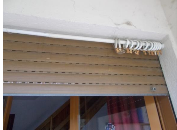
30. Dettaglio avvolgibile