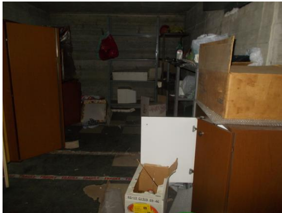
55. Soppalco all'interno del box