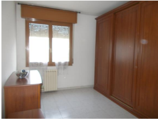
35. Camera 1