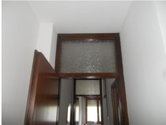
43. Dettaglio sopra luce