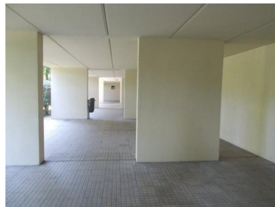
6. Piano terra