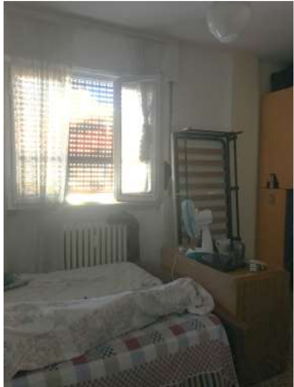
Immagini 26 e 27. La camera da letto.