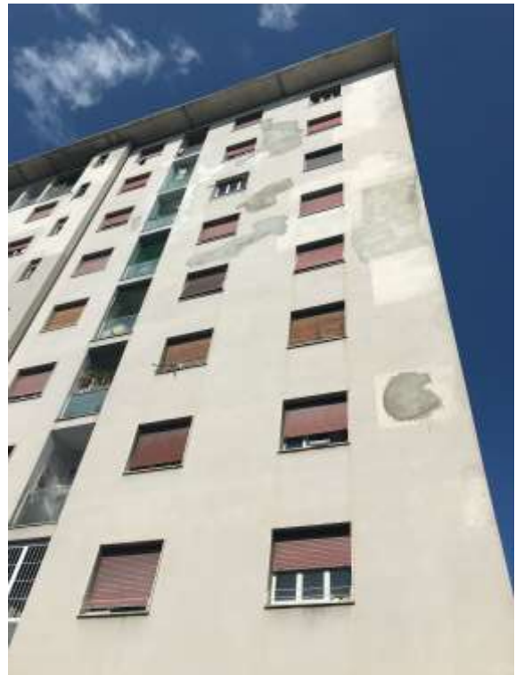
Immagini 3. 4. Il fabbricato in cui si colloca l'unità in oggetto della relazione inquadrato dall'esterno.