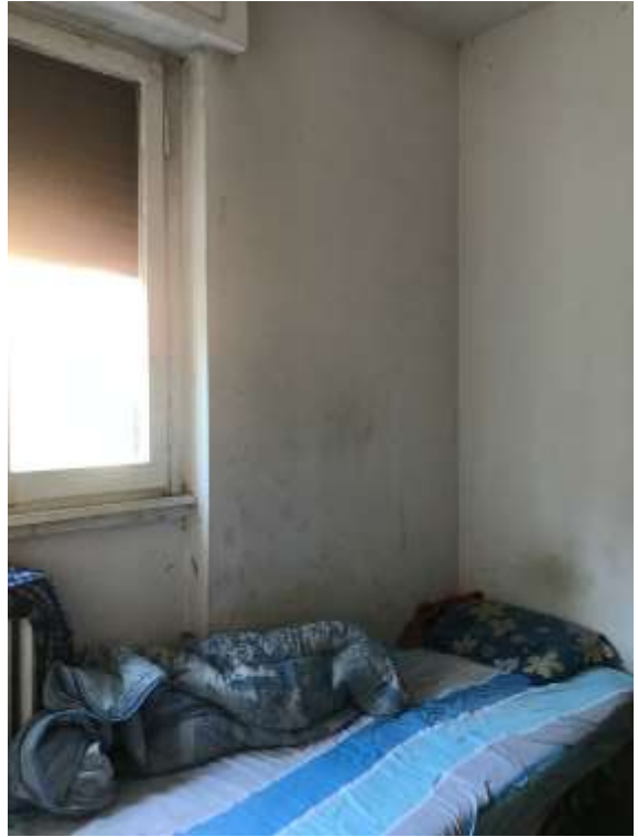
Immagine 17 e 18. Il soggiorno.