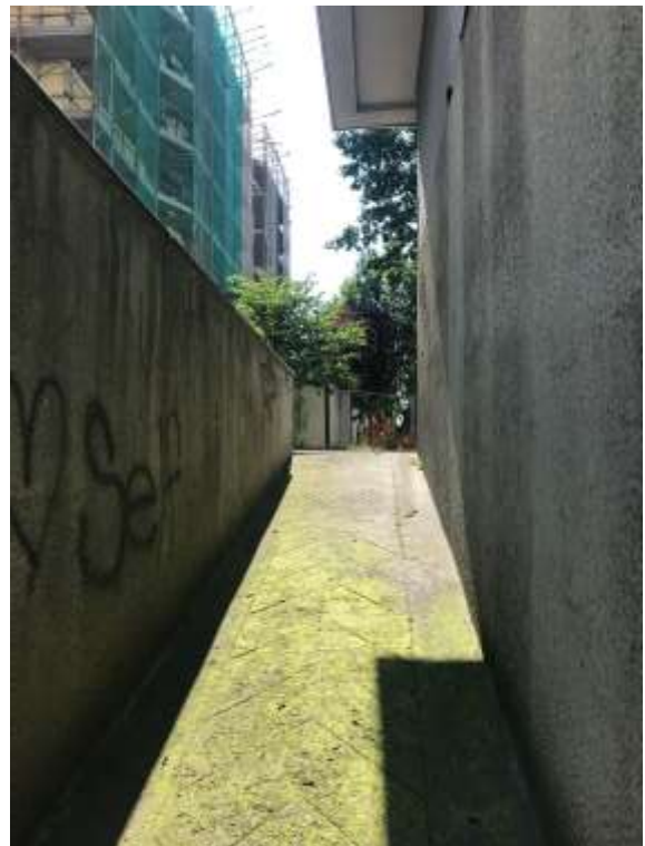
Immagini 32 E 33. Il piano interrato e la rampa che consente il collegamento con il cortile interno del fabbricato.