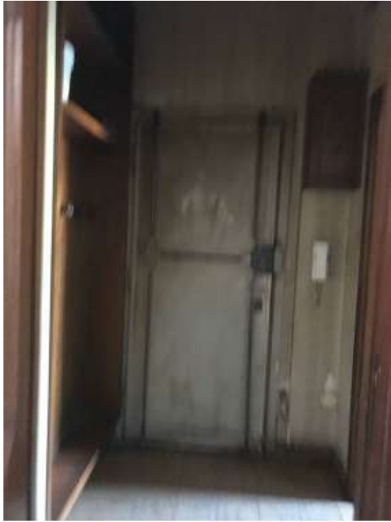
Immagine 9. Il portoncino di ingresso all'appartamento inquadrato dall'interno.