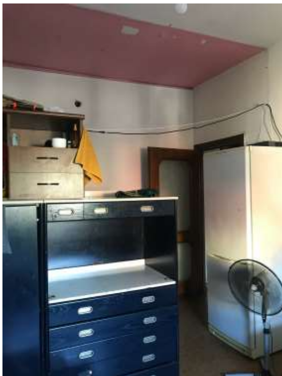
Immagine 25. Il soggiorno verso l'ingresso.