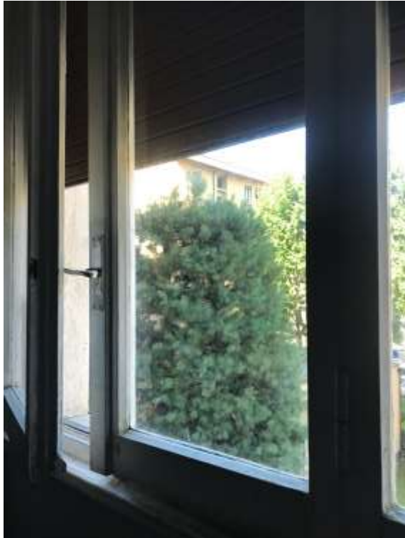
Immagine 24. Dettaglio del serramento in legno.