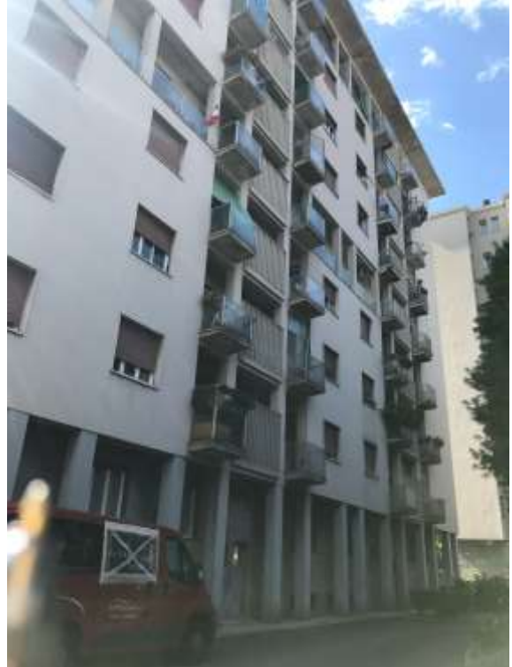
Immagini 1. 2. Il fabbricato in cui si colloca l'unità in oggetto della relazione, inquadrato dall'esterno.