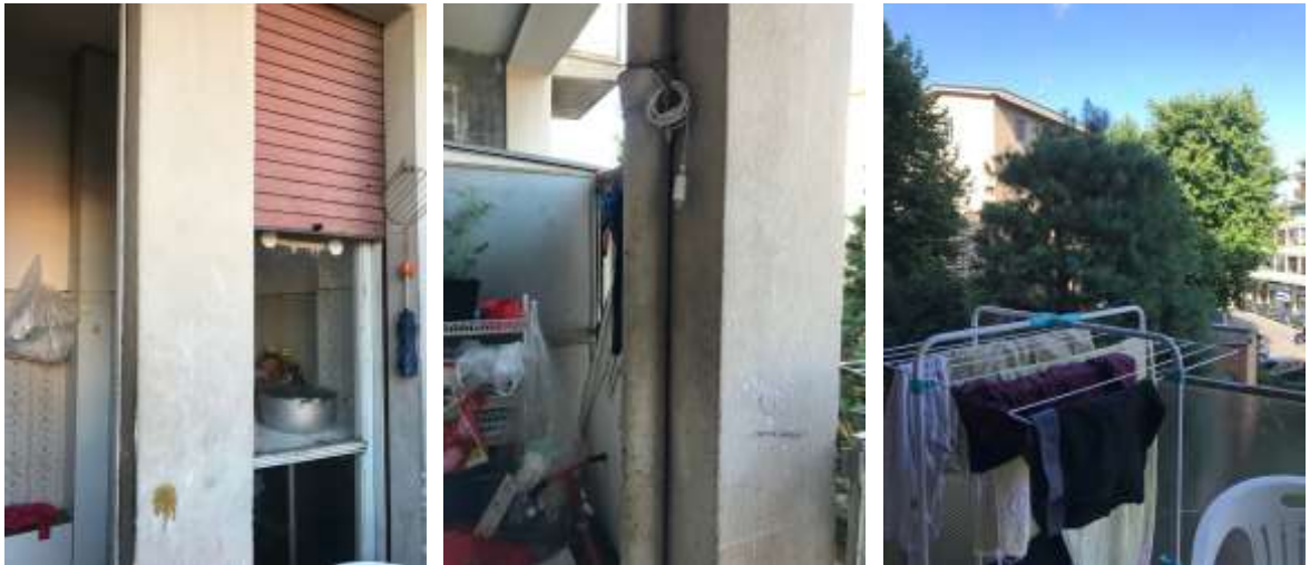
Immagini 12, 13 e 14. Il balcone accessibile dalla cucina.