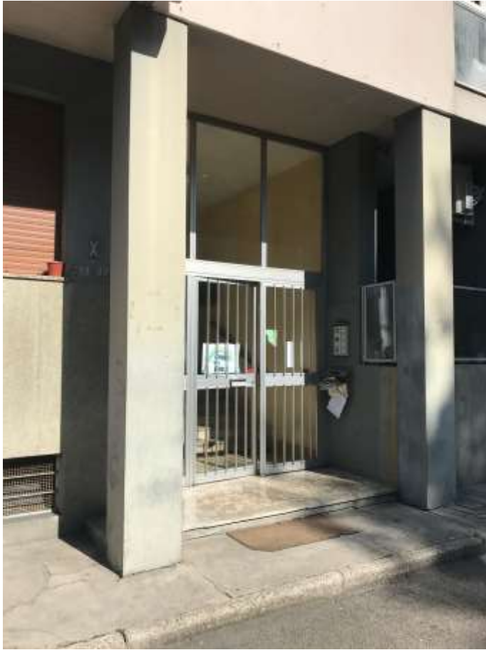
Immagine 5. Il portoncino di ingresso al fabbricato inquadrato dall'esterno.