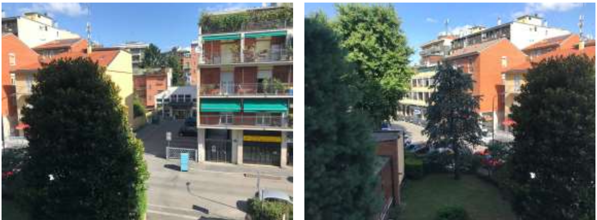
Immagini 15 e 16. Vista dal balcone con accesso dalla cucina.