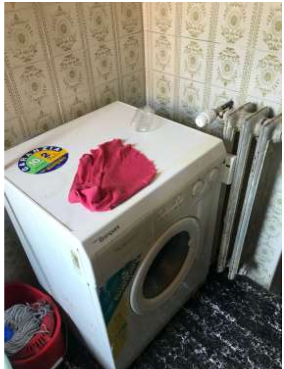
Immagini 22. 23. Dettagli dello scaldacqua e della lavatrice collocati all'interno del bagno.