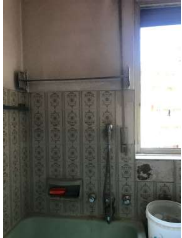
Immagini 20. 21. Il bagno.