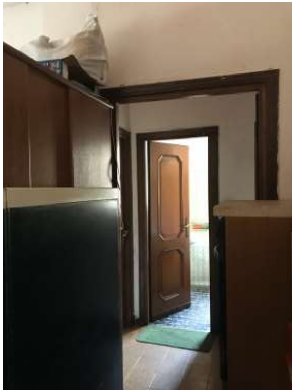
Immagine 19. Il disimpegno.