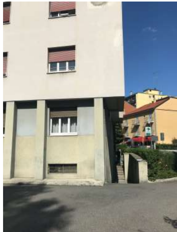
Immagini 28 e 29. Il cortile del fabbricato e la scala che consente l'accesso dal cortile al piano interrato (cantine).