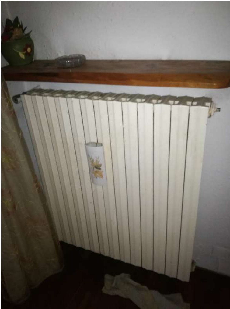
FOTO 15,16 - RADIATORI E SOPPALCO