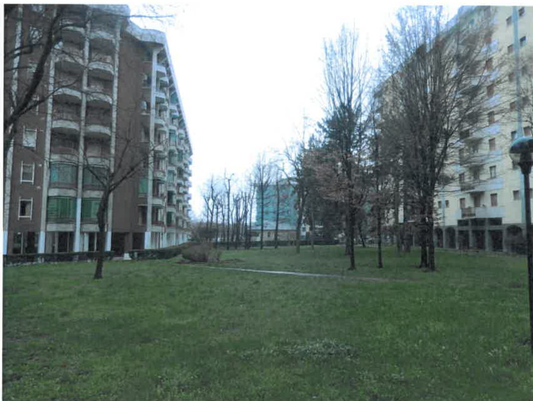
Foto 6 – Vista parziale del giardino condominiale verso la portineria.