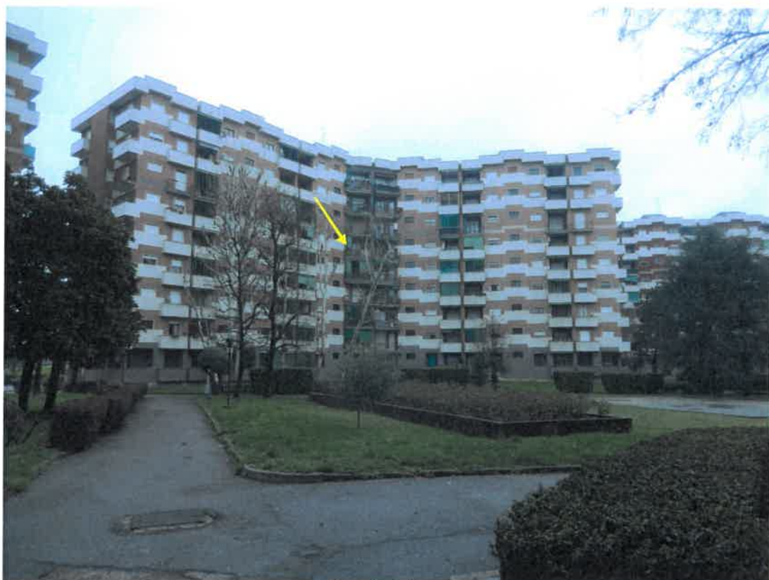
Foto 5 – Vista del prospetto ovest dell'edificio "E". Indicata dalla freccia l'unità in esame.