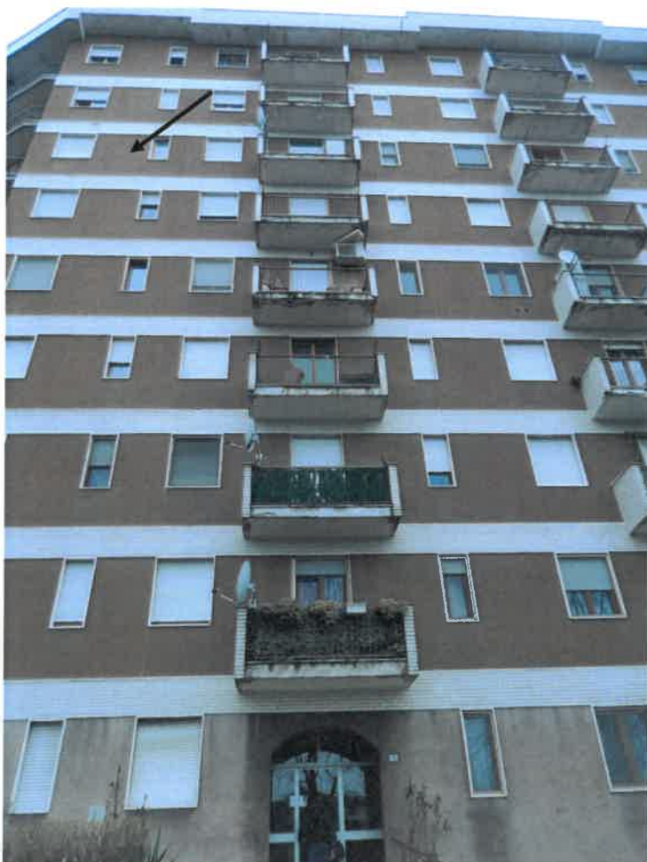
Foto 4 – Vista parziale del prospetto est. Indicato dalla freccia l'appartamento in esame.