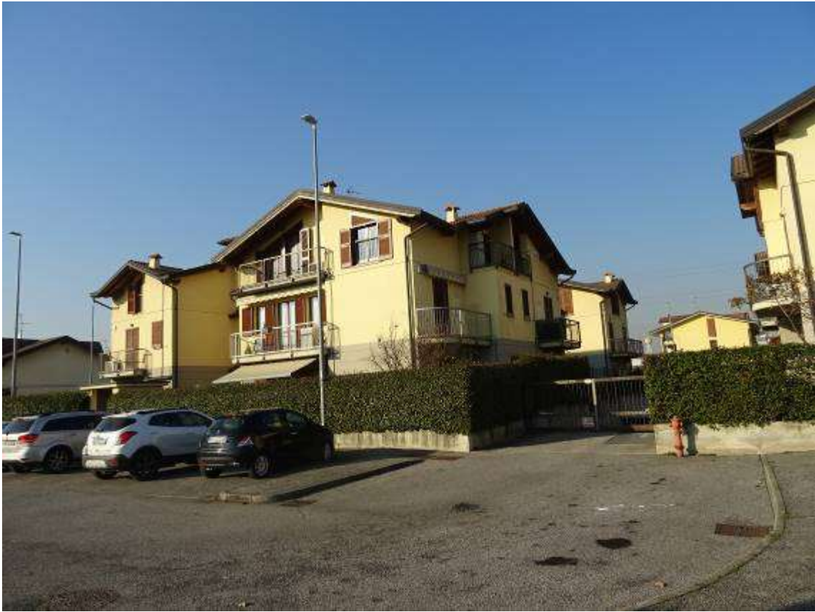
Basiano Via Galileo Galilei n°16 e n°14 – individuazione dell'unità residenziale