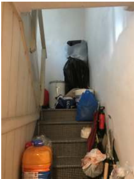
Fig.15: vano scala da piano 1 a piano 2