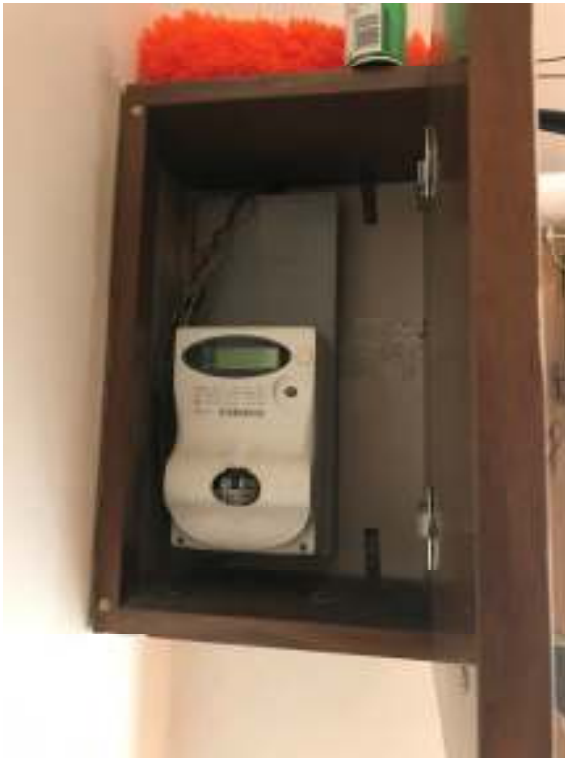
Fig.21: contatore enel