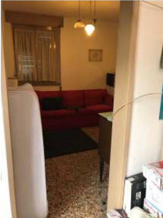
Fig.5: vista pranzo - soggiorno da ingresso