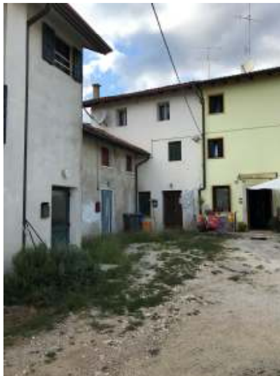
Fig.2: vista da sud - est