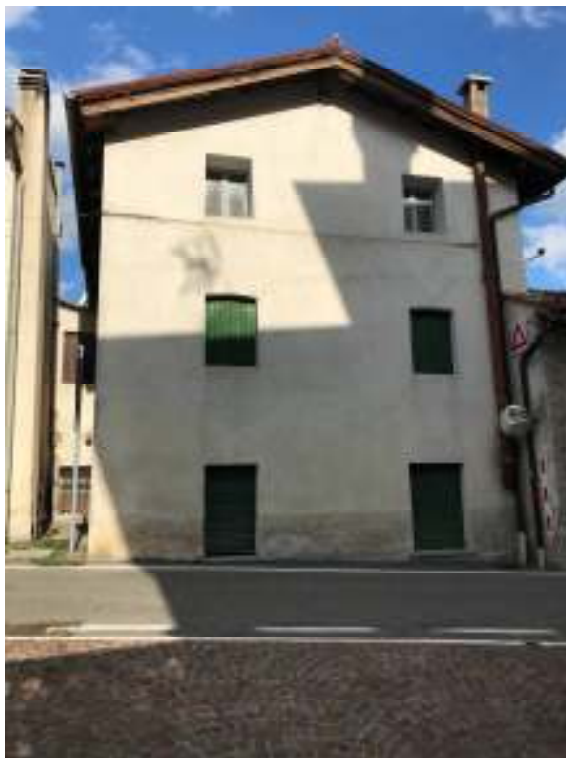
Fig.1: vista fronte strada da sud - ovest