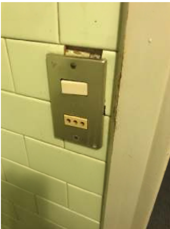
Fig.23: altri frutti impianto elettrico