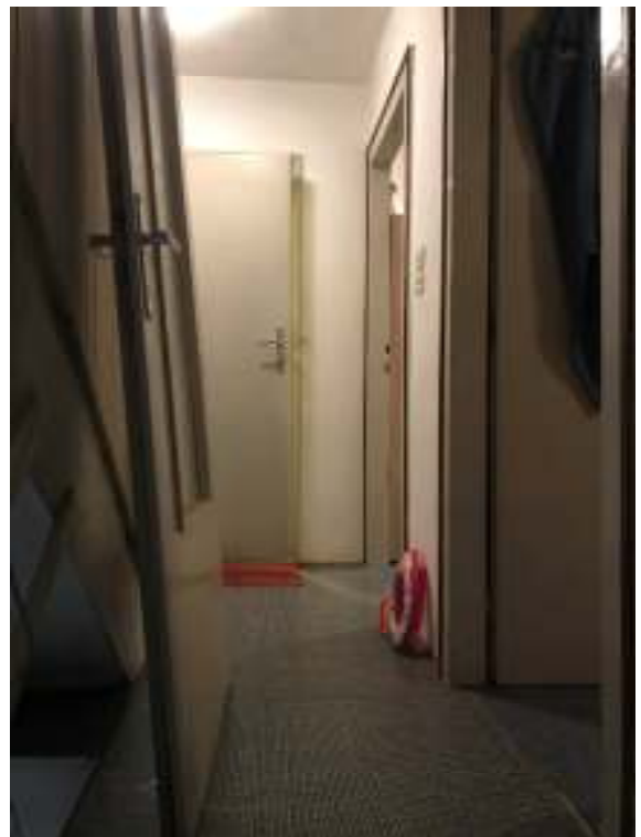
Fig.10: disimpegno piano 1