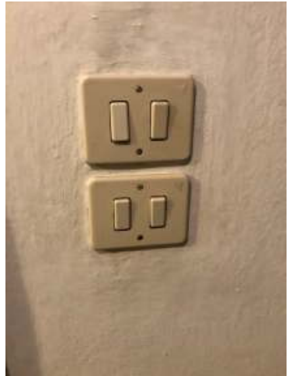
Fig.22: frutti impianto elettrico