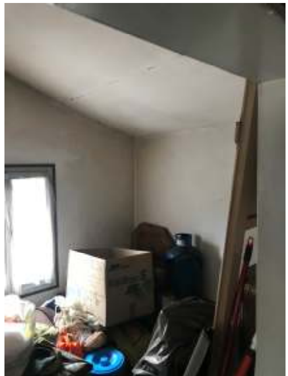
Fig.18: altra vista ripostiglio – soffitta 1