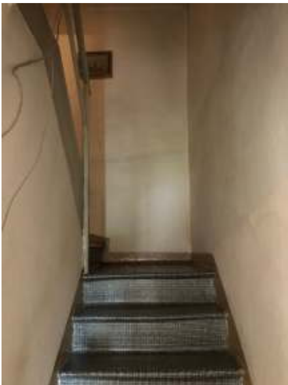
Fig.9: vano scala da piano terra a piano 1