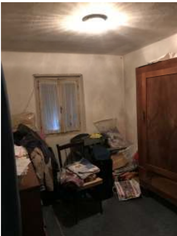
Fig.11: camera 1