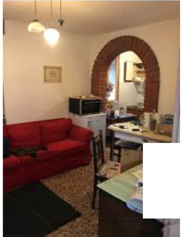
Fig.6: pranzo - soggiorno