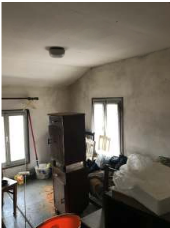
Fig.19: ripostiglio – soffitta 2