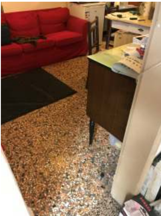
Fig.25: pavimento piano terra