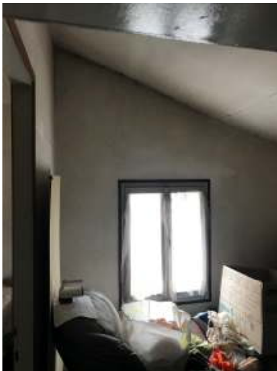
Fig.17: ripostiglio – soffitta 1