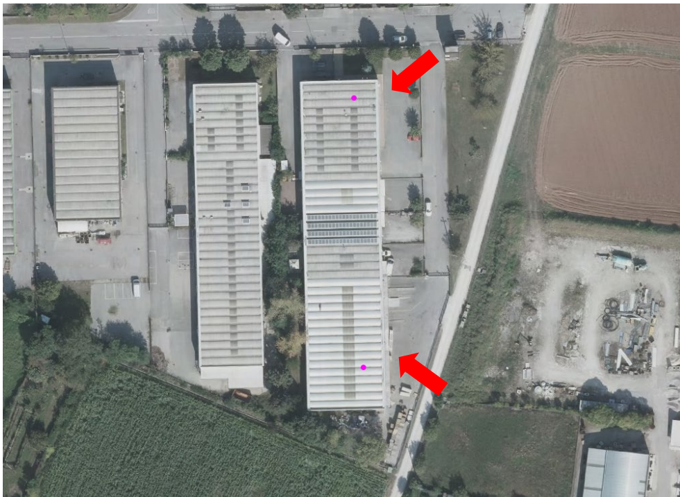
2. Ortofoto: localizzazione dell'edificio – Aerofoto particolare