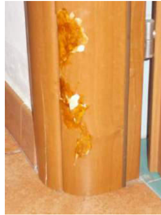
60. Dettaglio stipite della porta