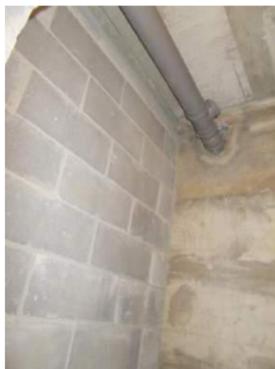
70. Interno della cantina