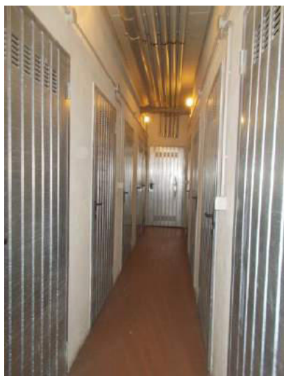
67. Corridoio comune alle cantine