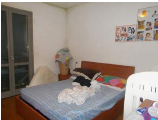
55. Camera matrimoniale