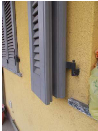
62. Dettaglio della persiana da oscuro