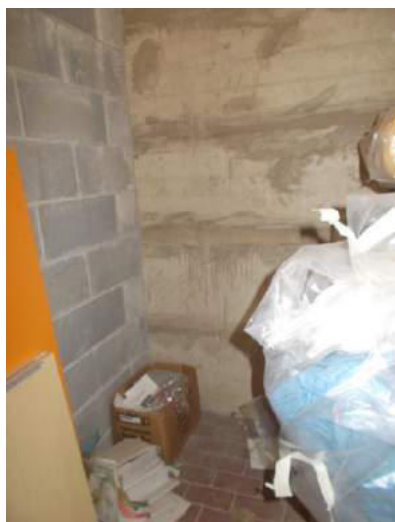
69. Interno della cantina