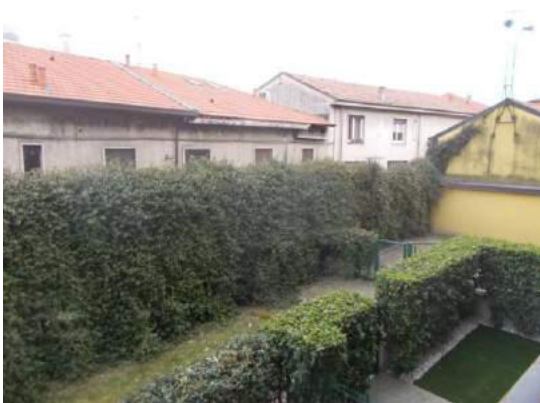
63. Vista dal balcone