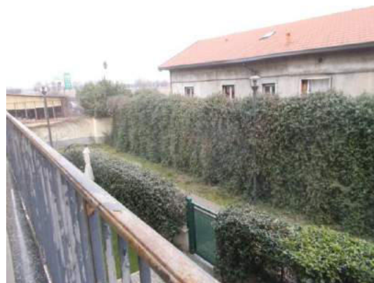
64. Vista dal balcone