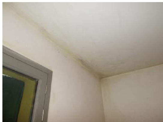
58. Ponte termico nella camera