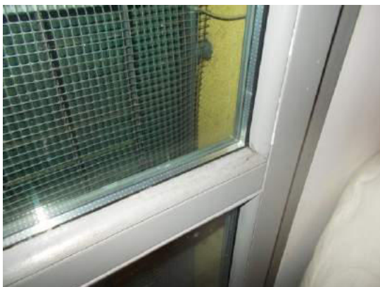
57. Dettaglio serramento della camera