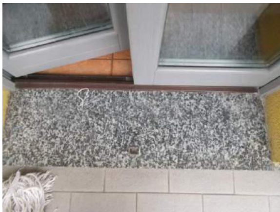
65. Dettaglio soglia del balcone