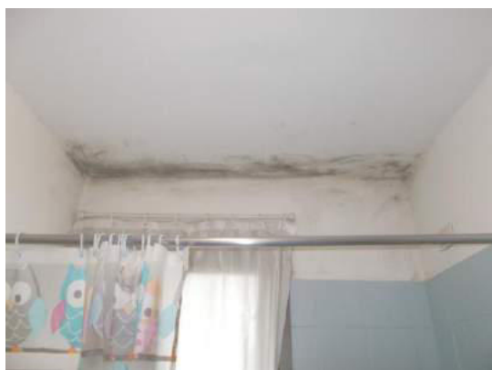
52. Ponte termico nel bagno