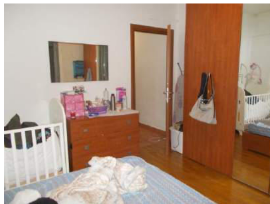
56. Camera matrimoniale