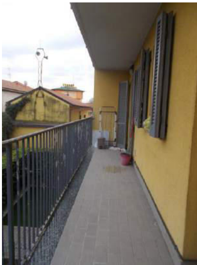
61. Balcone in lato est