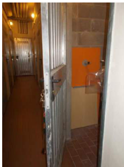
68. Cantina di pertinenza