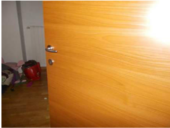
59. Dettaglio porta interna