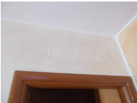
97. Predisposizione per condizionamento