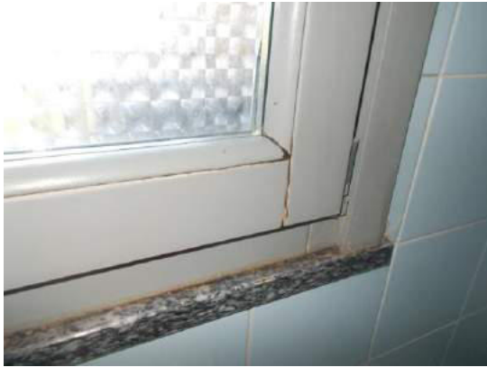
89. Dettaglio serramento del bagno