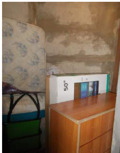
102. Interno della cantina