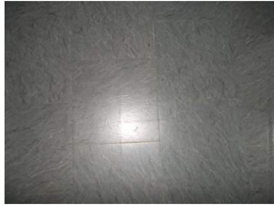
90. Pavimento del bagno