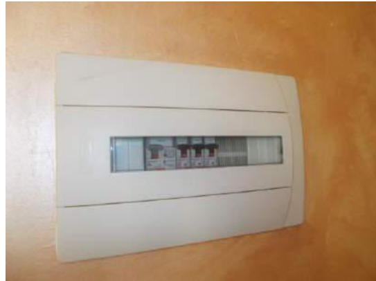
96. Particolare quadro elettrico