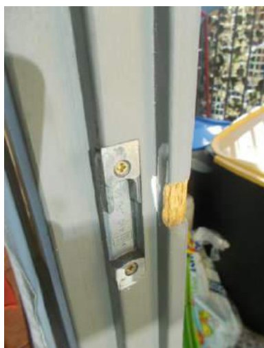
80. Dettaglio serramento esterno