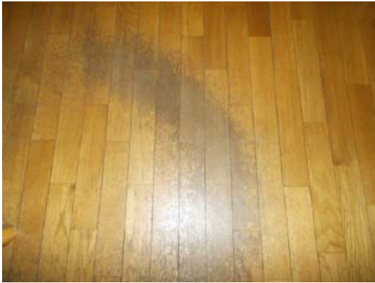
95. Dettaglio pavimento della camera