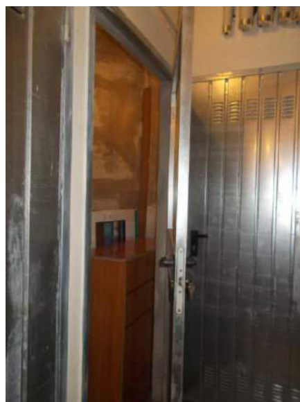
100. Cantina di pertinenza