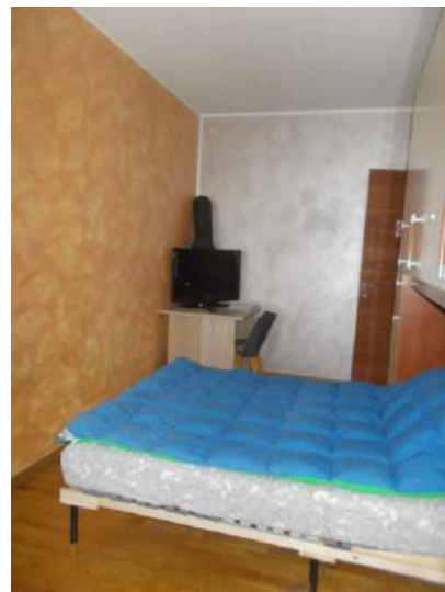
92. Altra camera