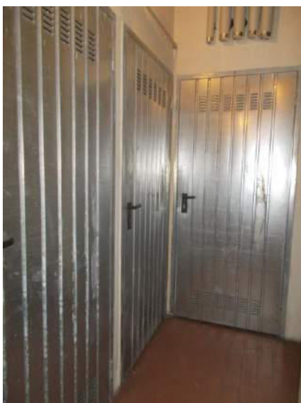
99. Corridoio cantine