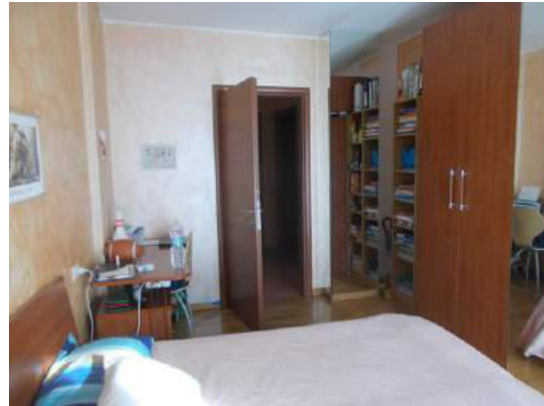
84. Camera matrimoniale