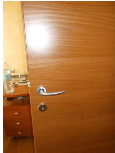
86. Porta della camera