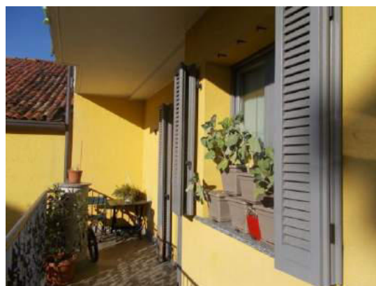
76. Balcone verso il cortile interno (sud)