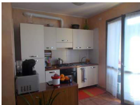
73. Zona cucina