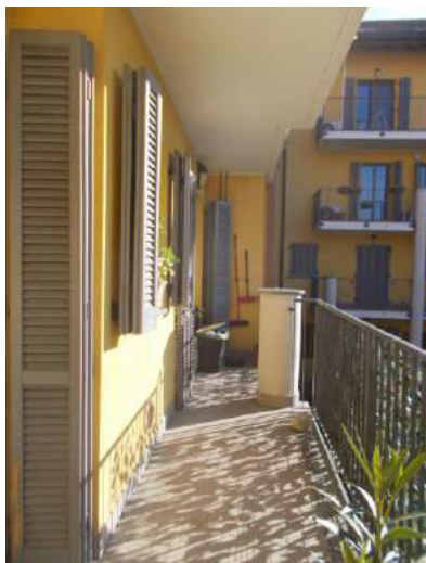
78. Balcone verso il cortile interno