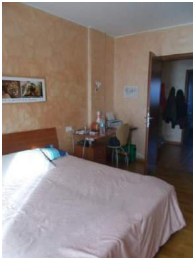
85. Camera matrimoniale