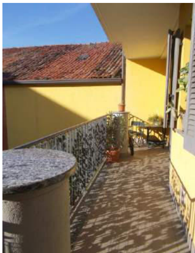
77. Balcone verso il cortile interno