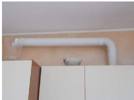
98. Emissione fumi caldaia (in cucina)