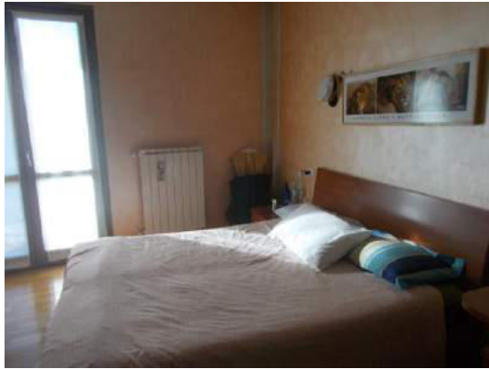
83. Camera matrimoniale