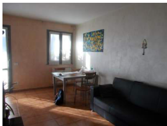
74. Zona pranzo nel soggiorno