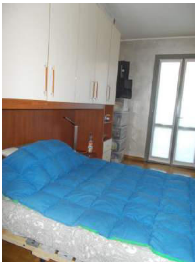
91. Altra camera