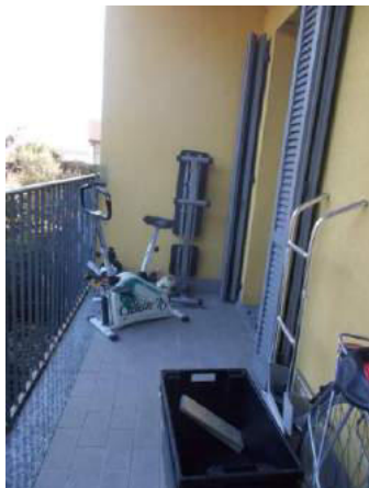
93. Balcone in lato est