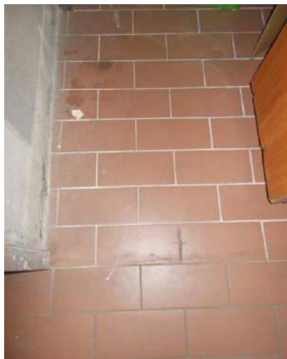
101. Pavimento della cantina