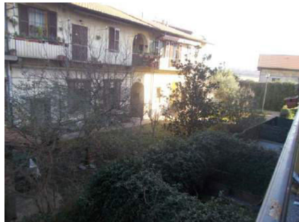
94. Vista dal balcone