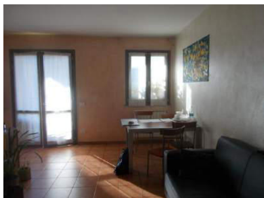
75. Zona pranzo nel soggiorno