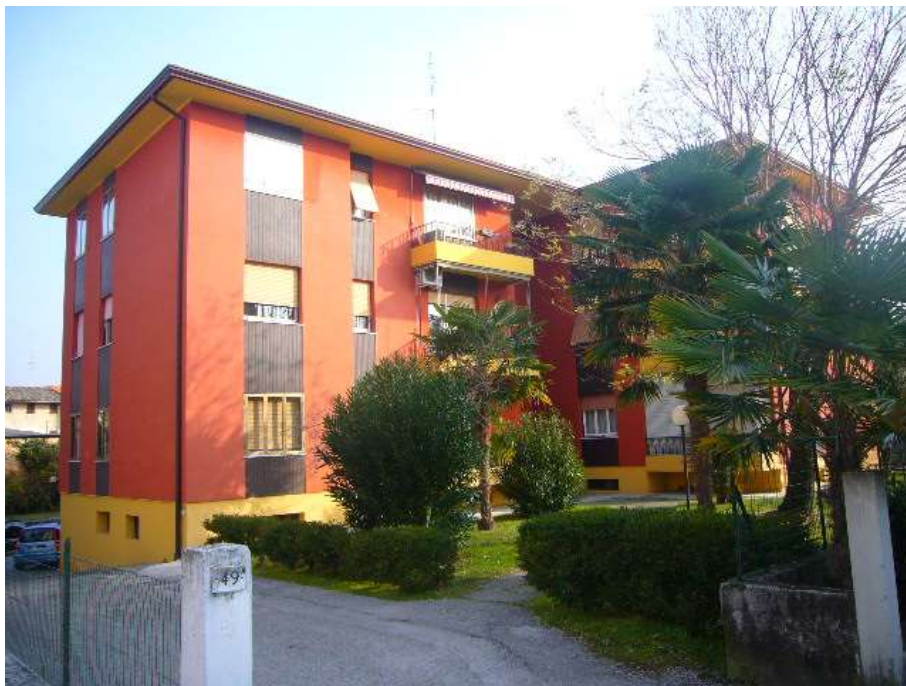
PROSPETTO LATO SUD-OVEST