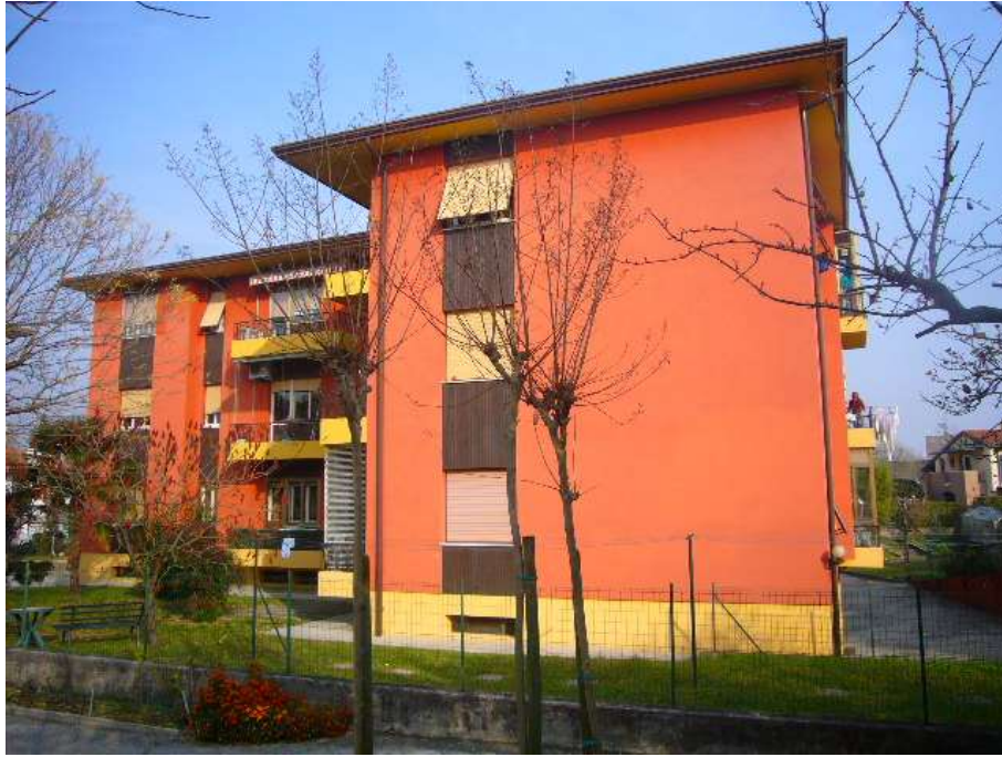
PROSPETTO LATO SUD