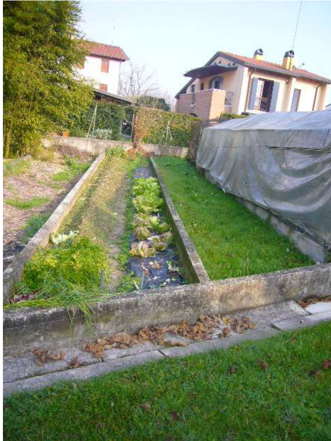
PORZIONE ADIBITA A ORTO