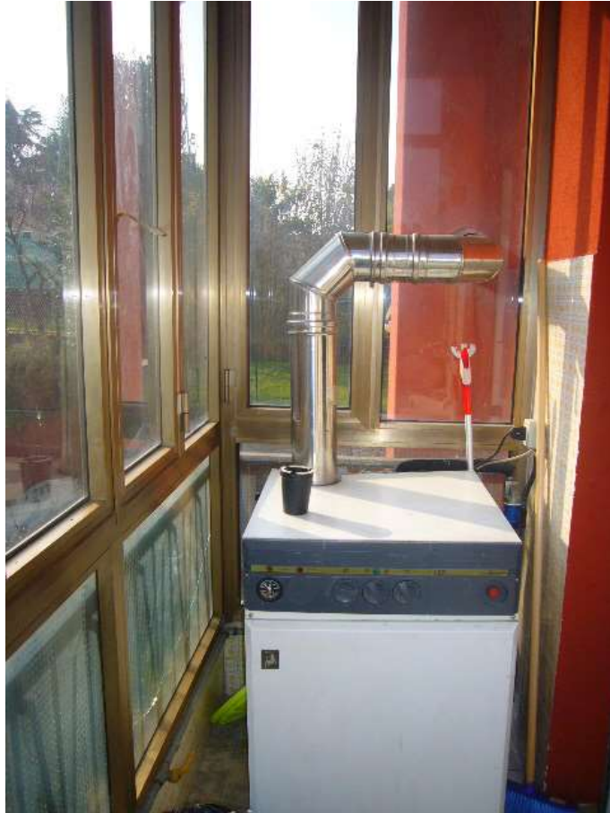
VERANDA CO C.T.