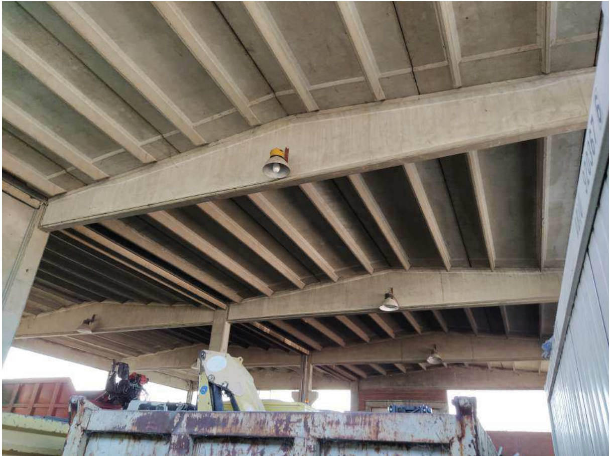
CORPO C FOTO 15,16,17,18 – lavorazione vetro