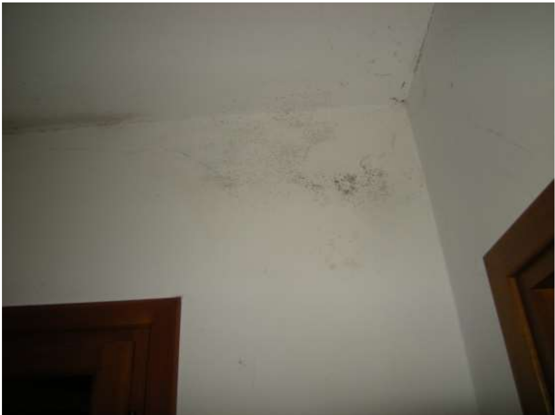
Budoia, via Cardazzo n°. 15, Piano primo - Danni alla tinteggiatura.