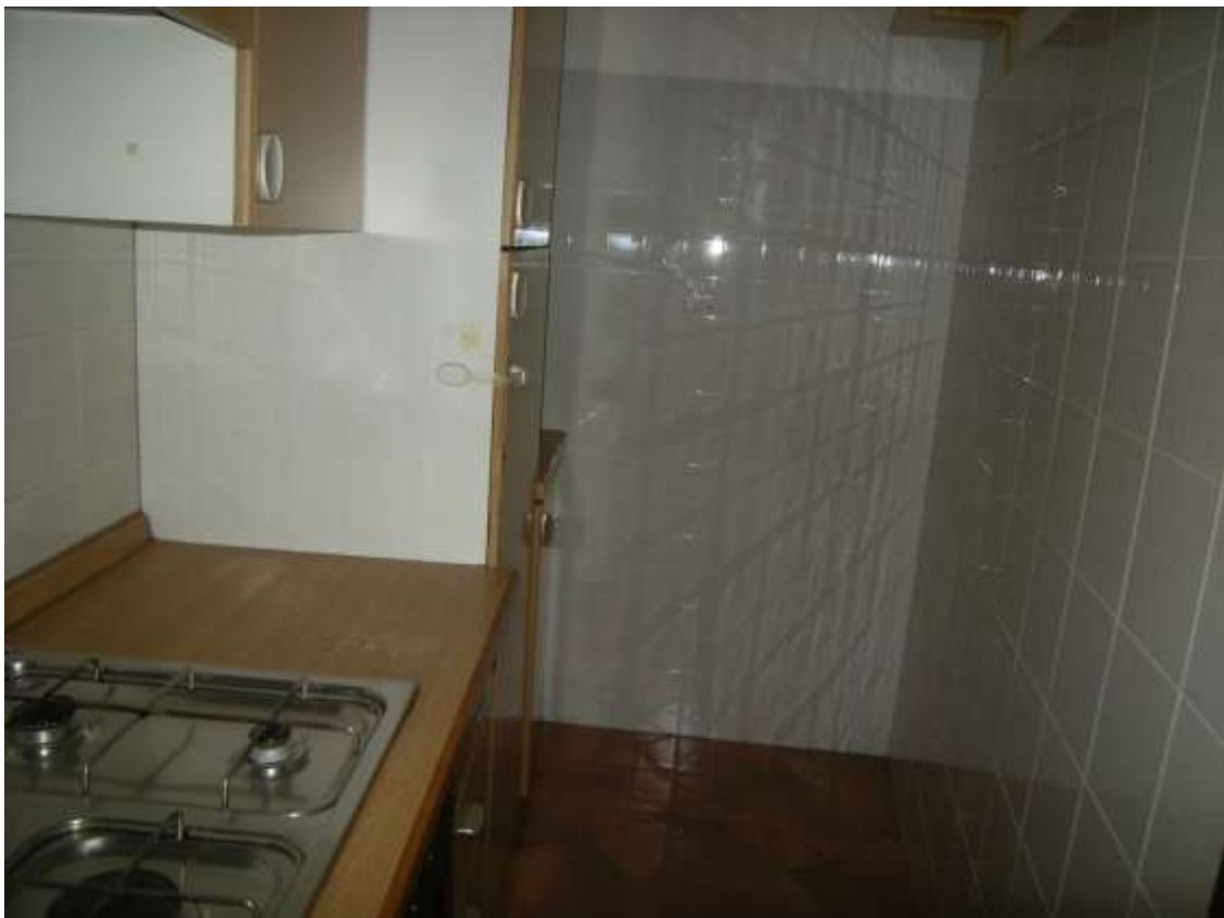
Budoia, via Cardazzo n°. 15, piano I – Il ripostiglio adibito a cucina.