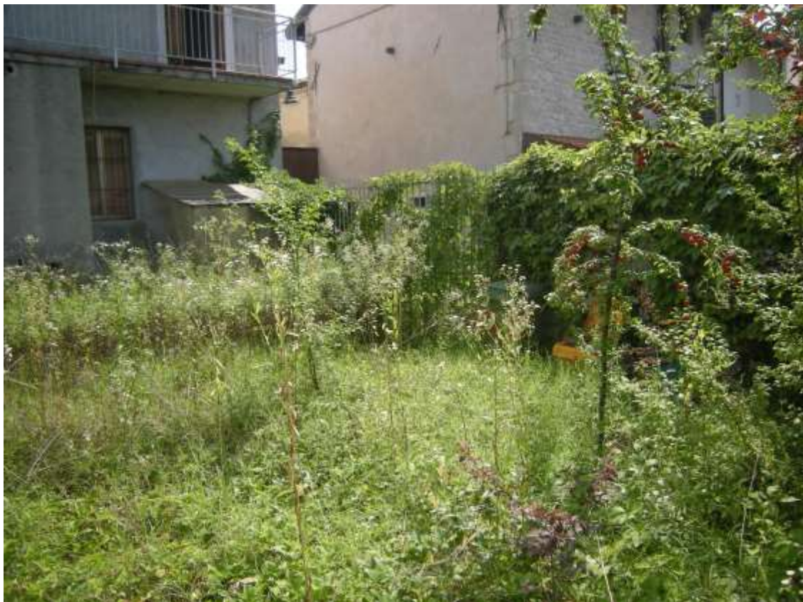
Budoia, via Cardazzo n° 15 - Il prospetto a sud - ovest della casa indipendente e la corte.