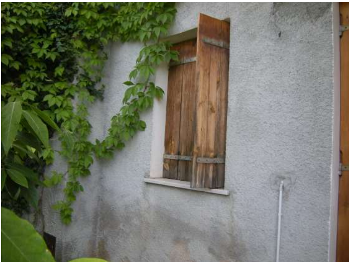
Budoia, via Cardazzo n°. 15 – Particolare dell'infisso esterno.