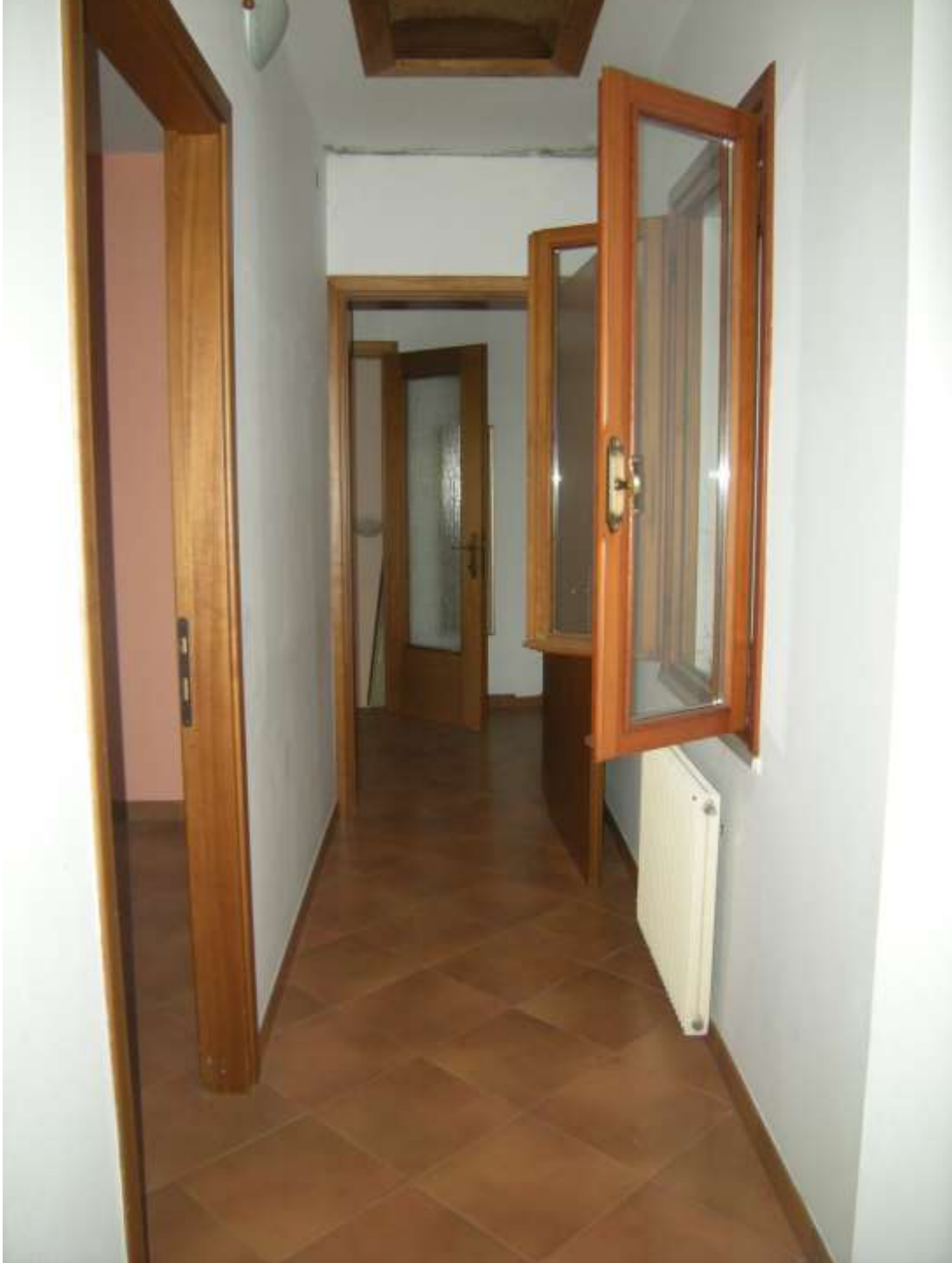
Budoia, via Cardazzo n° 15, piano I - Il disimpegno.