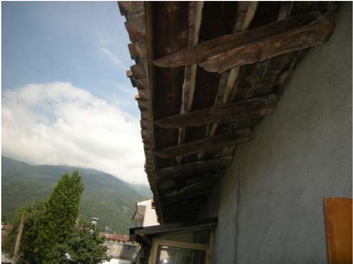
Budoia, via Cardazzo n°. 15, piano I – Sopra il poggiolo, sotto la copertura.