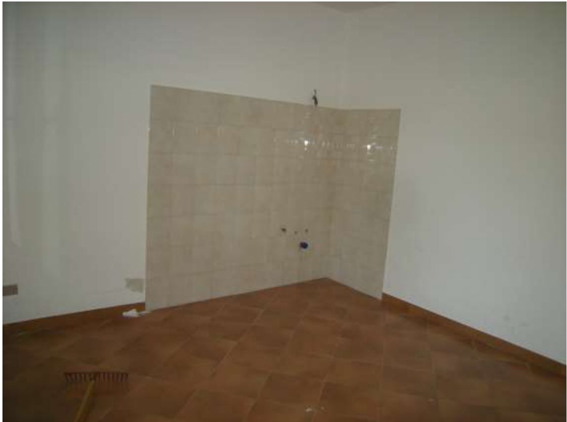
Budoia, via Cardazzo n°. 15, piano terra - La stanza.