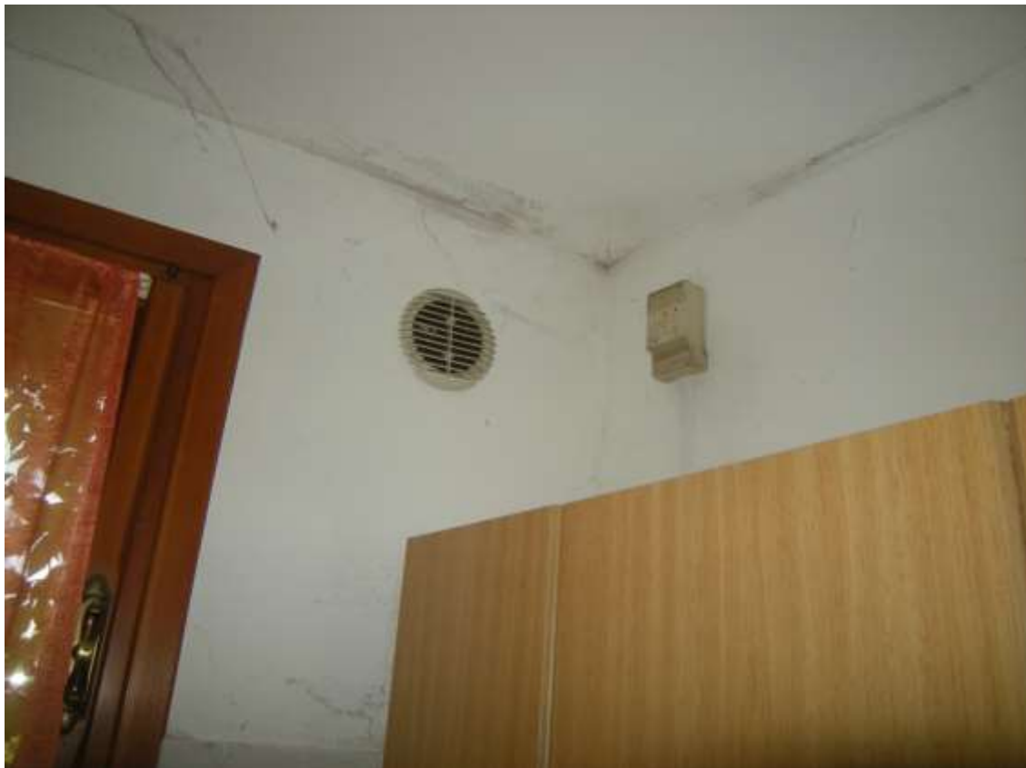
Budoia, via Cardazzo n°. 15 – Lo stato degli impianti: idraulico e termico.