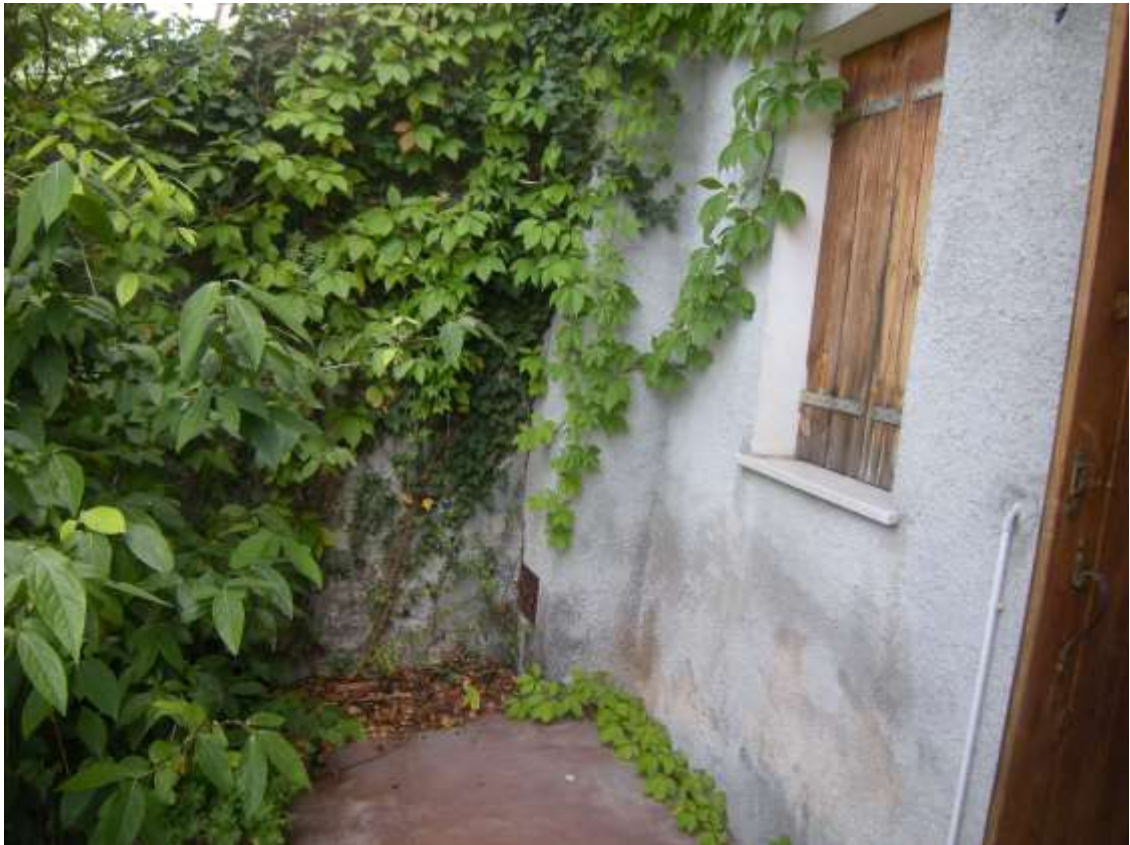
Budoia, via Cardazzo n°. 15, Piano terra - Danni agli intonaci.