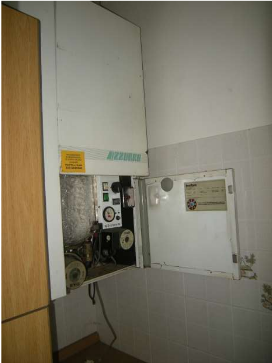
Budoia, via Cardazzo n°. 15, piano I- La caldaia murale.