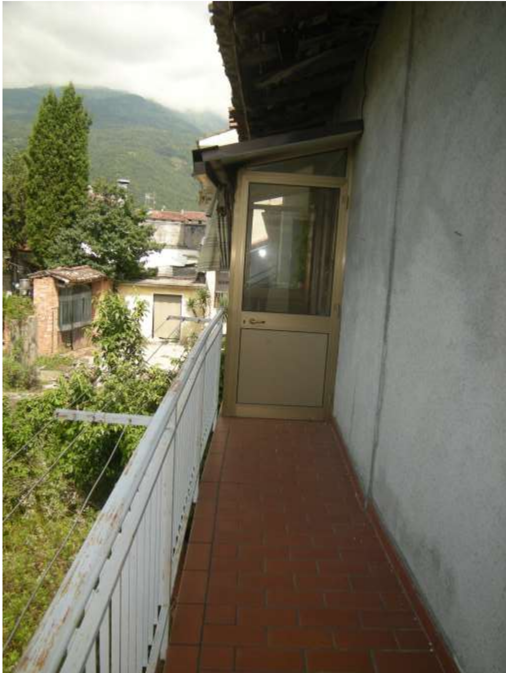
Budoia, via Cardazzo n°. 15, piano I - Il poggiolo.