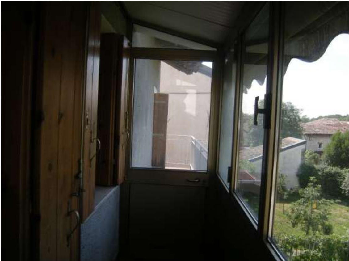
Budoia, via Cardazzo n° 15, piano I - La veranda.