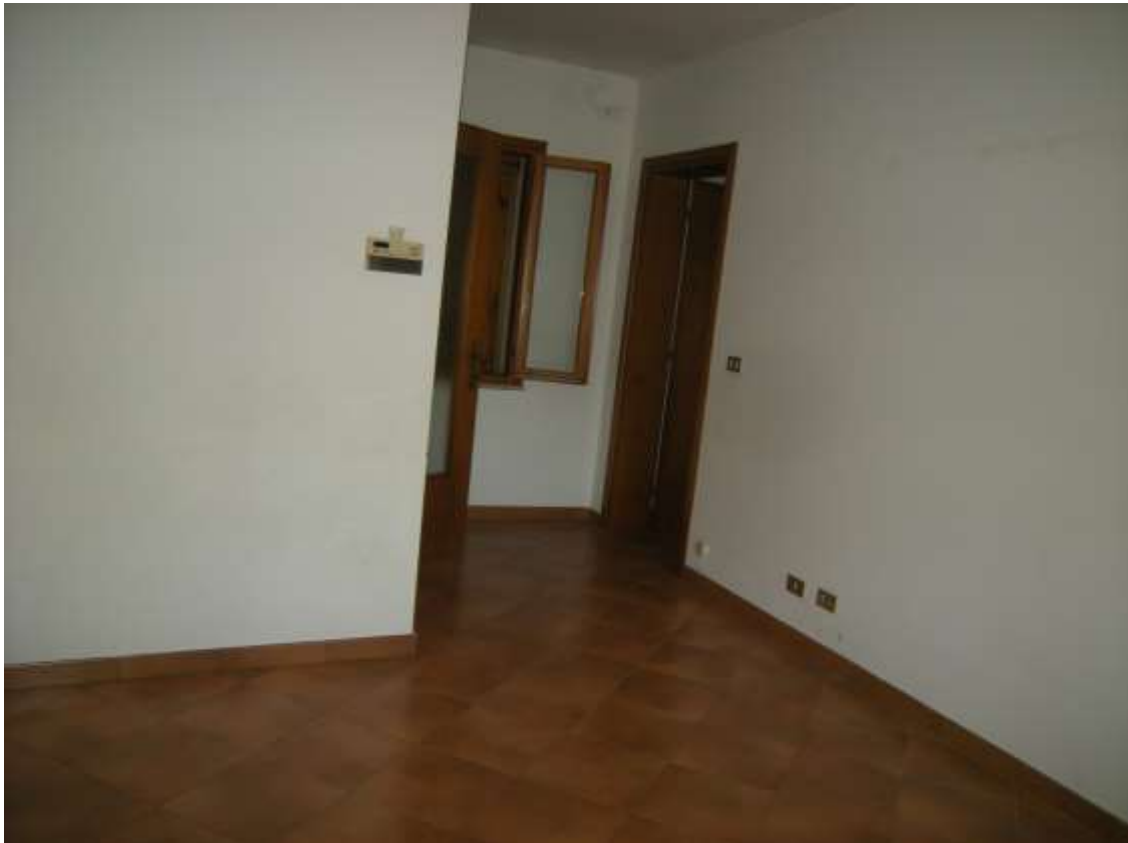
Budoia, via Cardazzo n°. 15, piano I – La sala da pranzo.