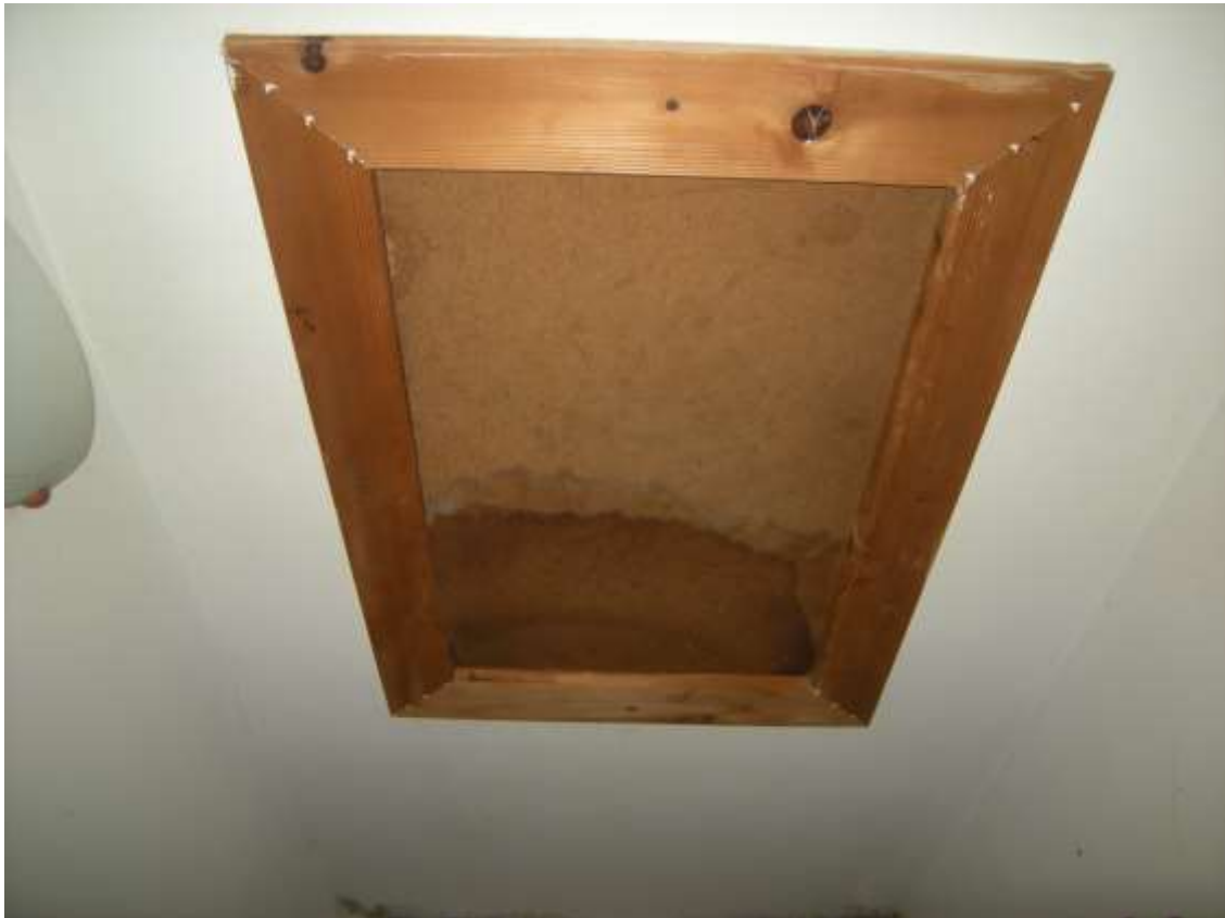
Budoia, via Cardazzo n°. 15, Piano primo – Sopra danni alla tinteggiatura, segni di infiltrazioni di acqua meteorica sulla botola di accesso al sotto tetto.