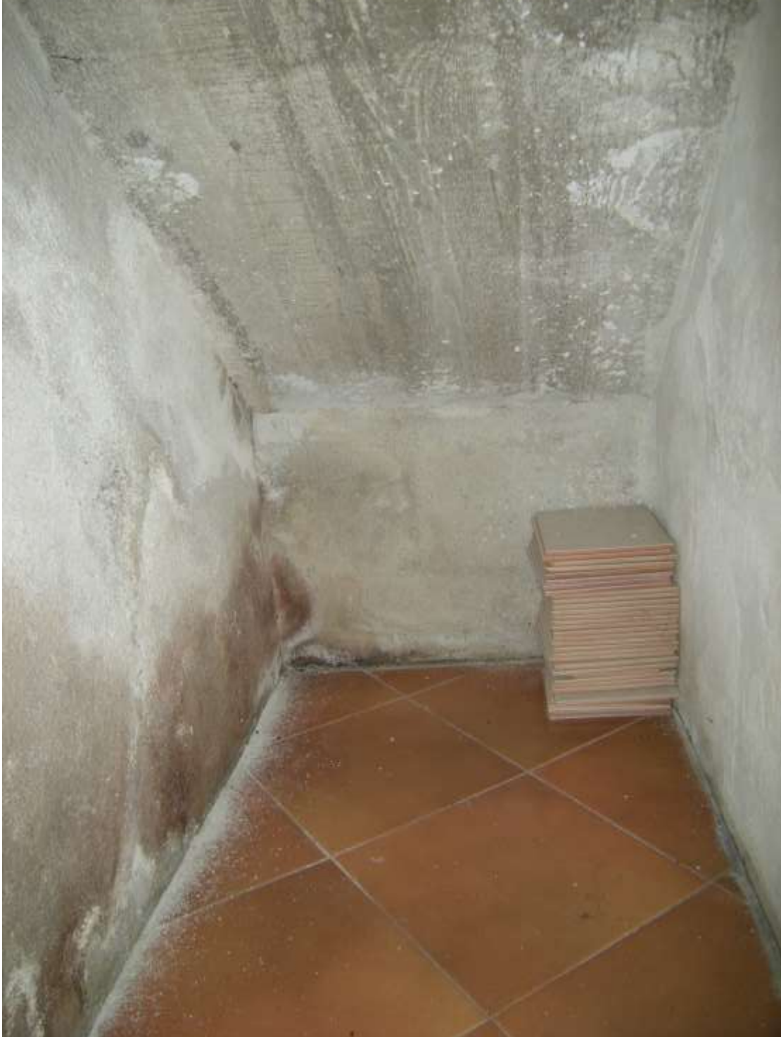
Budoia, via Cardazzo n°. 15, piano terra - Il sottoscala.