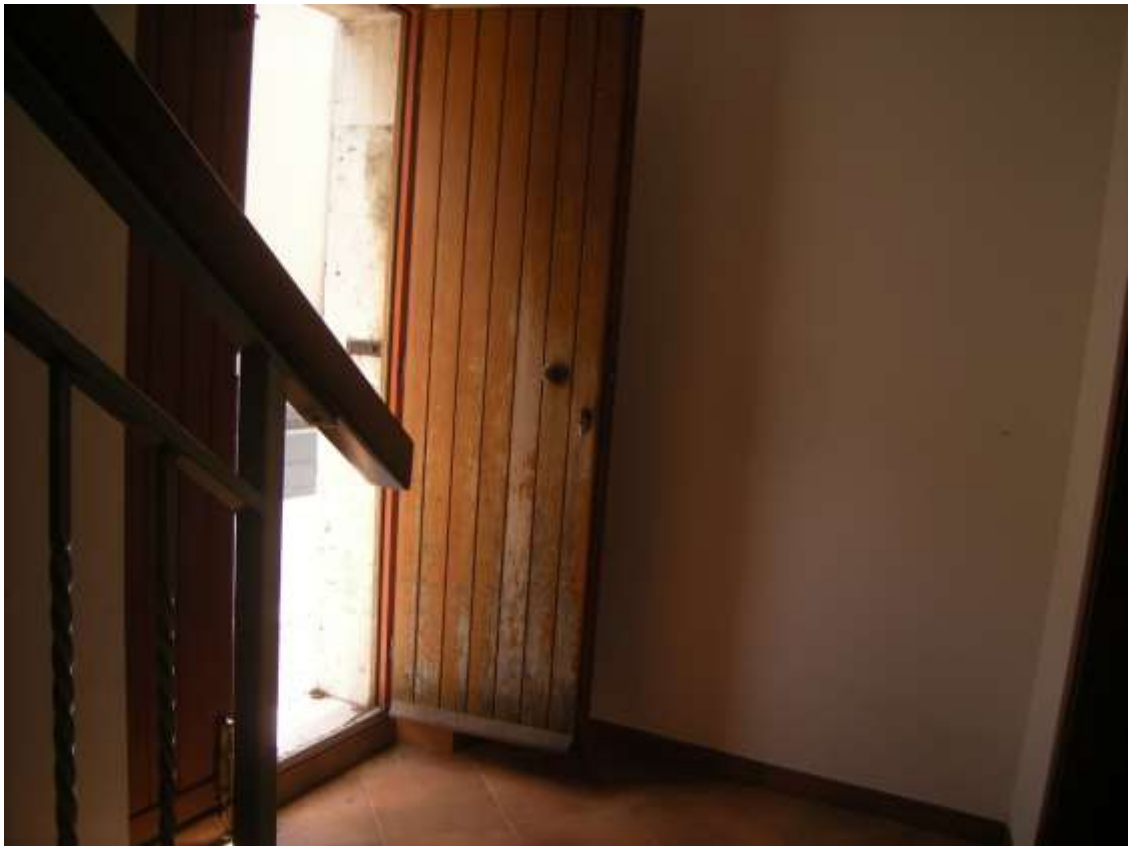
Budoia, via Cardazzo n°. 15 - L'ingresso.