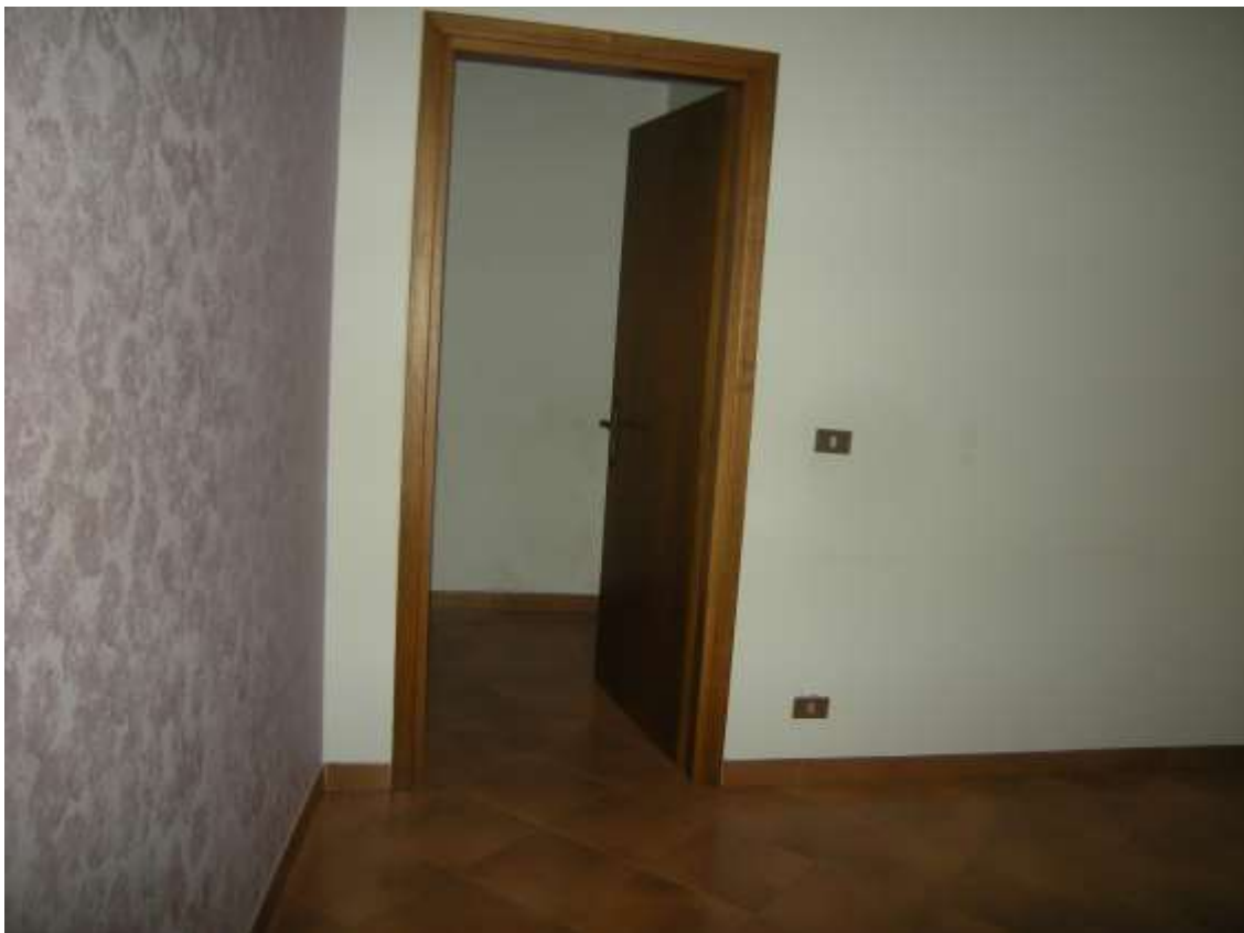
Budoia, via Cardazzo n° 15, piano I - La camera 2.