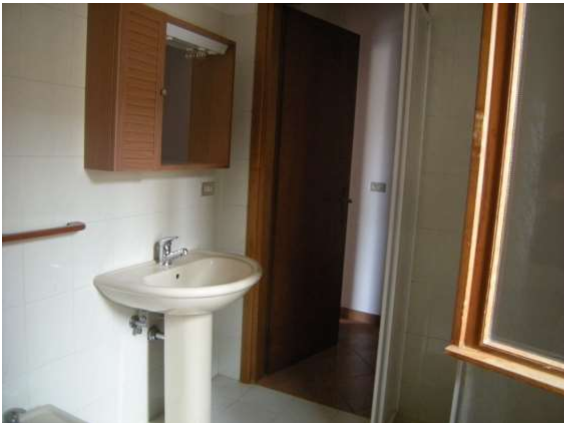
Budoia, via Cardazzo n°. 15, piano I - Il bagno.