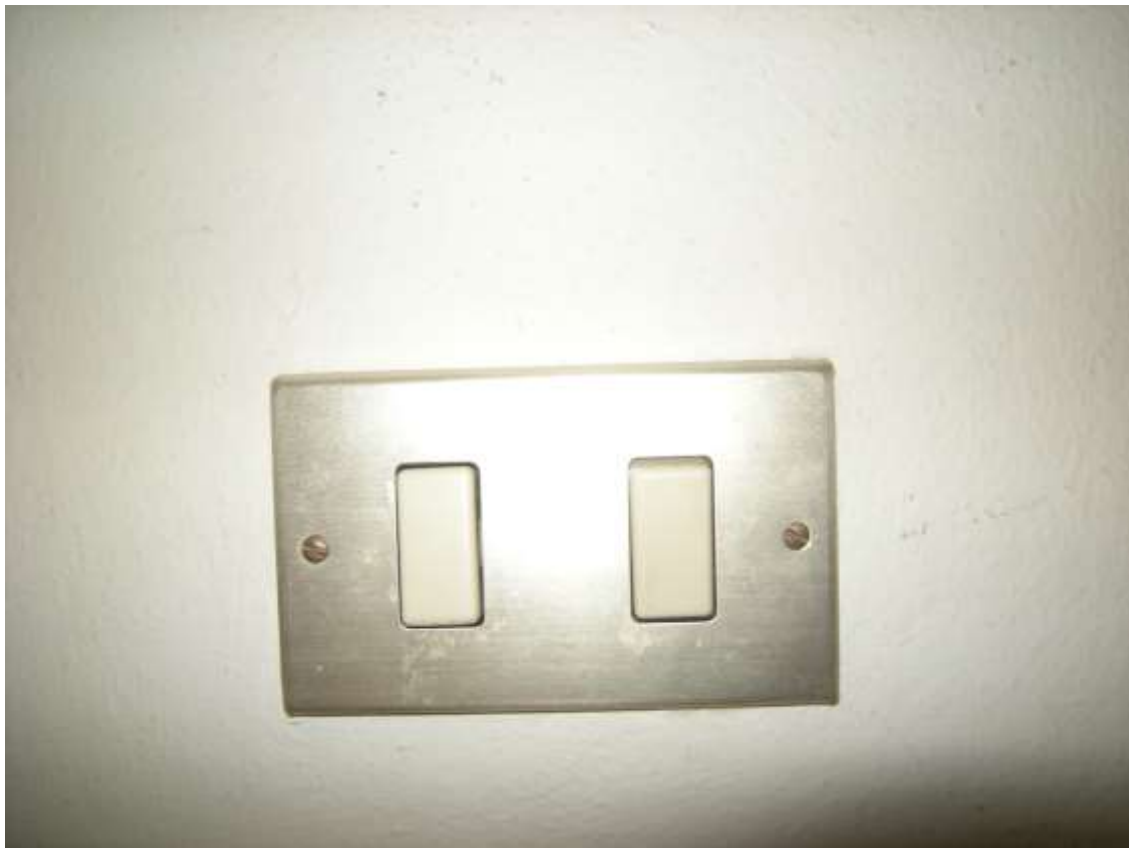
Budoia, via Cardazzo n°. 15 – Particolari dell'impianto elettrico.