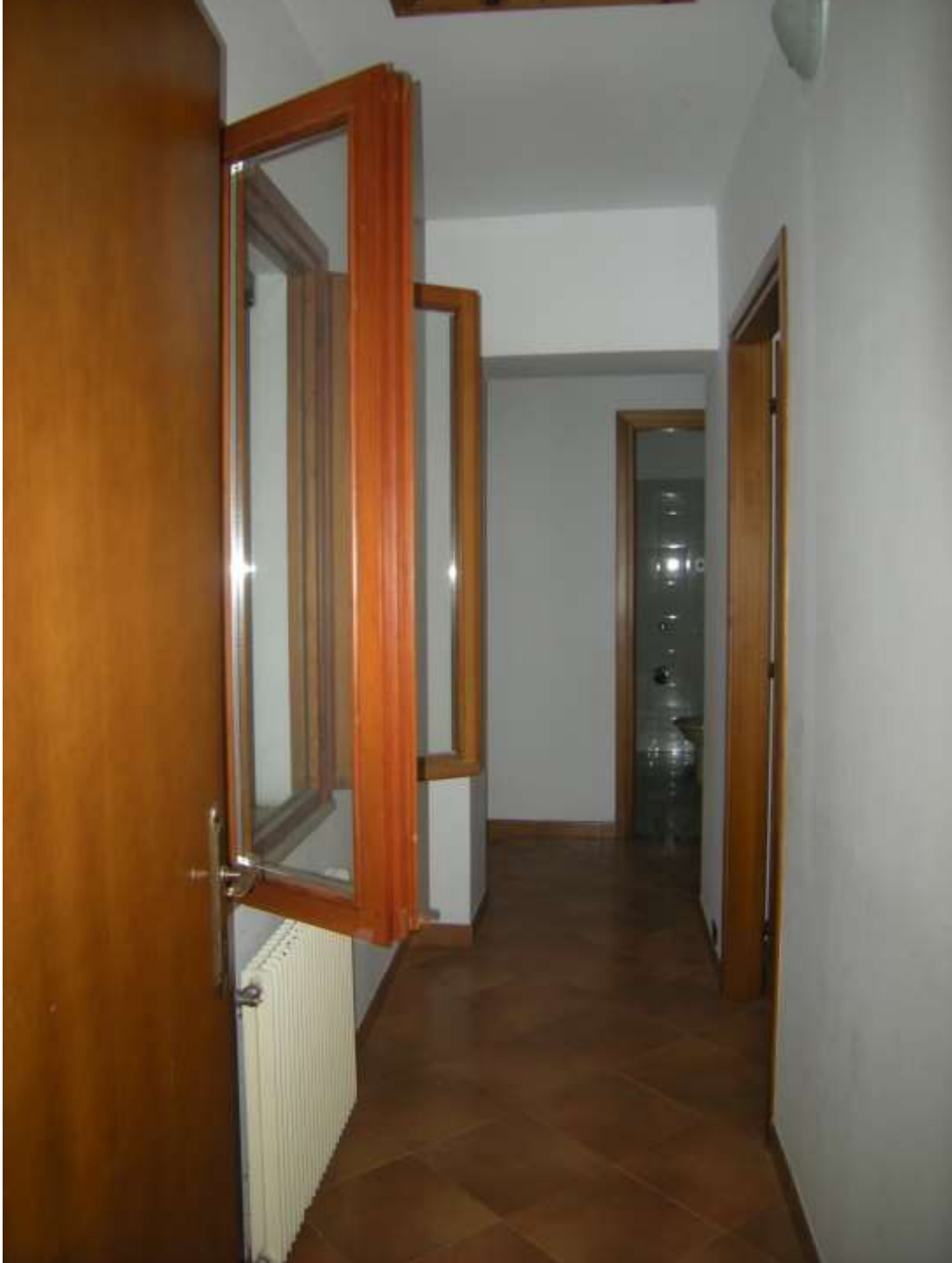
Budoia, via Cardazzo n°. 15, piano I - Il disimpegno.