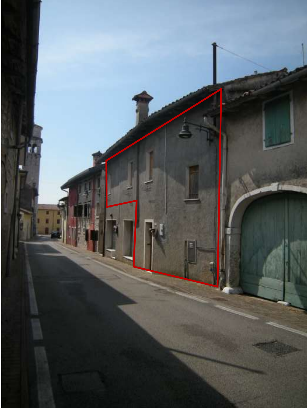
Budoia, via Cardazzo n°. 15 - Il prospetto a nord - est della casa indipendente.