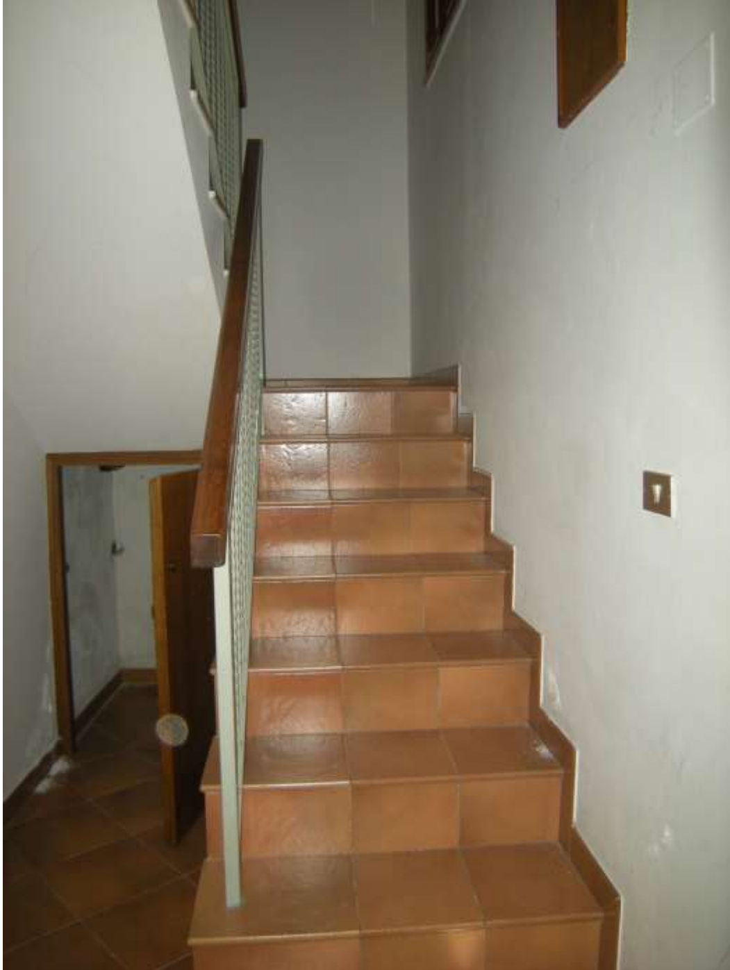
Budoia, via Cardazzo n°. 15 – La scala di accesso al piano primo.