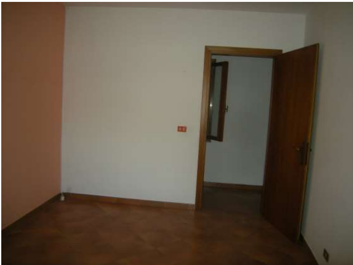
Budoia, via Cardazzo n°. 15, piano I - La camera 1.