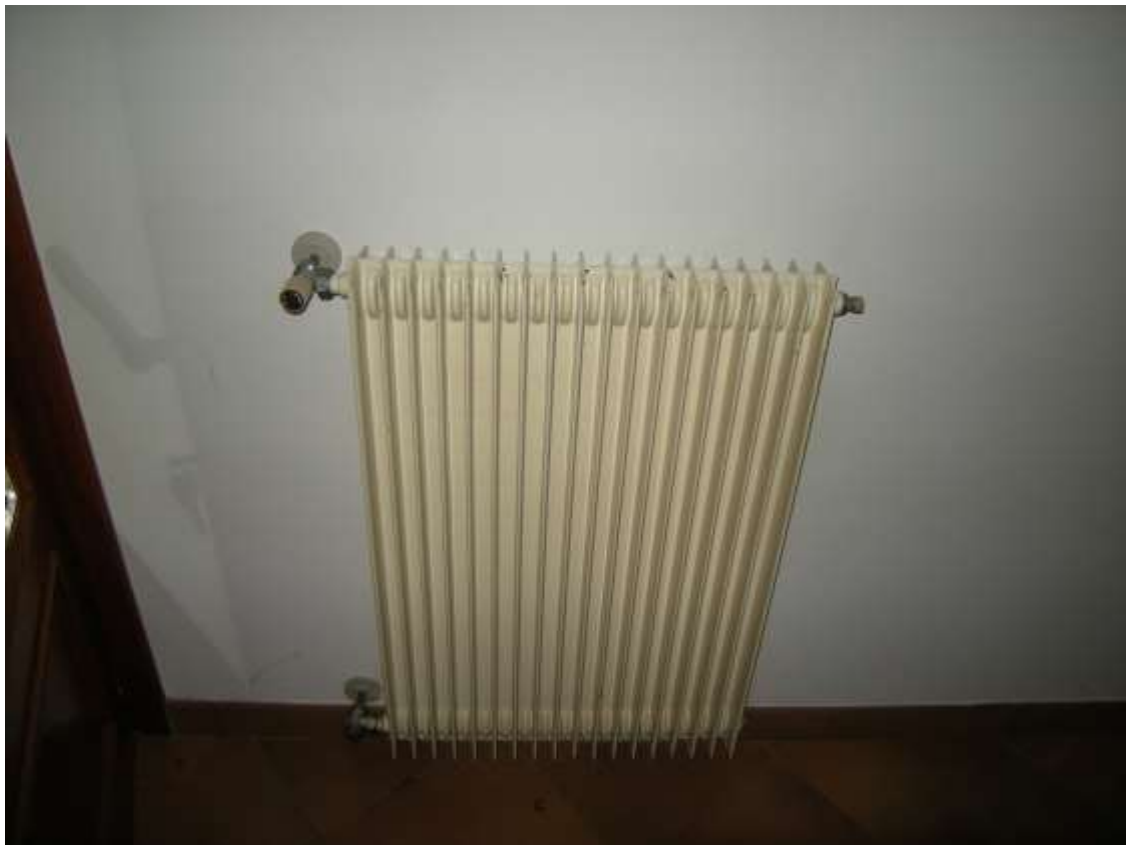
Budoia, via Cardazzo n°. 15 - Particolare dei terminali dell'impianto termico.