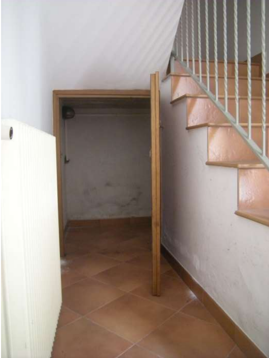
Budoia, via Cardazzo n°. 15, piano terra - L'ingresso ed il sottoscala.