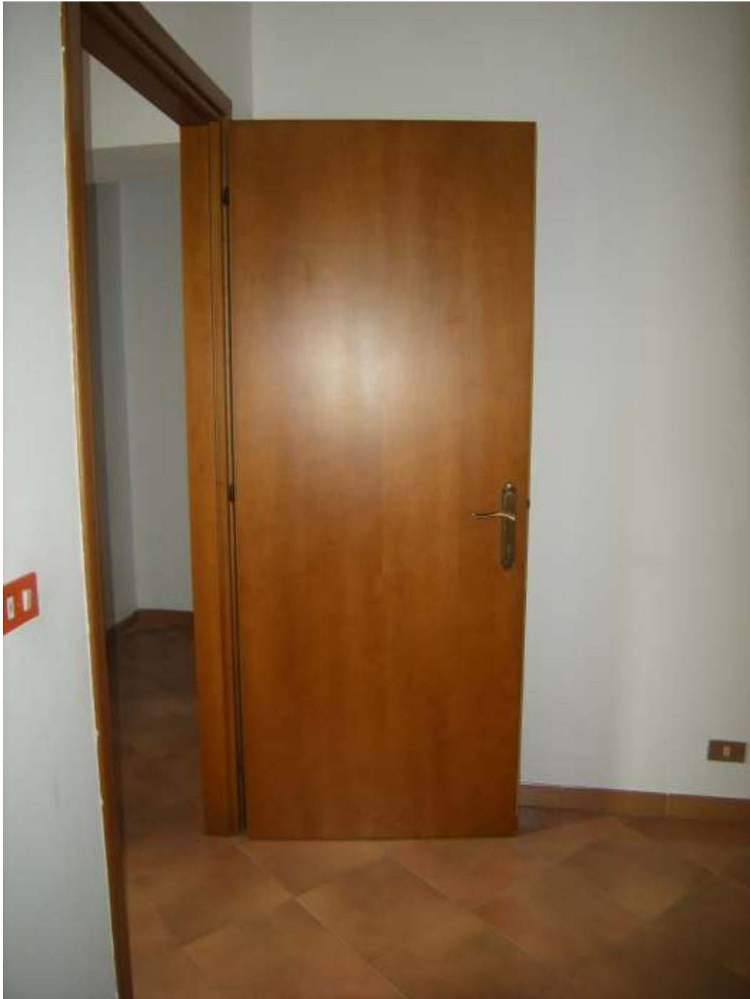
Budoia, via Cardazzo n°. 15 – Particolare dell'infisso interno.