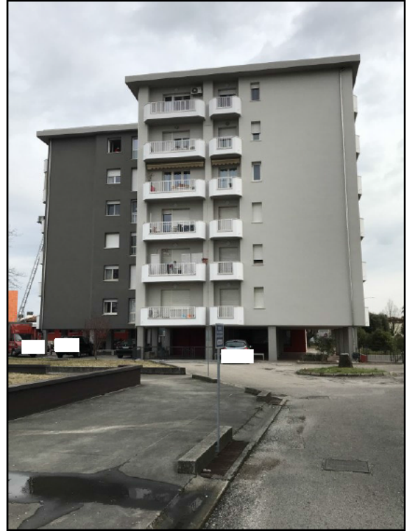
Fig.6: vista da ovest