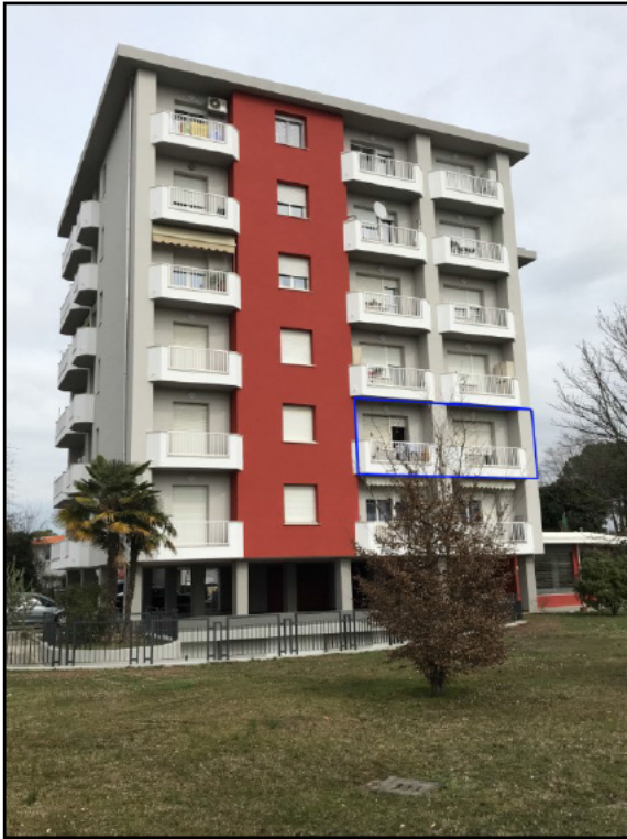
Fig.1: vista da sud