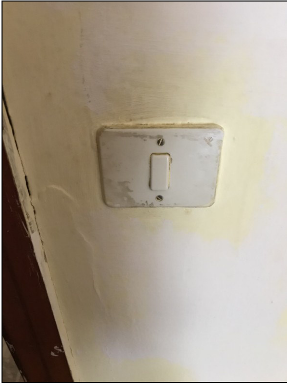
Fig.21: vista frutti impianto elettrico