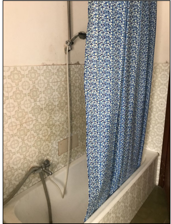
Fig.18: altra vista bagno dalla finestrella