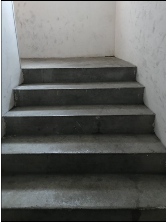
Fig.24: vista scale parti comuni scantinato