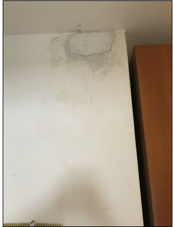
Fig.22: particolare parete in entrata da ripristinare