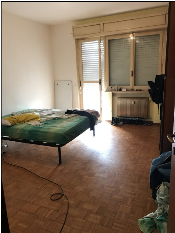
Fig.15: camera sud - est