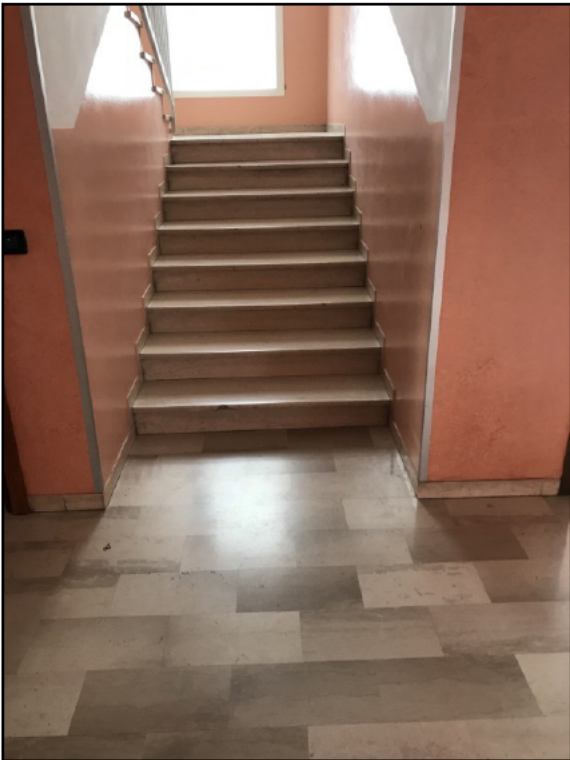
Fig.7: vano scale condominiale