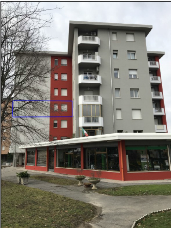
Fig.3: vista da est