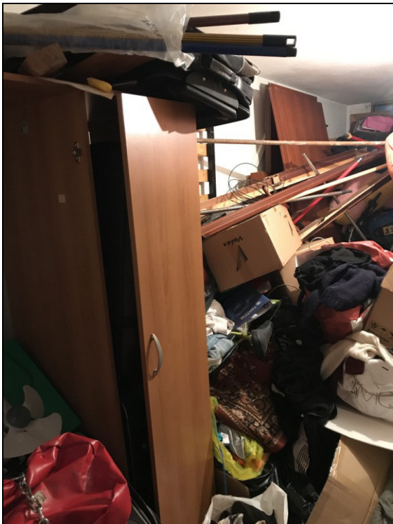
Fig.26: vista cantina