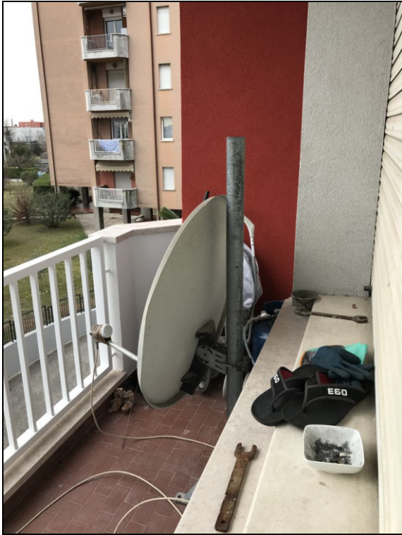
Fig.13: terrazzino con accesso dal soggiorno