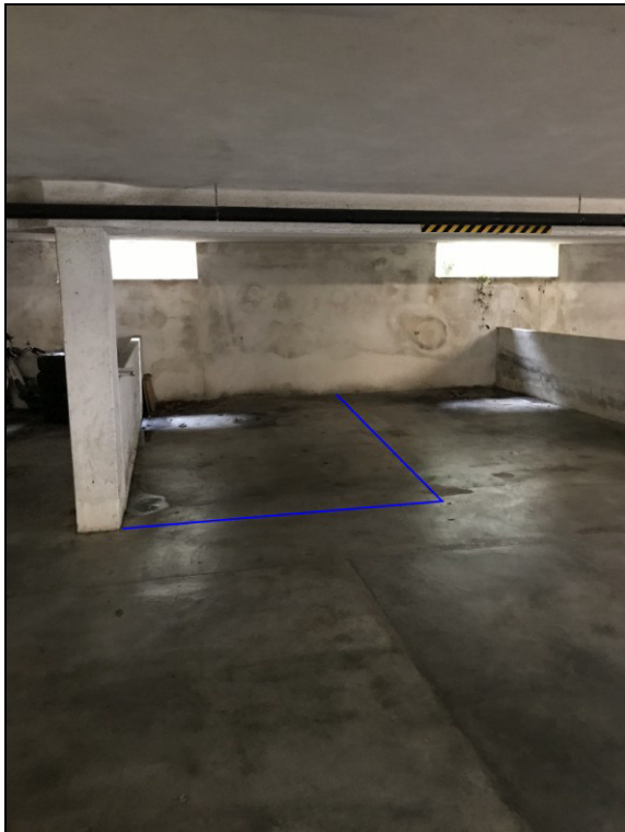
Fig.29: vista posto auto garage