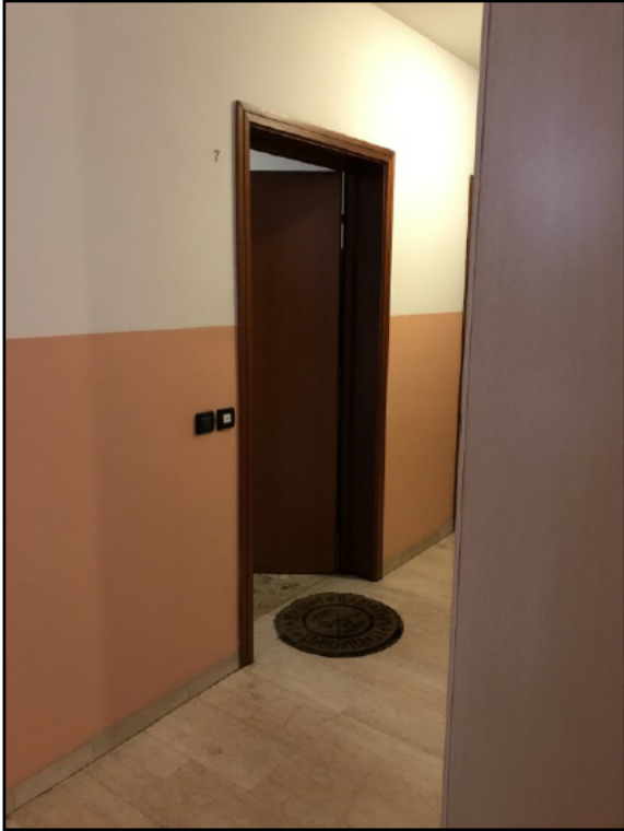
Fig.9: vista entrata appartamento al piano