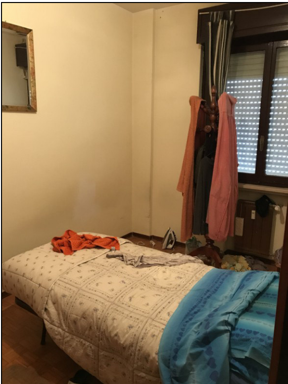
Fig.19: camera ad est