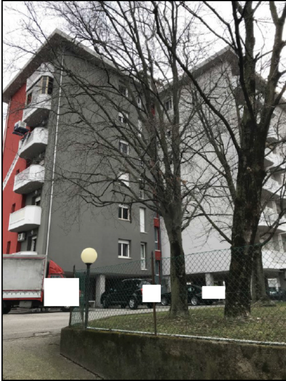
Fig.5: vista da nord - ovest