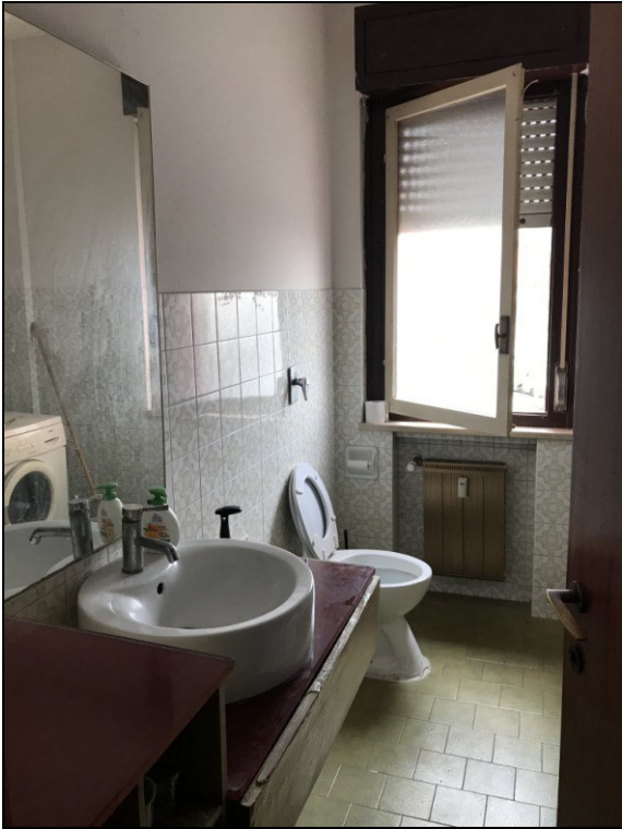
Fig.17: vista bagno dal corridoio zona notte