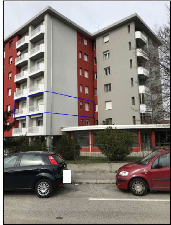
Fig.2: vista da sud - est