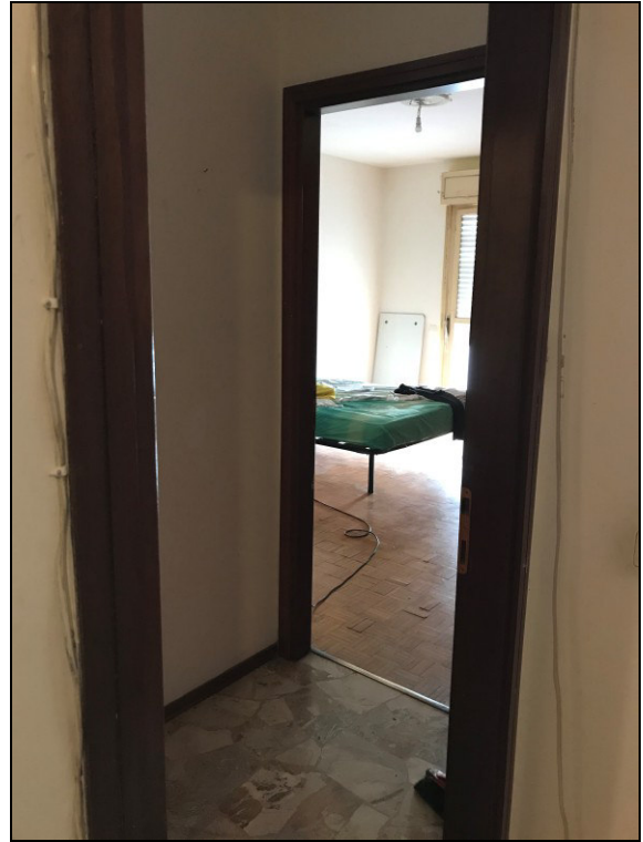
Fig.14: corridoio zona notte