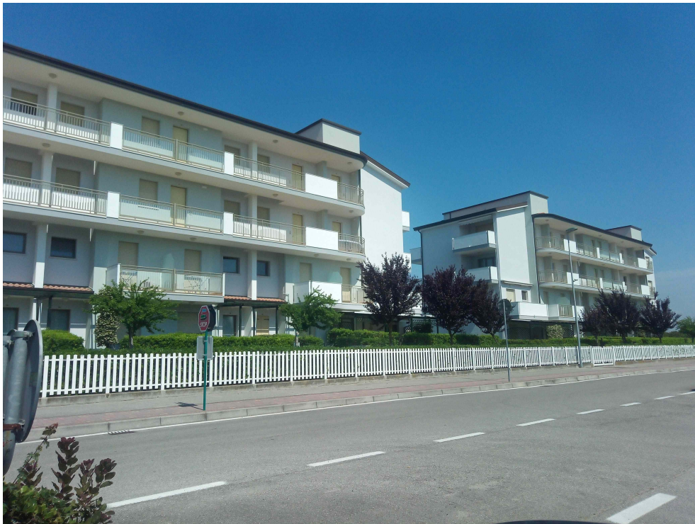
INTERO COMPLESSO DALLA STRADA PRINCIPALE