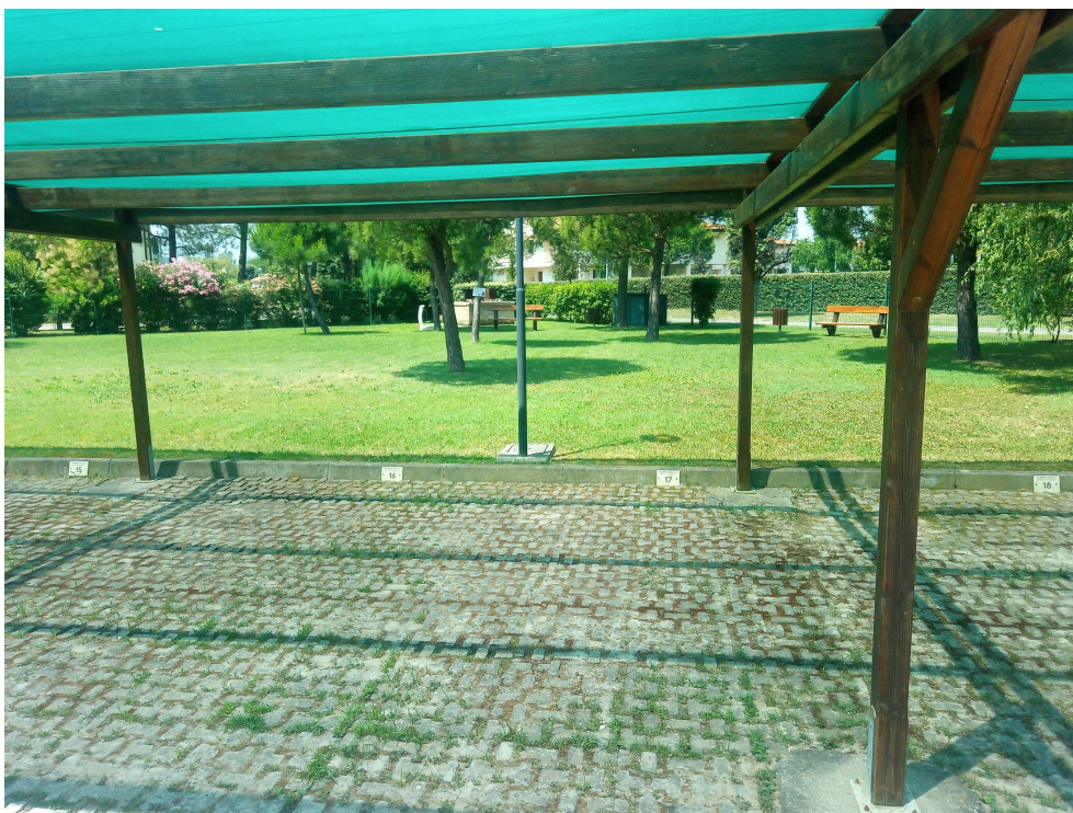
POSTO AUTO COPERTO