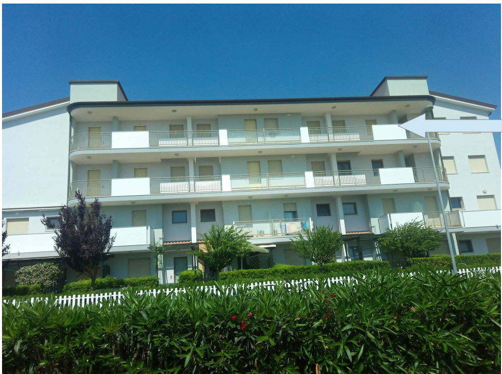
FRONTE DALLA STRADA